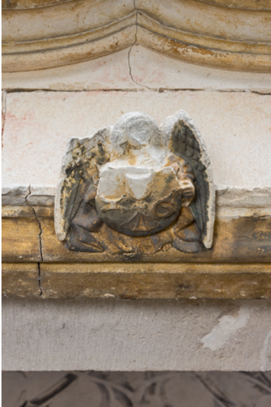
Linteau, détail : ange portant l'écu de Jehan Géliot.

71, Laives montée de Lenoux, lieudit : Lenoux