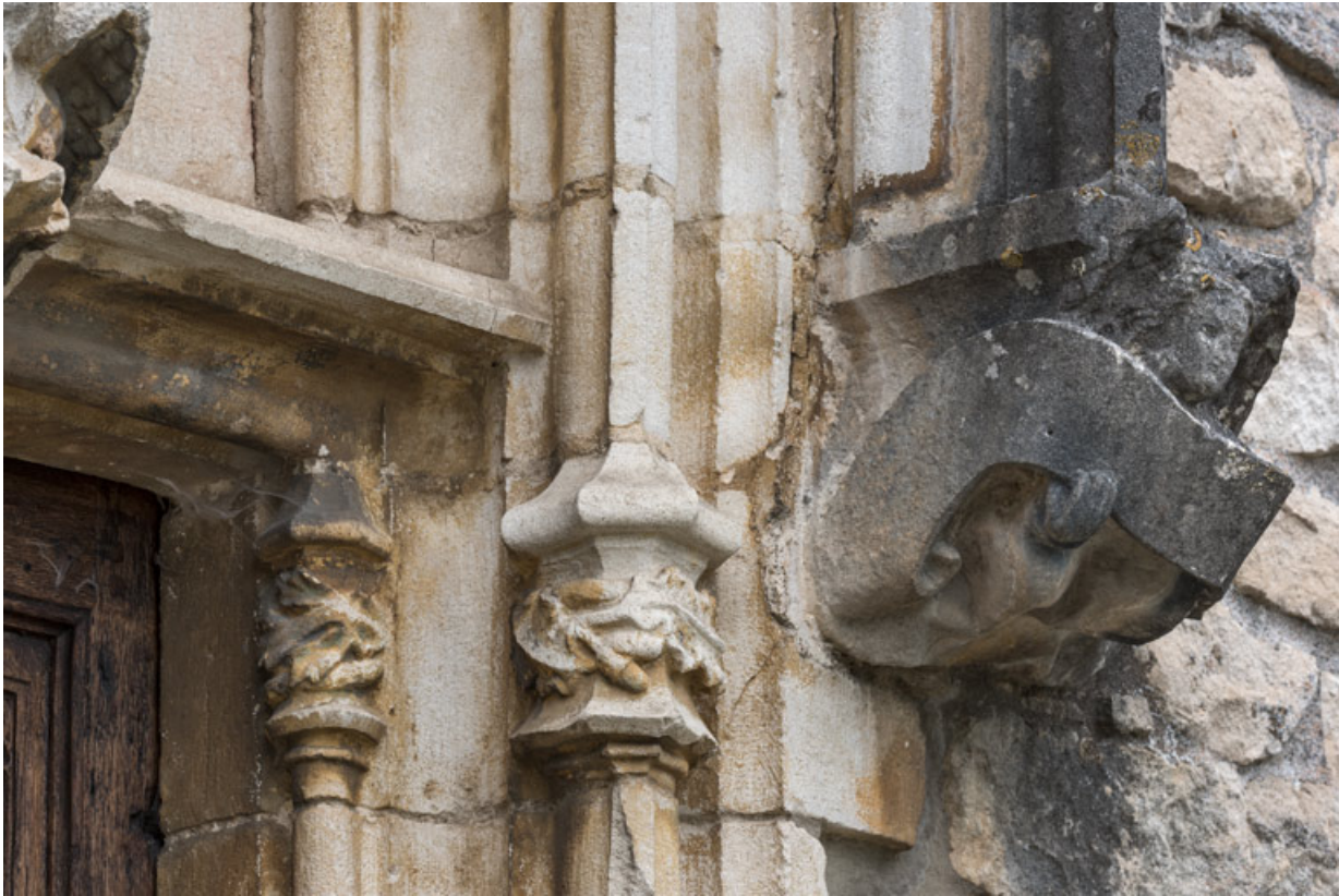
Détail de l'arc en accolade, décor de la retombée de droite : ange portant un phylactère.

71, Laives montée de Lenoux, lieudit : Lenoux