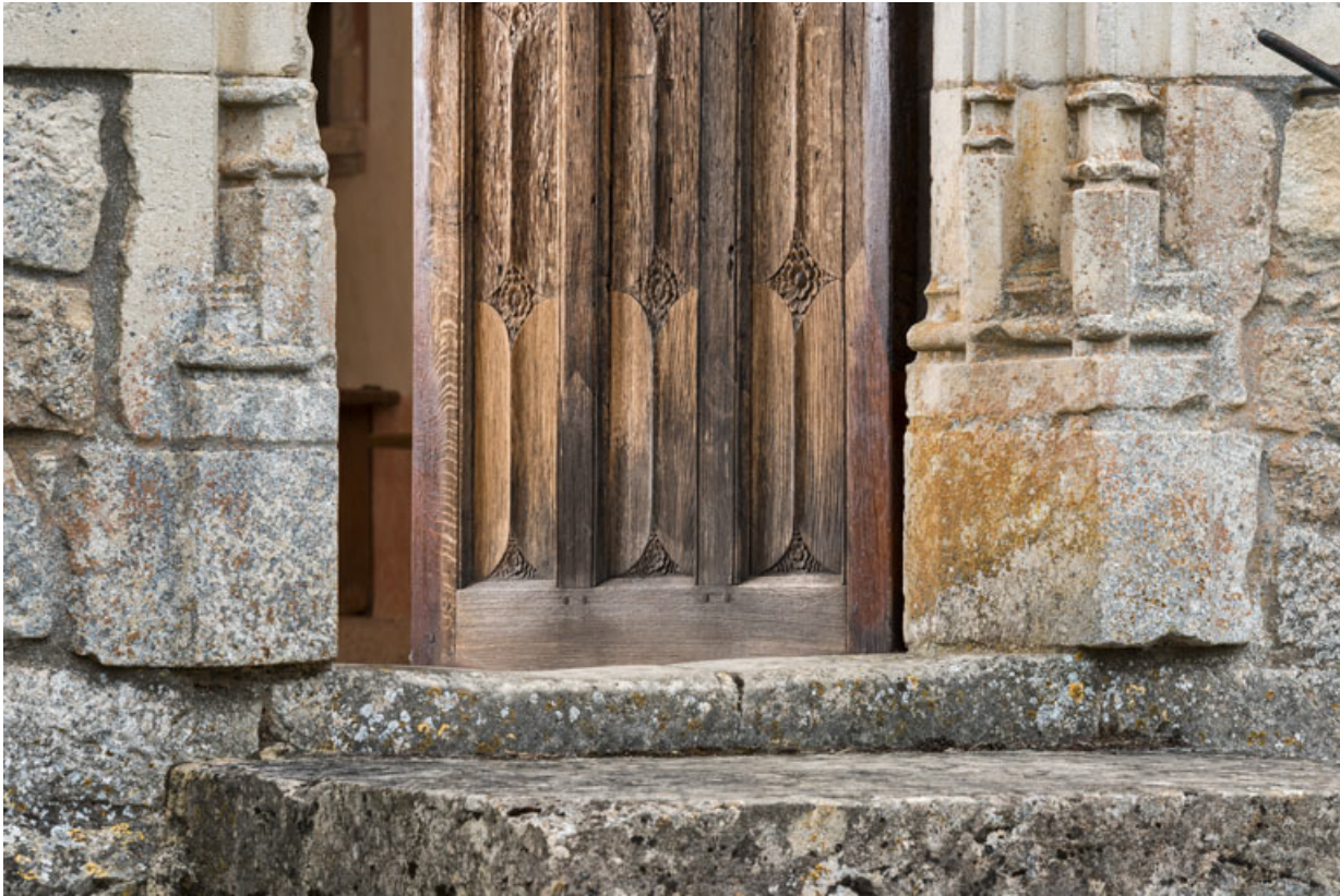
Piédroit, détail de la partie inférieure.

71, Laives montée de Lenoux, lieudit : Lenoux