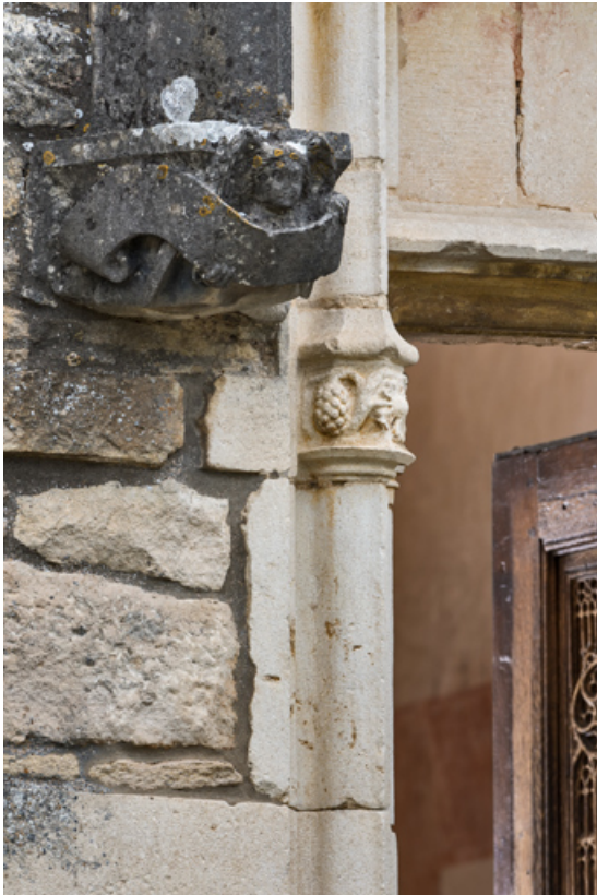
Piédroit, détail de la partie supérieure, gauche.

71, Laives montée de Lenoux, lieudit : Lenoux