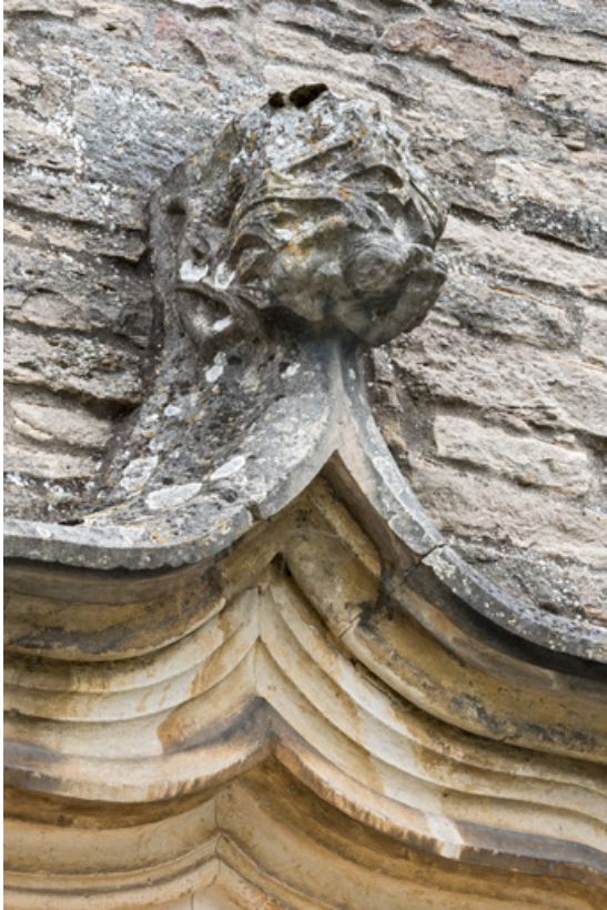
Détail de l'arc en accolade, faite : feuilles et personnage.

71, Laives montée de Lenoux, lieudit : Lenoux