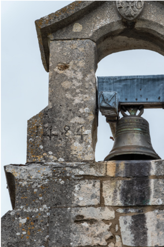
Clocher-mur, détail : date (1484).

71, Laives montée de Lenoux, lieudit : Lenoux