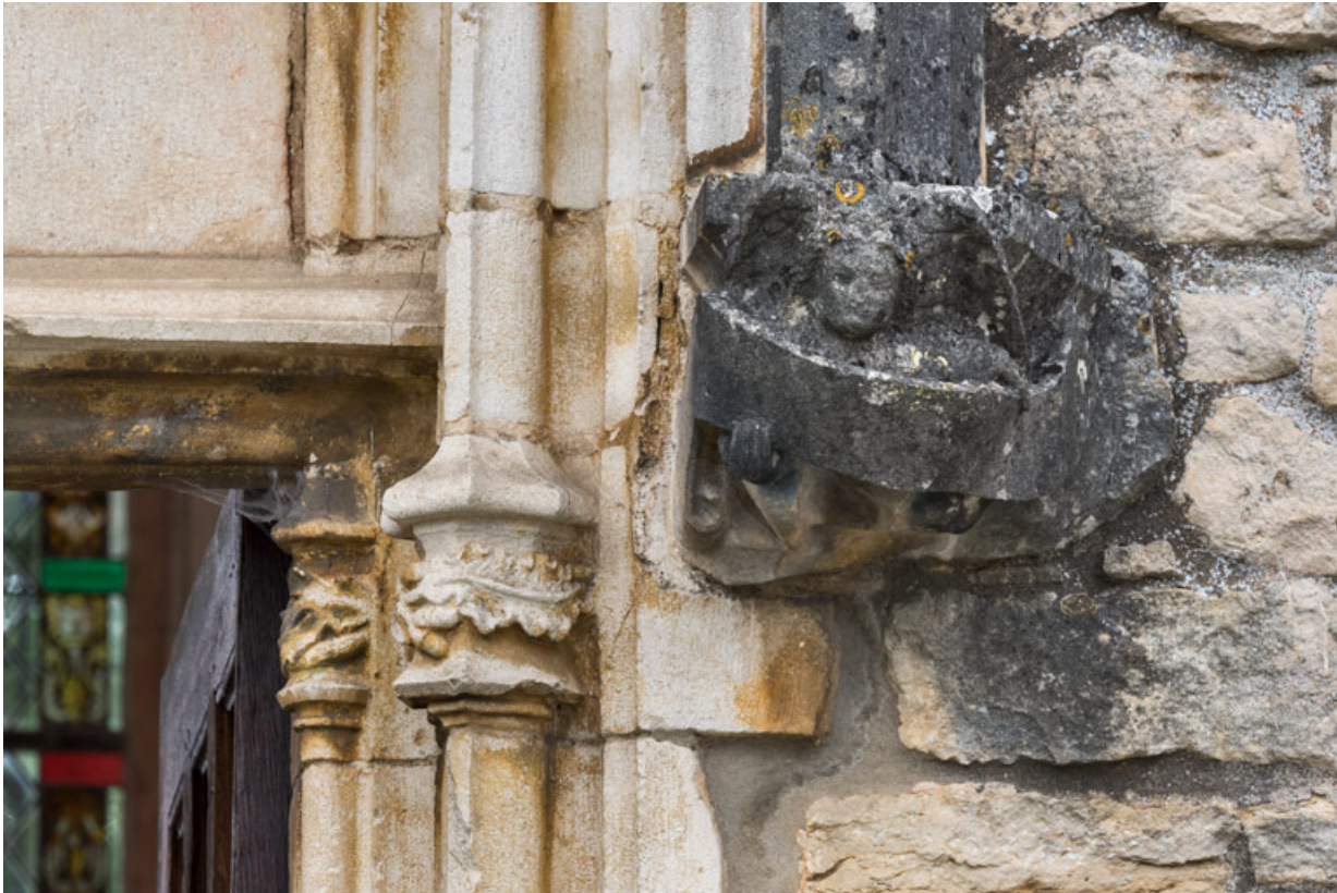
Détail de l'arc en accolade, décor de la retombée de droite : ange portant un phylactère.

71, Laives montée de Lenoux, lieudit : Lenoux