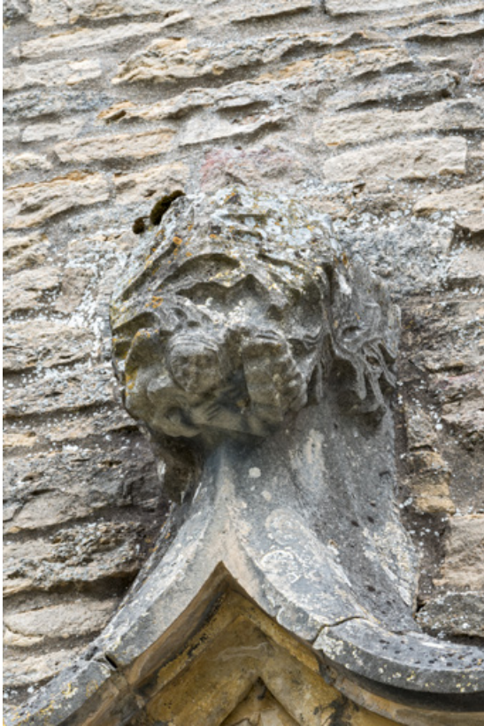
Détail de l'arc en accolade, faite : feuilles et personnage.

71, Laives montée de Lenoux, lieudit : Lenoux