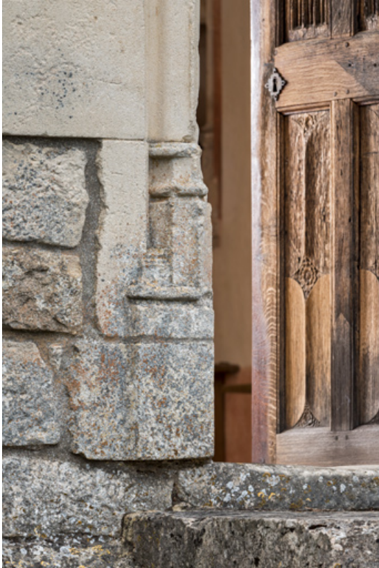
Piédroit, détail de la partie inférieure, gauche.

71, Laives montée de Lenoux, lieudit : Lenoux