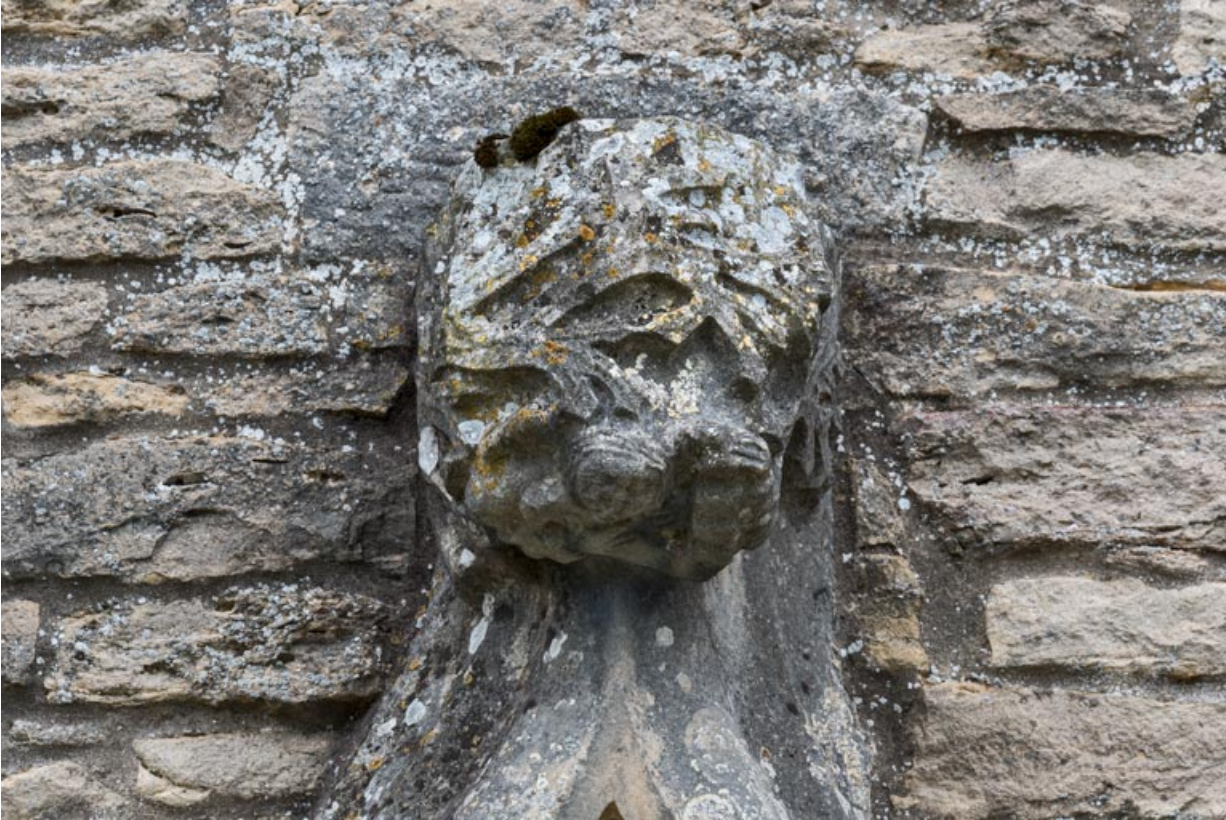
Détail de l'arc en accolade, faite : feuilles et personnages.

71, Laives montée de Lenoux, lieudit : Lenoux