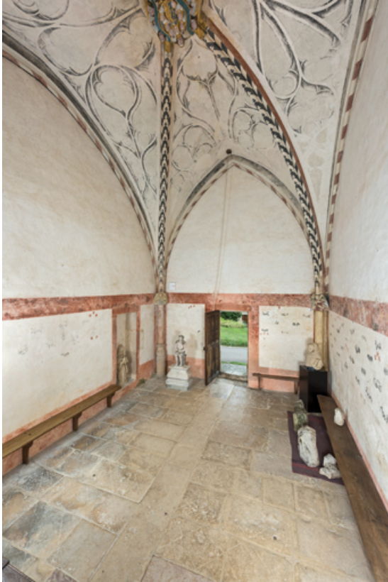
Vue d'ensemble de l'intérieur, en direction de l'entrée (porte ouverte).

71, Laives montée de Lenoux, lieudit : Lenoux