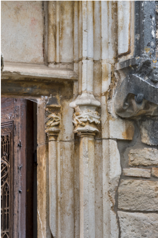
Piédroit, détail de la partie supérieure, droite.

71, Laives montée de Lenoux, lieudit : Lenoux