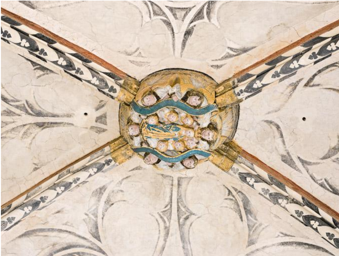
Détail de la clé de voûte : le couronnement de la Vierge.

71, Laives montée de Lenoux, lieudit : Lenoux