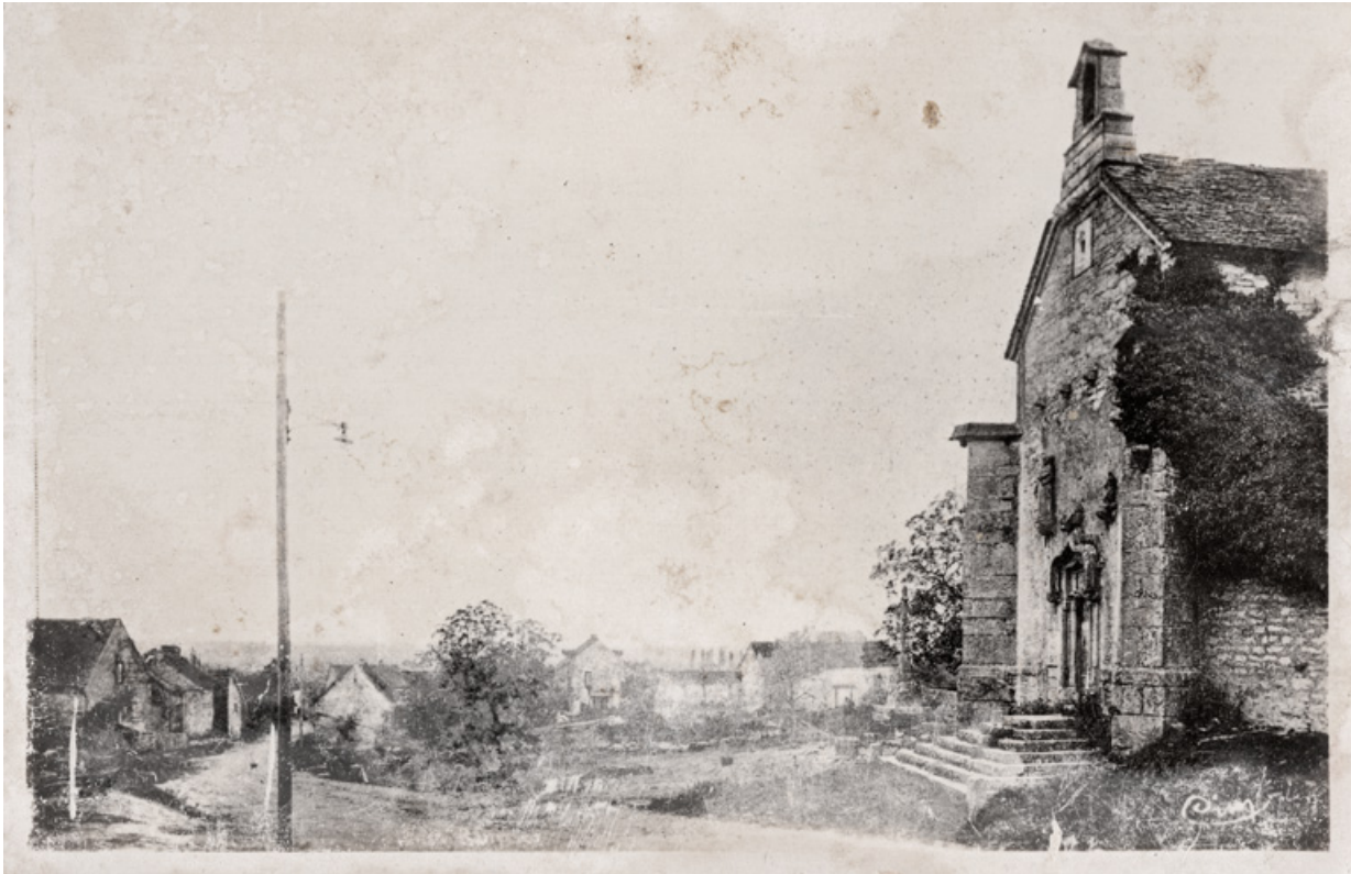
Vue ancienne (vers 1900).

71, Laives montée de Lenoux, lieudit : Lenoux