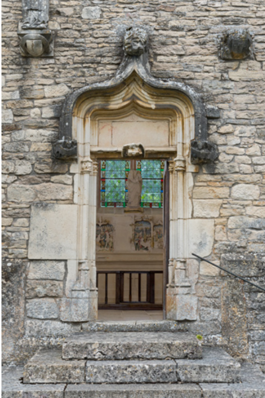
Porte en façade occidentale (vantail ouvert).

71, Laives montée de Lenoux, lieudit : Lenoux