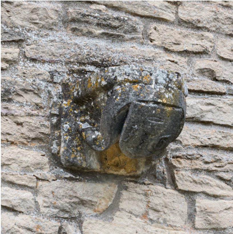
Console en façade à l'écu de Jehan Géliot, vue de trois quarts.

71, Laives montée de Lenoux, lieudit : Lenoux