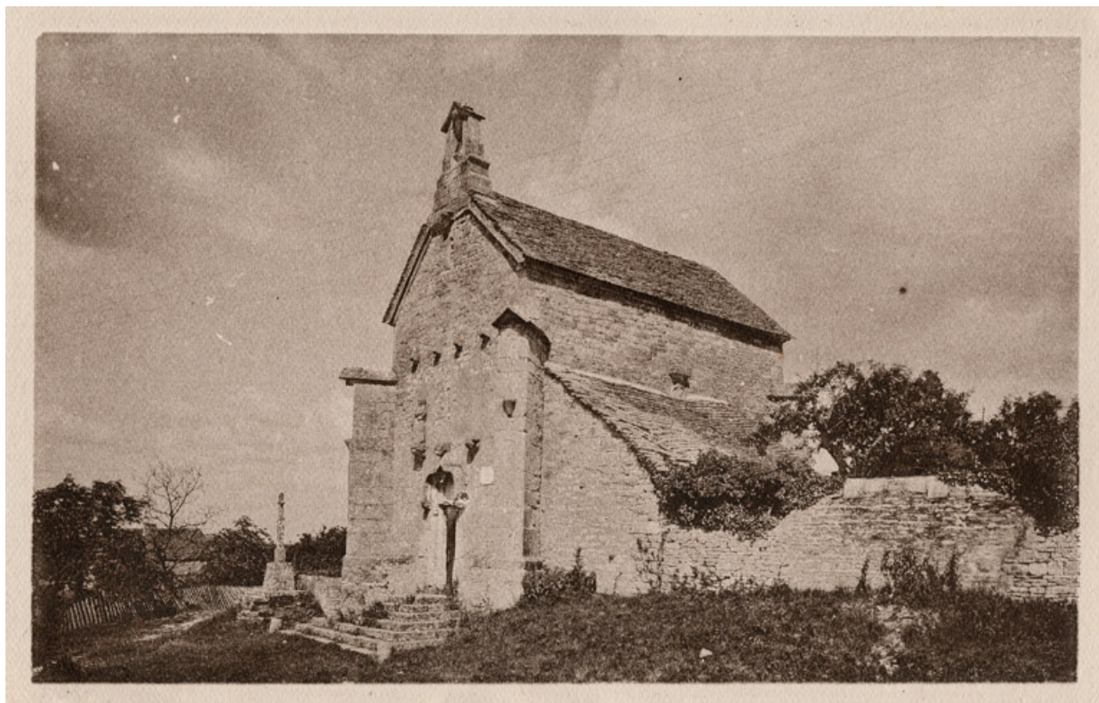
Vue ancienne (vers 1900).

71, Laives montée de Lenoux, lieudit : Lenoux