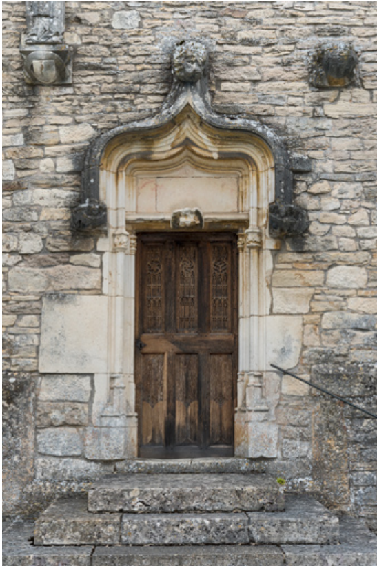
Porte en façade occidentale (vantail fermé).

71, Laives montée de Lenoux, lieudit : Lenoux