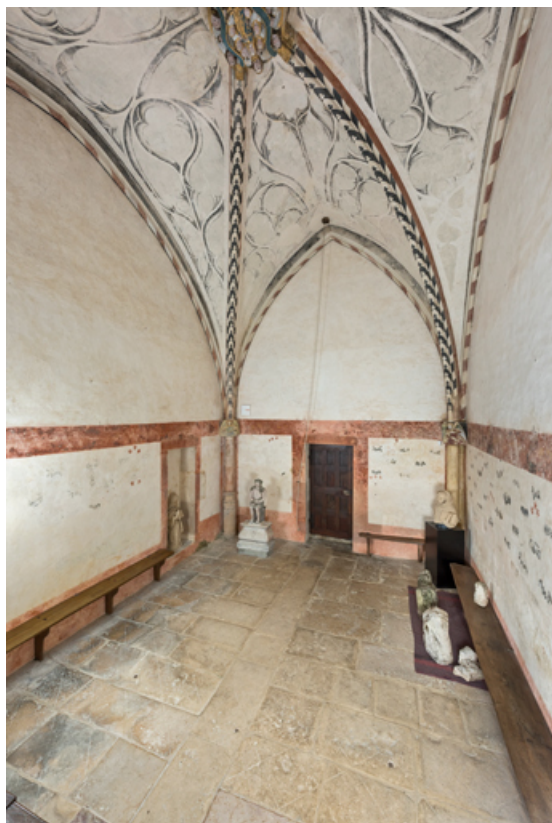
Vue d'ensemble de l'intérieur, en direction de l'entrée (porte fermée).

71, Laives montée de Lenoux, lieudit : Lenoux