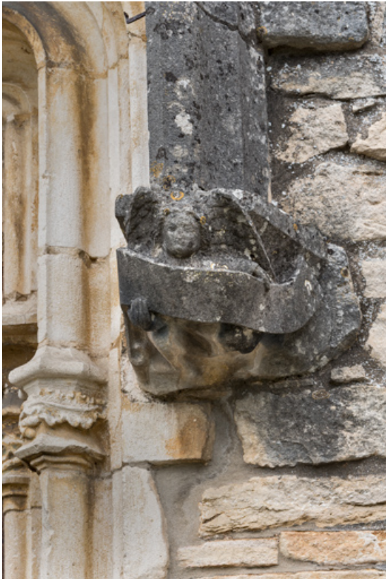
Détail de l'arc en accolade, décor de la retombée de droite : ange portant un phylactère.

71, Laives montée de Lenoux, lieudit : Lenoux