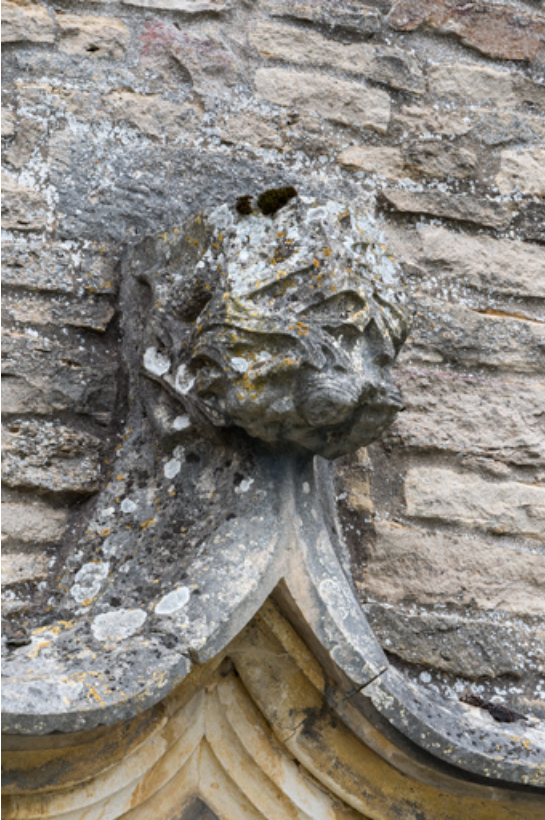
Détail de l'arc en accolade, faite : feuilles et personnage.

71, Laives montée de Lenoux, lieudit : Lenoux