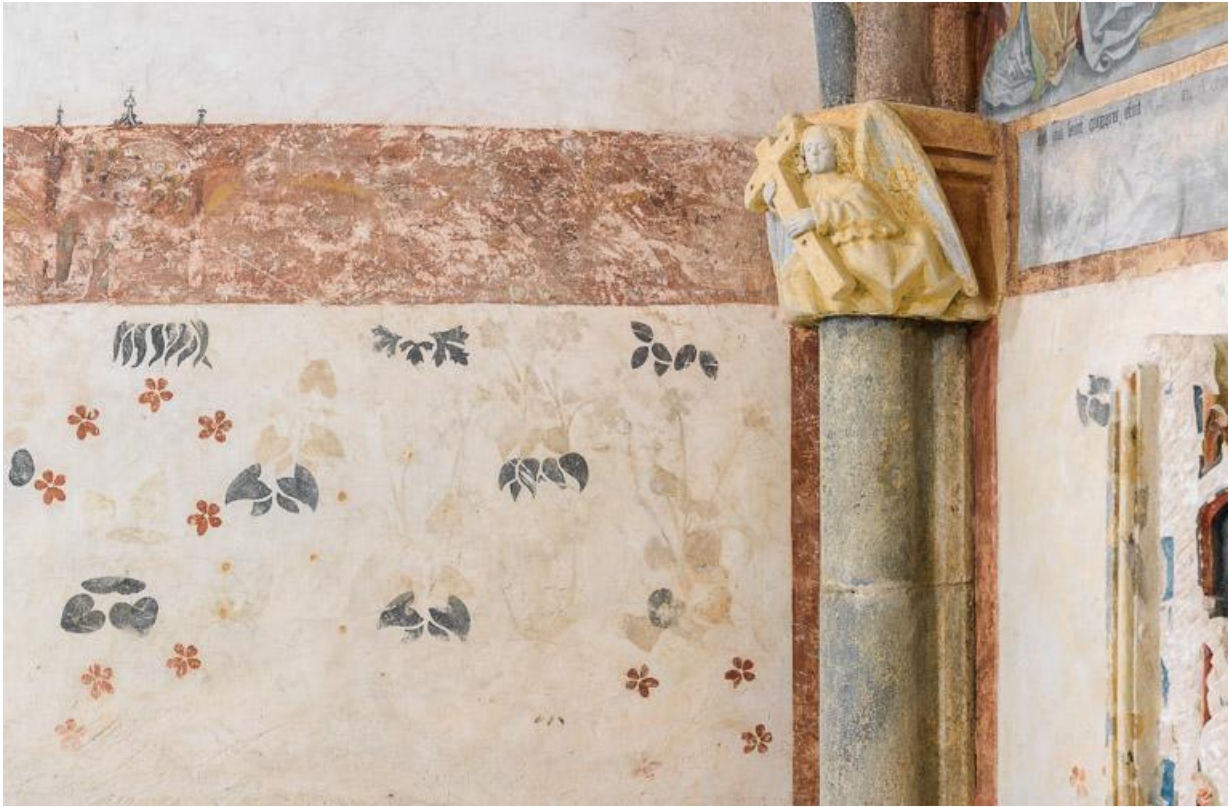
Détail des peintures murales du mur gauche, récemment restaurées.

71, Laives montée de Lenoux, lieudit : Lenoux