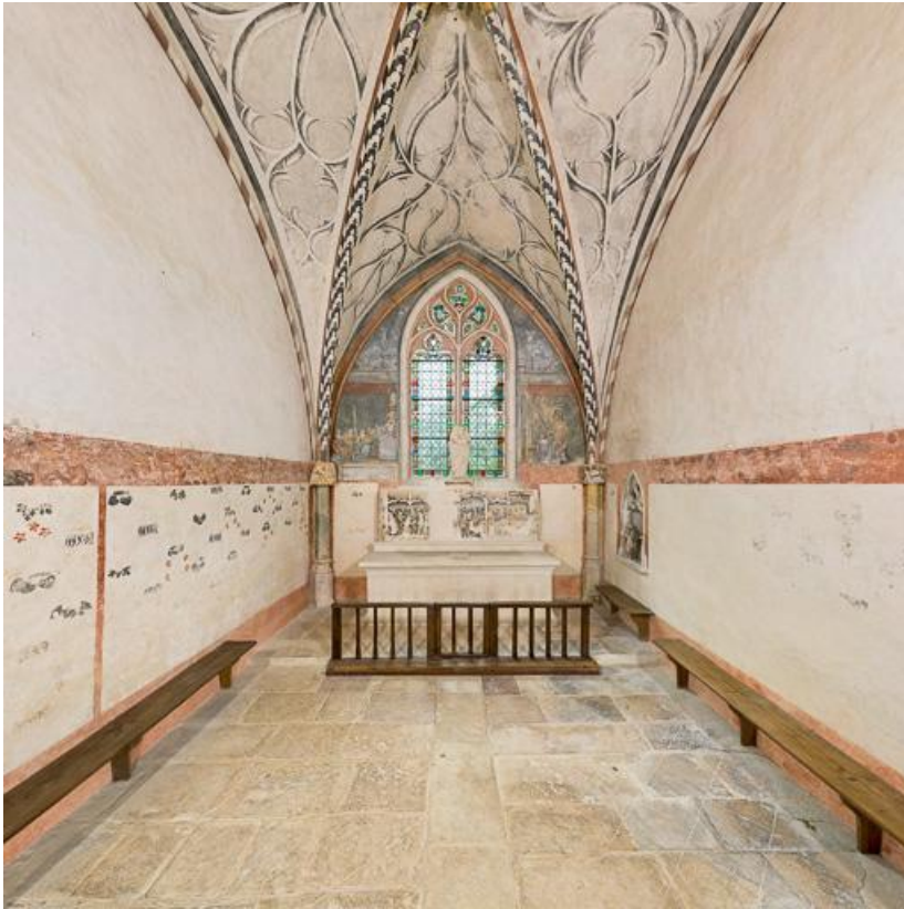
Vue d'ensemble de l'intérieur, depuis l'entrée.

71, Laives montée de Lenoux, lieudit : Lenoux