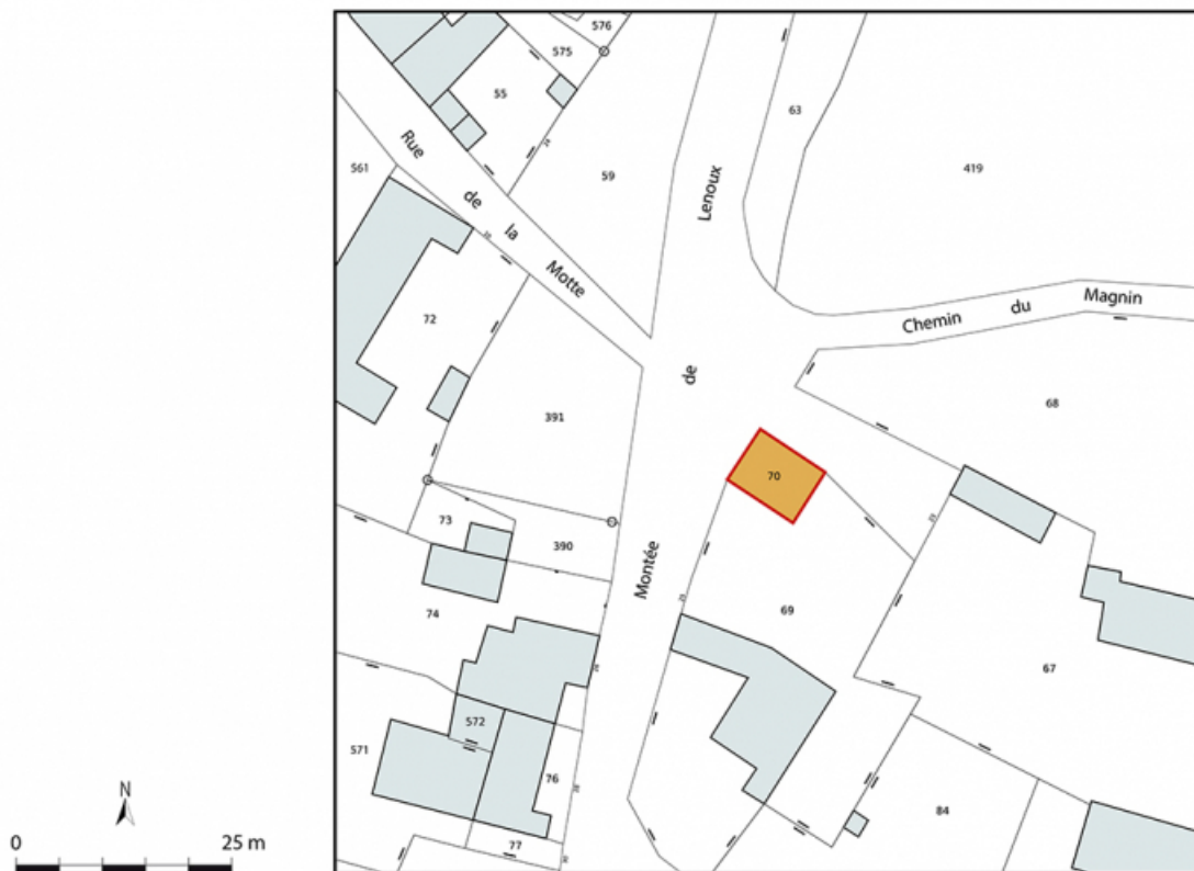
Plan-masse et de situation. Extrait du plan cadastral, 2024. Laives, section AD. Échelle 1/500.

71, Laives montée de Lenoux, lieudit : Lenoux