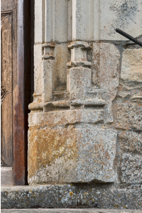
Piédroit, détail de la partie inférieure, droite.

71, Laives montée de Lenoux, lieudit : Lenoux