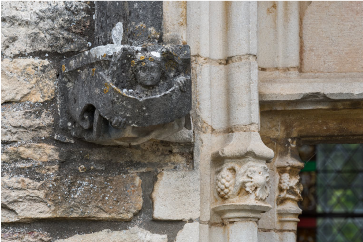
Détail de l'arc en accolade, décor de la retombée de gauche : ange portant un phylactère.

71, Laives montée de Lenoux, lieudit : Lenoux