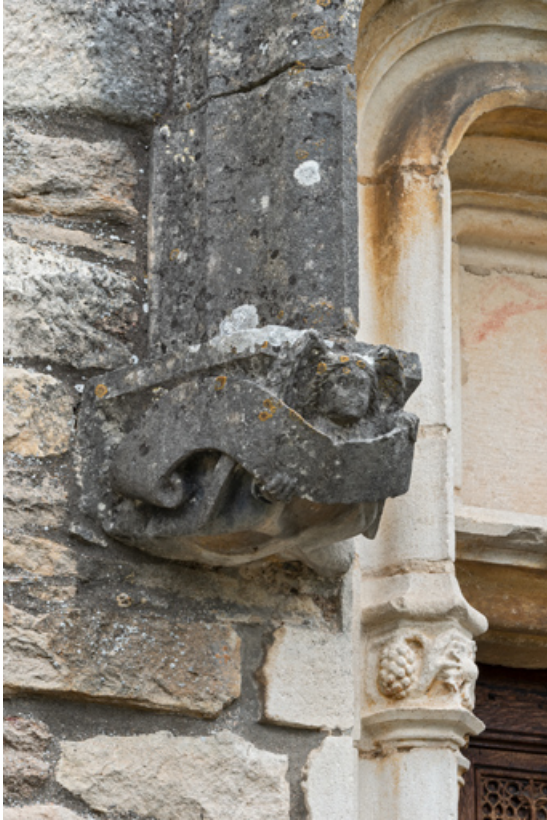
Détail de l'arc en accolade, décor de la retombée de gauche : ange portant un phylactère.

71, Laives montée de Lenoux, lieudit : Lenoux