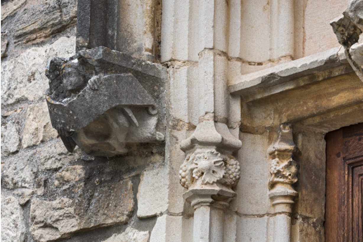
Détail de l'arc en accolade, décor de la retombée de gauche : ange portant un phylactère.

71, Laives montée de Lenoux, lieudit : Lenoux