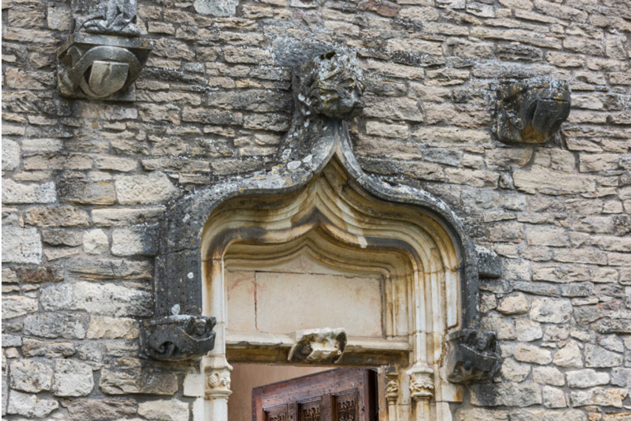
Tympan surmonté d'un arc en accolade.

71, Laives montée de Lenoux, lieudit : Lenoux