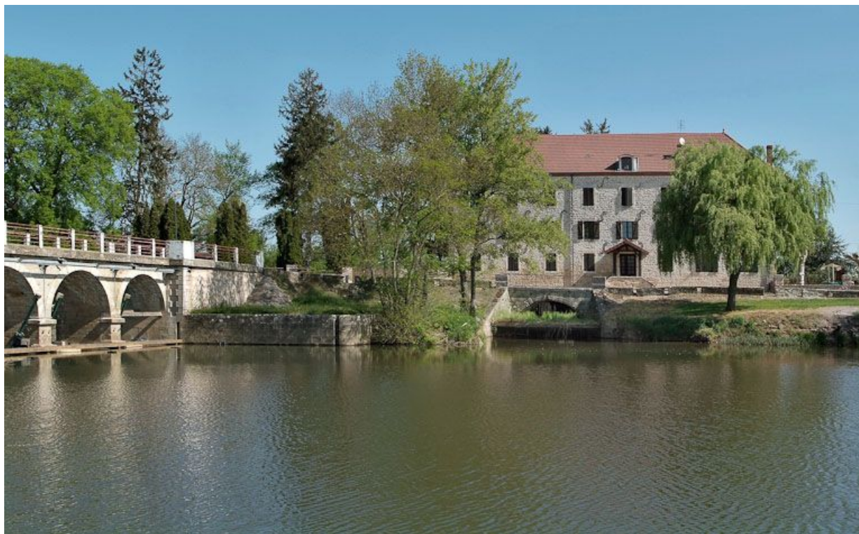
Barrage et pont de La Truchère à gauche, moulin à droite, vus de la rive droite de la Seille.