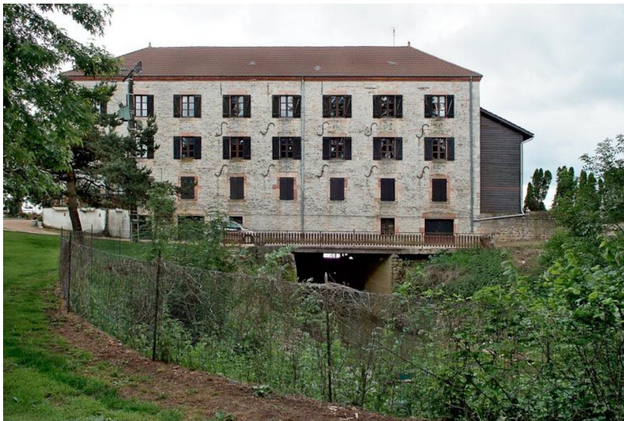
Vue de l'arrière du moulin avec le bief qui l'alimentait. 71, La Truchère