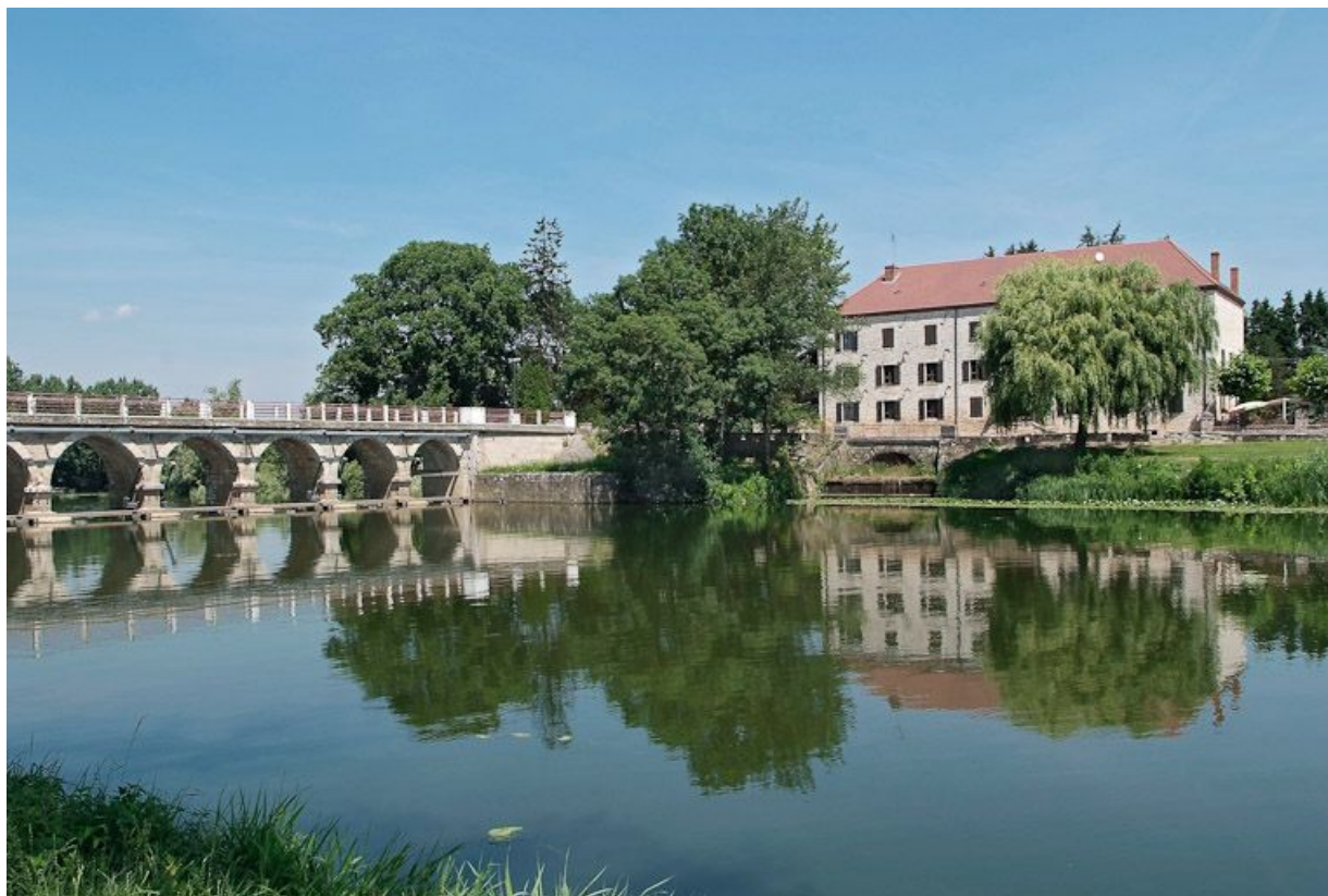
Barrage et pont de La Truchère à gauche, moulin à droite, vus de la rive droite de la Seille.