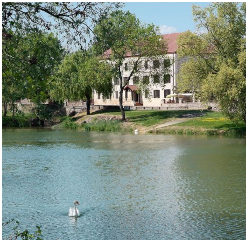
Moulin vu de la rive gauche de la Seille.