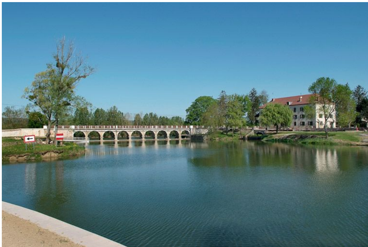
Barrage et pont de La Truchère à gauche, moulin à droite, vus de la rive gauche de la Seille.