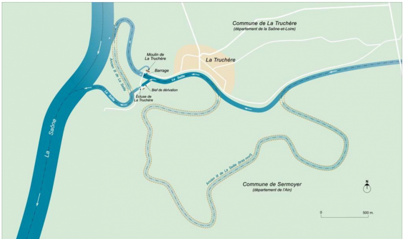
Plan schématique de la confluence de la Seille et de la Saône avec l'ancien tracé de la Seille.