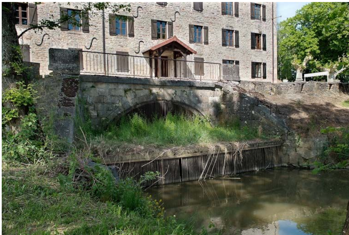
Vue de l'avant du moulin avec le bief qui l'alimentait.