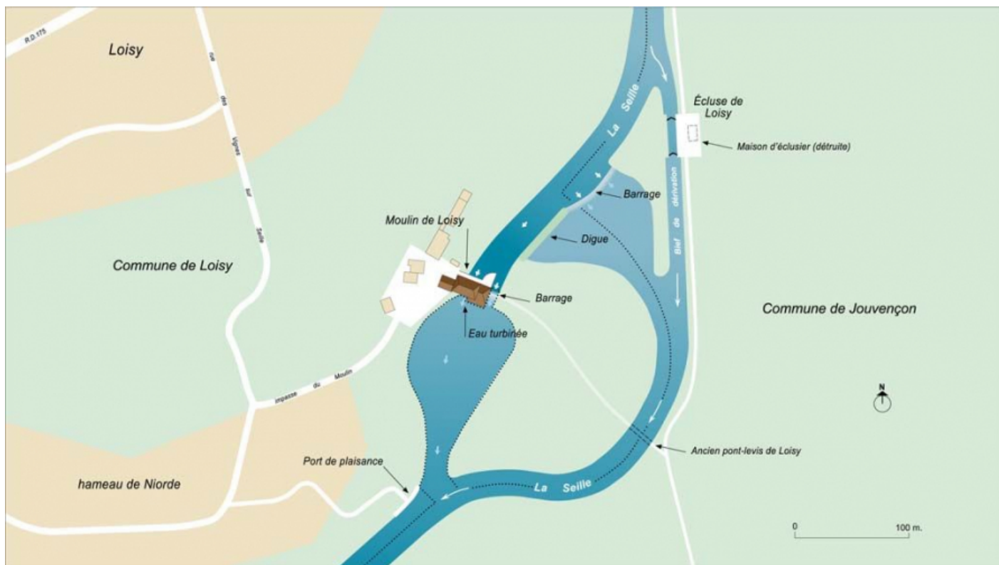
Plan schématique du site de l'écluse de Loisy, des barrages, du pont et du moulin de Loisy.