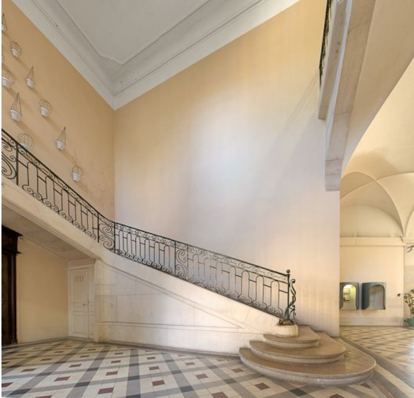
Escalier près de l'apothicaire.