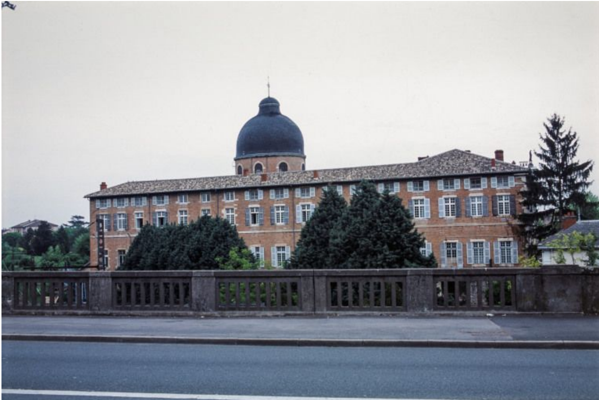
Elévation latérale gauche.