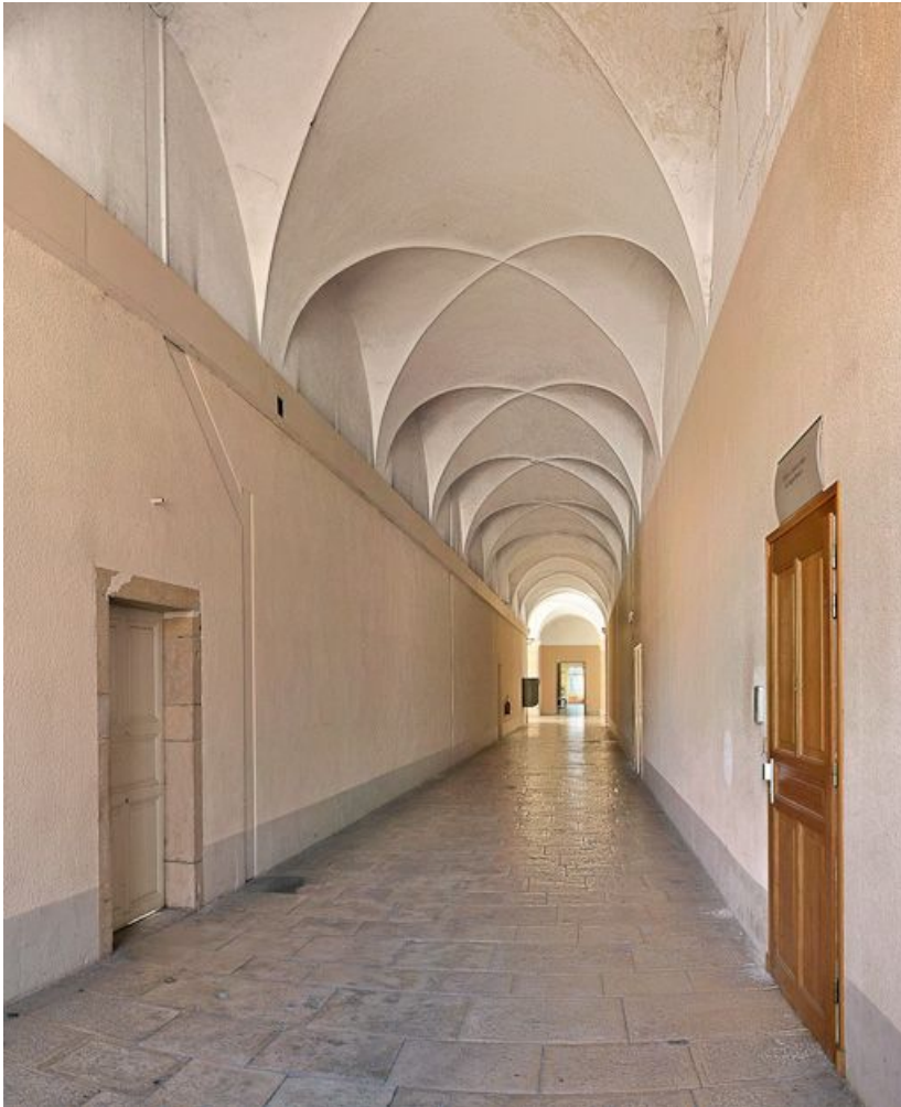
Couloir sud-est du rez-de-chaussée.