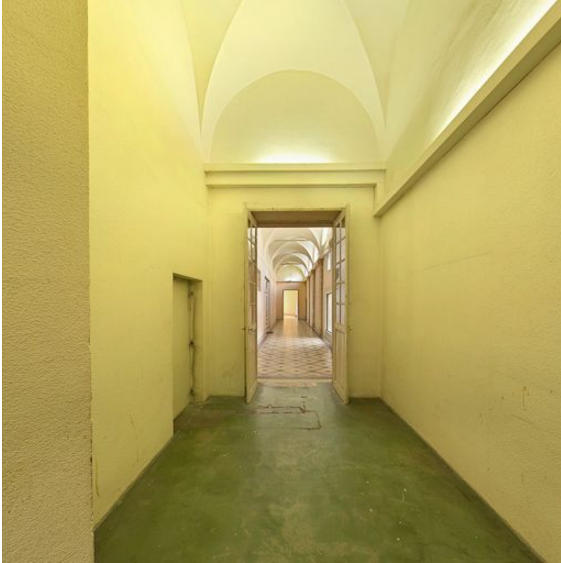
Couloir précédant la rotonde.