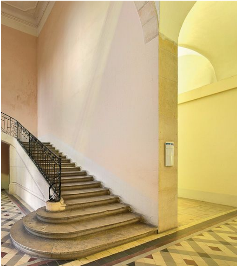
Départ de l'escalier.