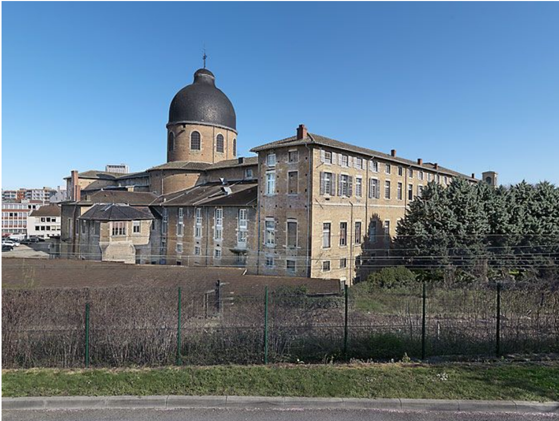
Elévations postérieure et latérale gauche.