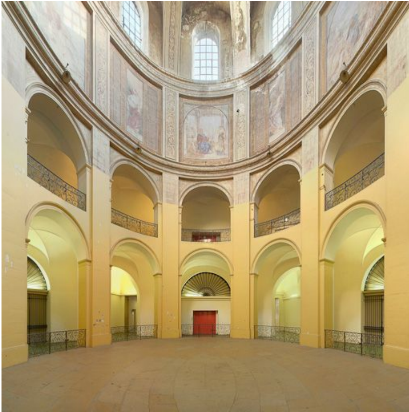
Rotonde, ancienne chapelle.