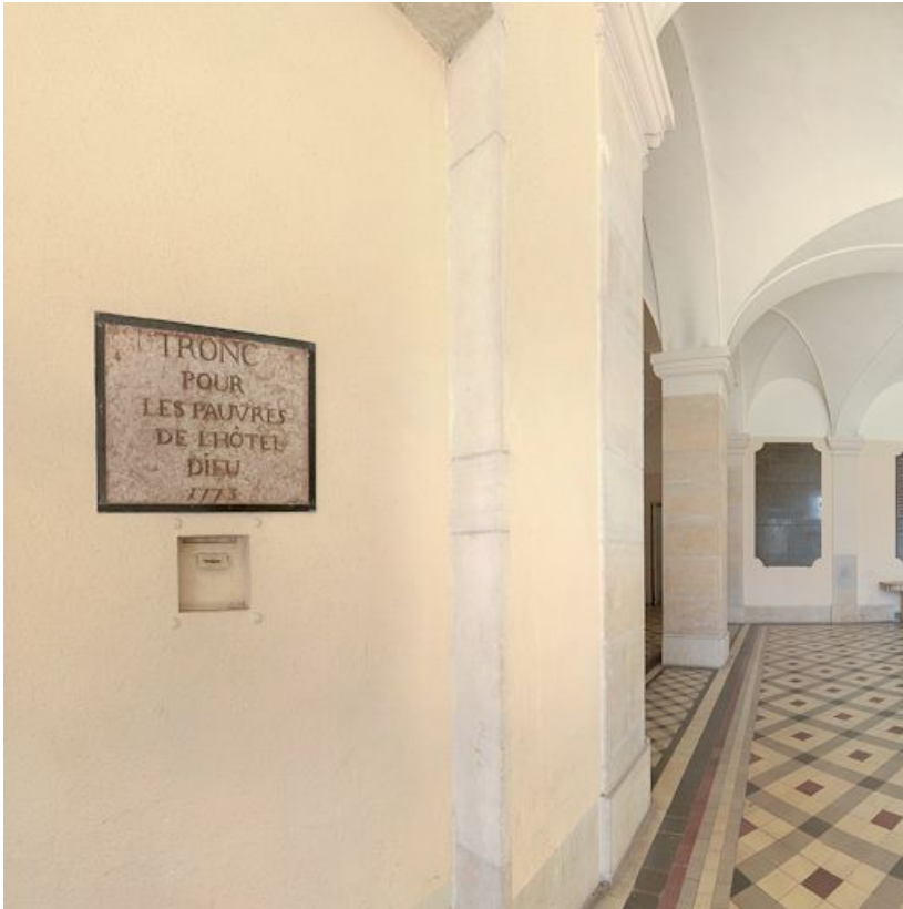
Vestibule, tronc des pauvres.