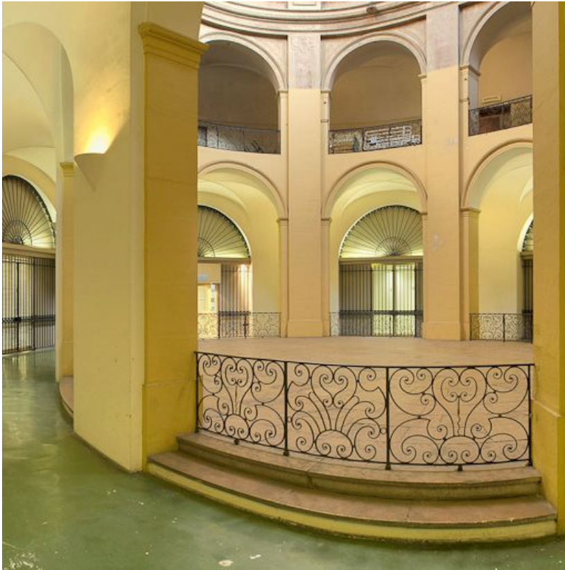
Rotonde (ancienne chapelle).