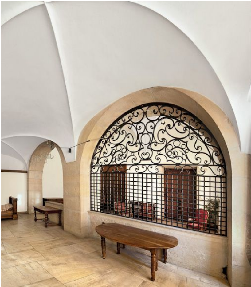
Salle à gauche de l'entrée.