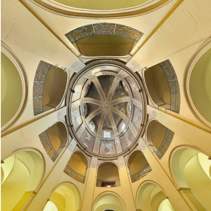
Vue intérieure du dôme.