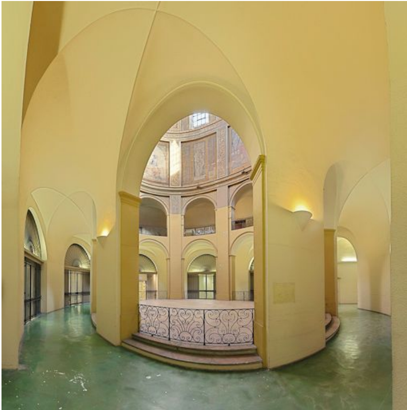
Rotonde (ancienne chapelle).