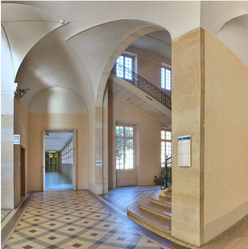
Escalier et couloir central, à droite du vestibule.