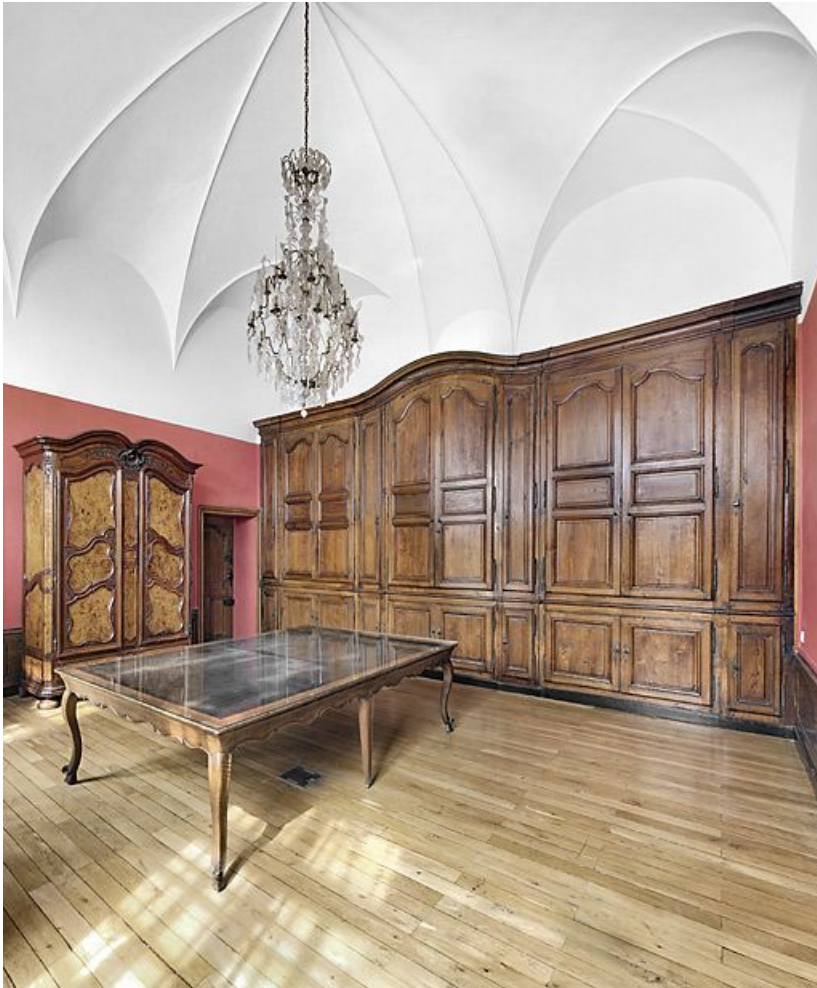
Salle de réunion des recteurs.