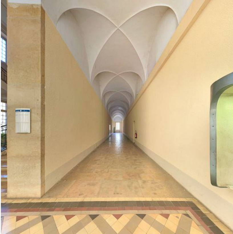
Couloir sud-est du rez-de-chaussée.