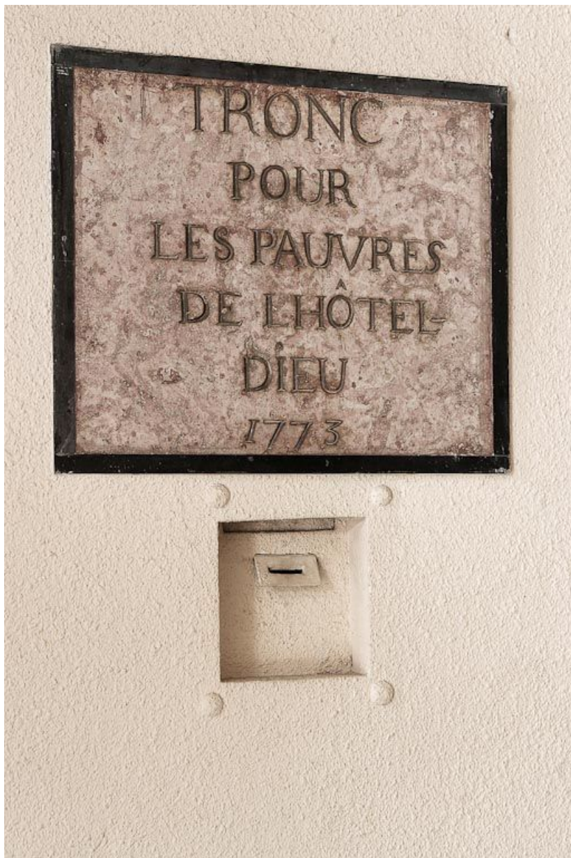
Vestibule, détail du tronc des pauvres.