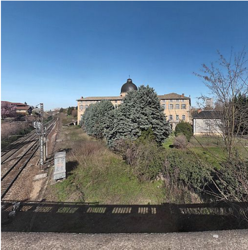
Elevation latérale gauche.