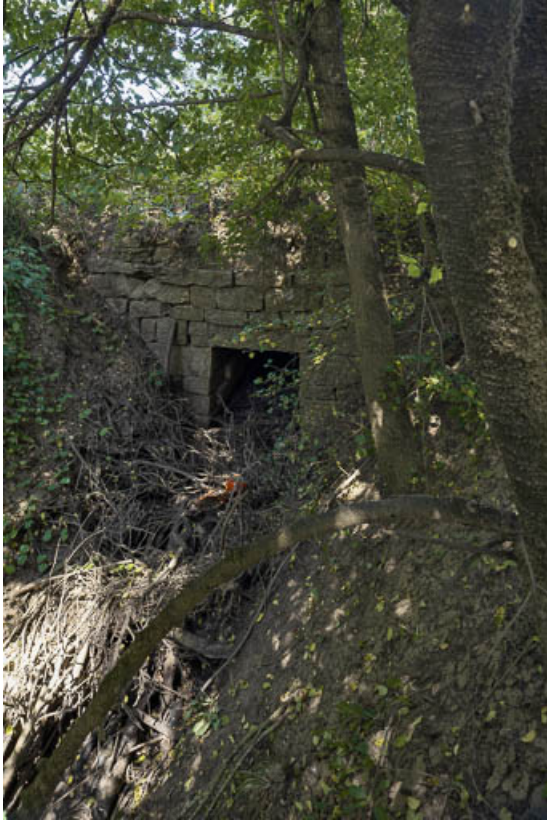
Vue de l'aqueduc.