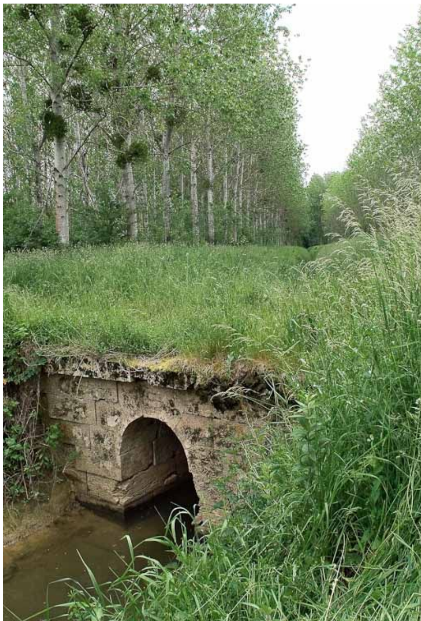
Ponceau, vue rapprochée.