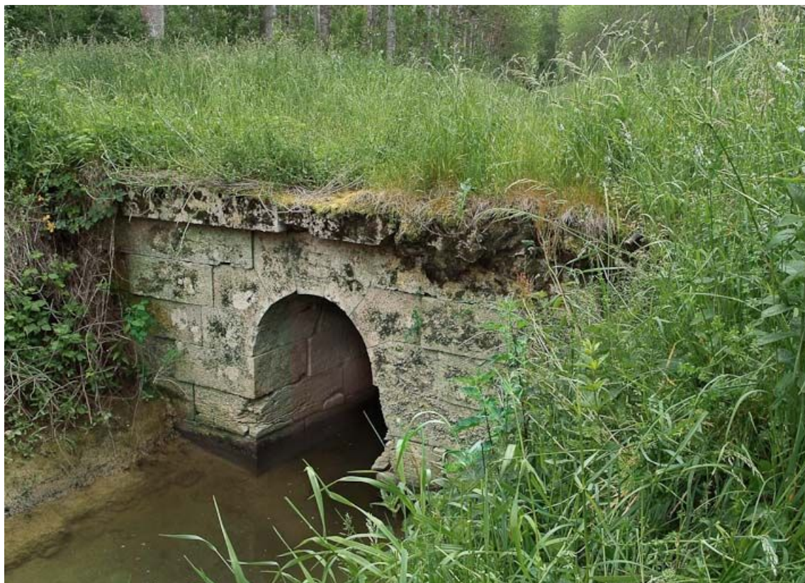
Ponceau, vue rapprochée.