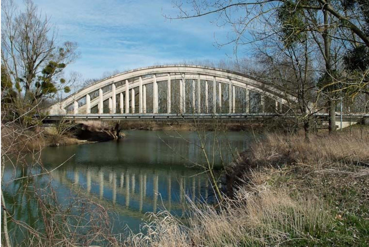
Pont de la Culée, il permet de traverser la Seille en direction de Branges.