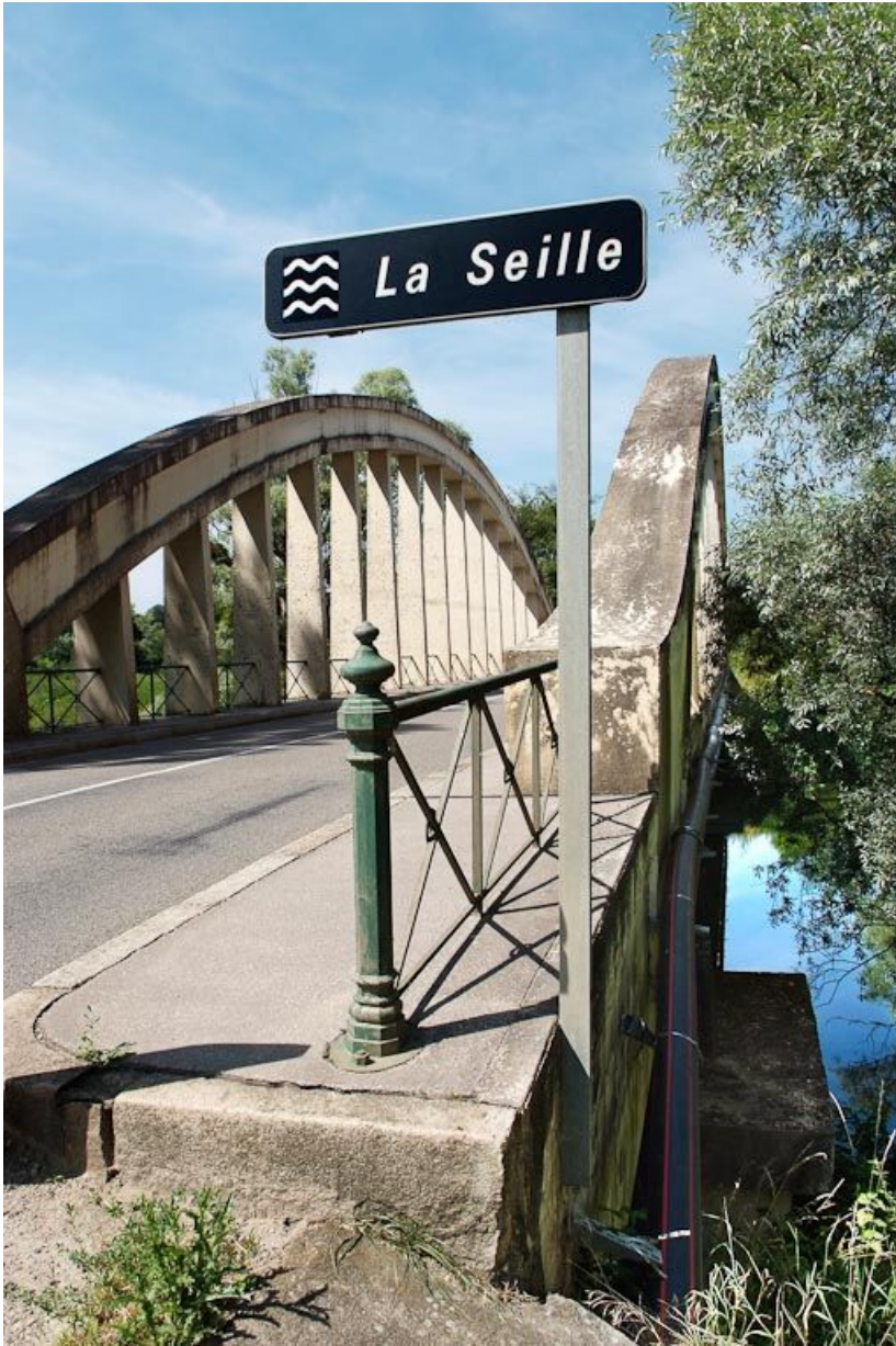
Pont de la Culée, il permet de traverser la Seille en direction de Branges. Entrée du pont avec panneau indiquant qu'il franchit la Seille.