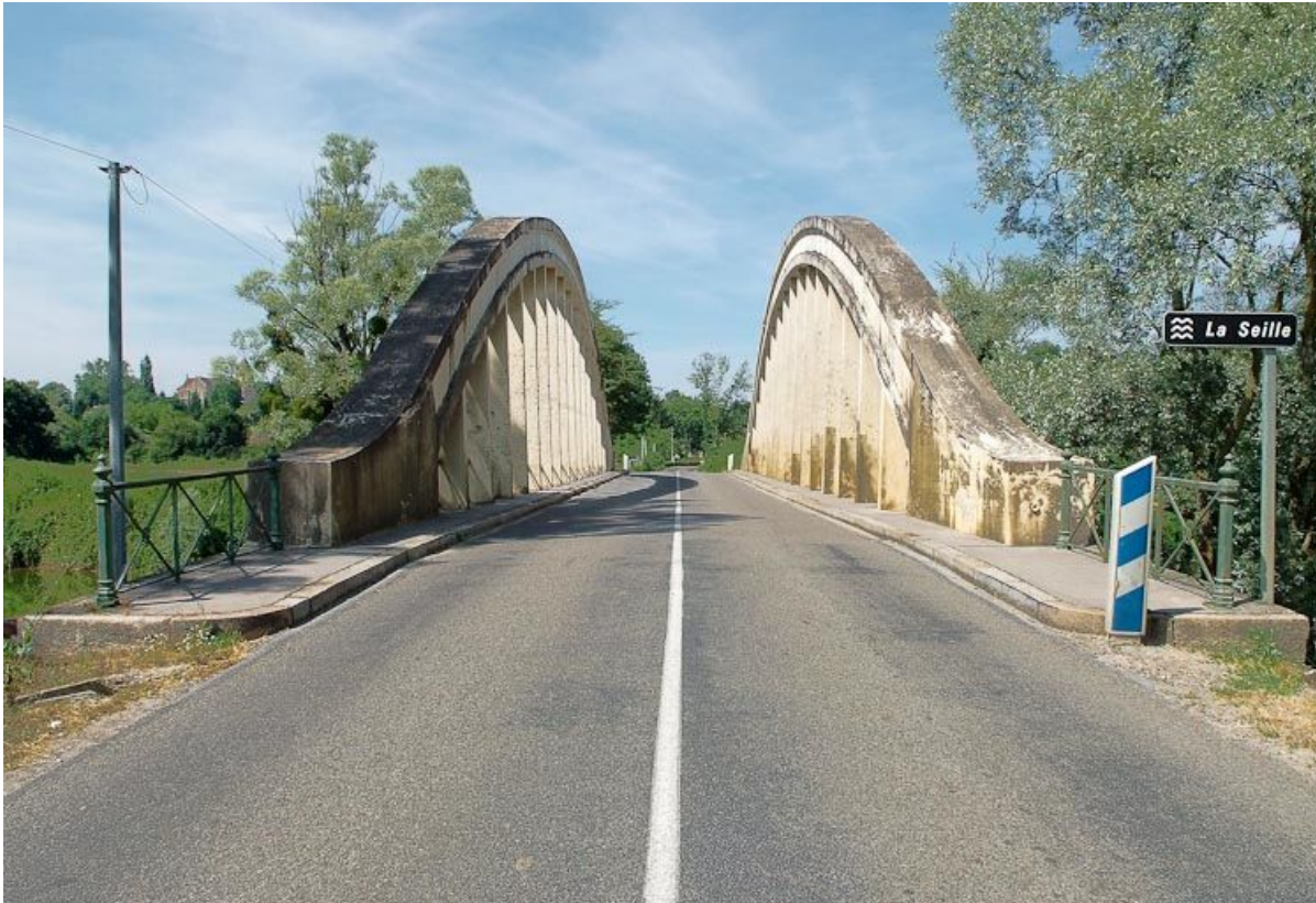
Pont de la Culée, il permet de traverser la Seille en direction de Branges. Vue rapprochée de la chaussée avec panneau "La Seille". 71, Branges, lieudit : La Culée