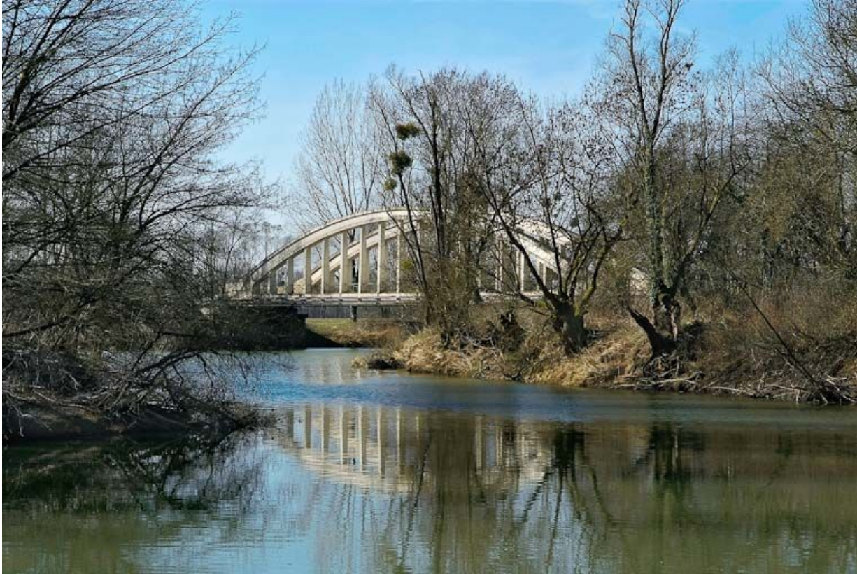
Pont de la Culée, il permet de traverser la Seille en direction de Branges.