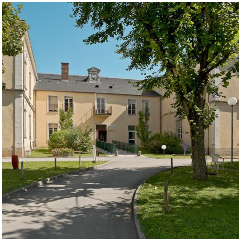
Bâtiment en U, façades sur la cour.