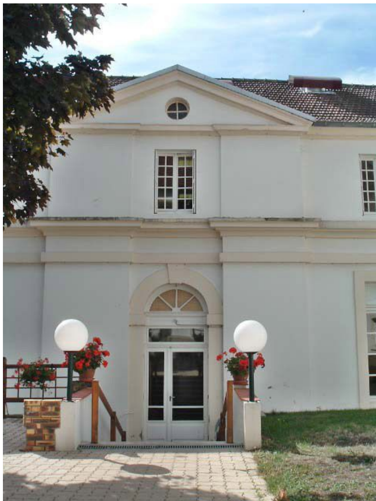
Bâtiment Dalivert (1781-1784), vue rapprochée de la façade antérieure, avant-corps central. 71, Montcenis Eglise