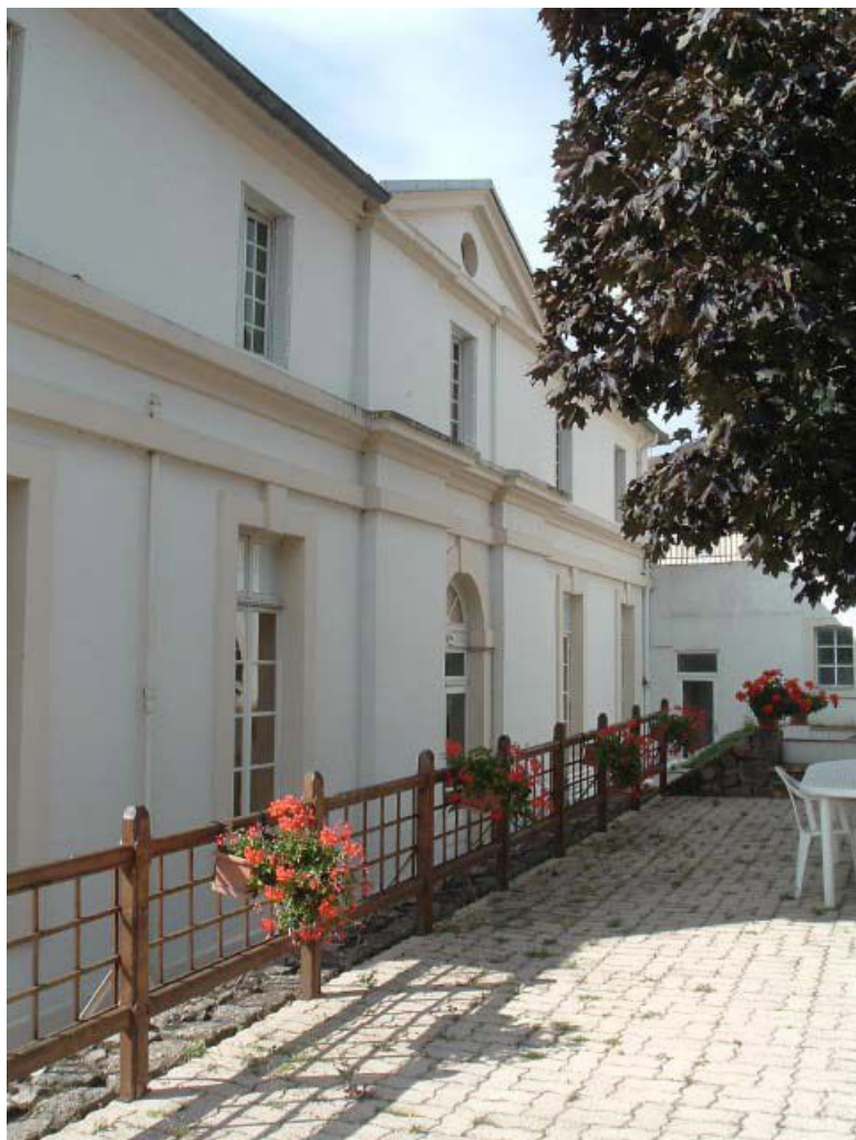
Bâtiment Dalivert (1781-1784), façade antérieure, vue générale latérale, depuis la terrasse du jardin contemporain. 71, Montcenis Eglise