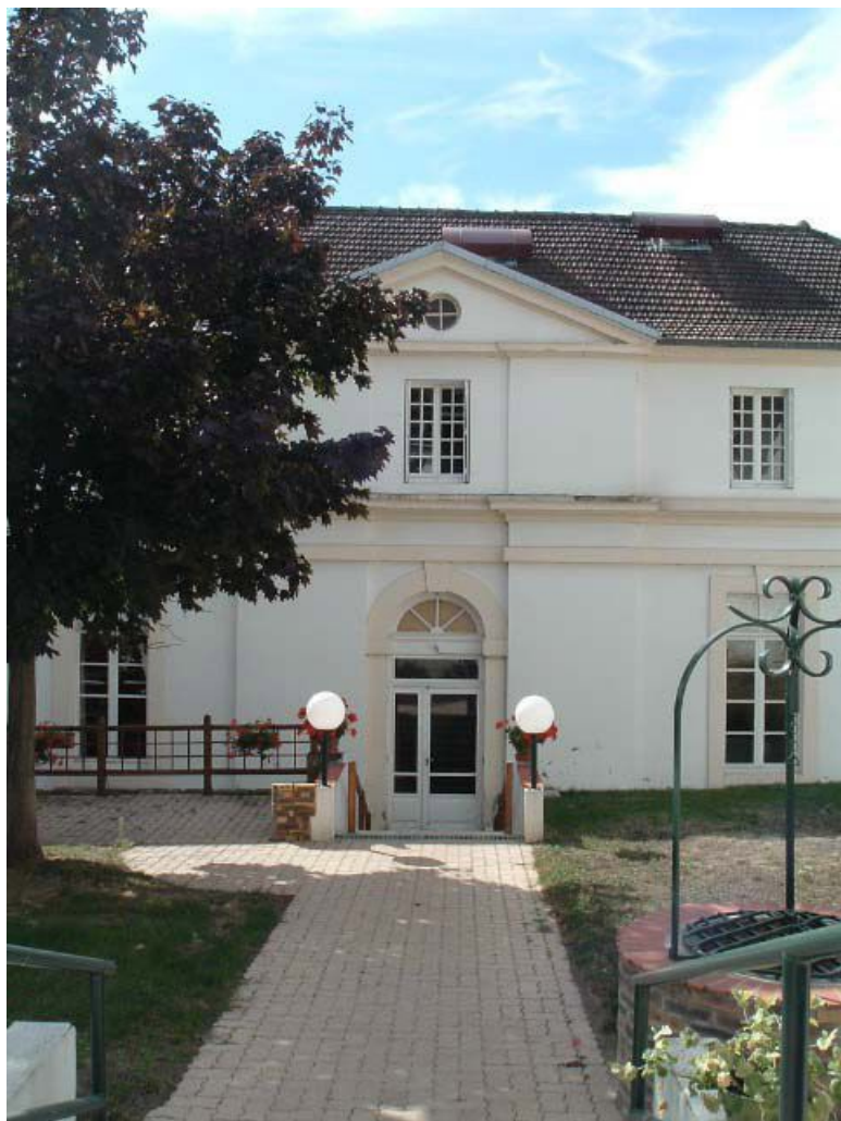
Bâtiment Dalivert (1781-1784), vue partielle de la façade antérieure, avant-corps central. 71, Montcenis Eglise