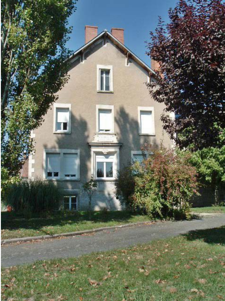
Vue d'ensemble de la façade latérale du bâtiment d'origine, depuis le jardin. 71, Issy-l'Évêque, 7 rue des Emigrés