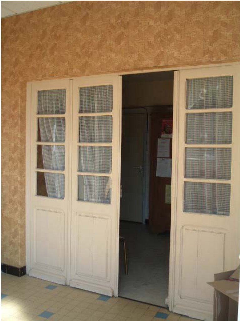
Vue intérieure, détail, porte vitrée à panneaux pleins et petits bois.