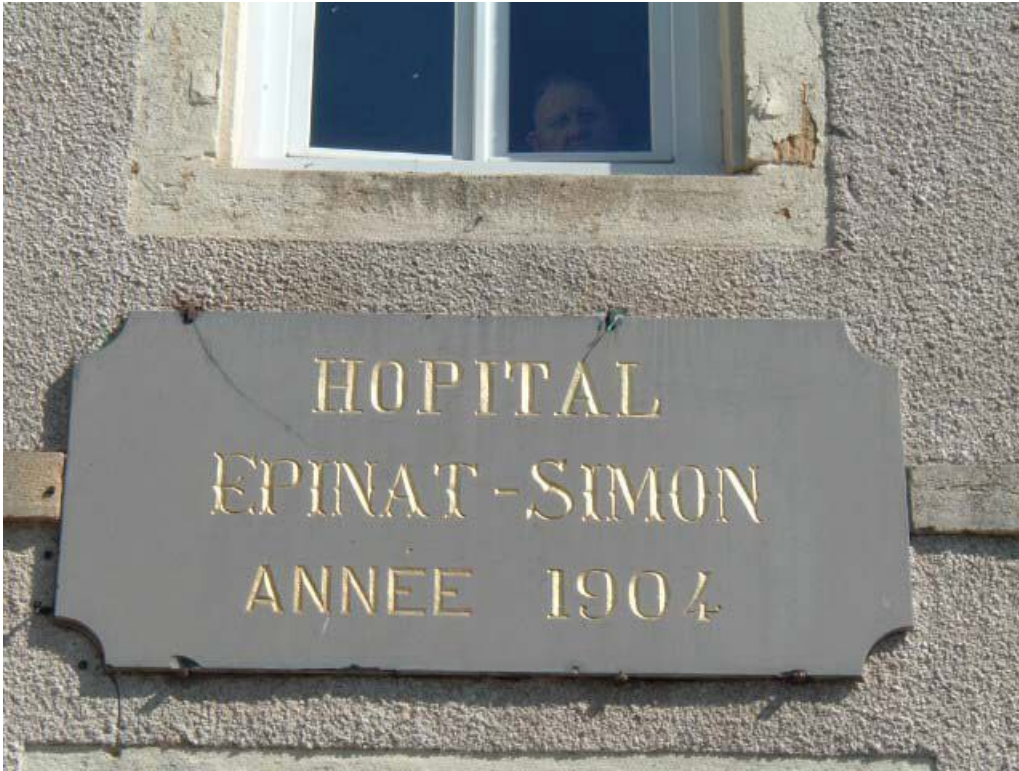
Vue de détail de la plaque gravée de l'hôpital, portant l'inscription "HOPITAL EPINAT-SIMON ANNEE 1904". 71, Issy-l'Évêque, 7 rue des Emigrés