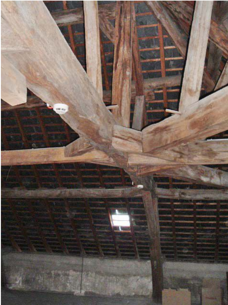
Vue intérieure de la charpente, comble.