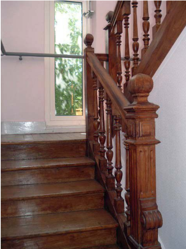
Vue de l'ancien escalier, bois tourné et sculpté.