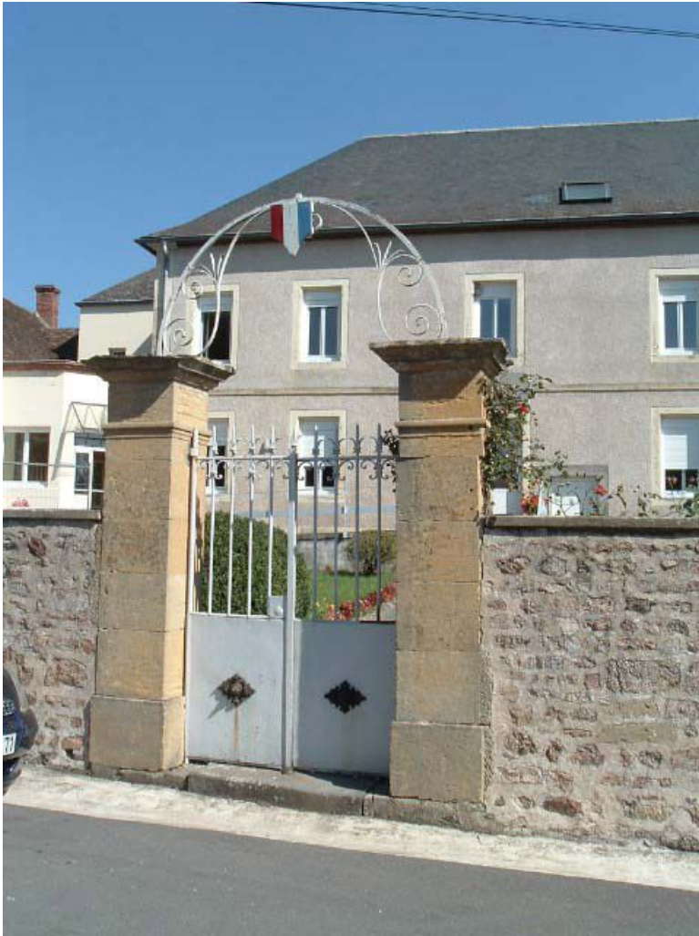
Portail d'entrée du bâtiment d'origine, vue de détail.