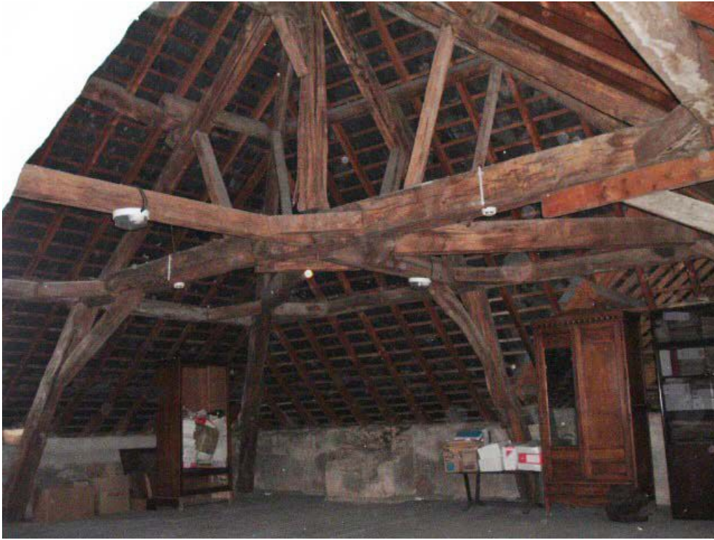
Vue de détail de la charpente, noeud de charpente, comble.