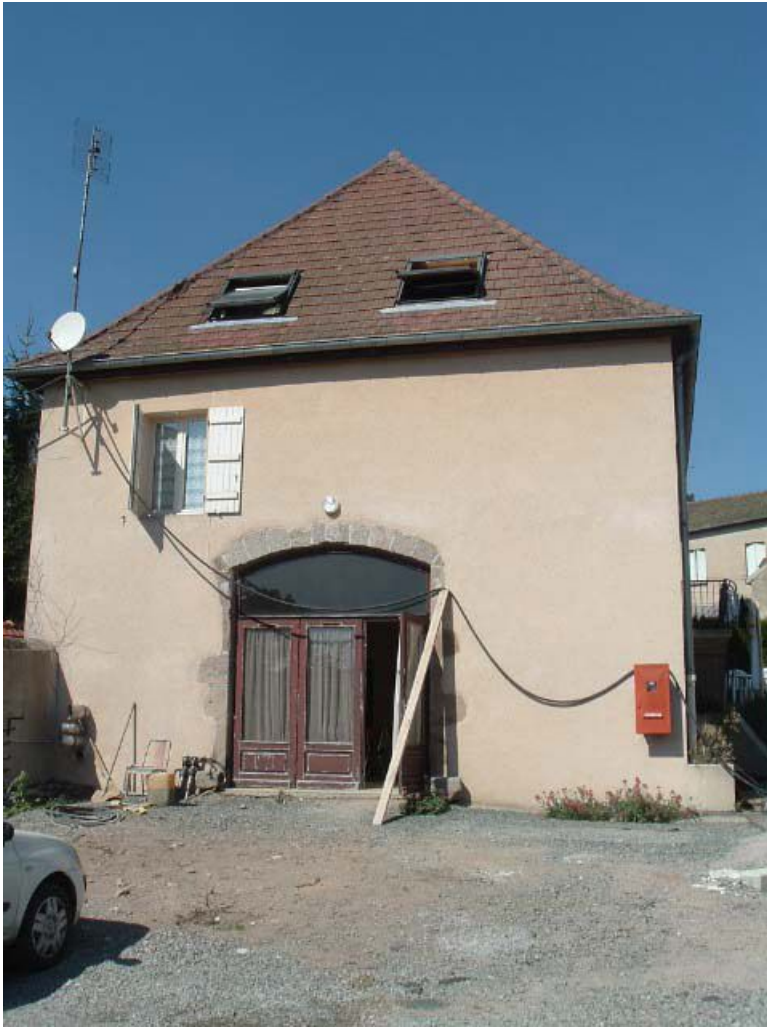
Vue d'ensemble du bâtiment des communs.