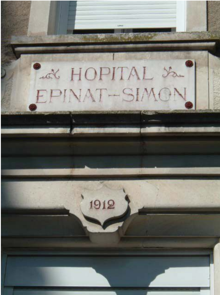
Vue de détail de la façade latérale, portant l'inscription "HOPITAL EPINAT-SIMON 1912". 71, Issy-l'Évêque, 7 rue des Emigrés