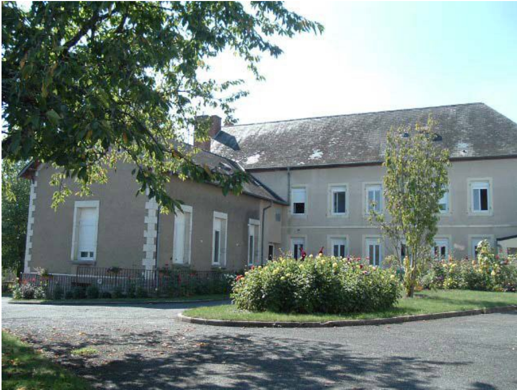
Vue d'ensemble de la façade postérieure.