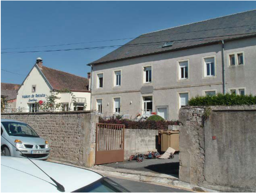
Vue partielle de la façade antérieure du bâtiment d'origine, vue depuis la rue. 71, Issy-l'Évêque, 7 rue des Emigrés