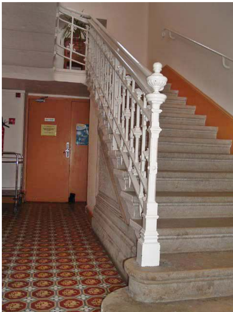
Vue intérieure, escalier en fonte au départ du rez-de-chaussée et carrelage en ciment. 71, Louhans, 12 rue Ferdinand Bourgeois