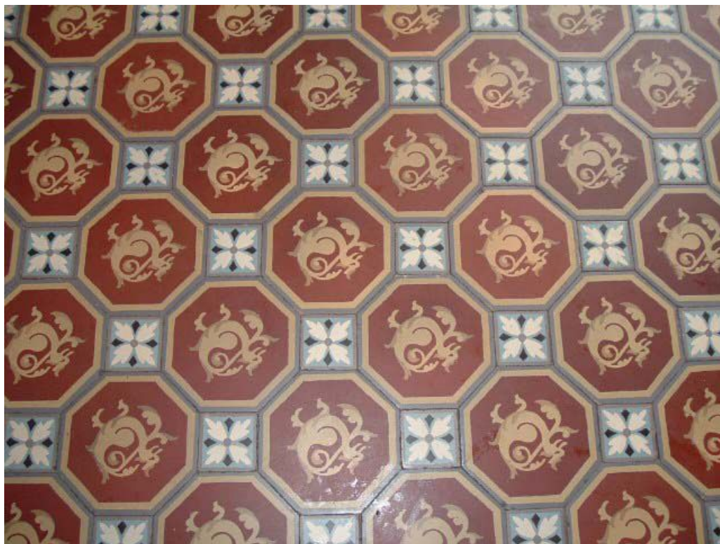
Vue de détail d'un ensemble de carreaux de ciment du rez-de-chaussée.