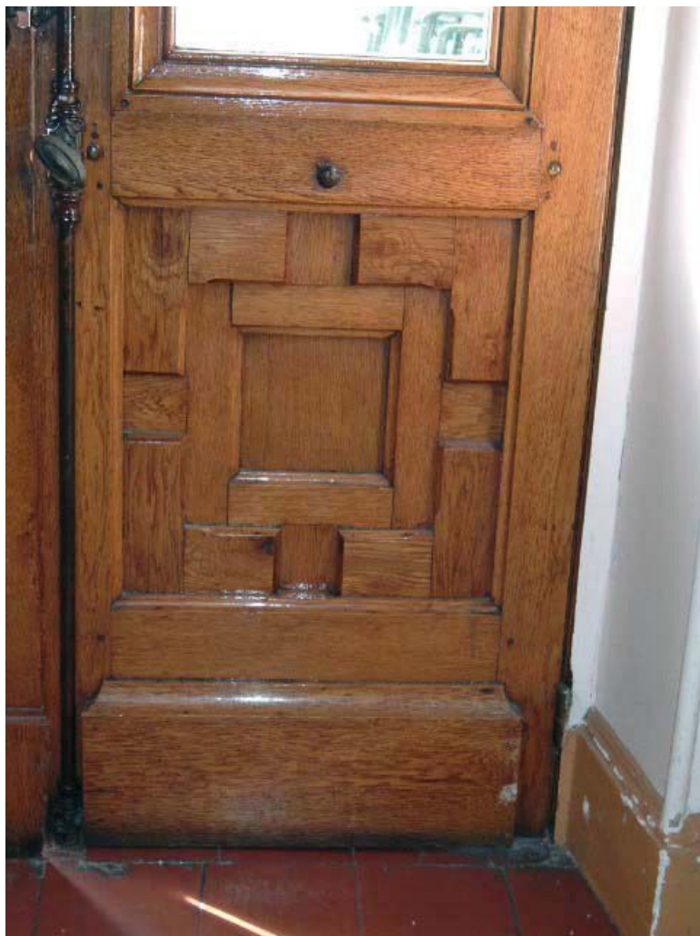
Vue de détail d'un panneau bois d'une porte d'entrée, assemblage vu de l'intérieur du bâtiment. 71, Louhans, 12 rue Ferdinand Bourgeois