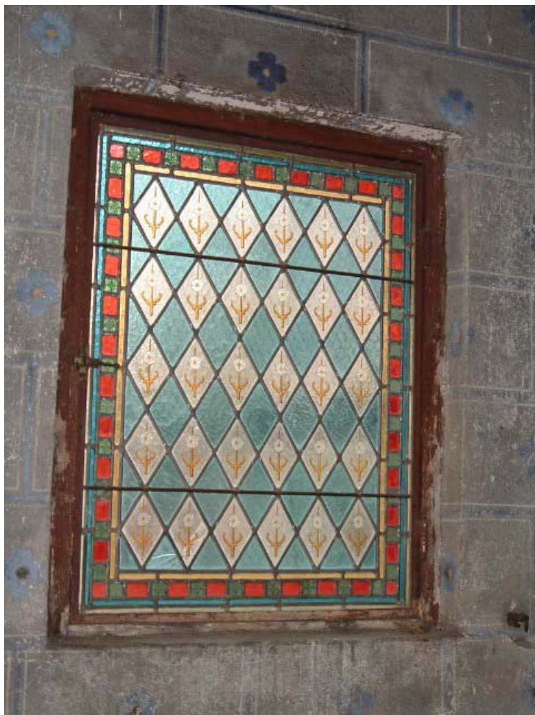
Vue de détail du vitrail de l'oratoire (décor géométrique et végétal stylisé).