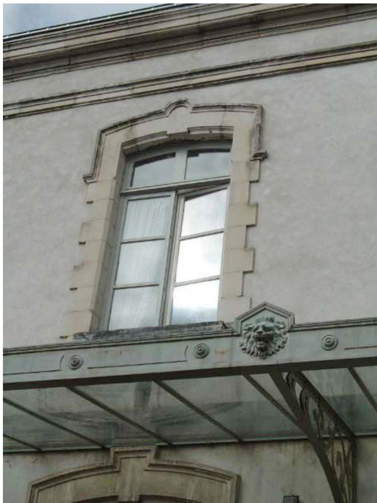
Vue de détail d'une fenêtre de la façade antérieure.