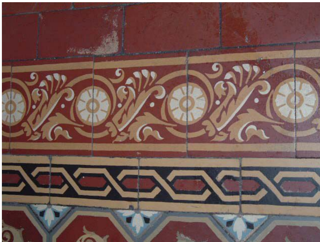
Vue de détail de la frise extérieure du carrelage en ciment, rez-de-chaussée.