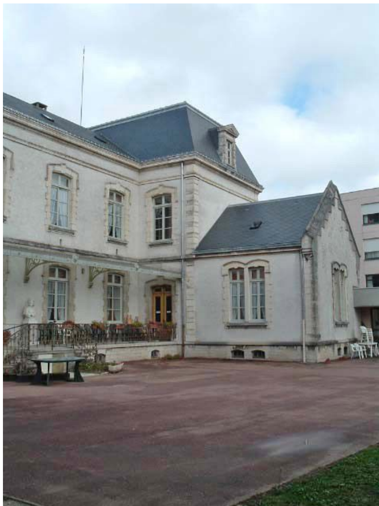
Vue partielle de l'aile droite.