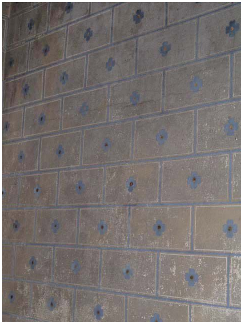
Vue de détail de la peinture murale de l'oratoire (décor polychrome faux joints et fleurette). 71, Louhans, 12 rue Ferdinand Bourgeois