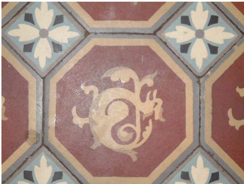
Vue de détail du carrelage du rez-de-chaussée.