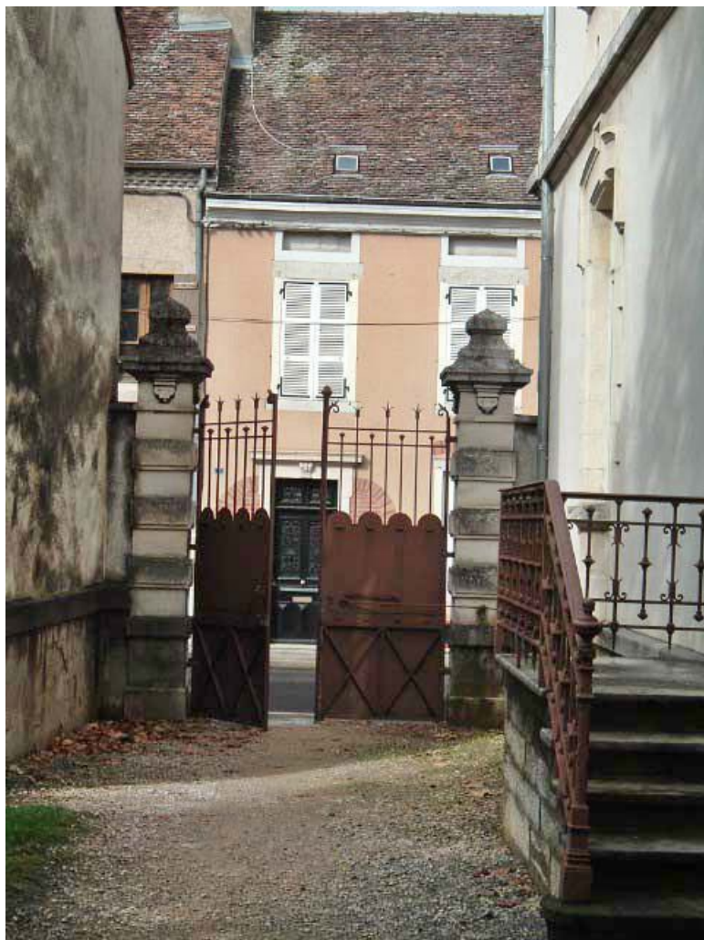
Vue du portail, de la grille et de l'escalier en fonte de l'entrée située sur la façade postérieure de l'établissement. 71, Louhans, 12 rue Ferdinand Bourgeois