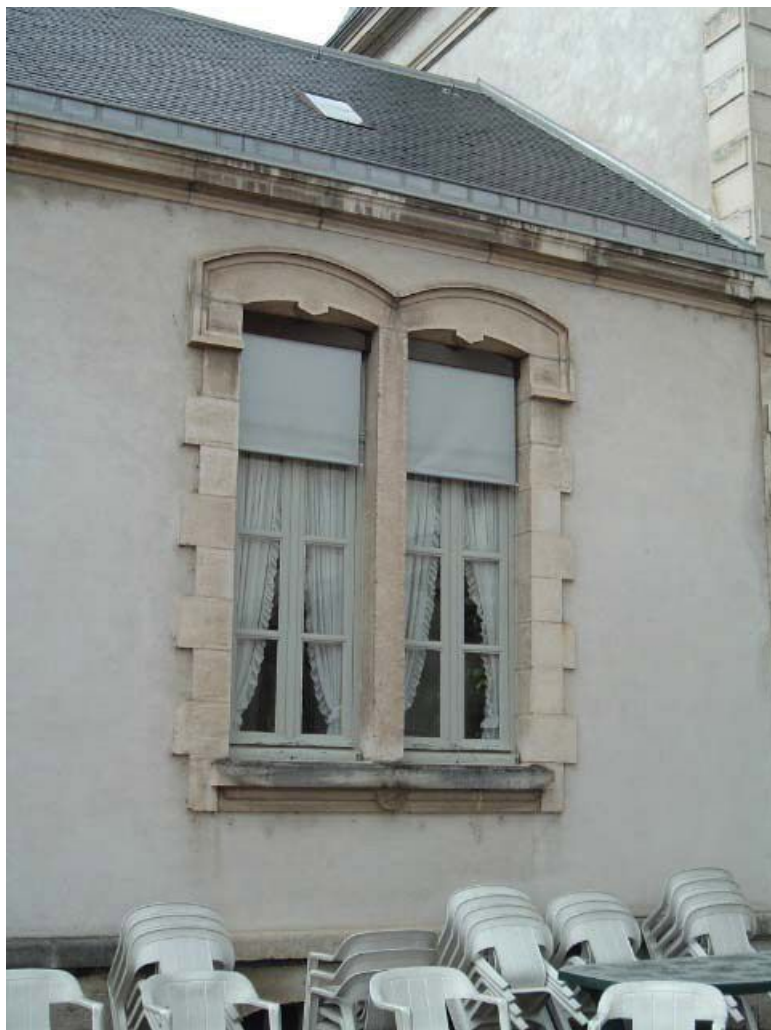
Vue de détail d'une baie géminée (aile gauche surbaissée).