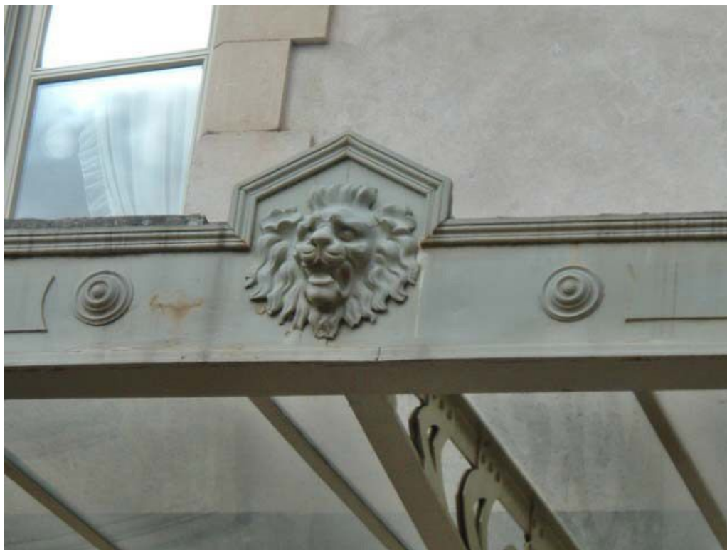
Vue de détail du mascarón (tête de lion) de la galerie extérieure à structure métallique (fonte). 71, Louhans, 12 rue Ferdinand Bourgeois