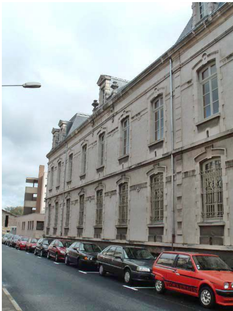
Vue générale latérale de la façade postérieure.