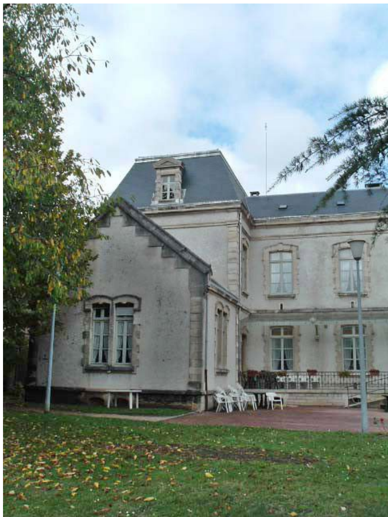
Vue partielle de l'aile gauche.