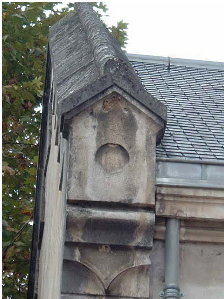
Vue de détail : rampant du pignon découvert.