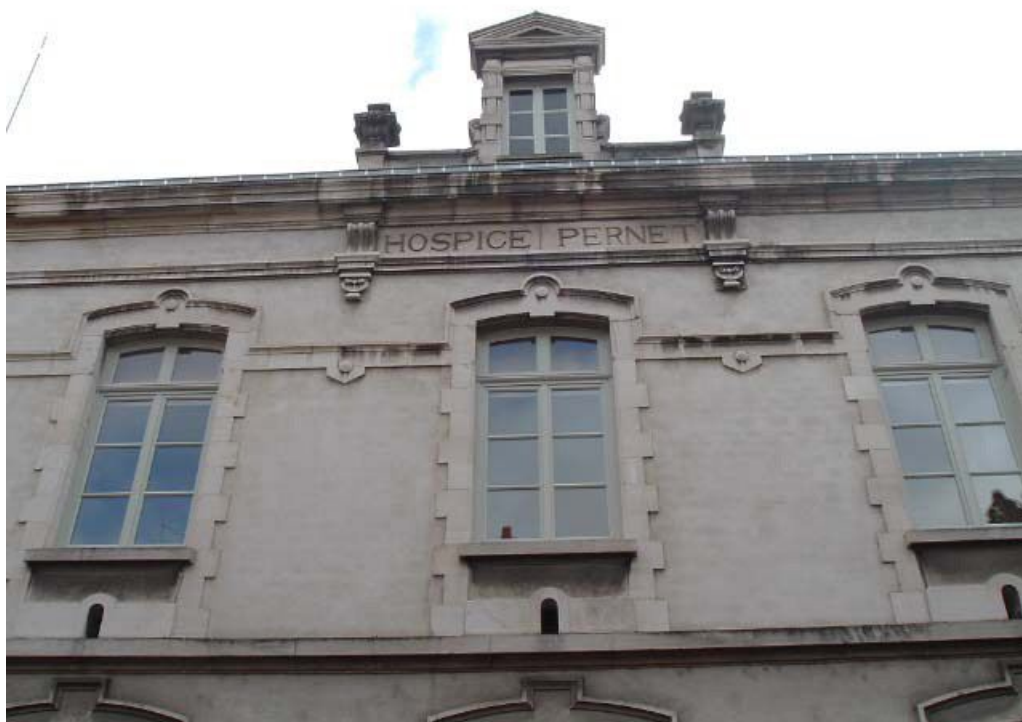
Vue de détail de la façade postérieure, étage carré, inscription HOSPICE PERNET.