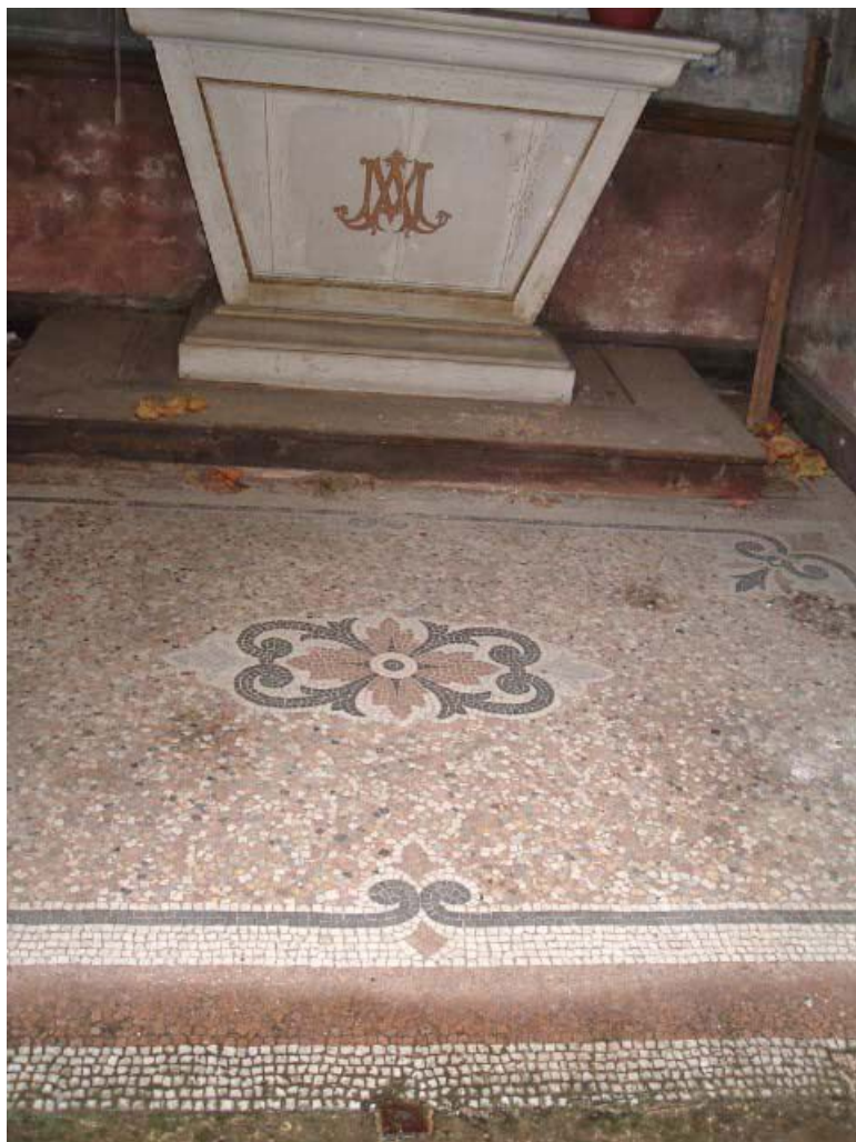
Vue de détail intérieure du carrelage de l'oratoire.