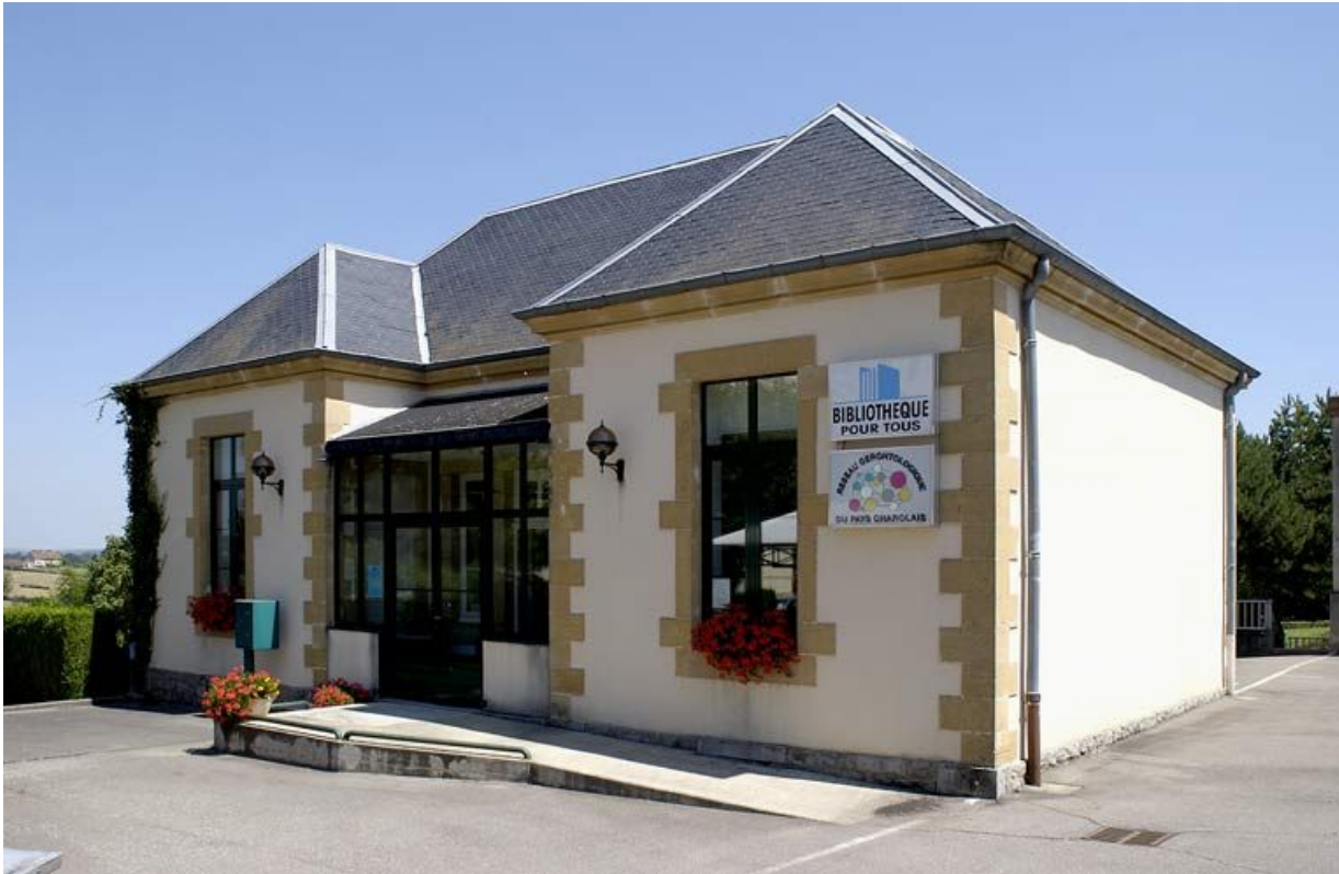
Ancienne maternité, vue d'ensemble.