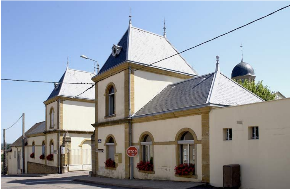
Pavillons d'entrée, vue générale depuis la rue. 71, Charolles, 6 rue du Prieuré