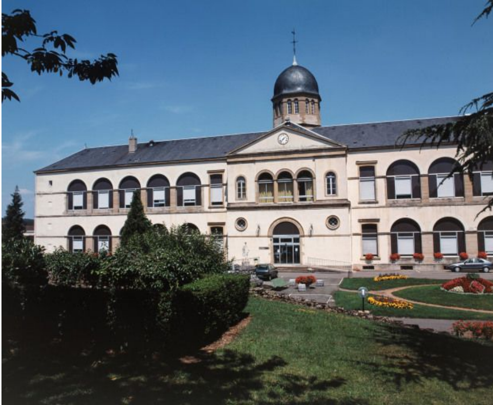
Vue de la façade principale.