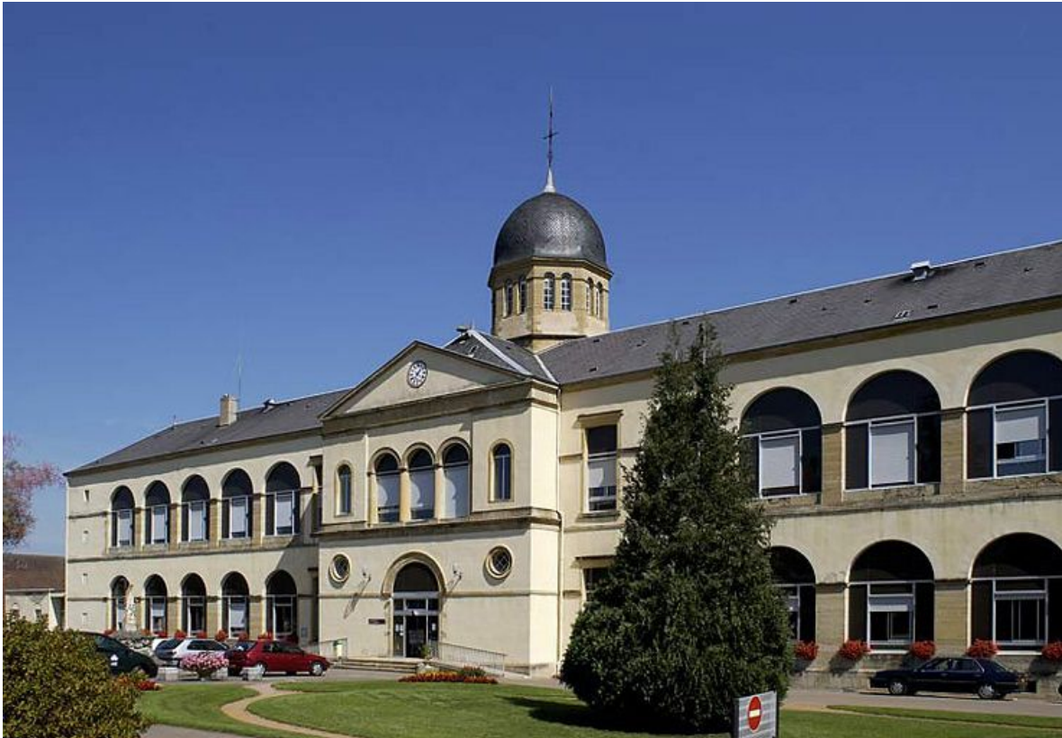
Façade antérieure, vue d'ensemble de la partie gauche.