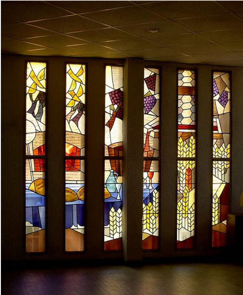
Chapelle actuelle, vitraux contemporains.