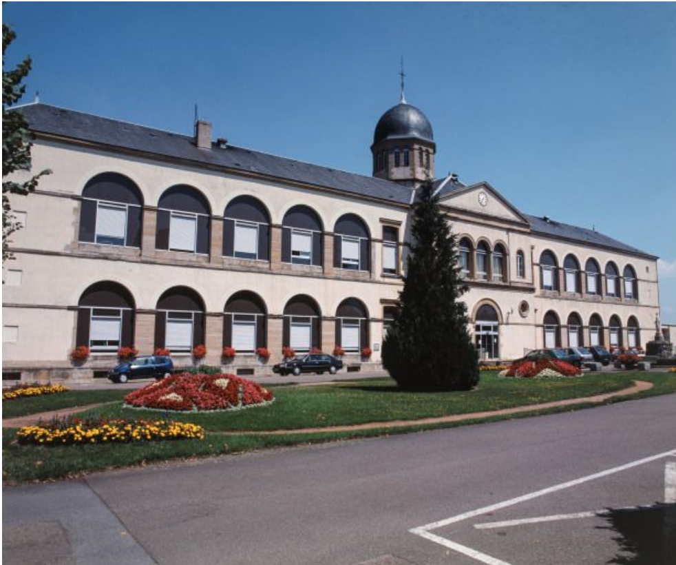
Vue de la façade principale de trois-quarts.