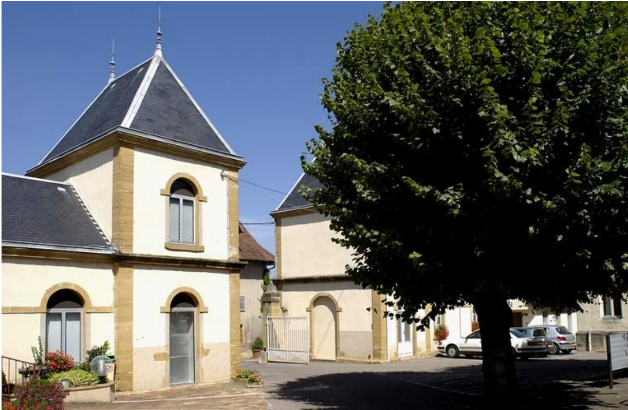
Pavillons d'entrée, vue générale depuis la cour. 71, Charolles, 6 rue du Prieuré