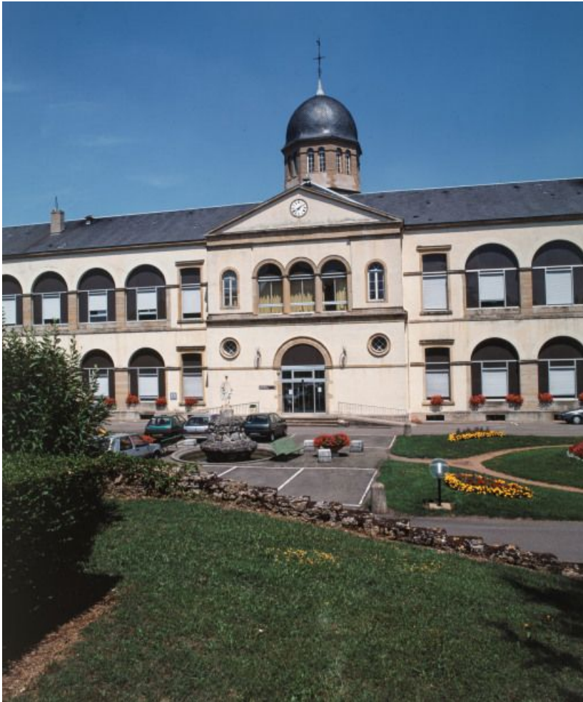
Partie centrale de la façade principale.