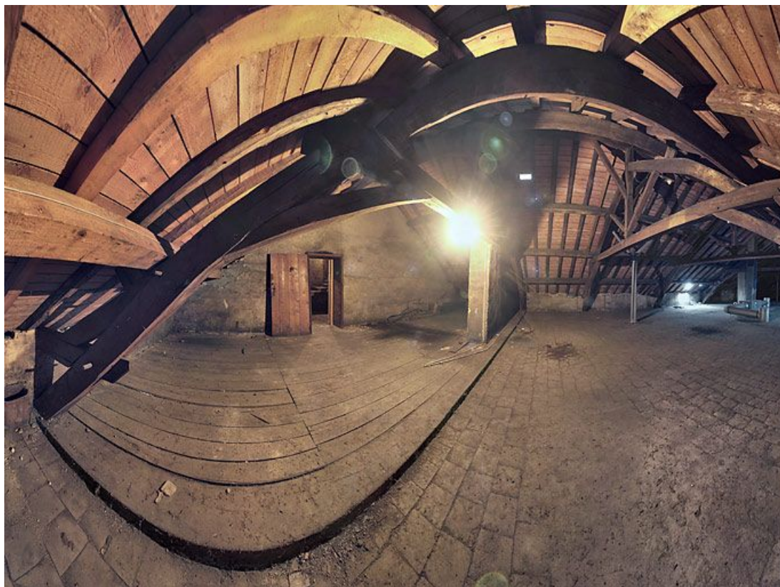
Combles du bâtiment principal.