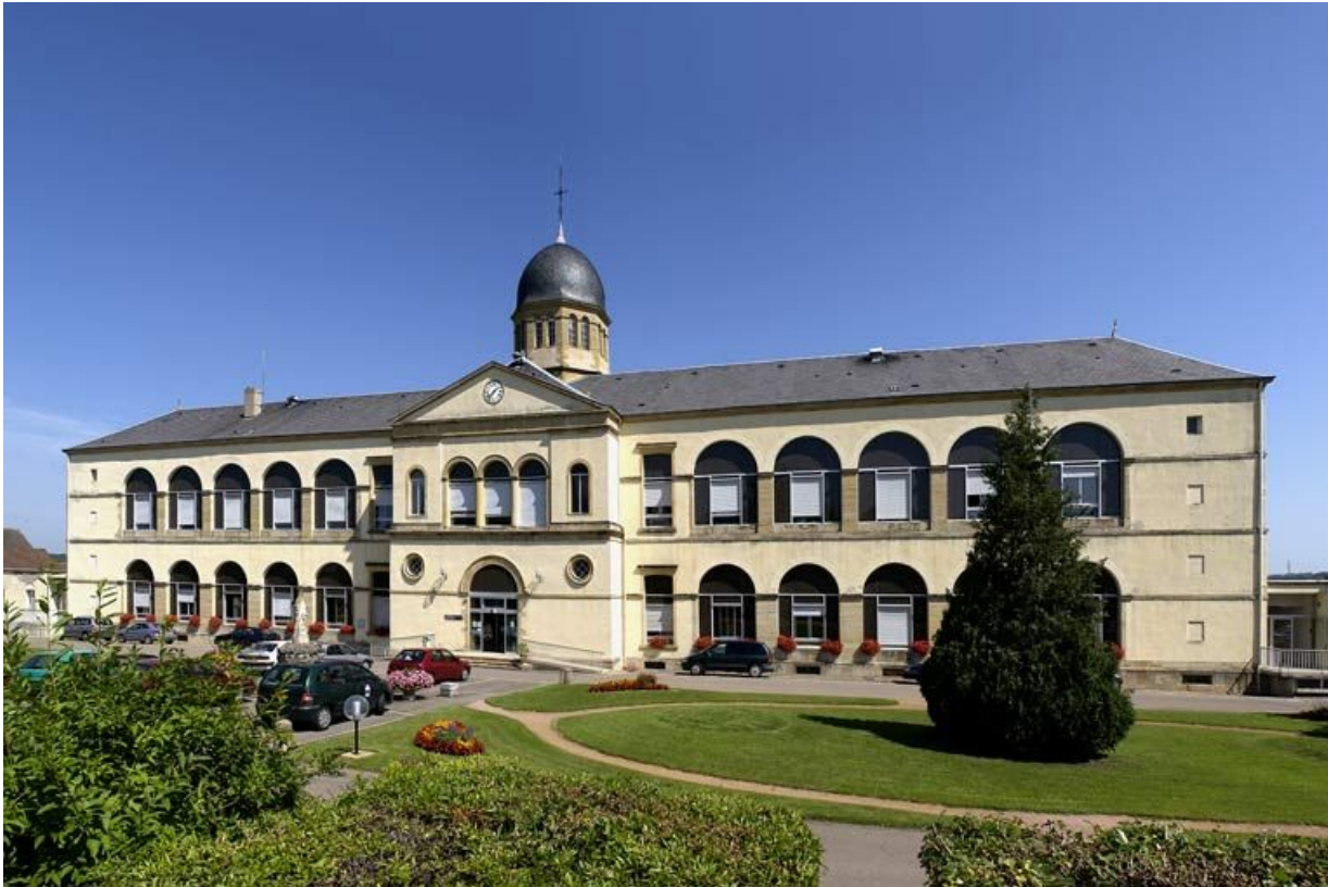
Vue générale de la façade antérieure.