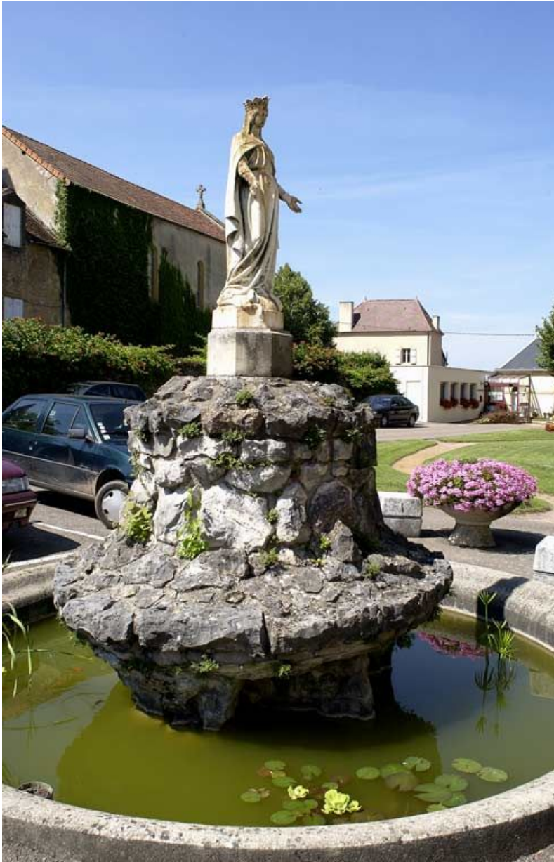
Bassin et statue de la Vierge dans le jardin.