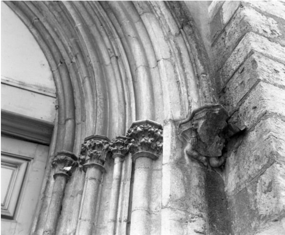
Culot et chapiteaux droits du portail.