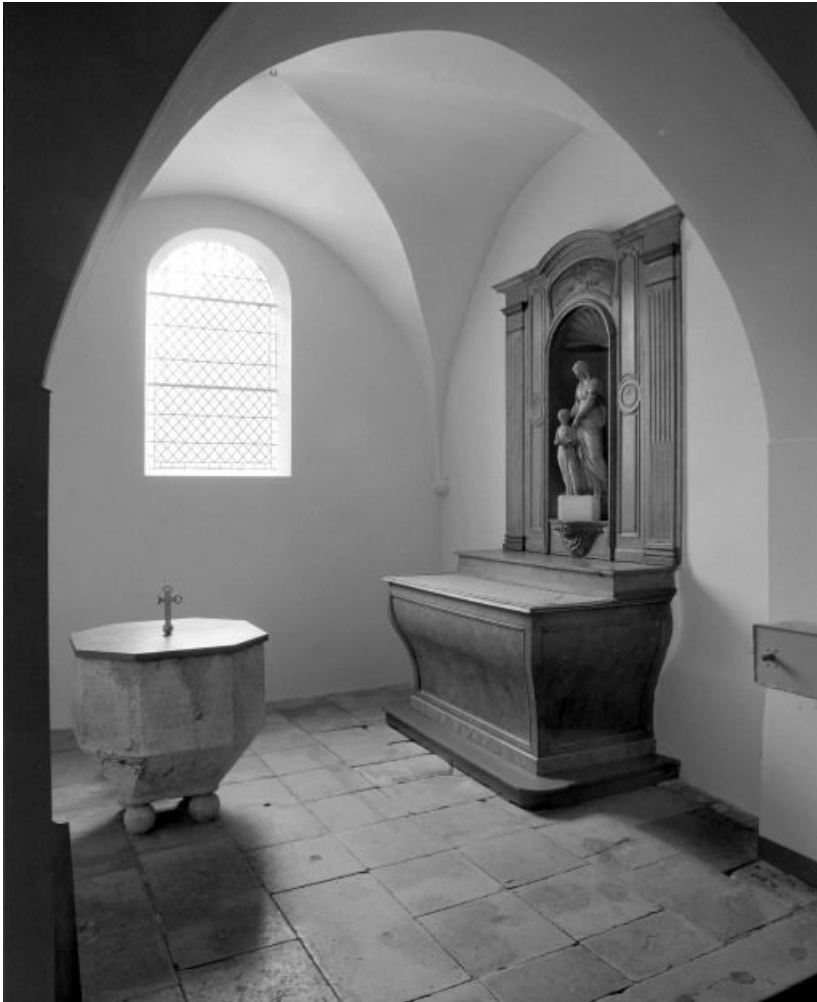
Première chapelle gauche.