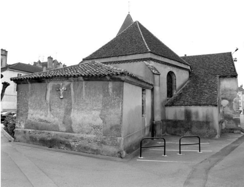
Sacristies (ancienne et actuelle).