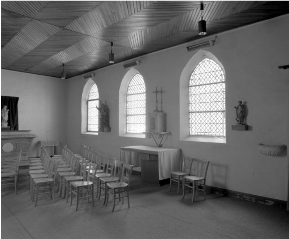
Première chapelle droite, dite chapelle Notre-Dame des treize.