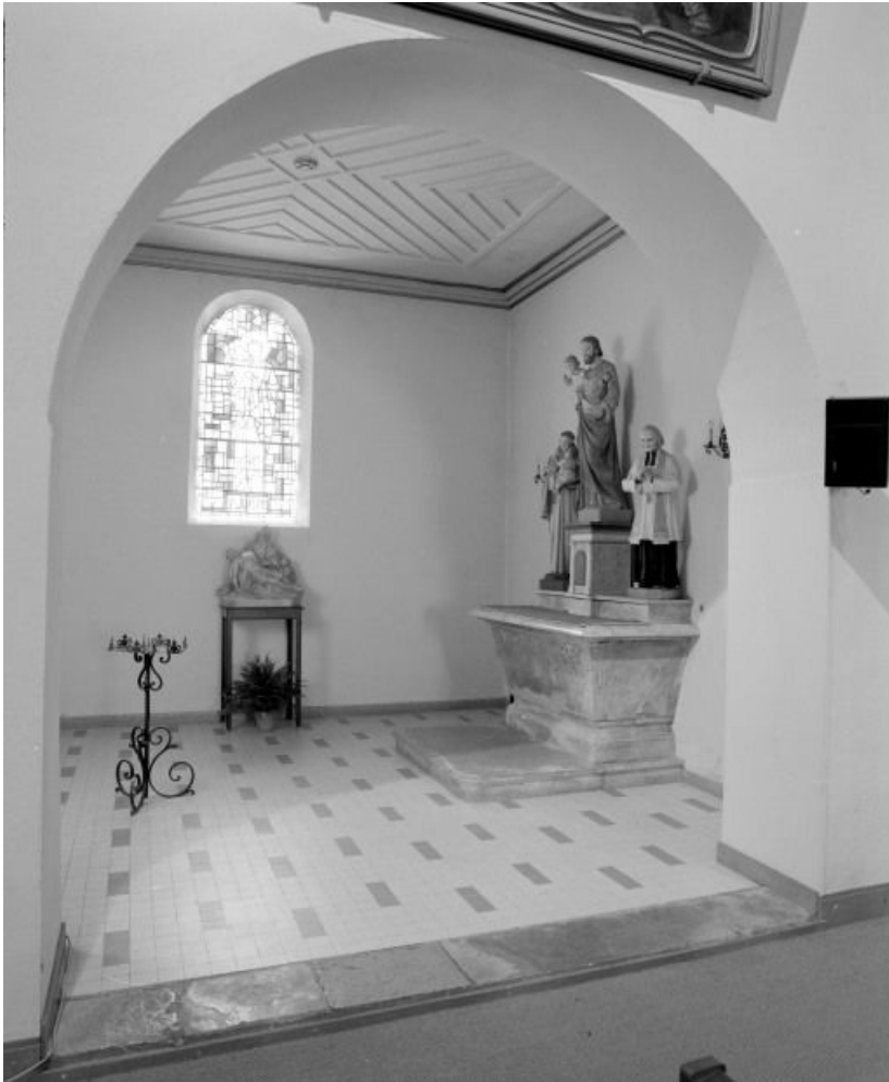
Troisième chapelle gauche.