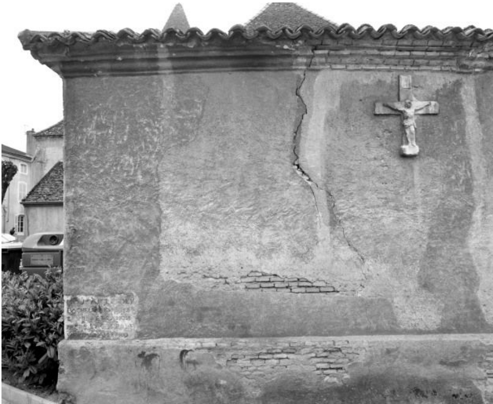
Sacristie, mur postérieur.