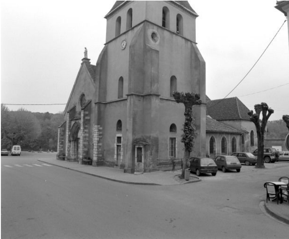
Façade et élévation droite.