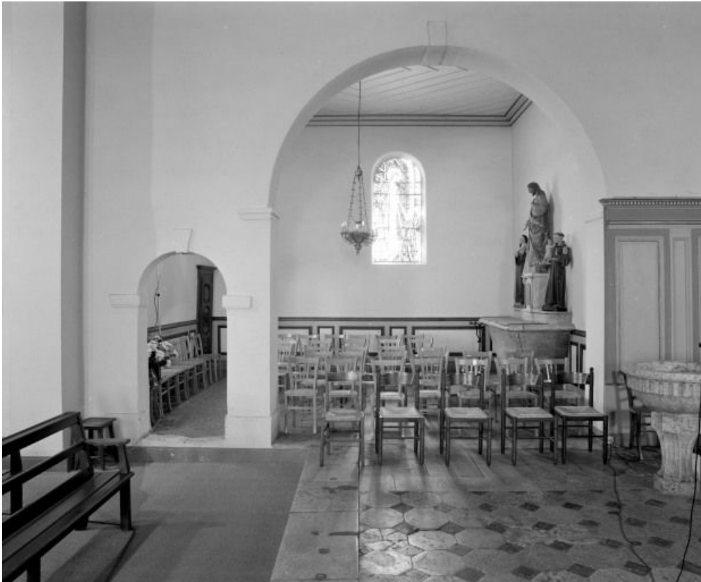
Quatrième chapelle gauche.