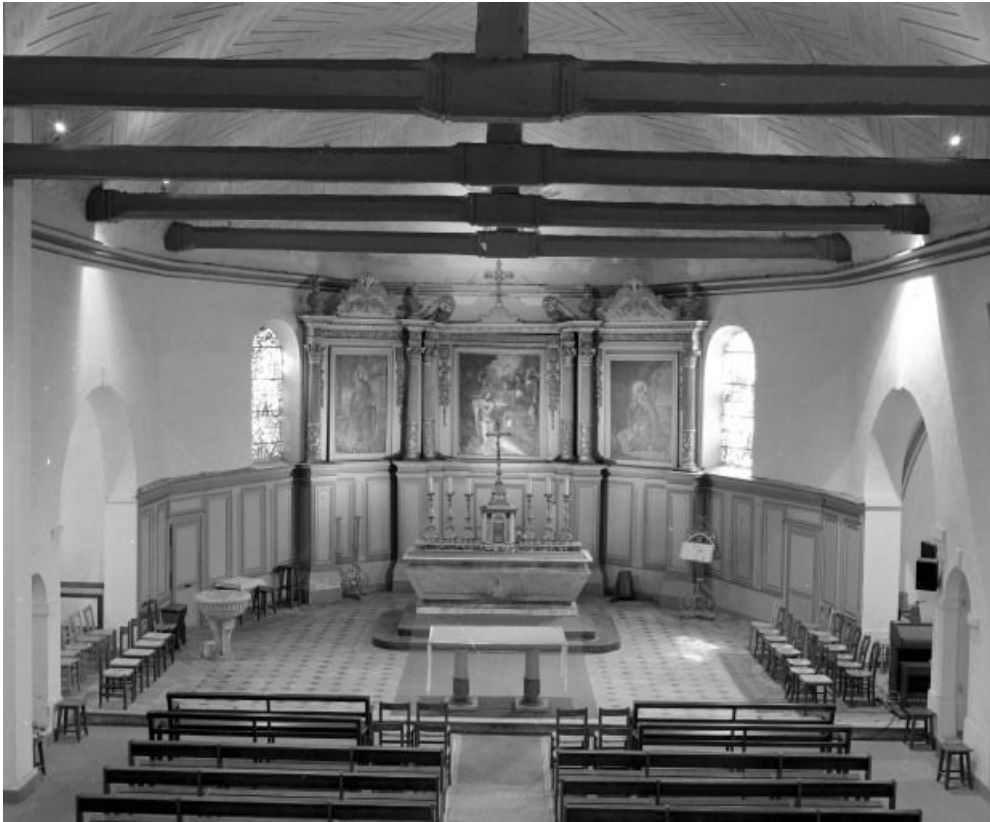
Vue rapprochée du chœur.