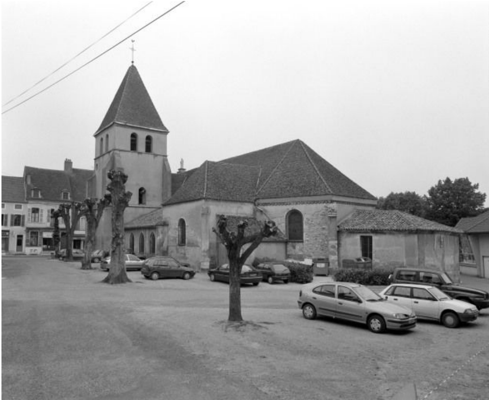
Elévation droite et chevet.