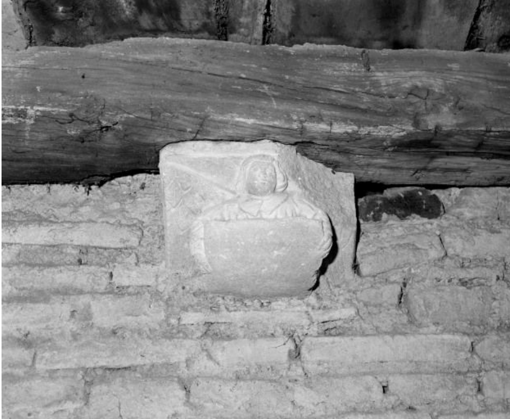
Clocher, 2e niveau : corbeau sculpté.