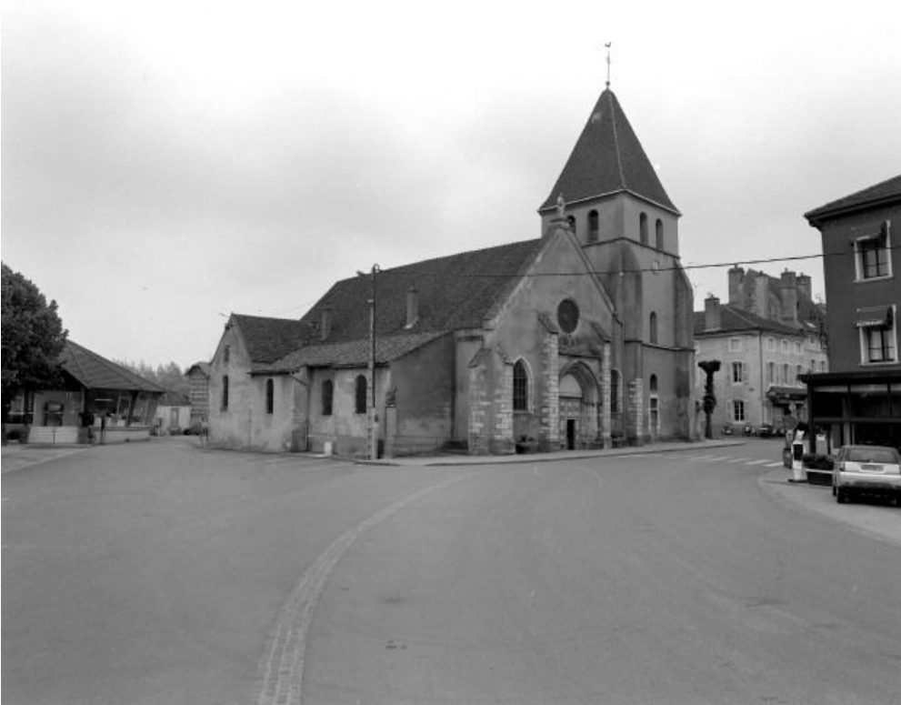
Façade et élévation gauche.