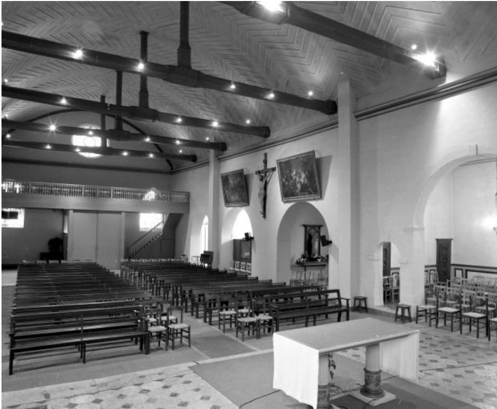
Vue d'ensemble depuis le chœur.