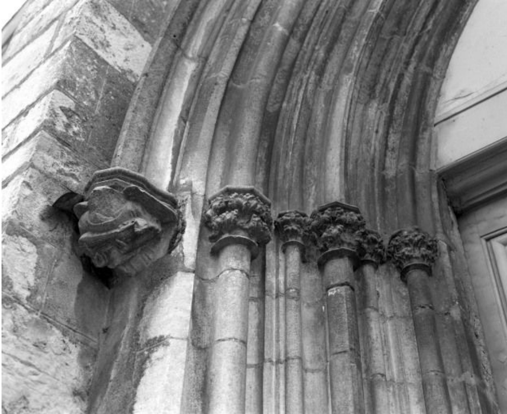
Culot et chapiteaux gauches du portail.