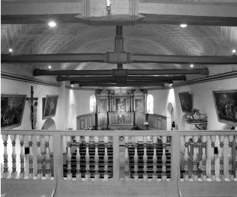
Vue d'ensemble depuis la tribune