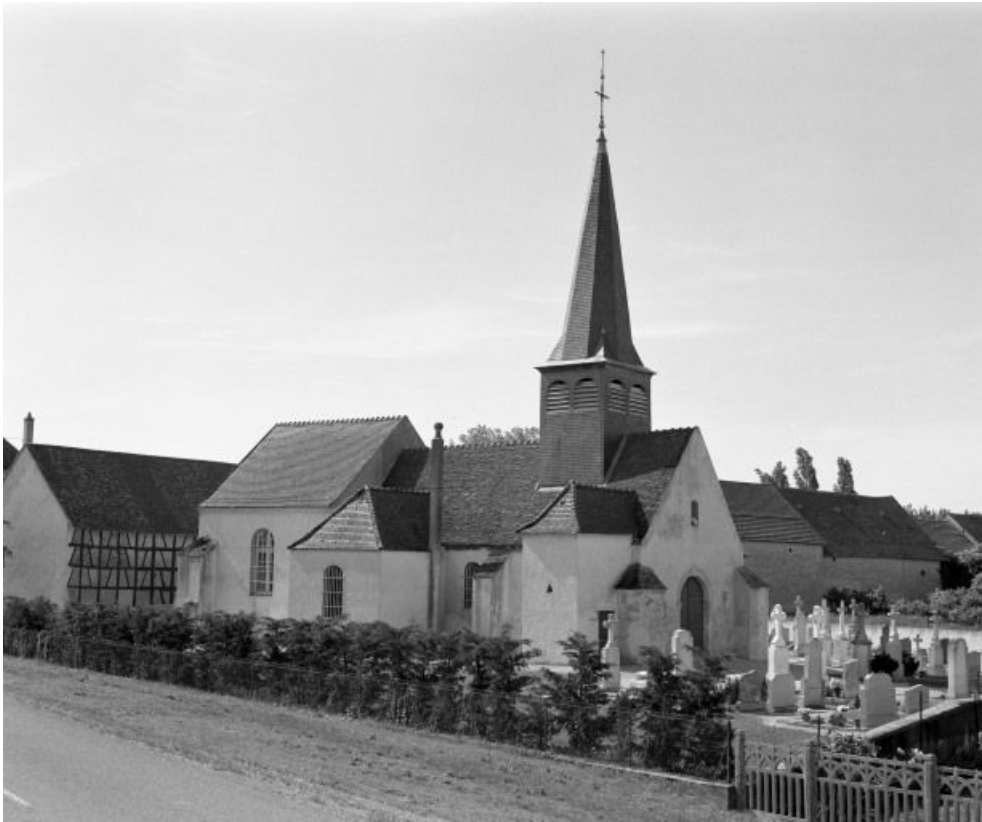
Elévation gauche et façade.