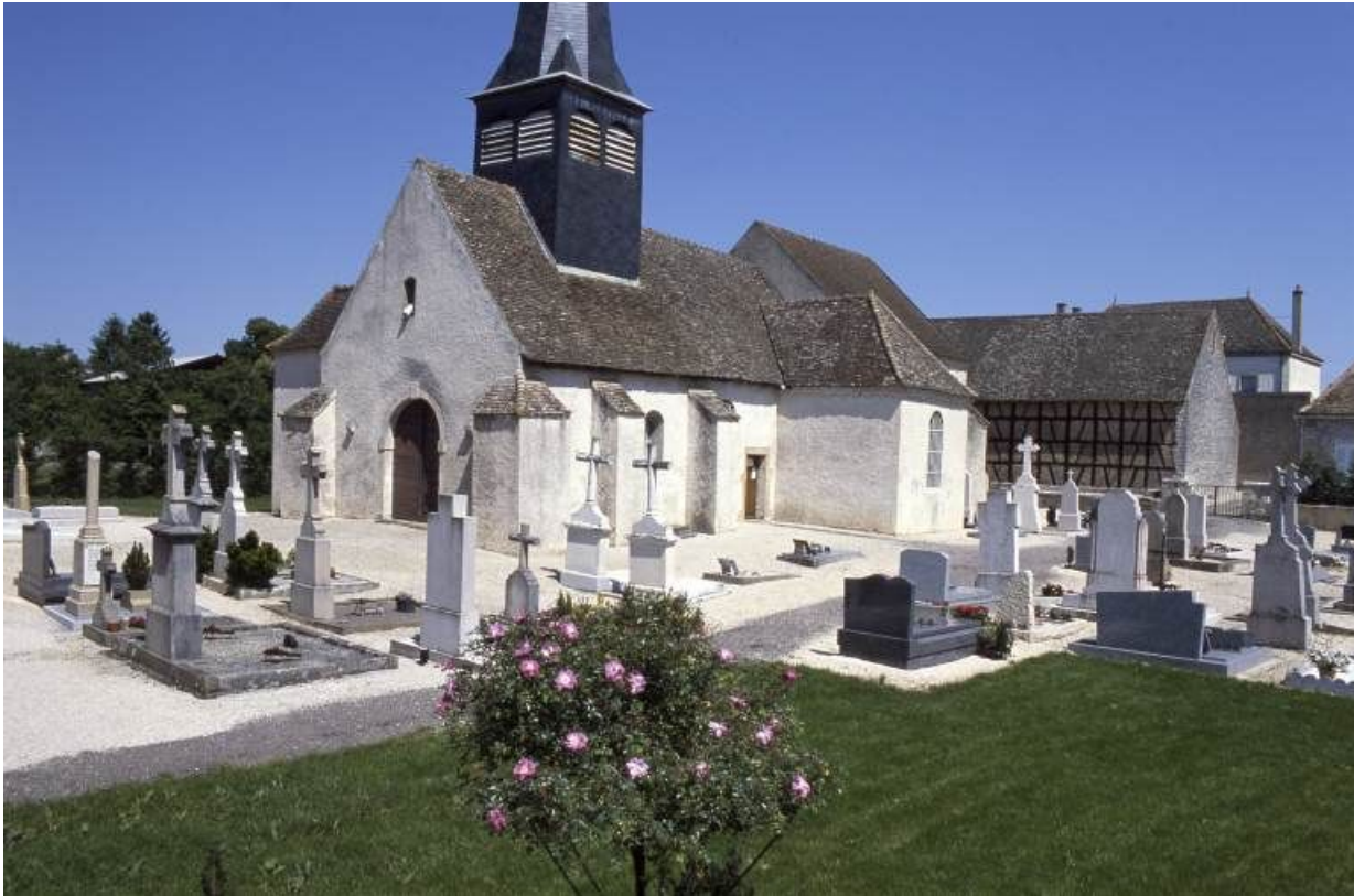
Façade et élévation droite.