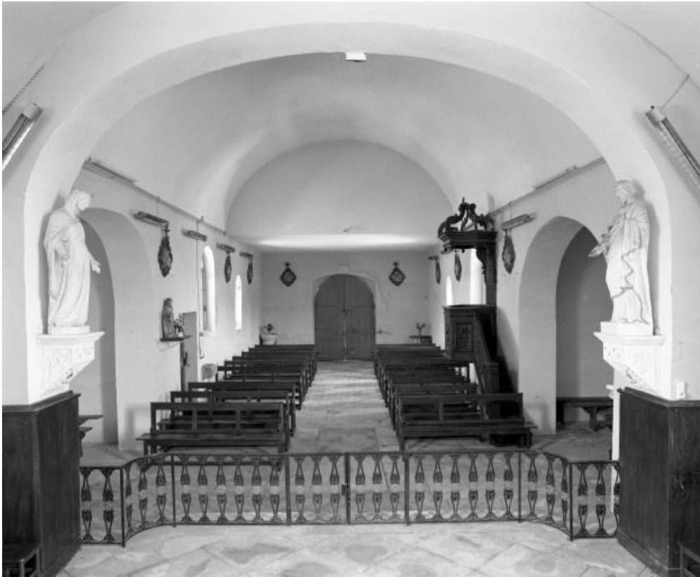
Vue d'ensemble prise du chœur.