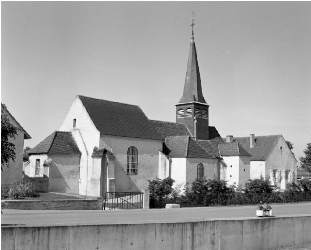
Chevet et élévation gauche.