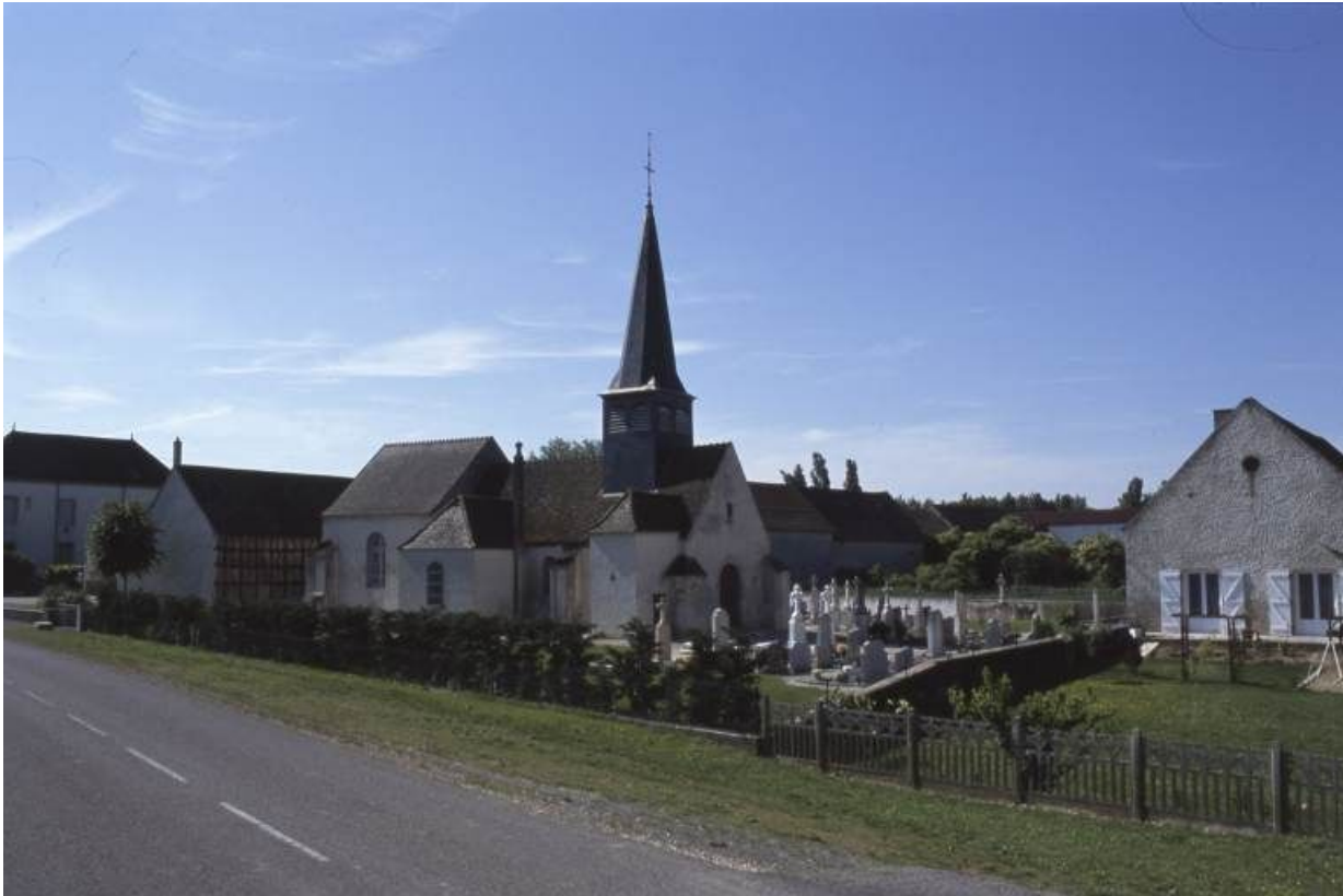
Elévation gauche et façade.