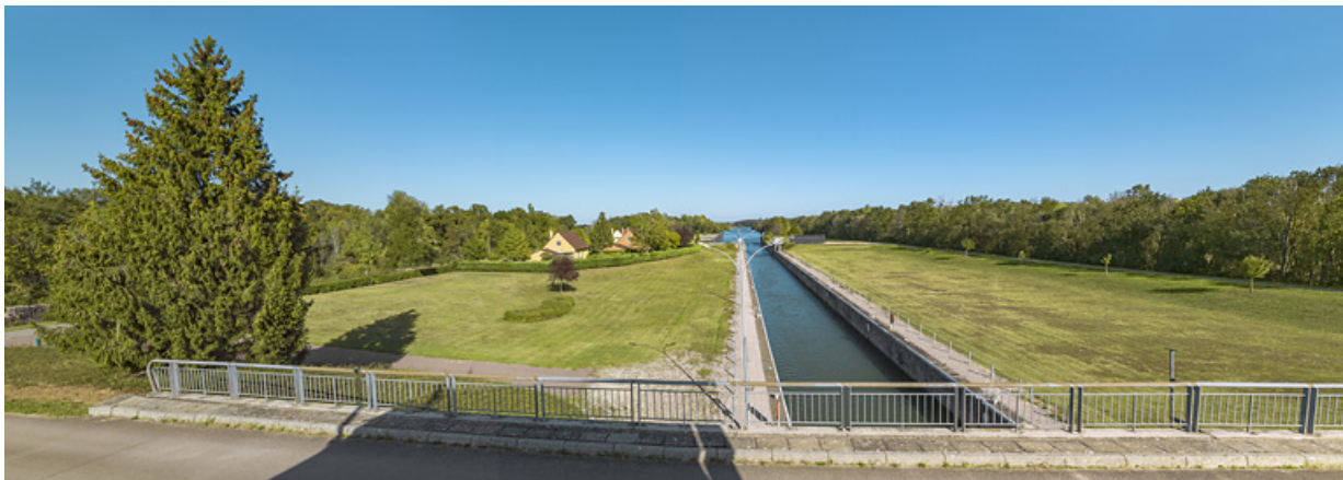
Le sas vu depuis le pont sur écluse.