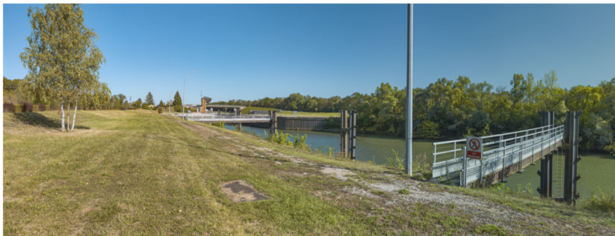
Le site d'écluse vu d'aval.