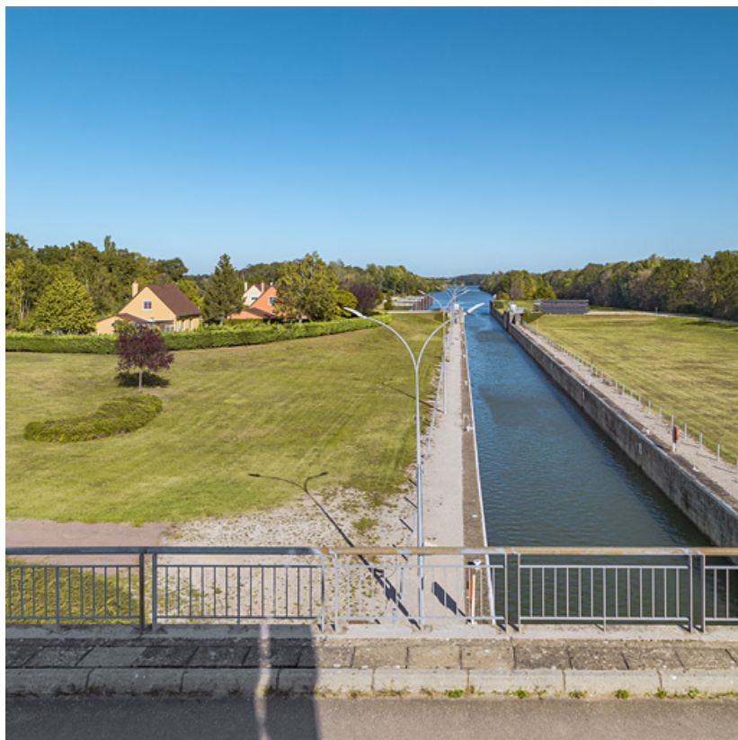
Le sas et le lotissement des employés de VNF, vus depuis le pont sur écluse.