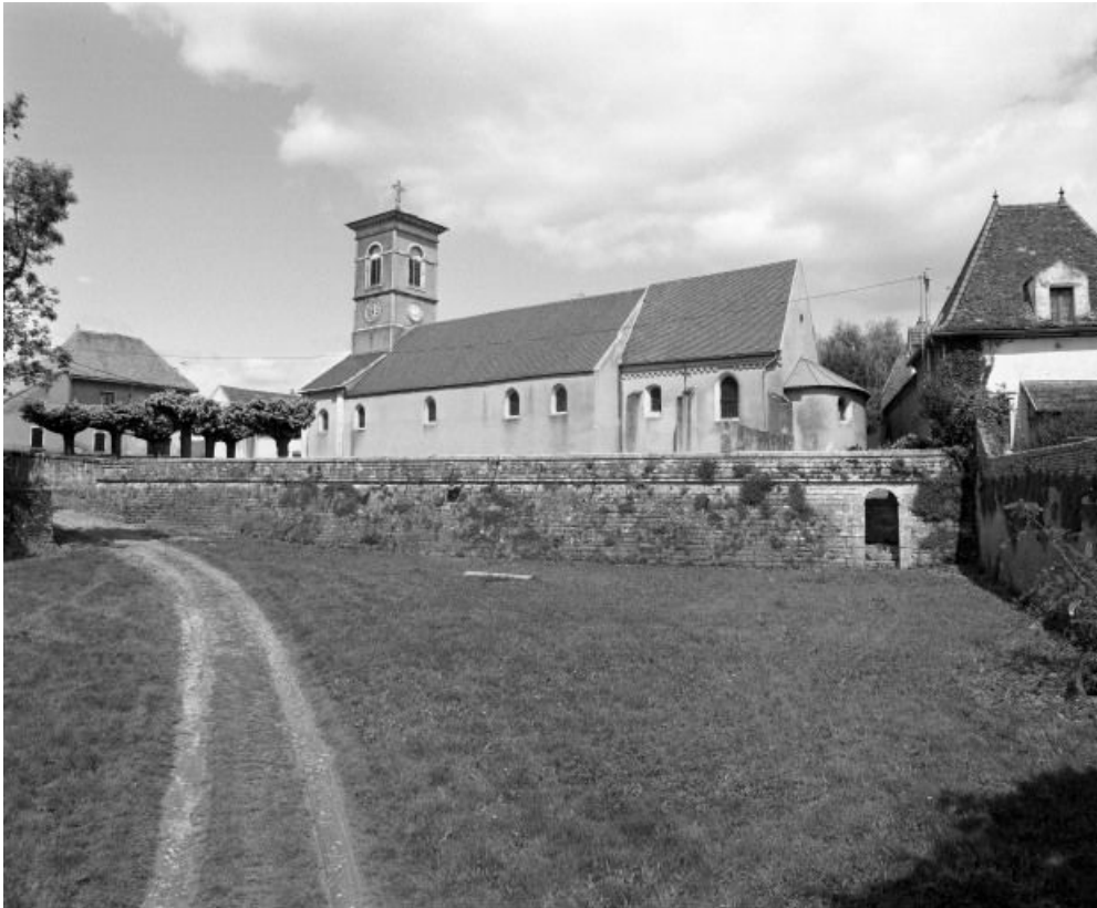
Elévation droite. 71, Écuellen Eglise