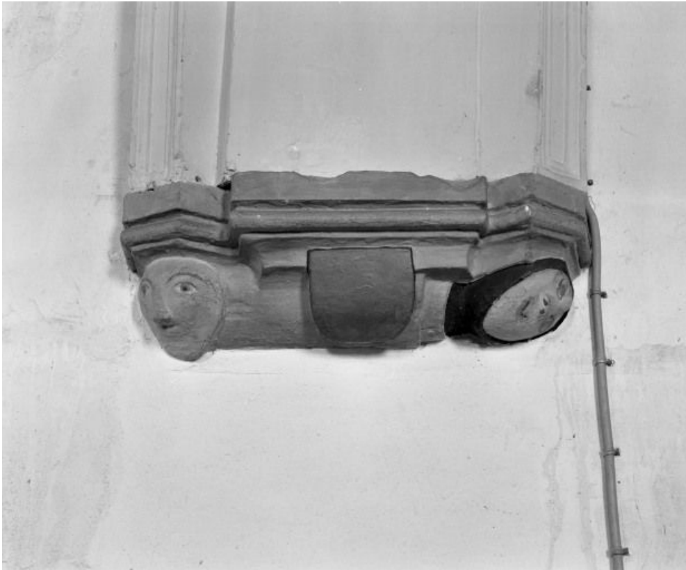
Choeur : culot central gauche.