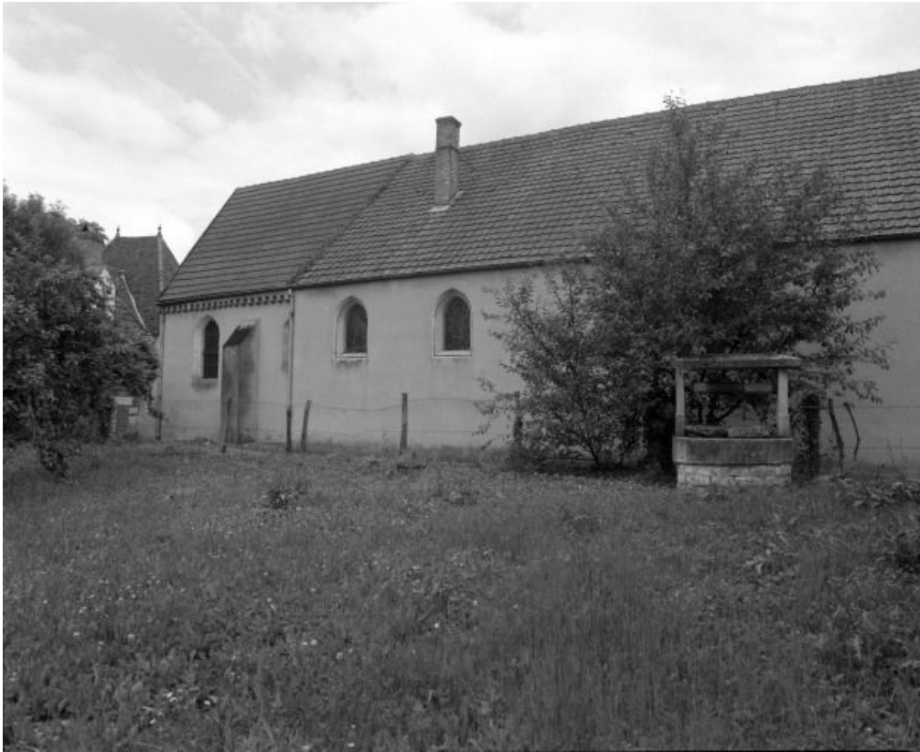
Elévation gauche du choeur et de la nef.