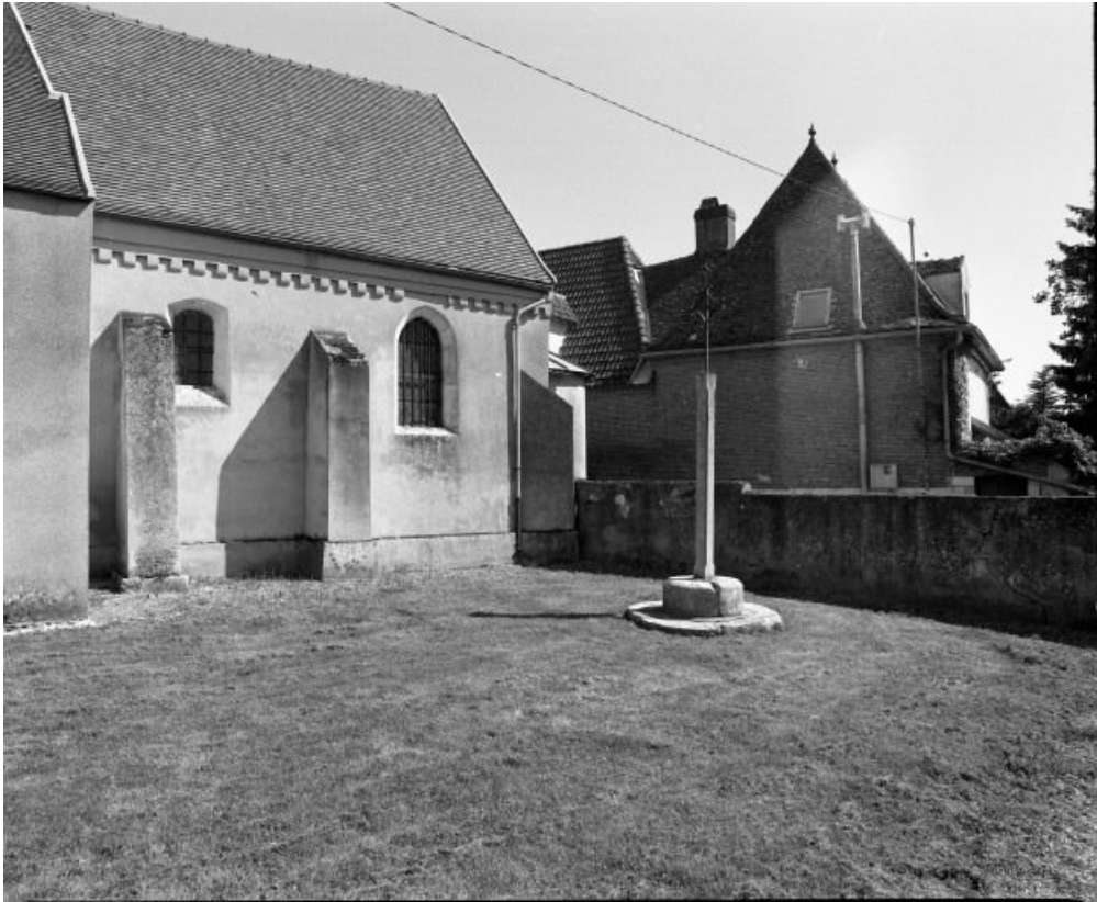
Elévation droite du chœur.