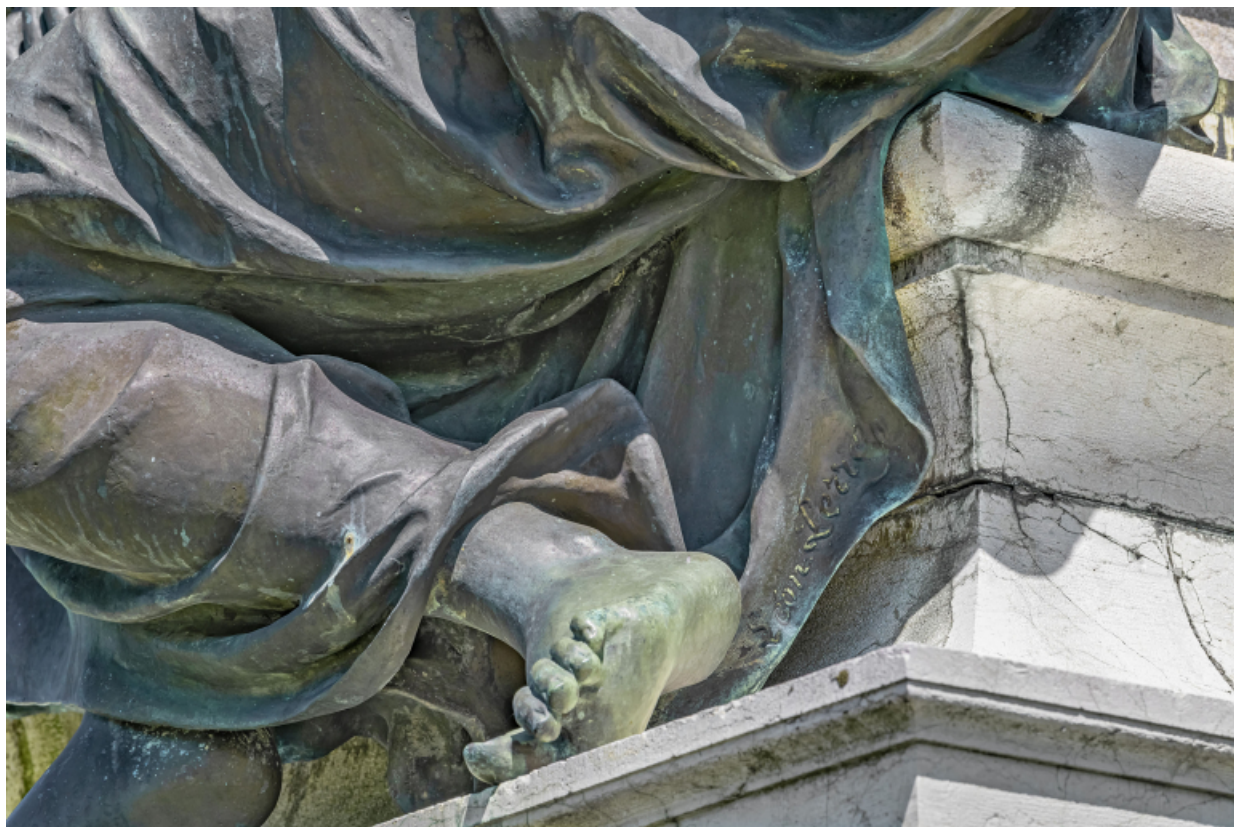
Détail de la signature de Léon Perrey.