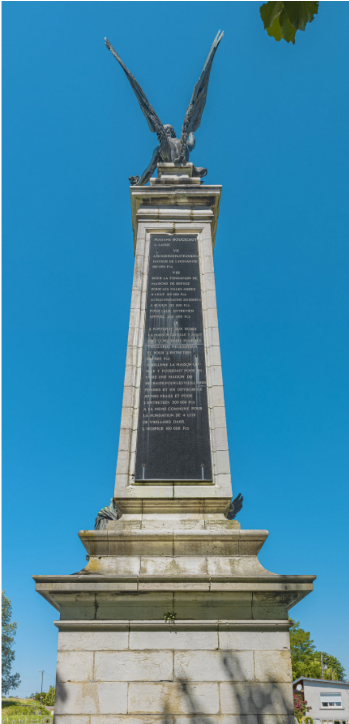
Face postérieure. 71, Verjux R.D. 139