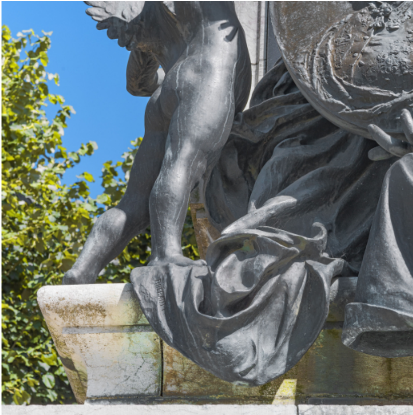
Détail de la signature de Thiébault.