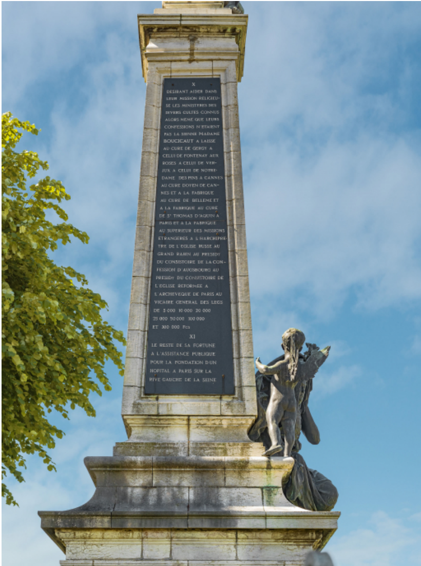
Face gauche. 71, Verjux R.D. 139