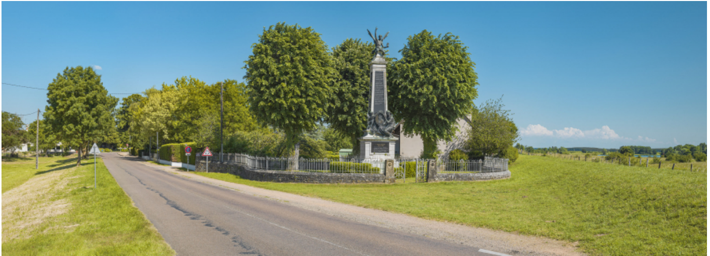
Vue d'ensemble du monument à l'entrée du village.