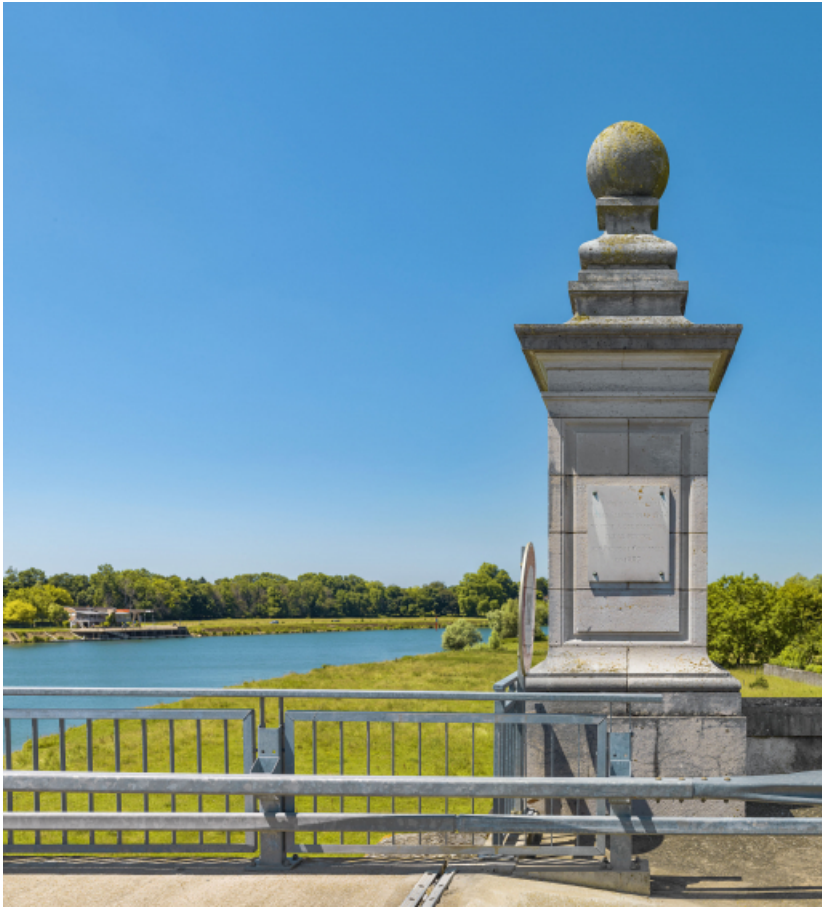
Détail d'une "borne" d'entrée du pont et de la plaque commémorative.