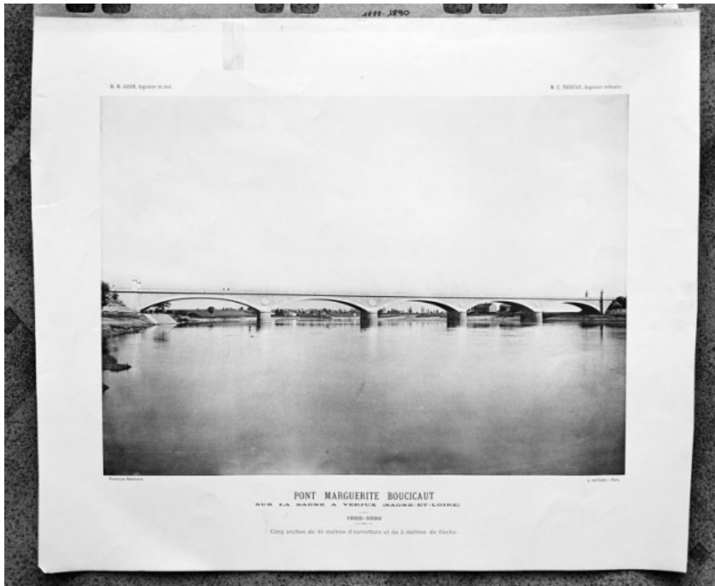
PONT MARGUERITE BOUCICAUD / sur la Saône à Verjux (Saône-et-Loire) / 1888-1890 / cinq arches de 40 mètres d'ouverture et de 5 mètres de flèche..