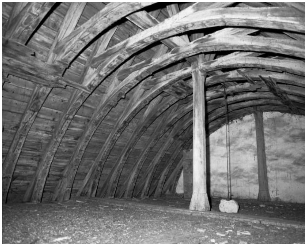
Comble du choeur, partie gauche.