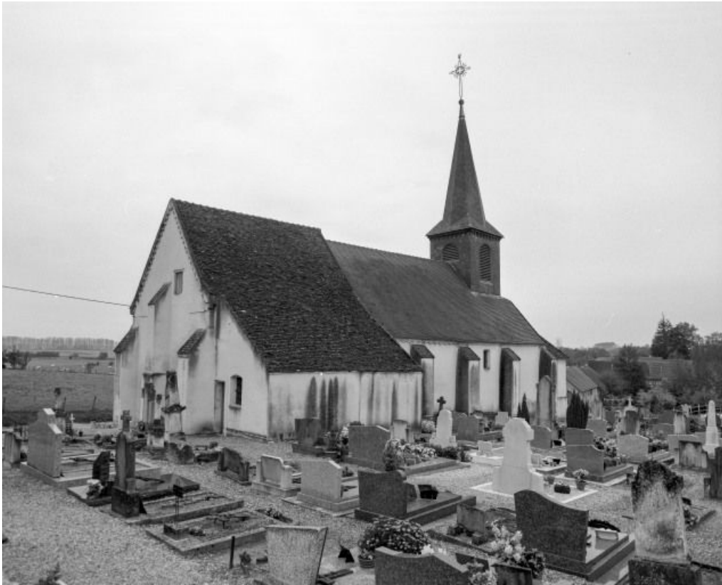
Chevet et élévation gauche.