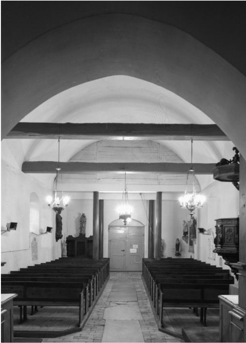
Vue d'ensemble depuis le chœur.