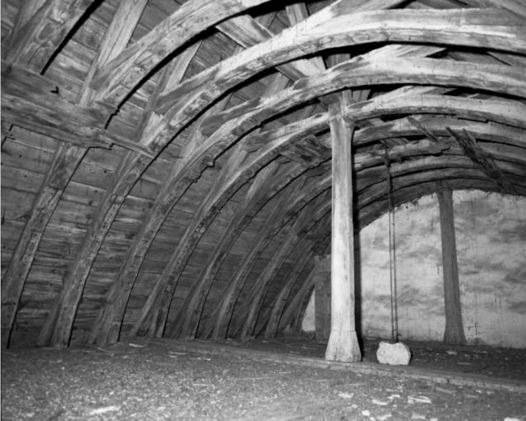
Comble du chœur, partie gauche.