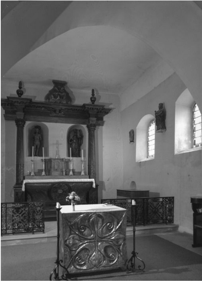
Vue rapprochée du chœur.