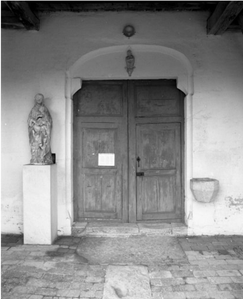
Porche, portail de la nef.