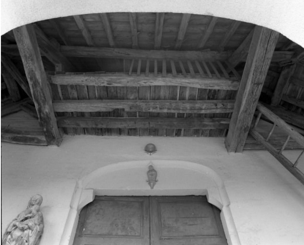
Porche, galerie permettant l'accès au clocher.