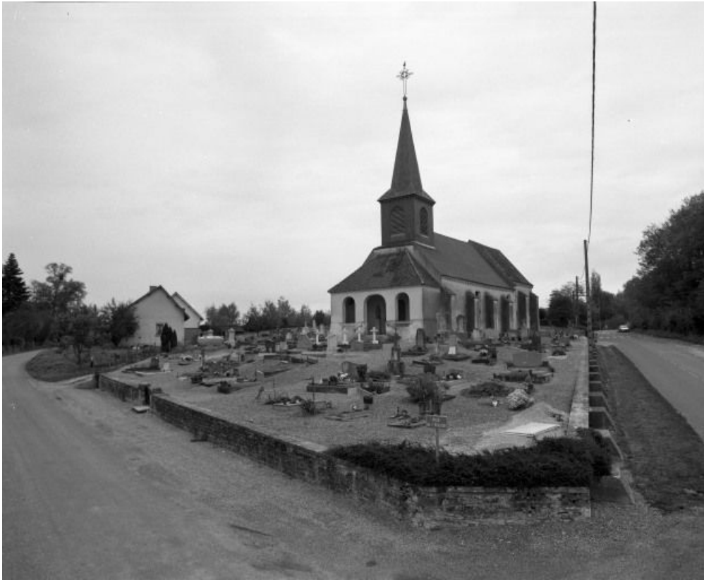
Vue d'ensemble, façade et élévation droite.