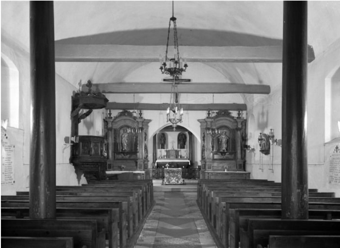
Vue d'ensemble depuis l'entrée.