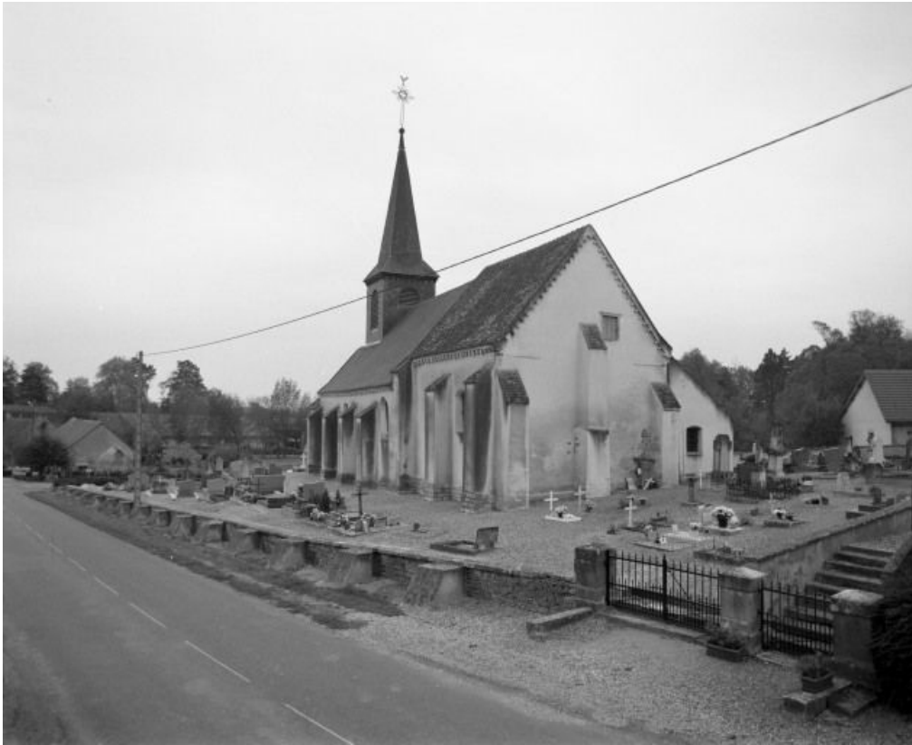
Elévation droite et chevet.