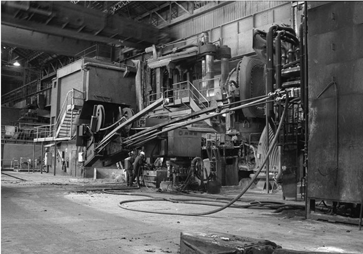
Le four électrique de 100 tonnes en activité.