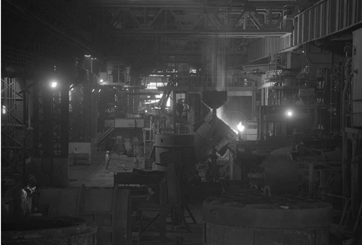
La halle de coulée.