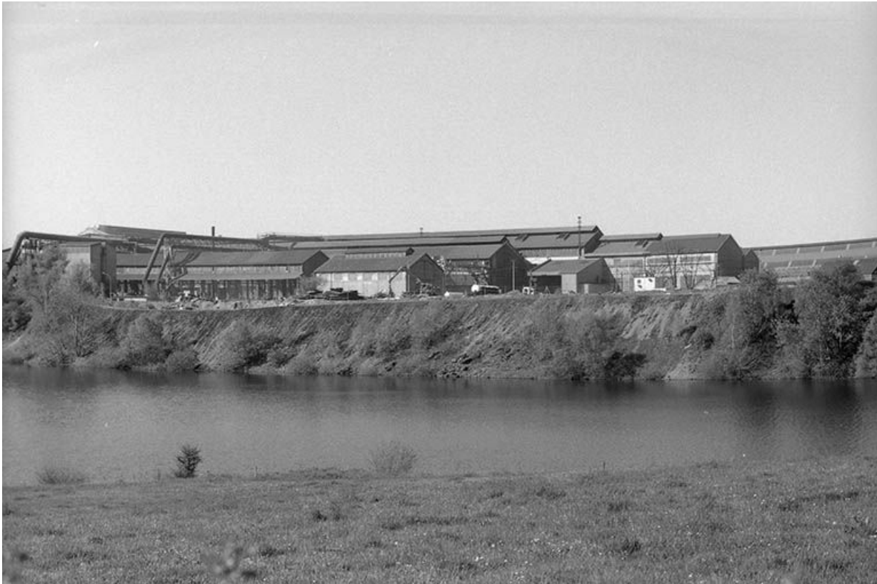
Vue de l'aciérie depuis le nord-est.