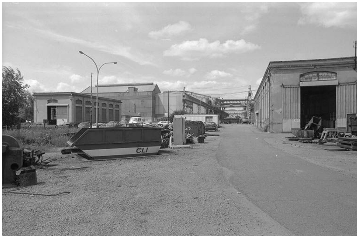
A gauche l'ancienne sous-station électrique, au fond l'aciérie (le bâtiment le plus élevé est celui de la coulée sous pression), à droite l'atelier d'entretien.