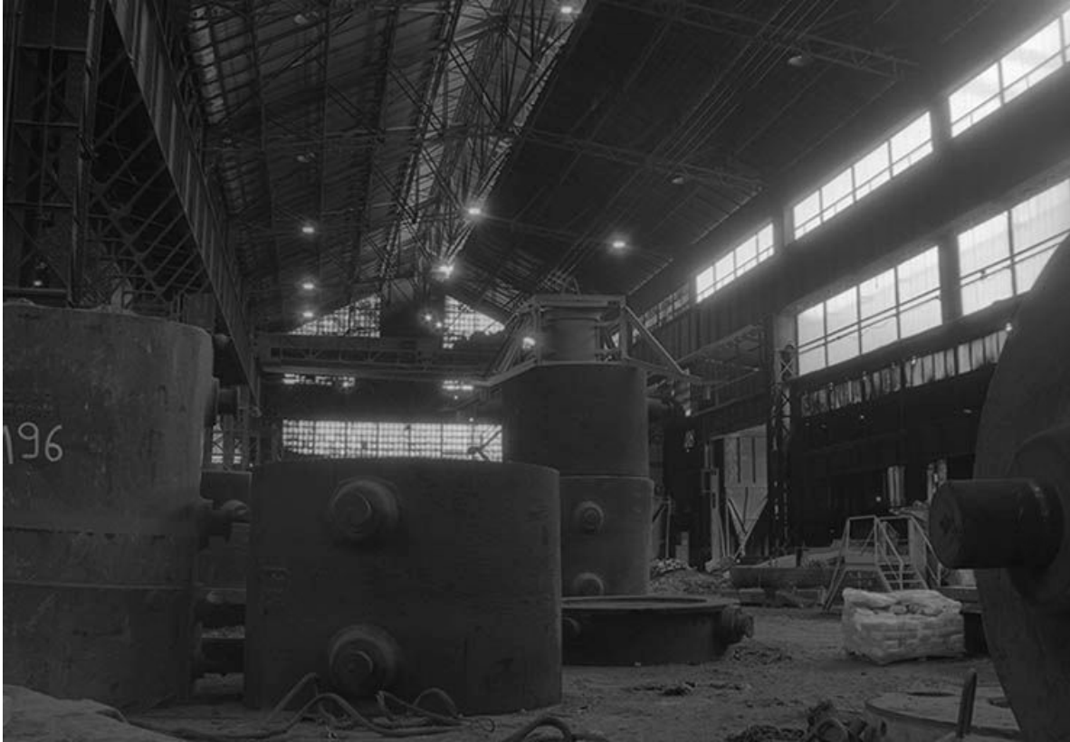
Extrémité nord de la halle des fours.