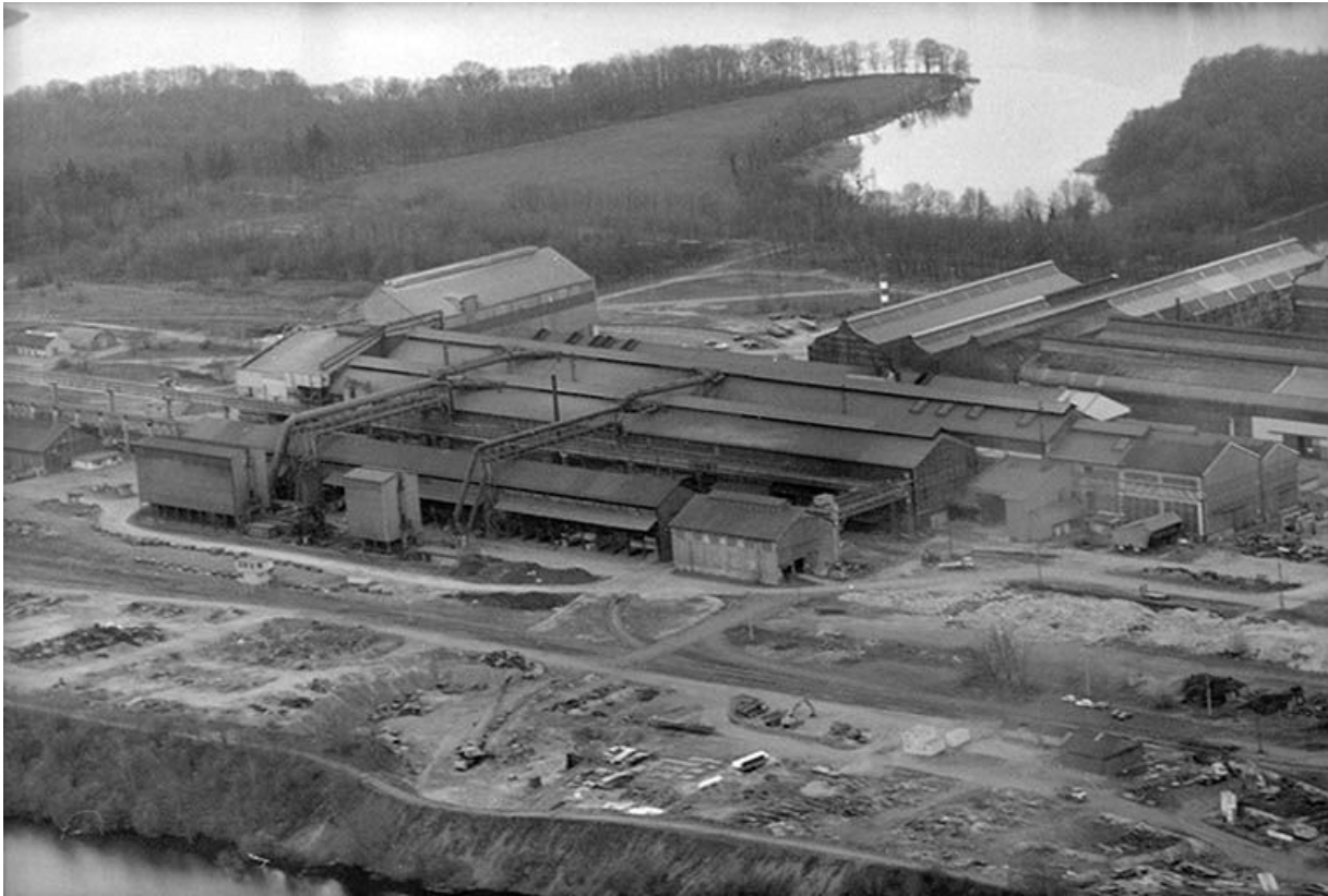
Vue aérienne de l'aciérie depuis le nord-est.