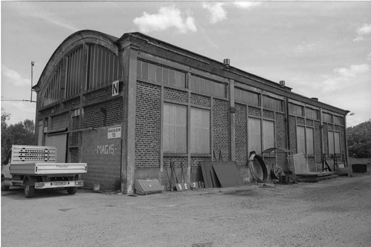
Ancien hangar des locomotives.