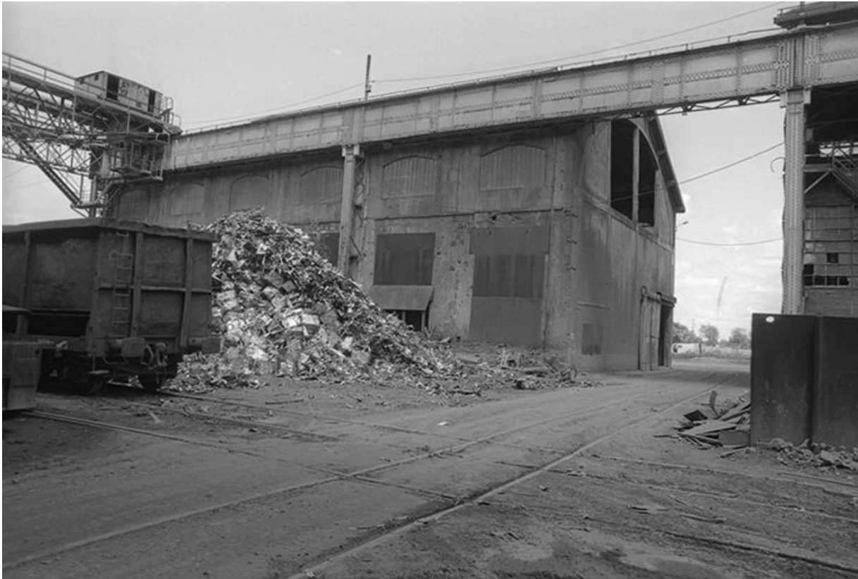
L'ancien atelier dolomitique, vue depuis le parc à riblons.