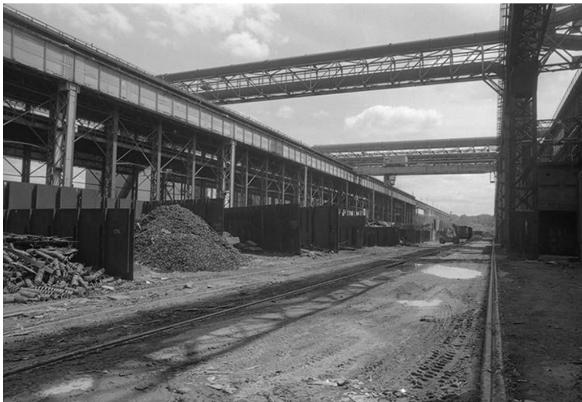
De gauche à droite, l'ancienne halle des gazogènes, le parc à riblons et la halle des fours.