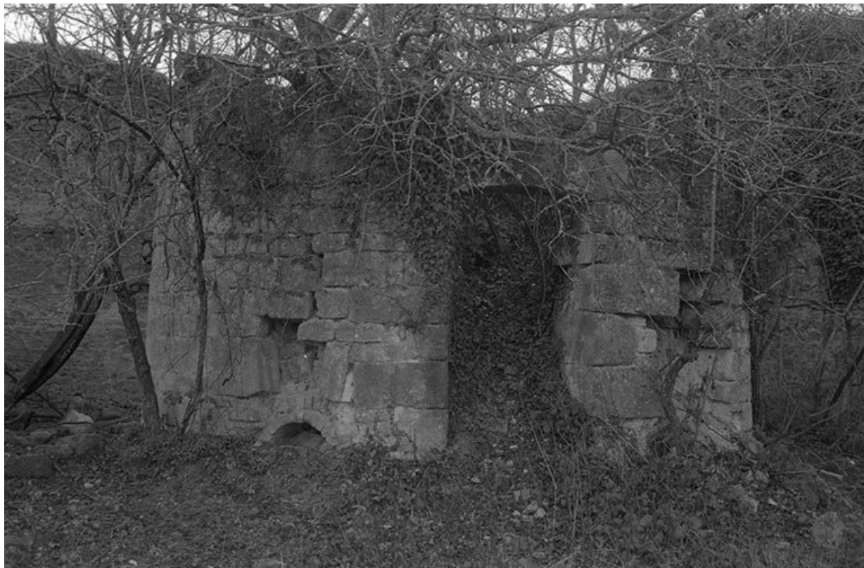
Four est de l'usine de céramique du Pont-du-Four.