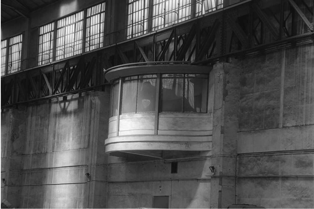
Le poste de contrôle de la salle des machines, installé dans le bâtiment des tableaux de distribution.

71, Montceau-les-Mines, 20 quai de Moulins