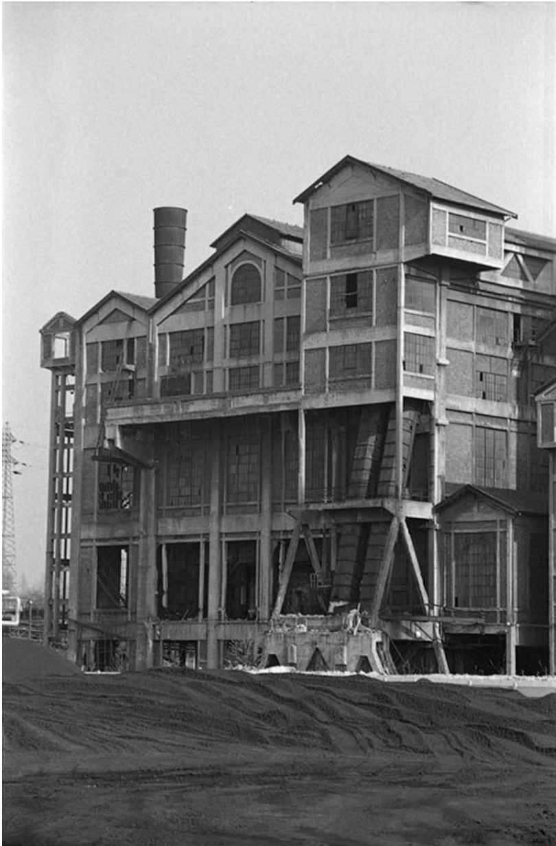
La chaufferie de Lucy II construite en 1923-1924, pignons sud.

71, Montceau-les-Mines, 20 quai de Moulins