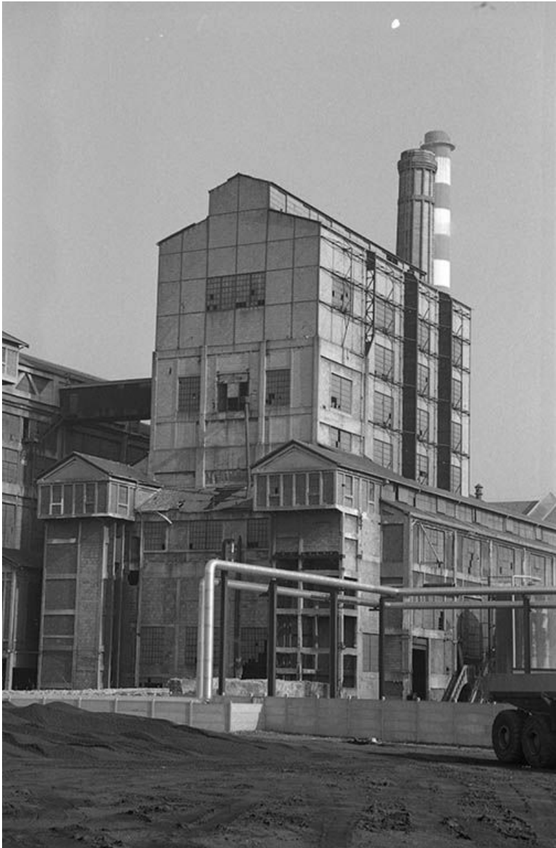
La chaufferie de Lucy II construite en 1919-1920 et son extension, pignons sud. 71, Montceau-les-Mines, 20 quai de Moulins