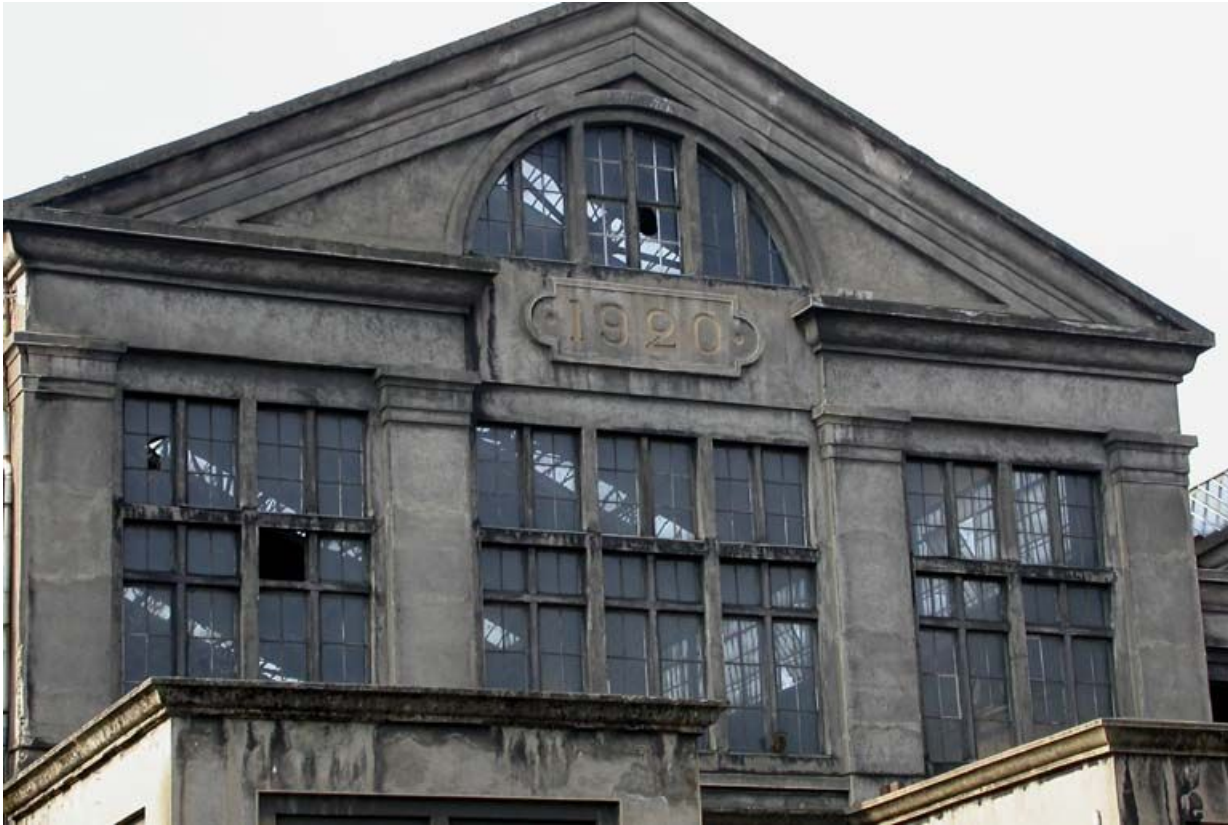
Élévation principale du bâtiments des alternateurs, détail.

71, Montceau-les-Mines, 20 quai de Moulins