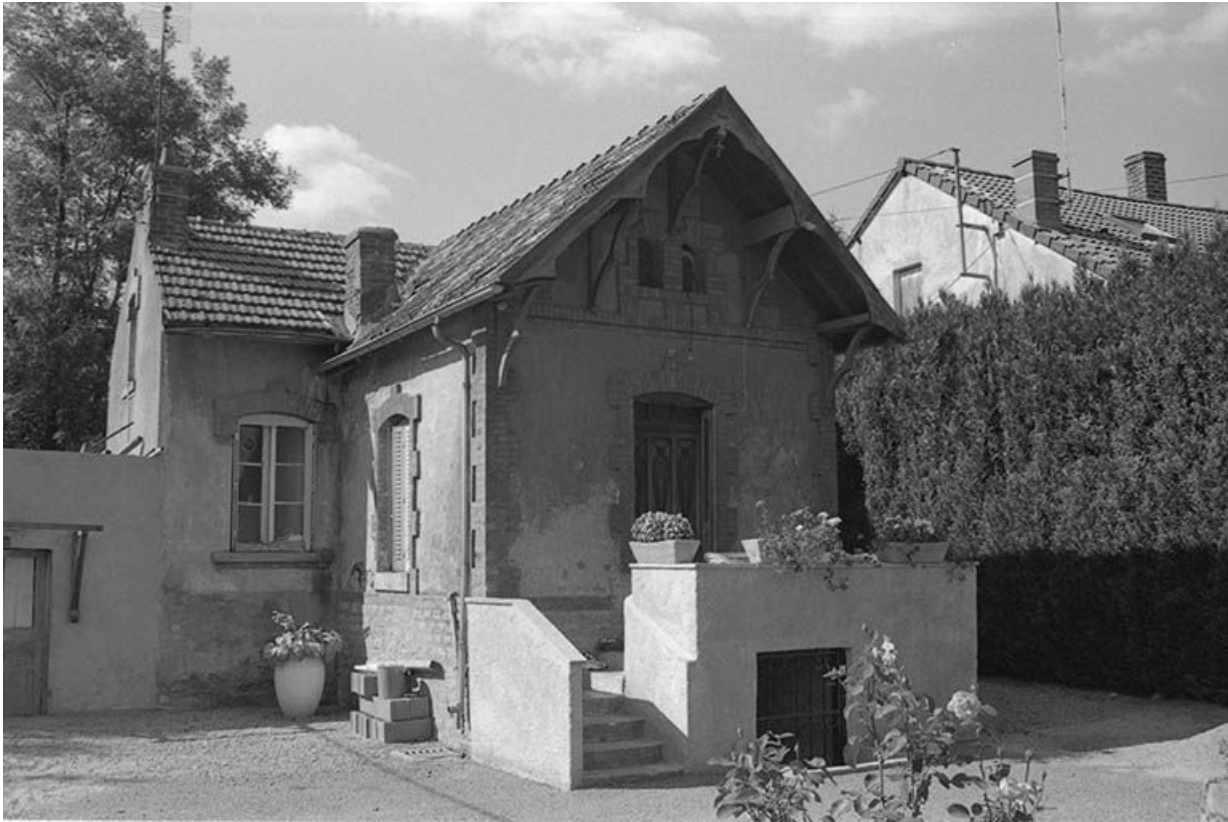
Anciens bureaux (?) vus du Sud Est, façade antérieure. 71, Blanzly, 31-49 route de Montchanin, lieudit : les Angliers