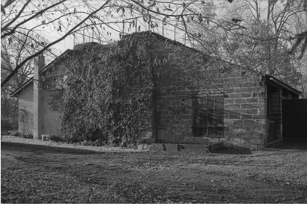
Fours à chaux vus du sud-est.

71, Ciry-le-Noble rue du 11 Novembre 1918, lieudit : le Bassin