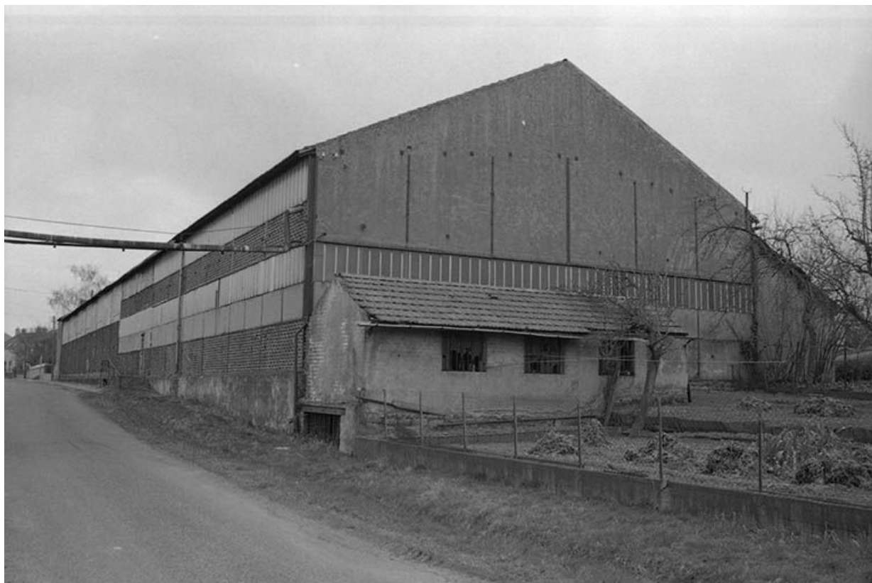
Ancienne chaudronnerie Prudhon acquise par les Ateliers de Constructions Mécaniques Aillot en 1937-39. 71, Montceau-les-Mines, 2 rue de Gilly