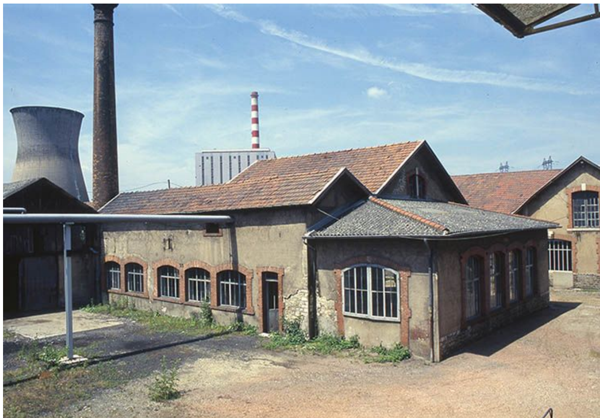
Façade postérieure de l'atelier de montage.