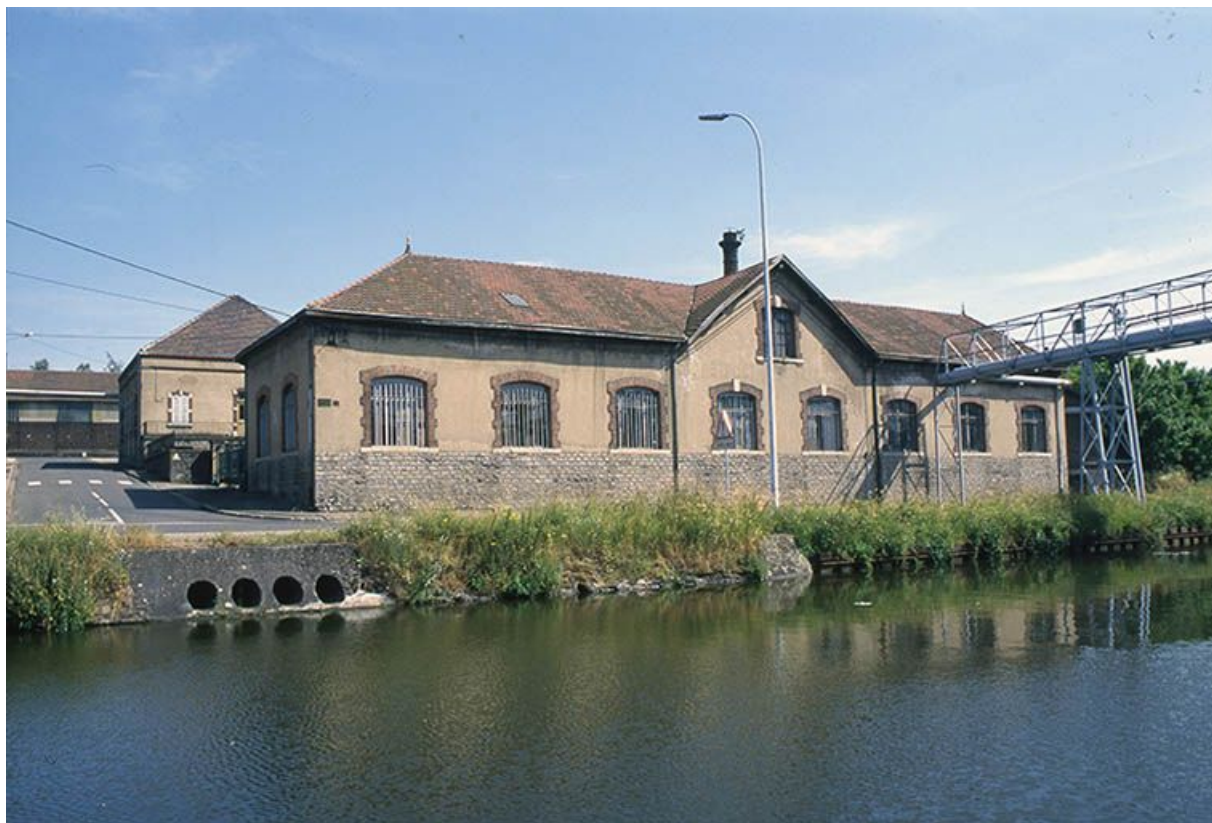
Façade postérieure de l'atelier d'ajustage et de tournage vue depuis les quais. 71, Montceau-les-Mines, 2 rue de Gilly