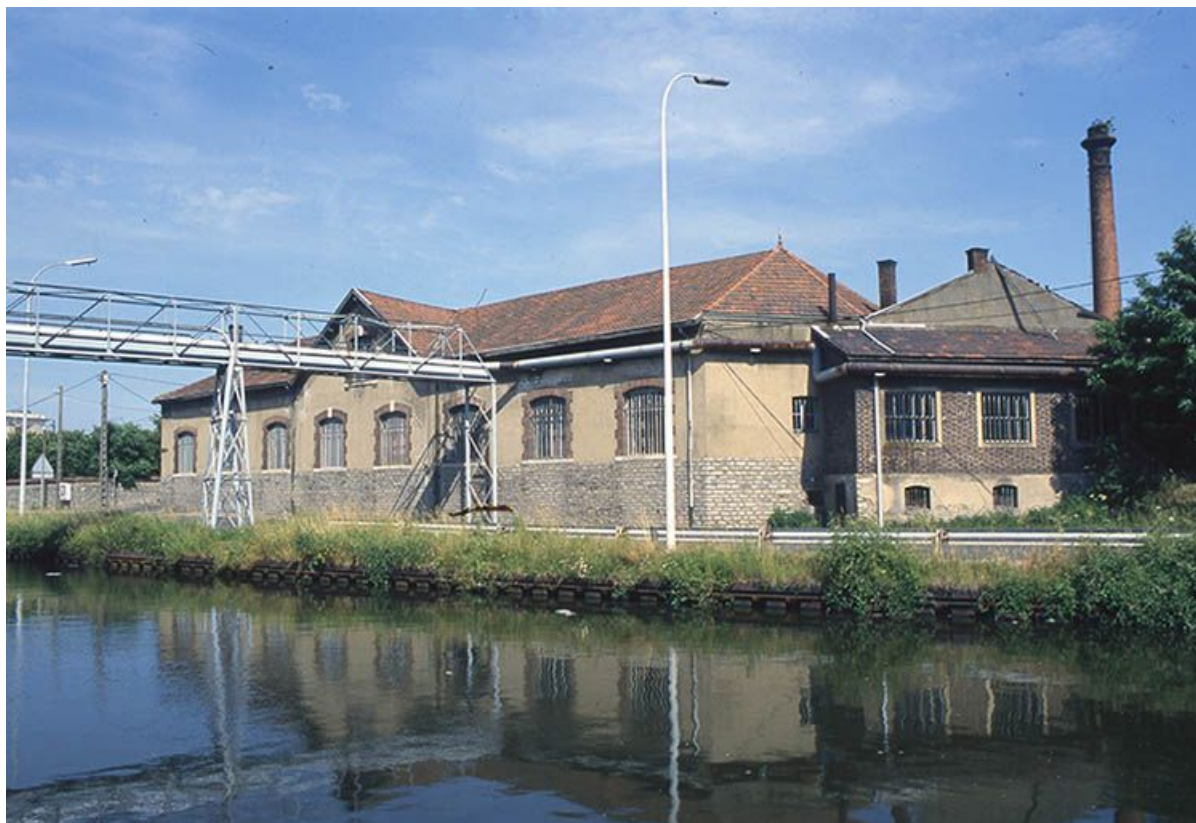
Façade postérieure de l'atelier d'ajustage et de tournage vue depuis les quais. 71, Montceau-les-Mines, 2 rue de Gilly