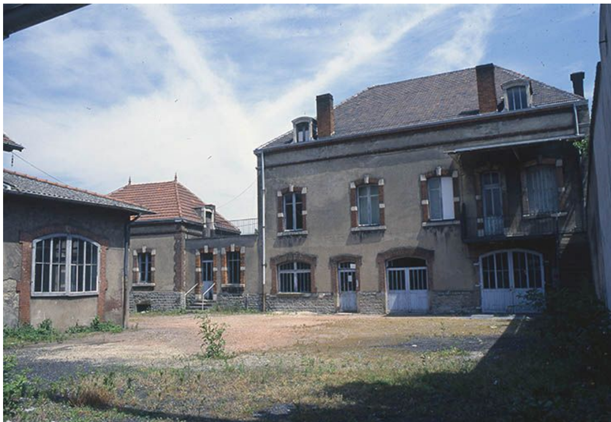
Bureaux (à droite, façade antérieure de l'ancien logement du directeur). 71, Montceau-les-Mines, 2 rue de Gilly