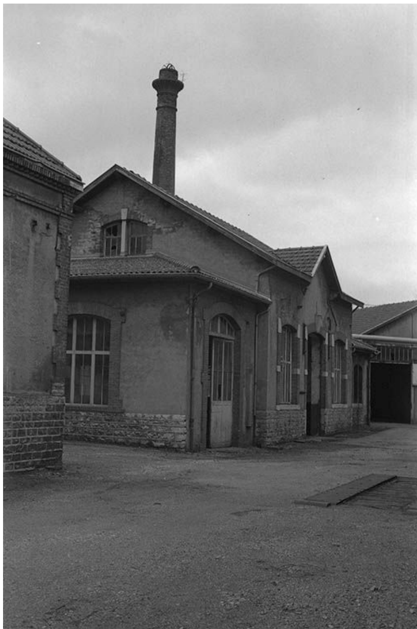
Façade antérieure de l'atelier de montage.