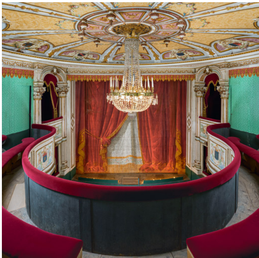
Salle : balcon, vu vers la scène.