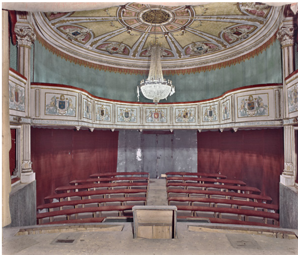
Salle vue depuis la scène.