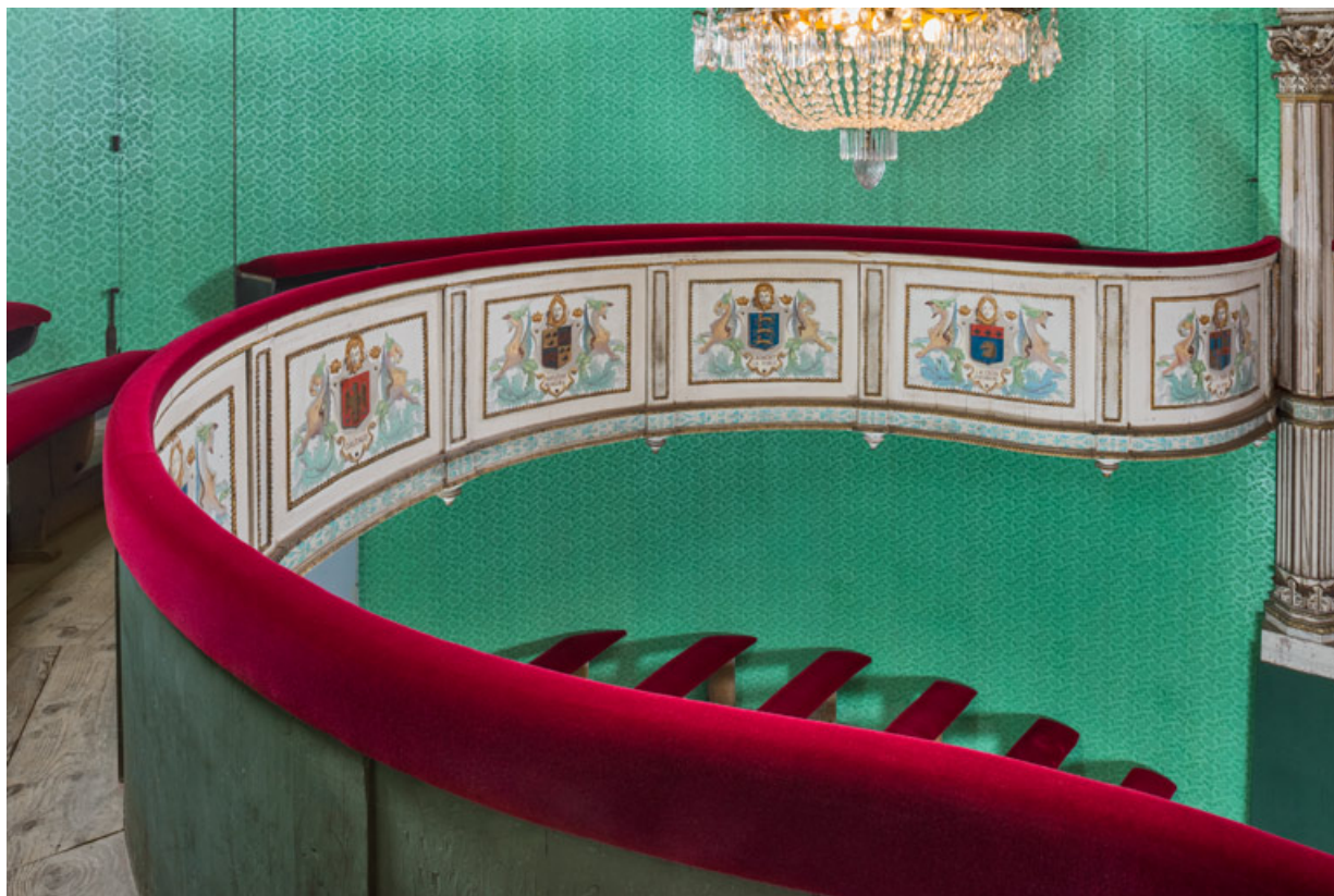
Salle : le balcon, vu de trois quart.