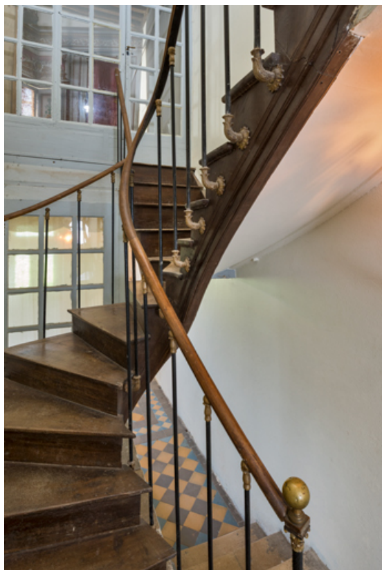
Couloir : escalier menant au balcon (volée de droite) et à une pièce côté rue (à gauche). 71, Palignes, lieudit : Digoine