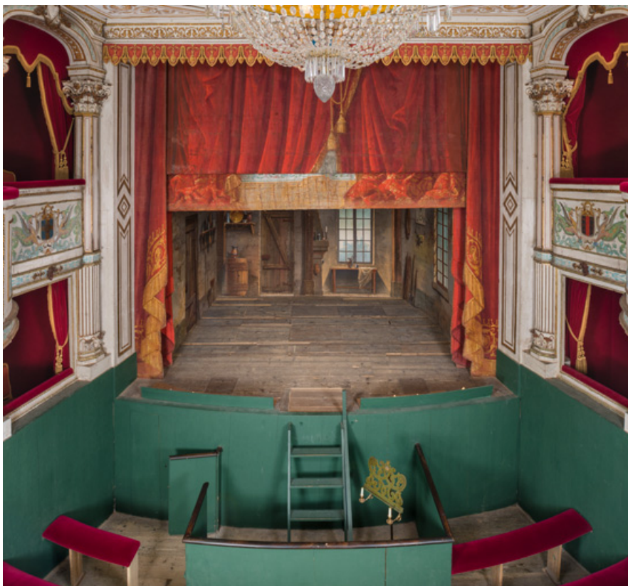
Salle, vue vers la scène depuis le balcon.