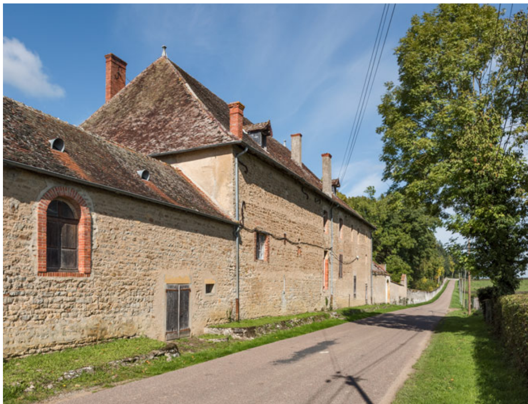
Façade postérieure (côté route), de trois quarts gauche.