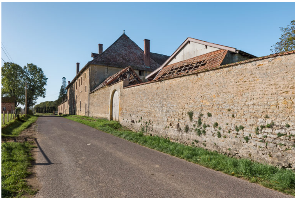
Dépendances, vues de la route au nord.