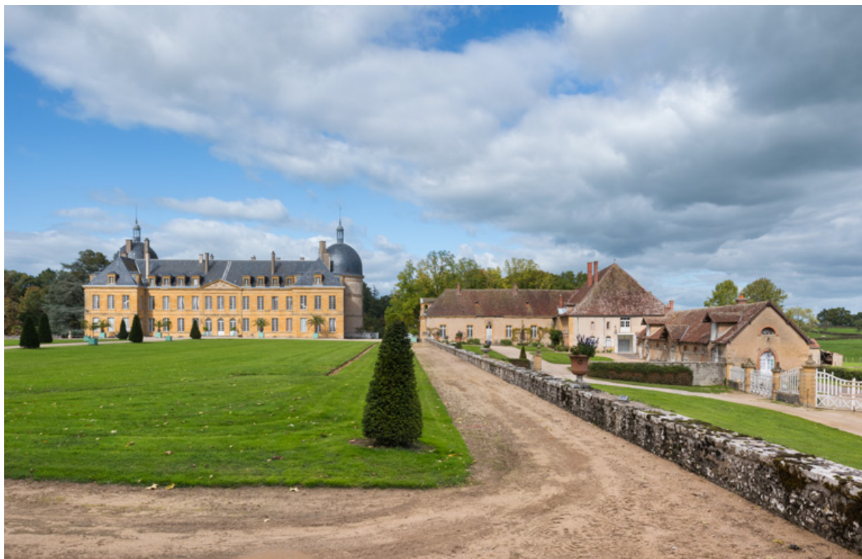
Vue d'ensemble du château de Digoine et de ses dépendances, depuis le sud.