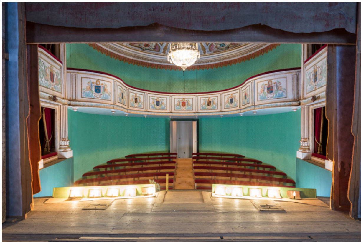
Salle, vue depuis la scène. 71, Palignes, lieudit : Digoine