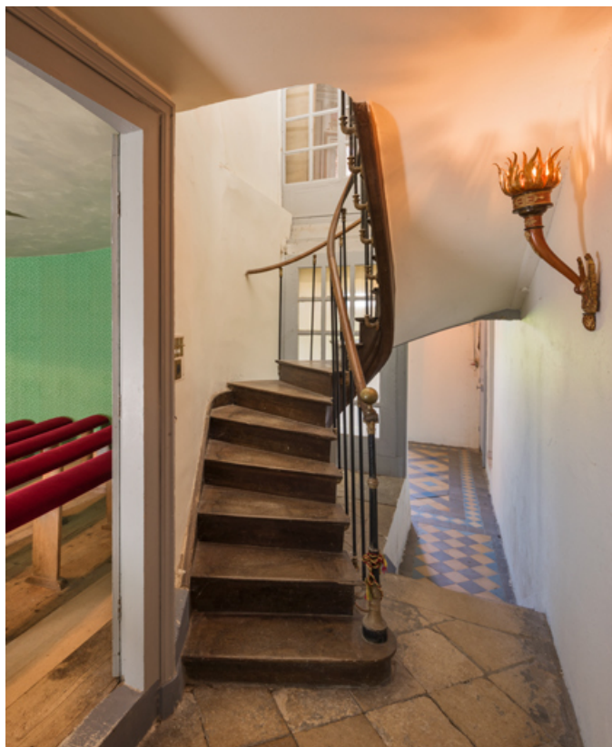
Couloir : accès à la salle (à gauche) et escalier menant au balcon. 71, Palignes, lieudit : Digoine