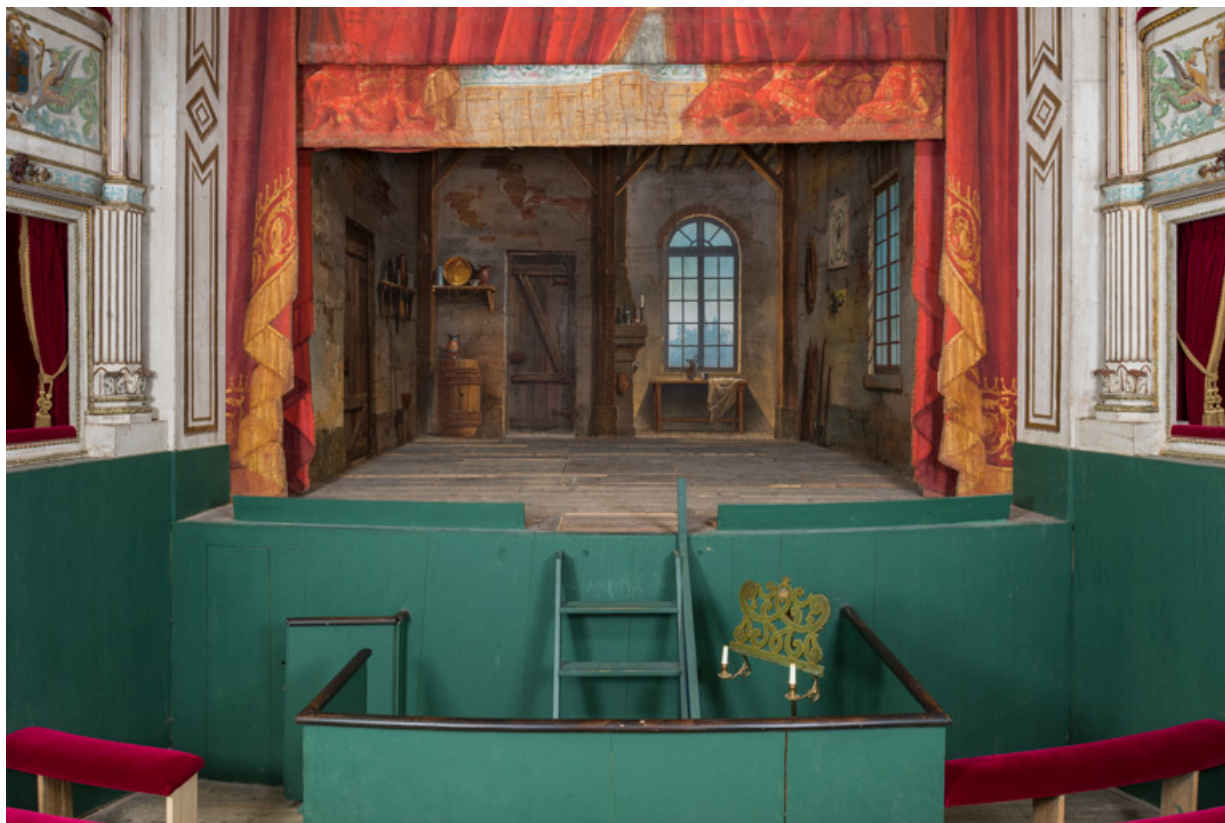
Salle, vue vers la scène : fosse d'orchestre, scène et décor scénique. 71, Palignes, lieudit : Digoine