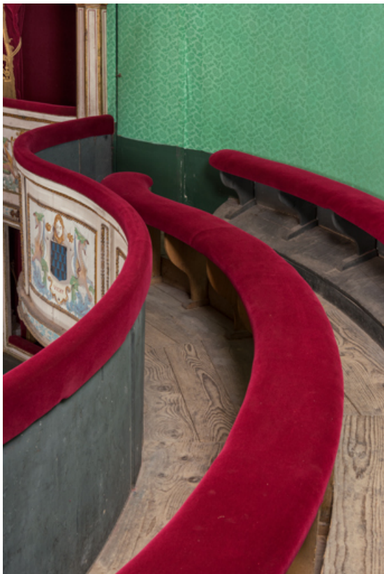
Salle : banquettes du balcon côté cour.