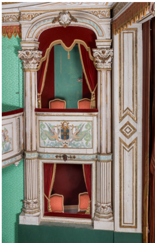
Salle : loges d'avant-scène, côté jardin.