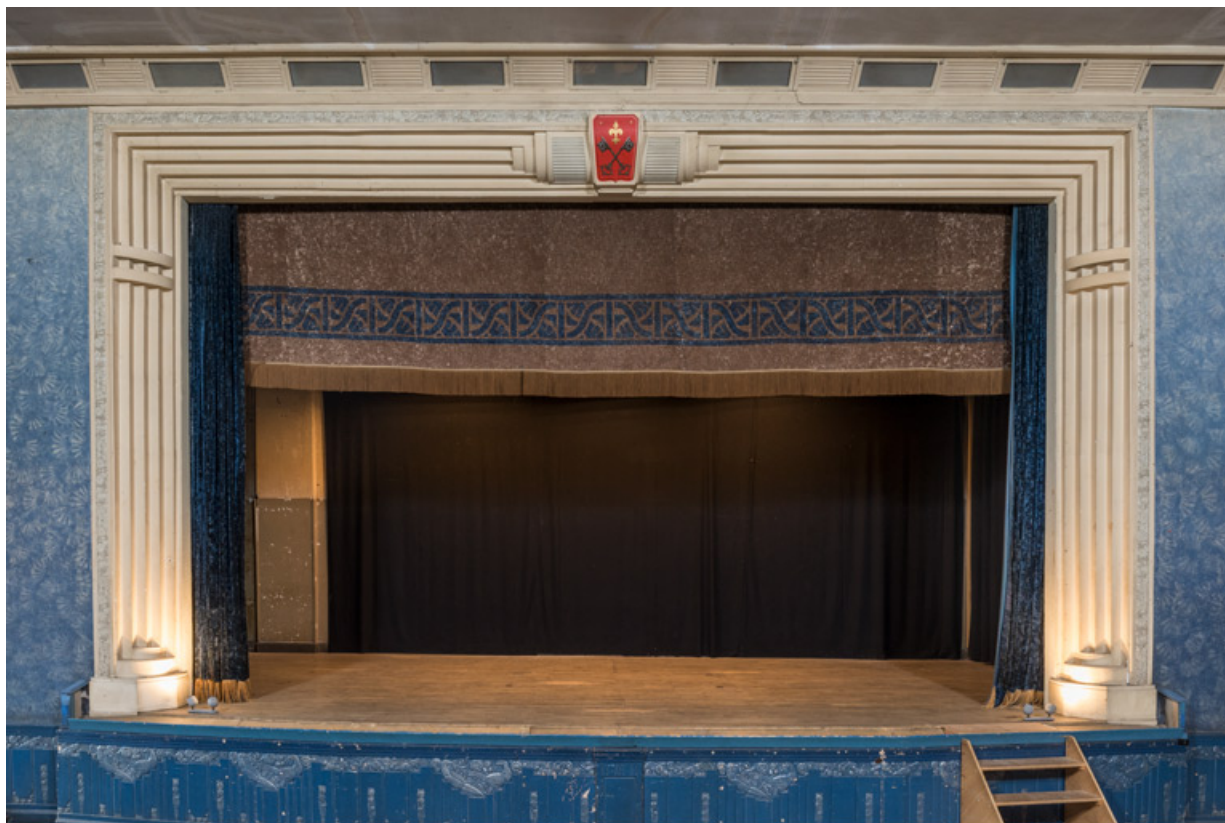
Cadre de scène mouluré, avec son blason, et manteau d'arlequin.