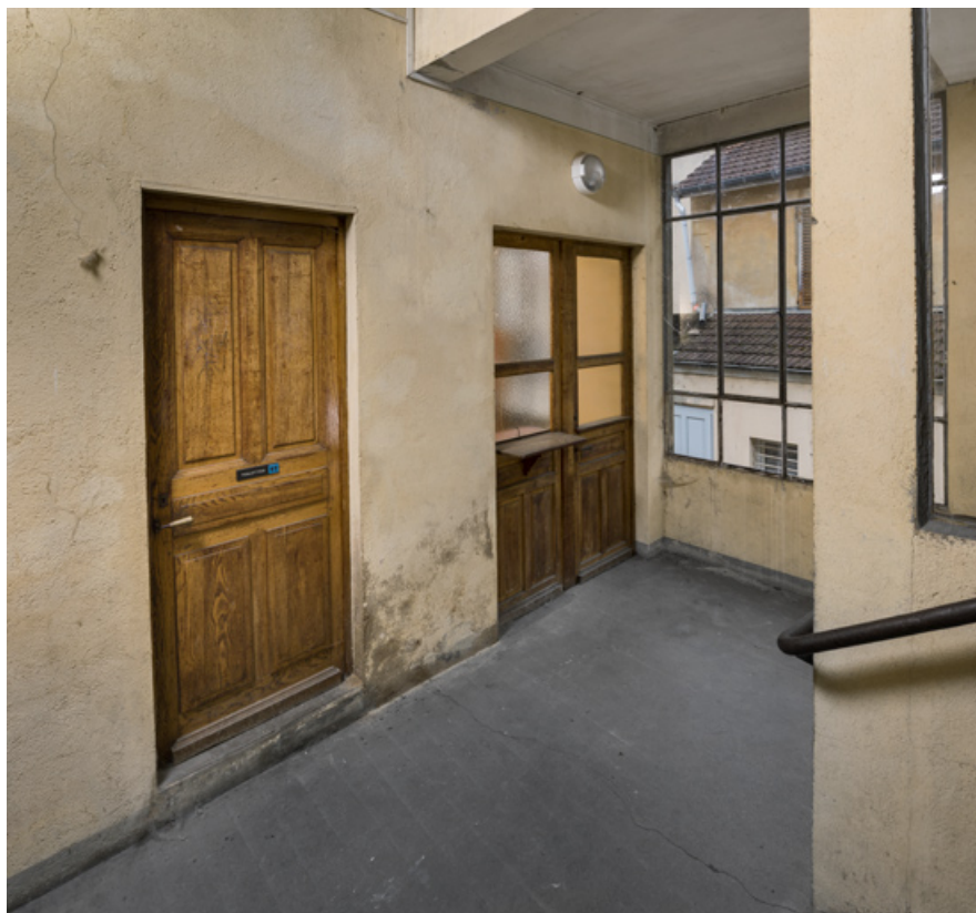
Escalier principal, repos : porte des sanitaires et guichet.