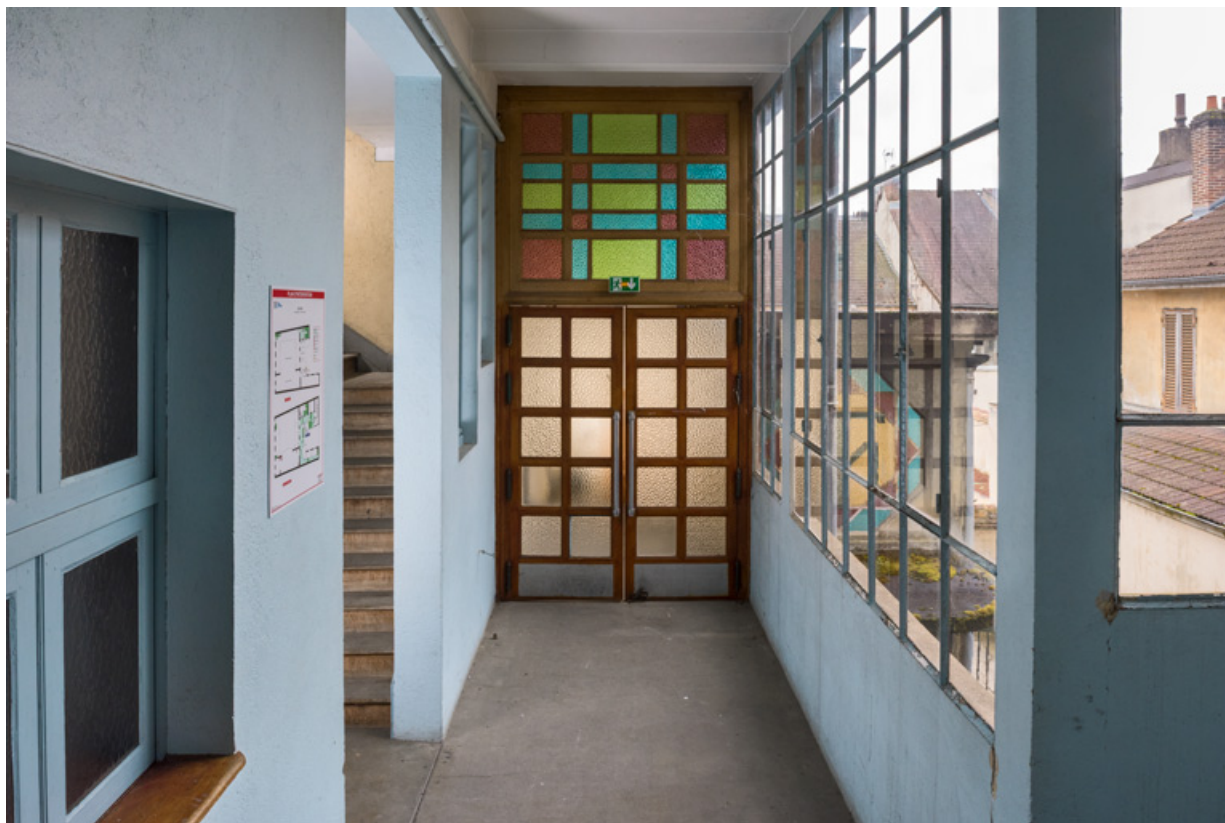
Escalier principal : deuxième palier et fermeture, depuis la galerie vitrée. A gauche, l'escalier desservant le balcon. 71, Louhans Grande Rue 88