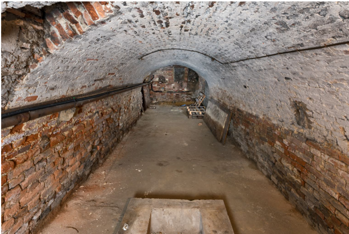
Cave voûtée au sous-sol. 71, Louhans Grande Rue 88