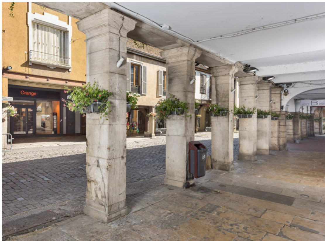
Galerie ouvrant sur la rue. 71, Louhans Grande Rue 88