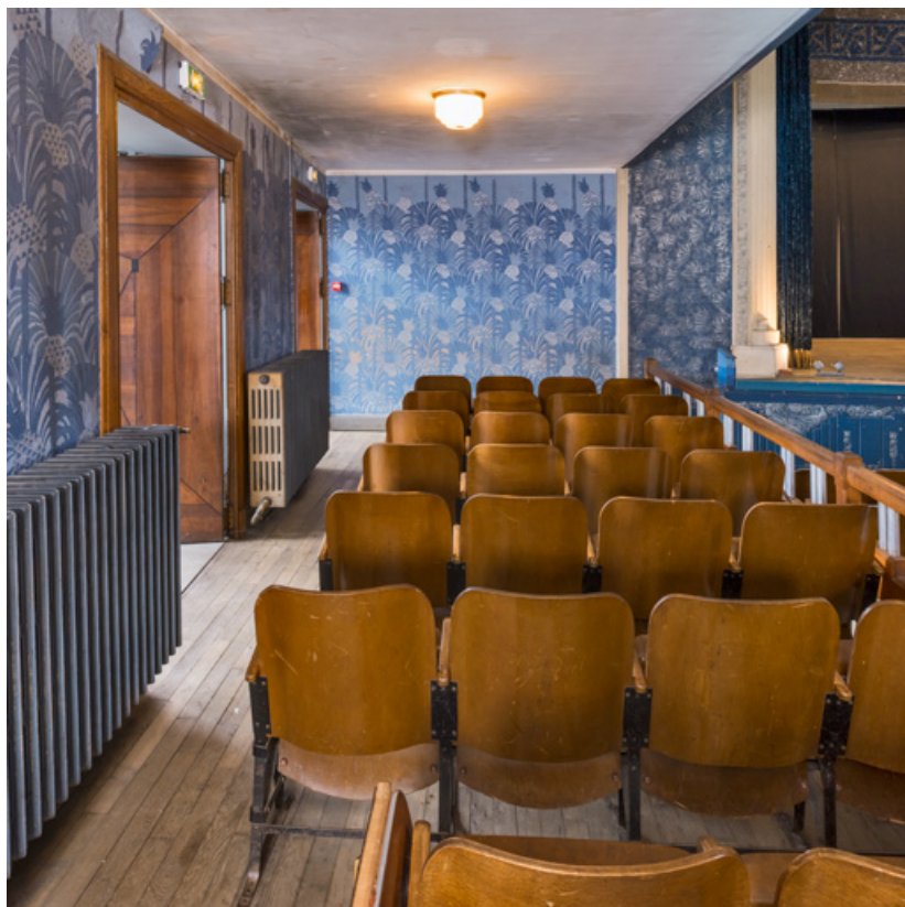
Salle : galerie côté jardin. 71, Louhans Grande Rue 88