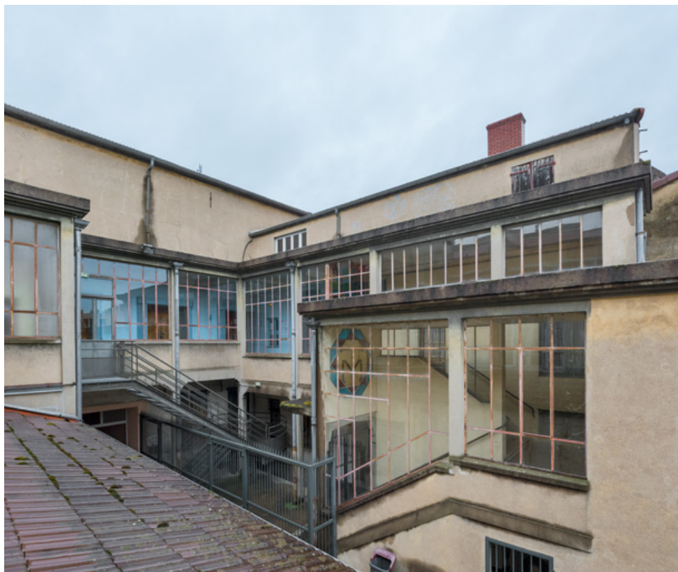
Dessertes : cage de l'escalier principal et galeries vitrées.