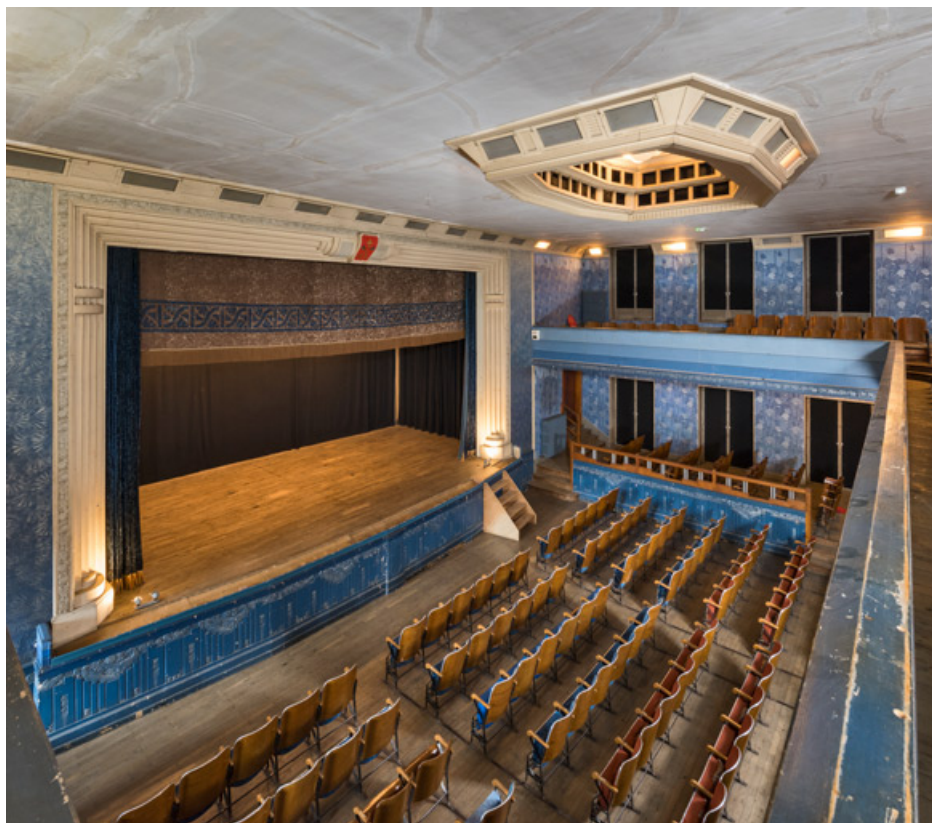
Salle et scène, vues du balcon.