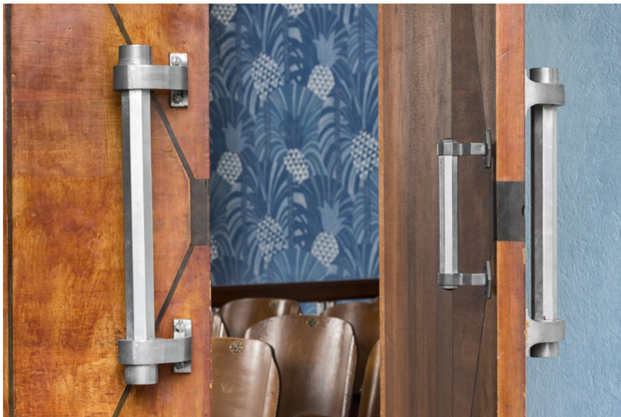
Galerie vitrée : détail des poignées octogonales d'une porte de la salle. 71, Louhans Grande Rue 88