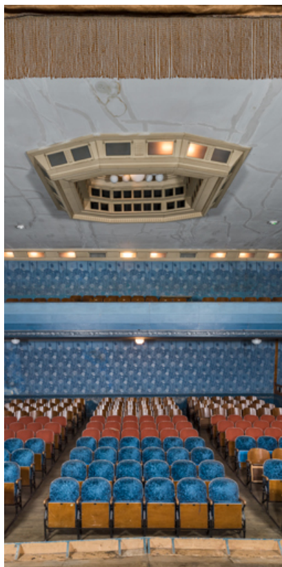
La salle, depuis la scène (vue verticale). 71, Louhans Grande Rue 88