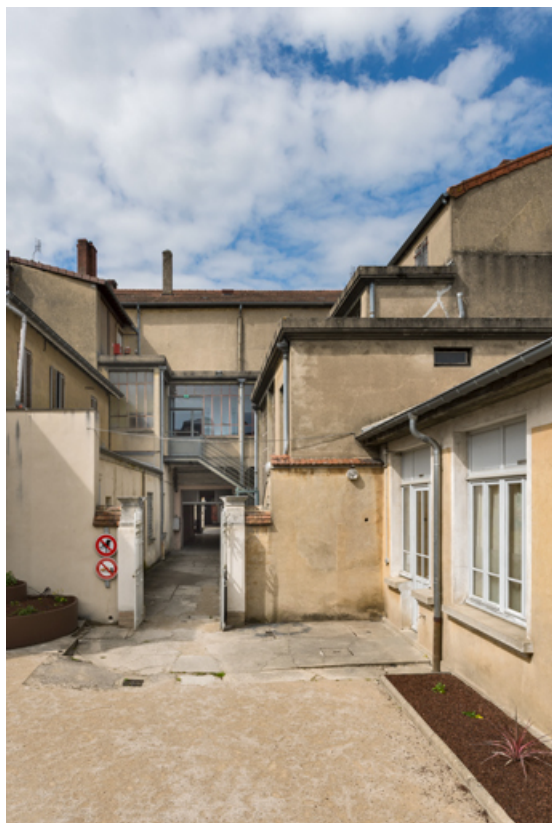
Façade postérieure et dépendances, depuis la deuxième cour au sud. 71, Louhans Grande Rue 88