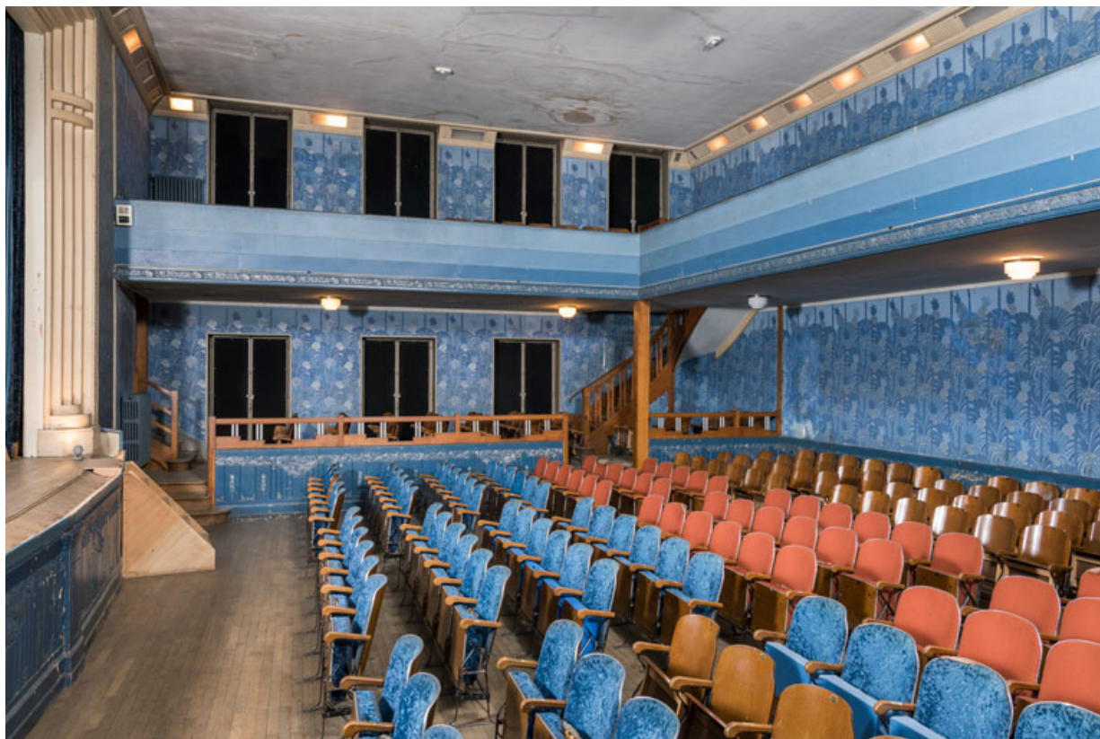
La salle, depuis la galerie côté jardin.