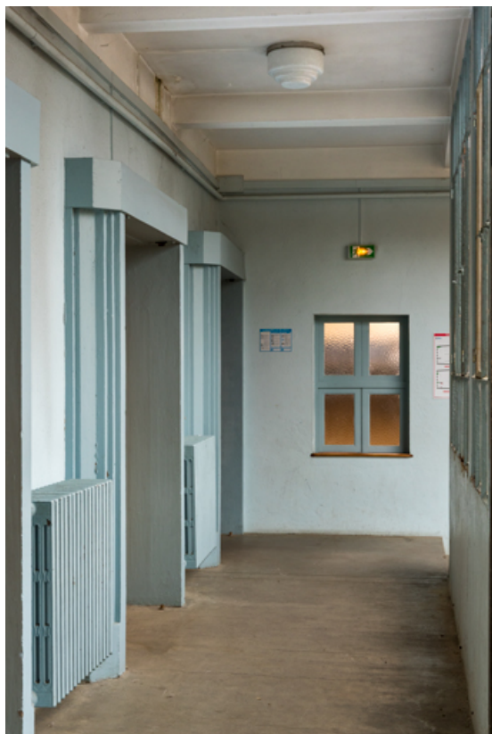
Galerie vitrée, depuis le côté des loges d'acteur (dépendance ouest). 71, Louhans Grande Rue 88