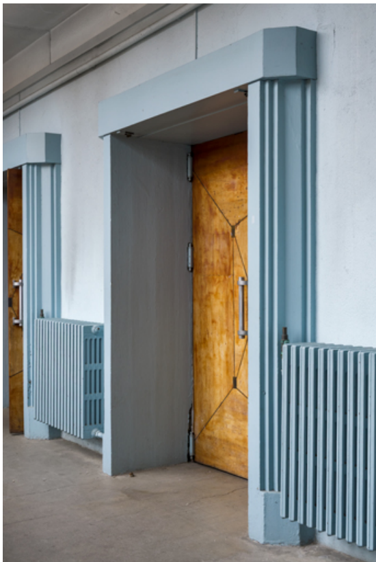
Galerie vitrée : porte de la salle, vue en enfilade.