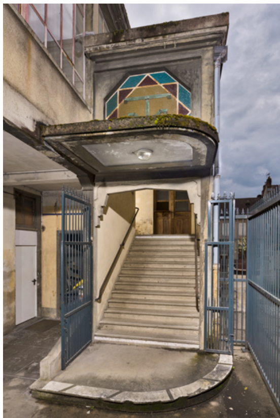
Cage de l'escalier principal.