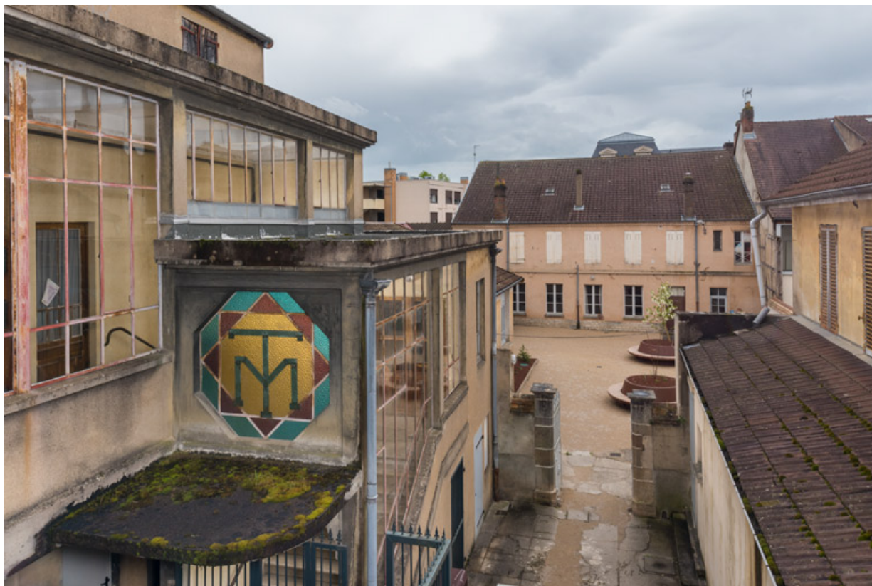
Cage de l'escalier principal (dépendance est) à gauche et loges d'acteur à droite, depuis la galerie vitrée. 71, Louhans Grande Rue 88