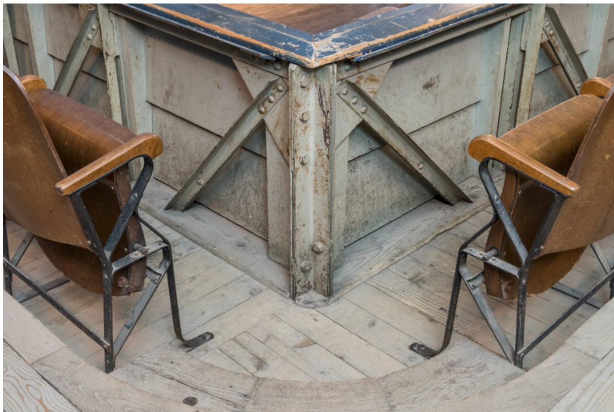
Balcon : structure métallique du garde-corps.