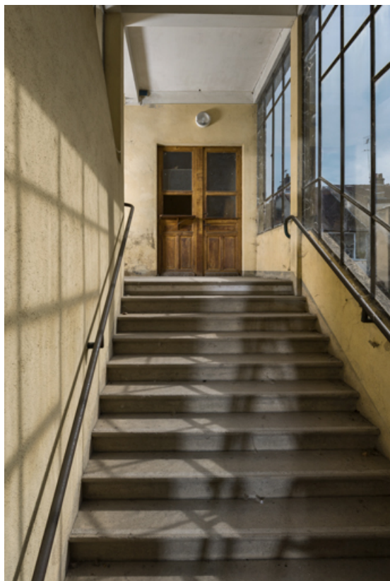
Escalier principal : première volée et guichet sur le repos.