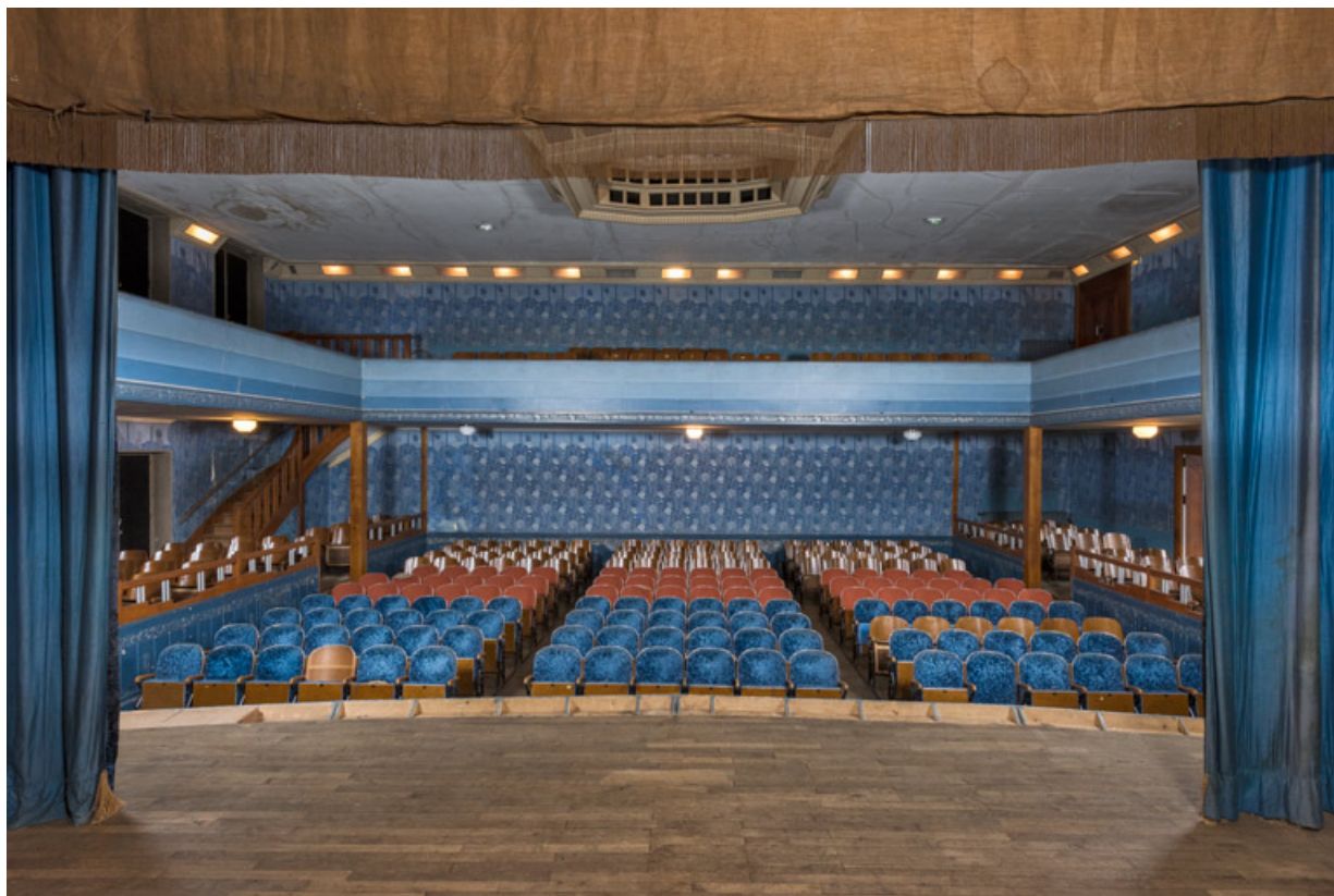
La salle, depuis la scène.