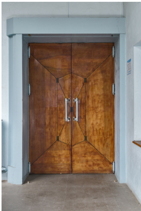
Galerie vitrée : une porte de la salle.