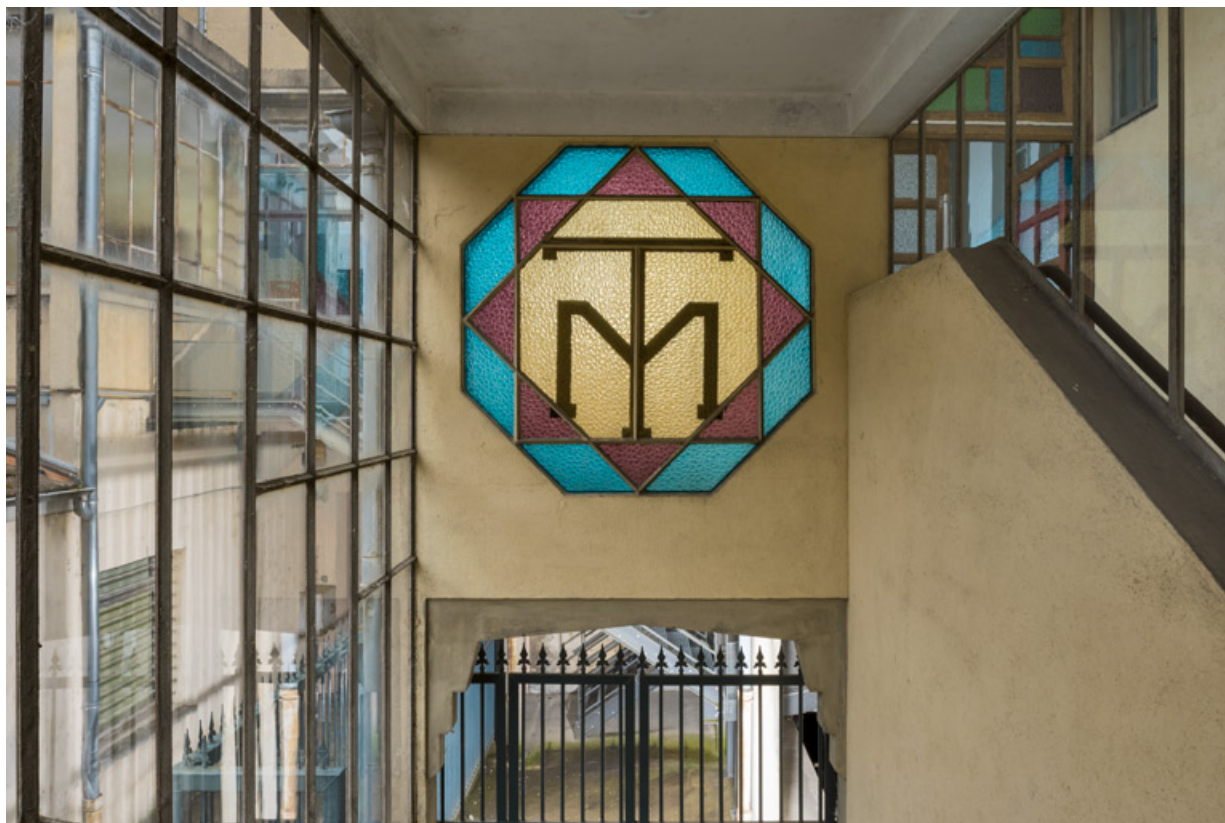
Escalier principal : fenêtre octogonale et vitrail. 71, Louhans Grande Rue 88