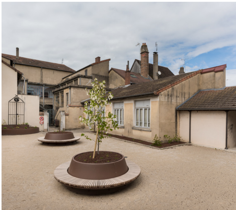
Façade postérieure et dépendances, depuis la deuxième cour au sud (vue d'ensemble). 71, Louhans Grande Rue 88