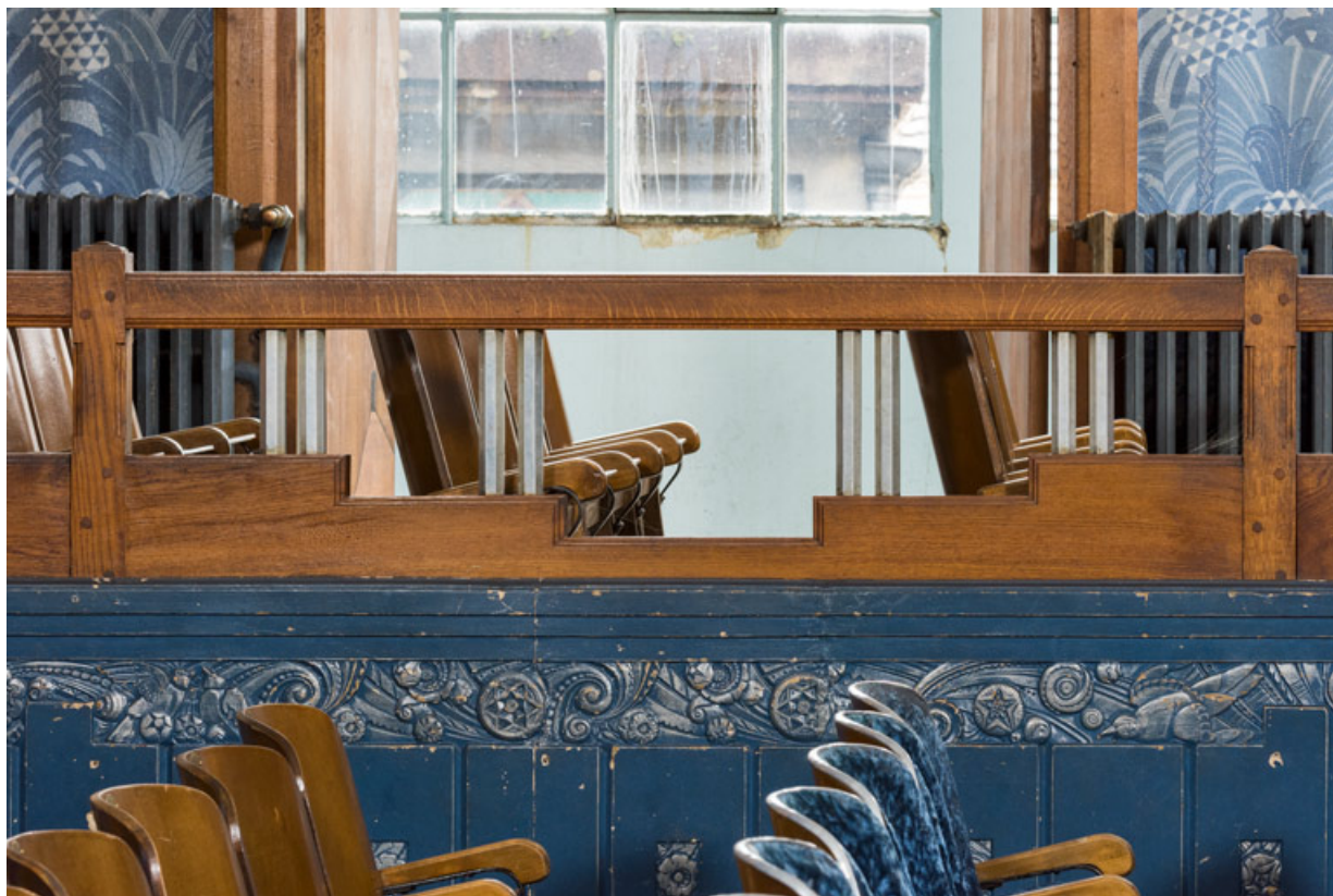
Salle, galerie côté jardin : détail du garde-corps. 71, Louhans Grande Rue 88