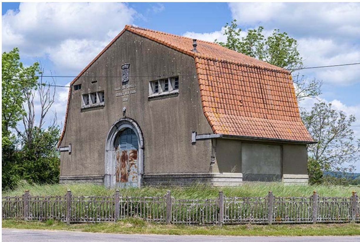
Face antérieure, de trois quarts avant droit. 70, Jussey, 9 rue du Bac, lieudit : Prés Barçeau