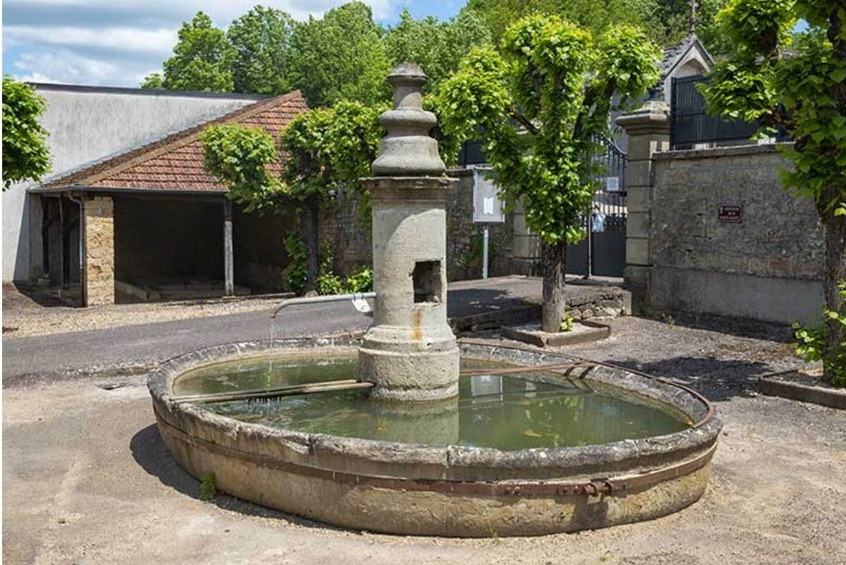
La fontaine vue depuis la rue, au sud.