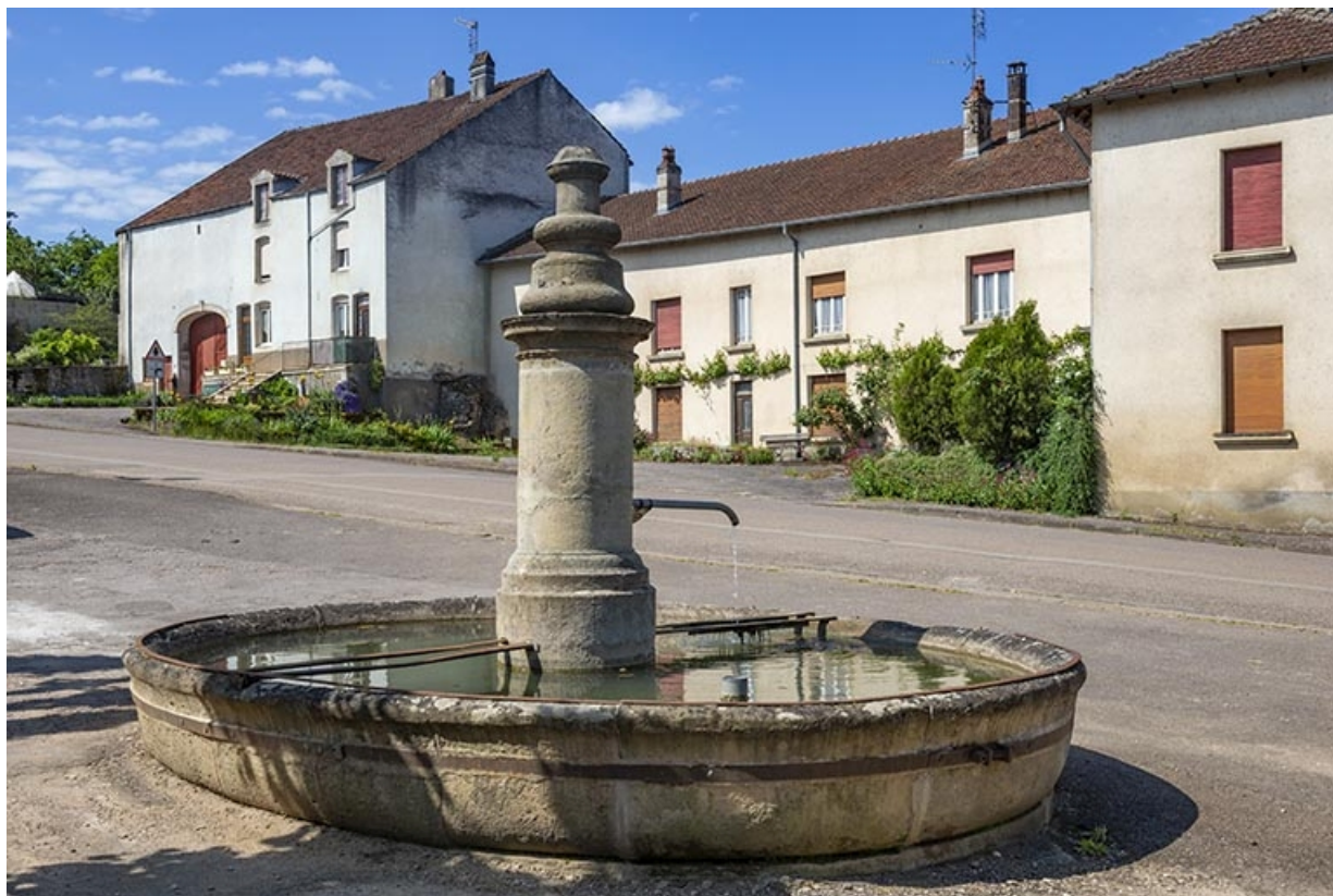
La fontaine vue depuis le nord. 70, Jussey rue Charles-Bontemps