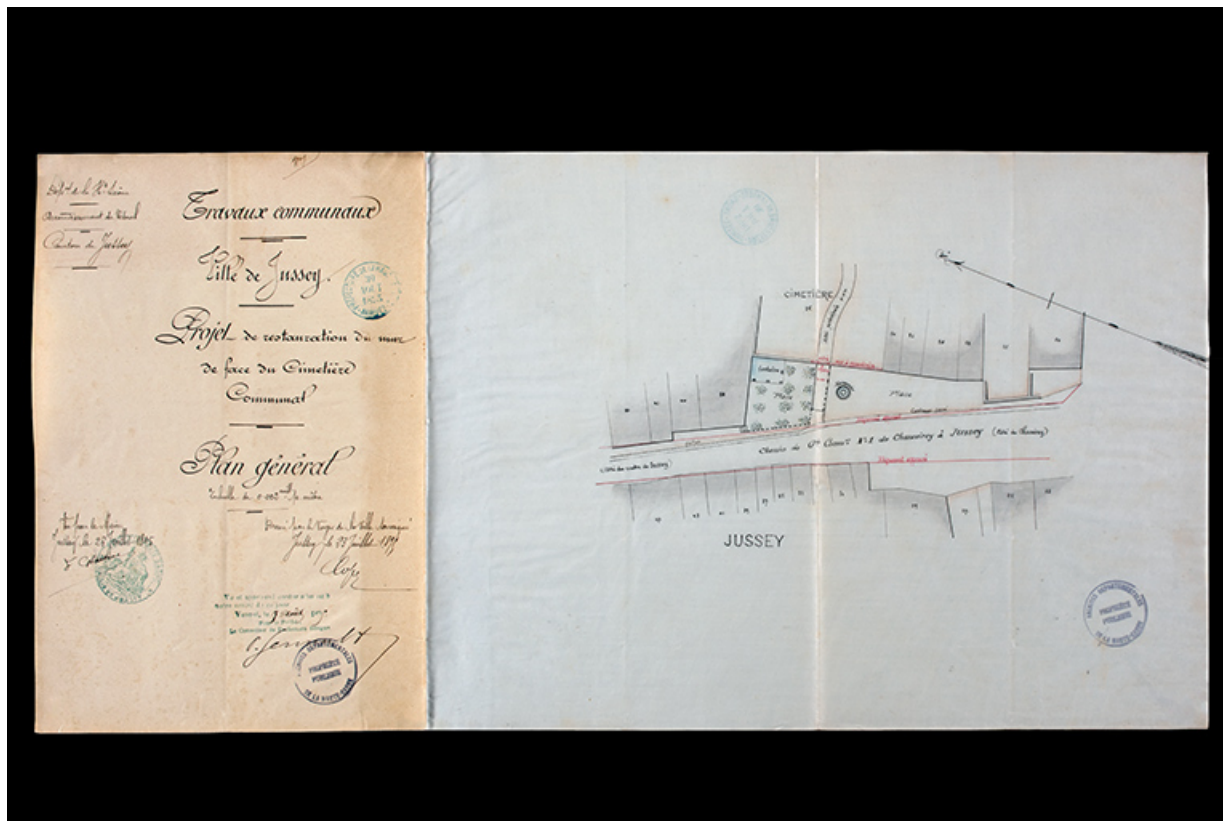
Plan pour la restauration du mur du cimetière [1895].