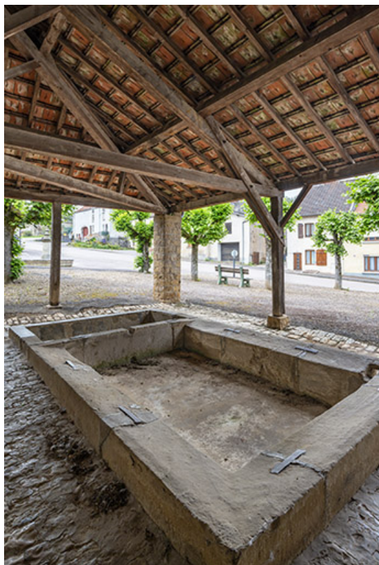
L'intérieur du lavoir, depuis le fond.