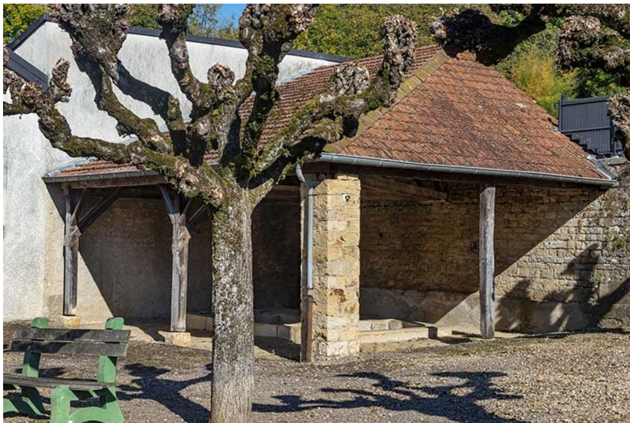
Le lavoir de trois quarts, vue rapprochée.