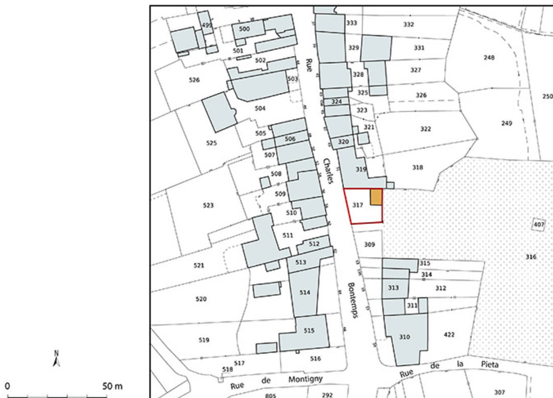
Plan-masse et de situation. Extrait du plan cadastral numérisé de la direction générale des finances publiques, 2025, 1/1 000. 70, Jussey rue Charles-Bontemps