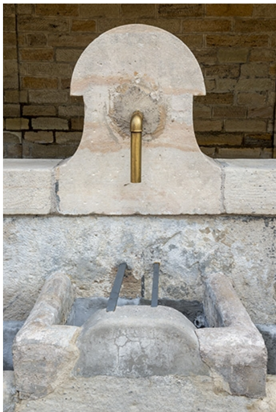
La borne de la fontaine de face.

70, Jussey avenue de la Gare, lieudit : la gare