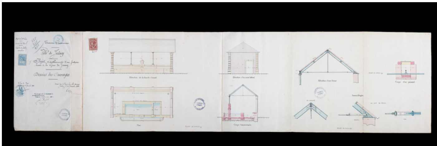
Plan, élévations, coupes et vues de détail projetés de la fontaine-lavoir de la gare à Jussey, 1902.

70, Jussey avenue de la Gare, lieu dit : la gare