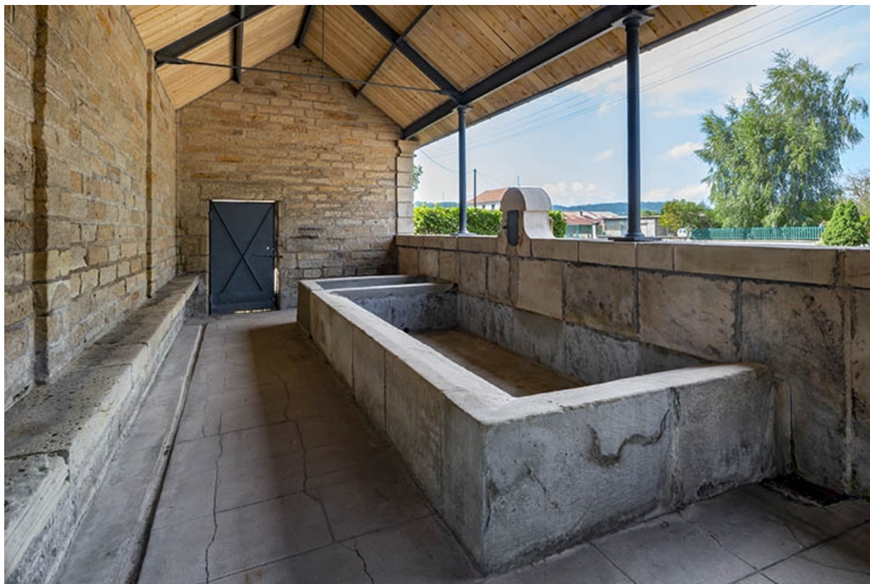
L'intérieur du lavoir, depuis le côté gauche.

70, Jussey avenue de la Gare, lieudit : la gare