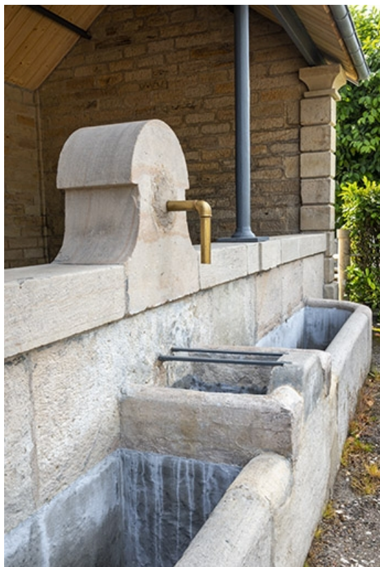
La borne de la fontaine, de trois quarts gauche.

70, Jussey avenue de la Gare, lieudit : la gare