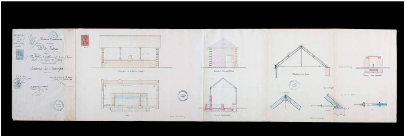
Plan, élévations, coupes et vues de détail projetés de la fontaine-lavoir de la gare à jussey, 1902.

70, Jussey avenue de la Gare, lieu dit : la gare