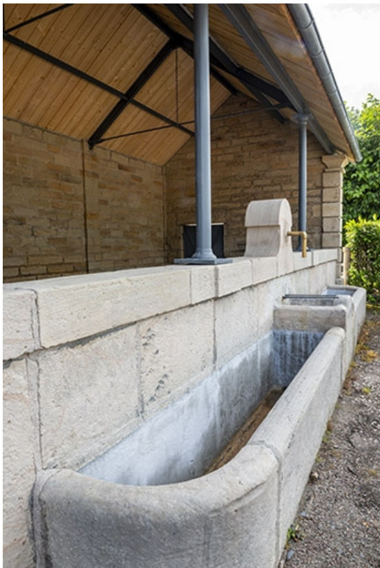
L'abreuvoir de la fontaine, de trois-quarts gauche.

70, Jussey avenue de la Gare, lieudit : la gare