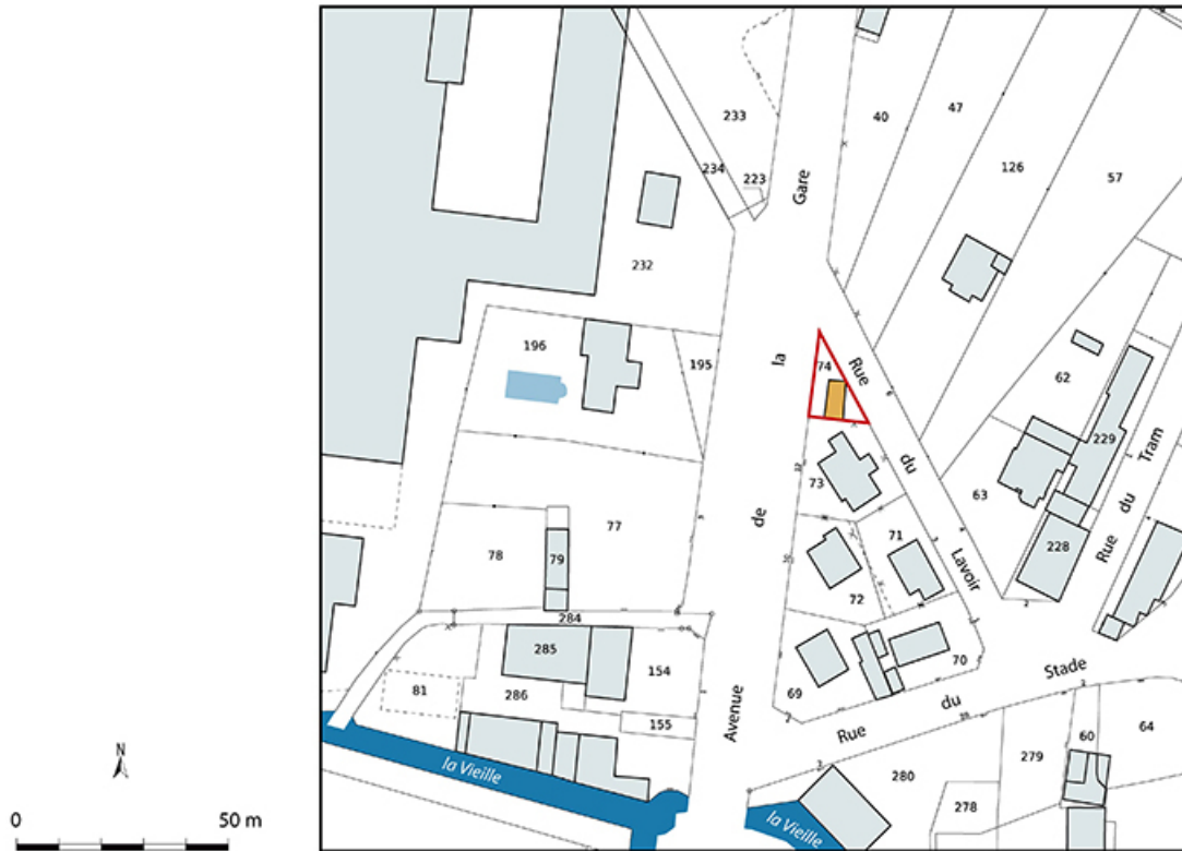
Plan-masse et de situation. Extrait du plan cadastral numérisé de la direction générale des finances publiques, 2025, 1/1 000. 70, Jussey avenue de la Gare, lieudit : la gare