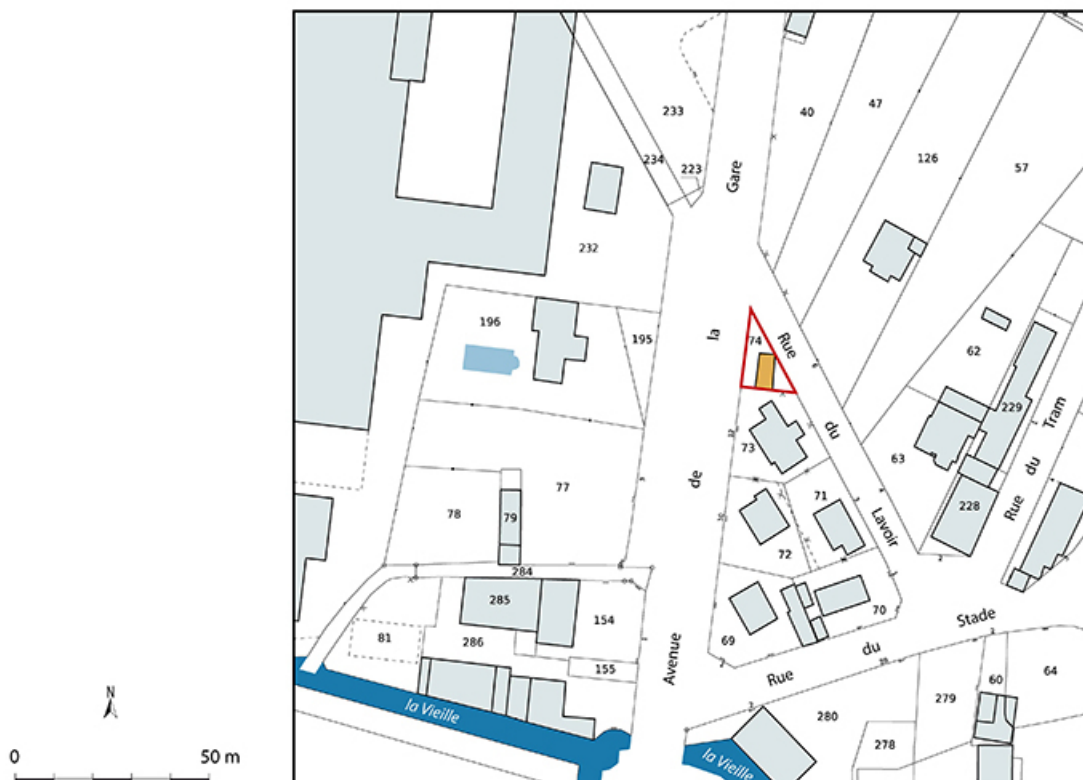
Plan-masse et de situation. Extrait du plan cadastral numérisé de la direction générale des finances publiques, 2025, 1/1 000. 70, Jussey avenue de la Gare, lieudit : la gare