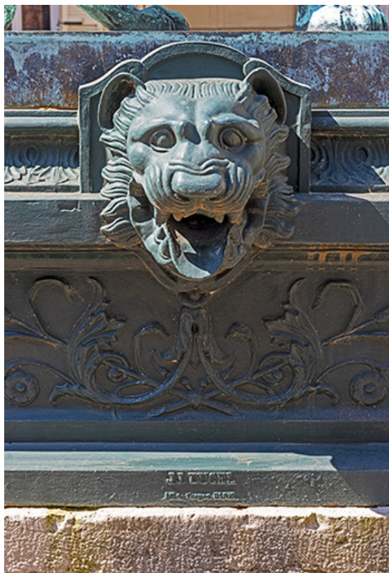
Détail du protomé de lion sans eau.