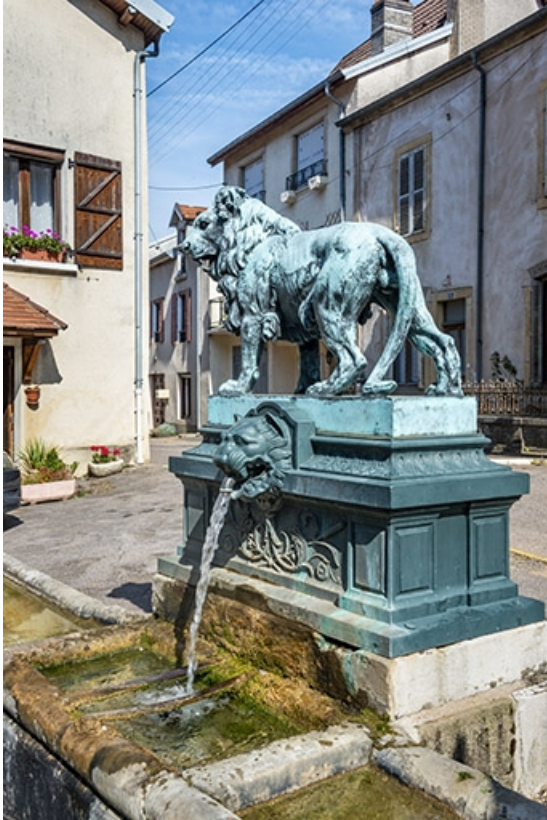
La statue et la borne de trois quarts droit. 70, Jussey rue Charles-Bontemps