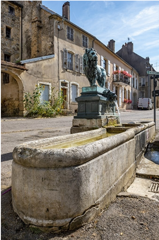
La fontaine de trois quarts gauche.