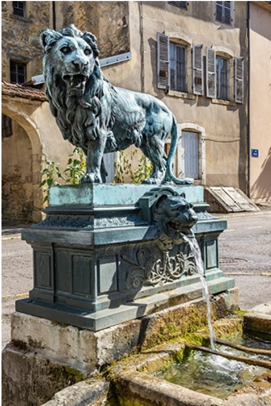
La borne et la sculpture de trois quarts gauche. 70, Jussey rue Charles-Bontemps