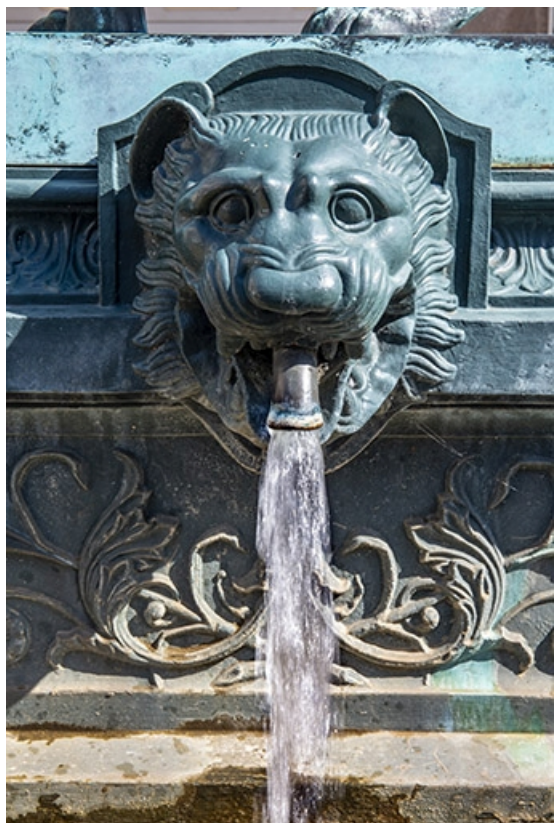
Détail du protomé de lion en eau.