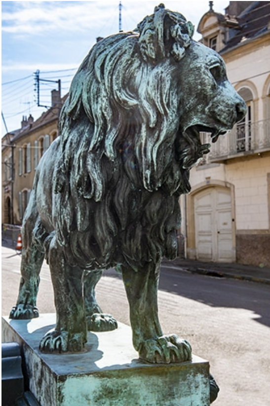
Trois quarts gauche du lion.