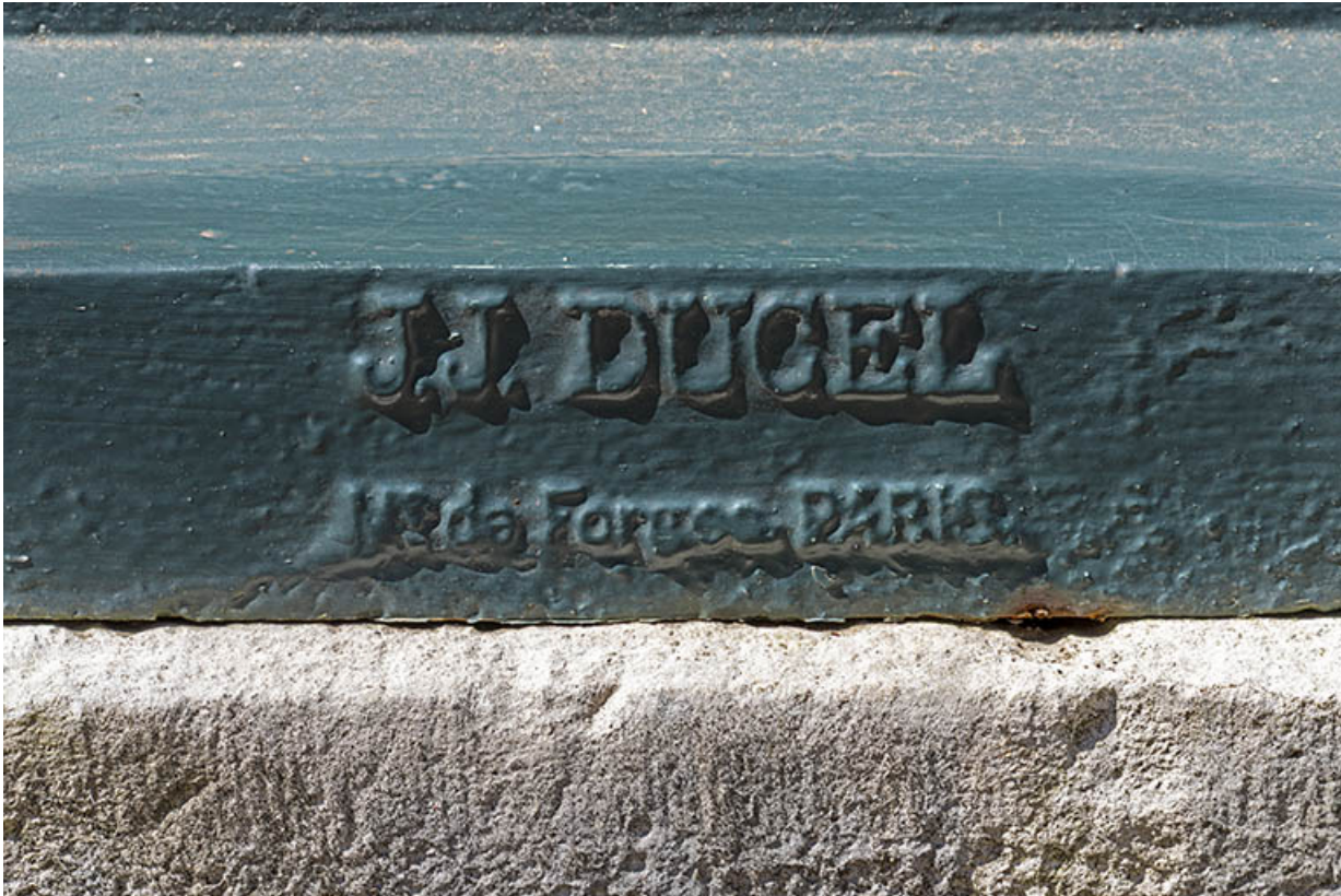
Signature de la fonderie au revers de la fontaine.