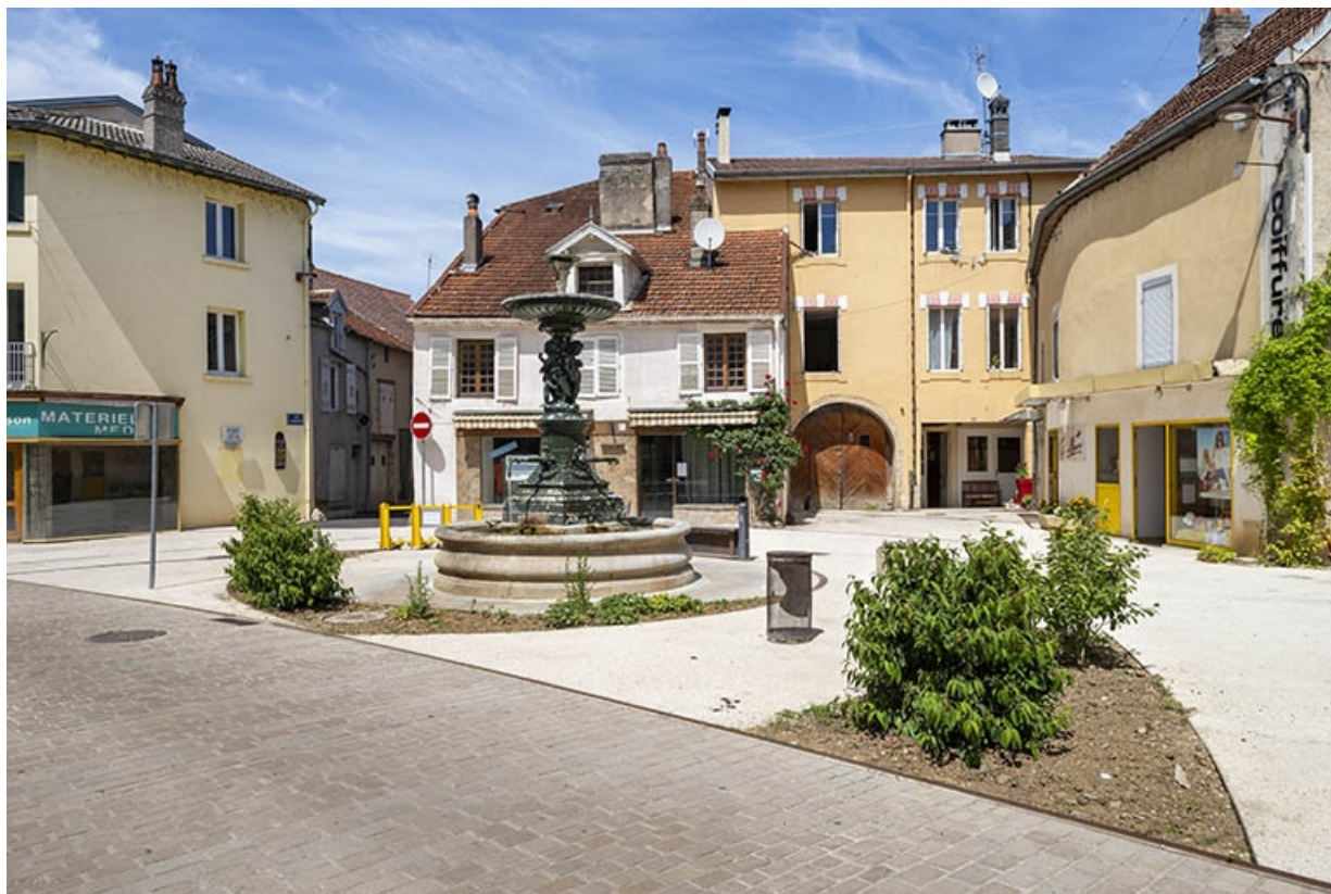
La fontaine dans son contexte.