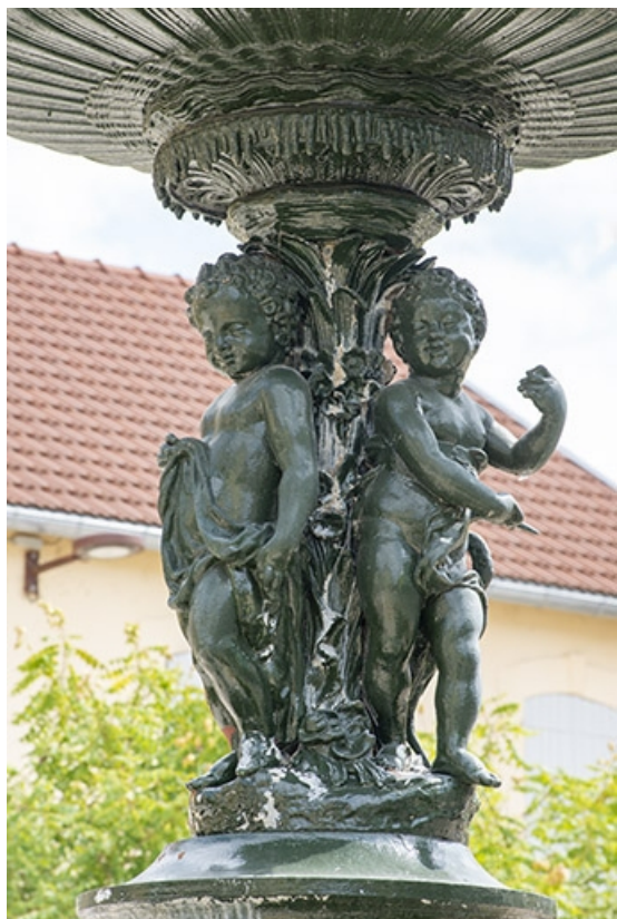
Détail des anges et de la partie inférieure de la vasque. 70, Jussey rue Gambetta