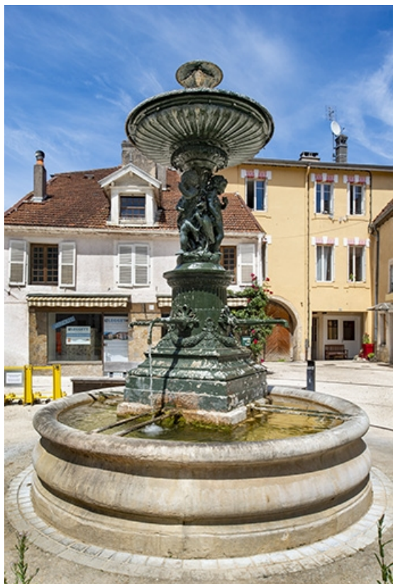
La fontaine, vue rapprochée.