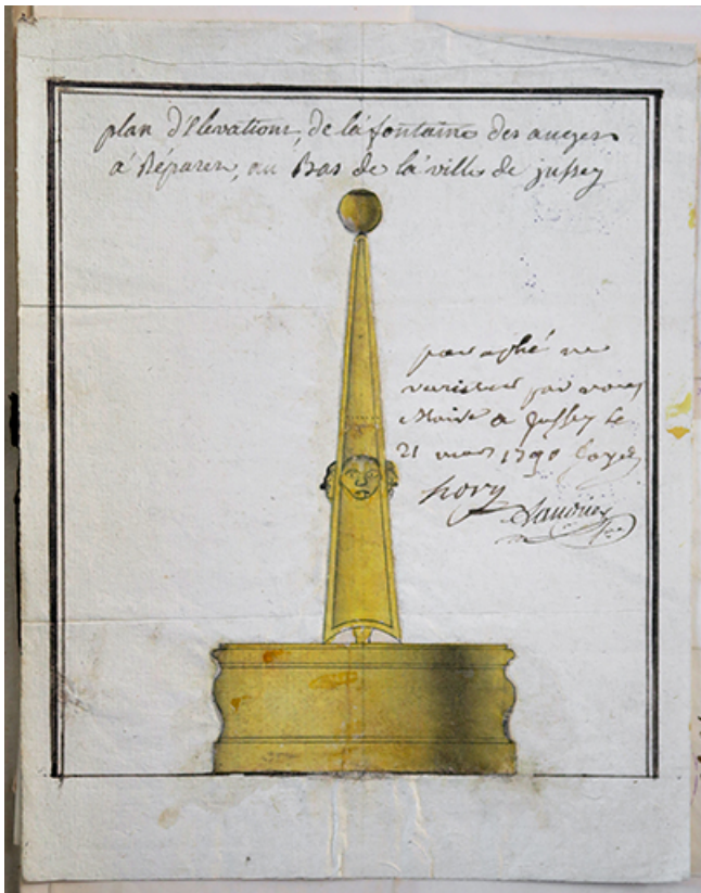
La fontaine des anges (détruite) en 1790.