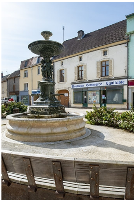
La fontaine et les façades opposées de la rue Gambetta. 70, Jussey rue Gambetta