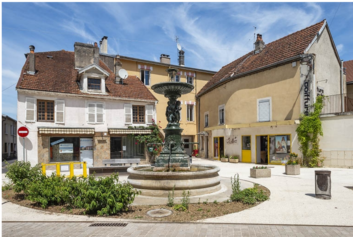
La fontaine et les façades de la rue Gambetta à l'arrière. 70, Jussey rue Gambetta