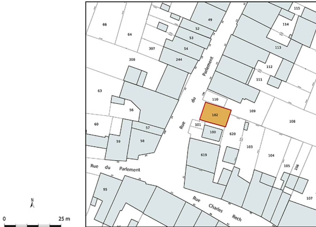
Plan-masse et de situation. Extrait du plan cadastral numérisé de la direction générale des finances publiques, 2025, 1/500. 70, Jussey rue du Parlement