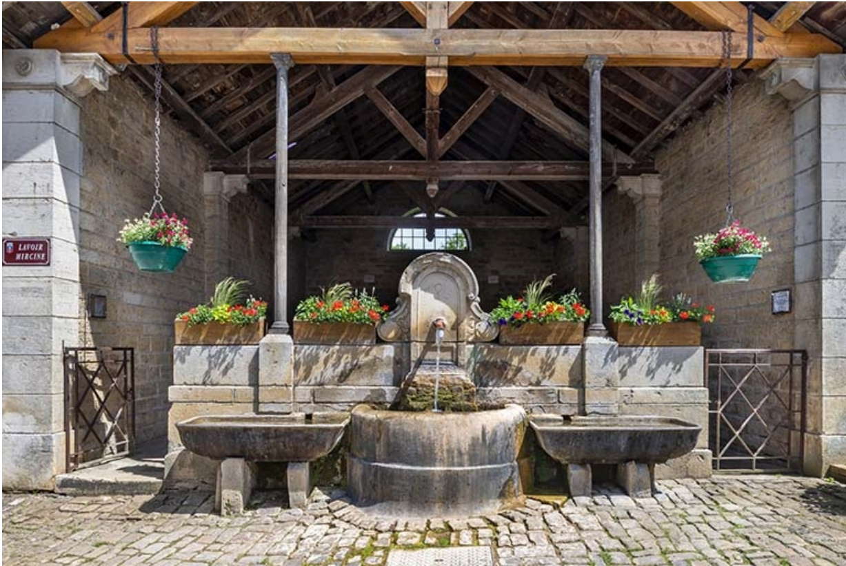
Détail de la face antérieure du lavoir.