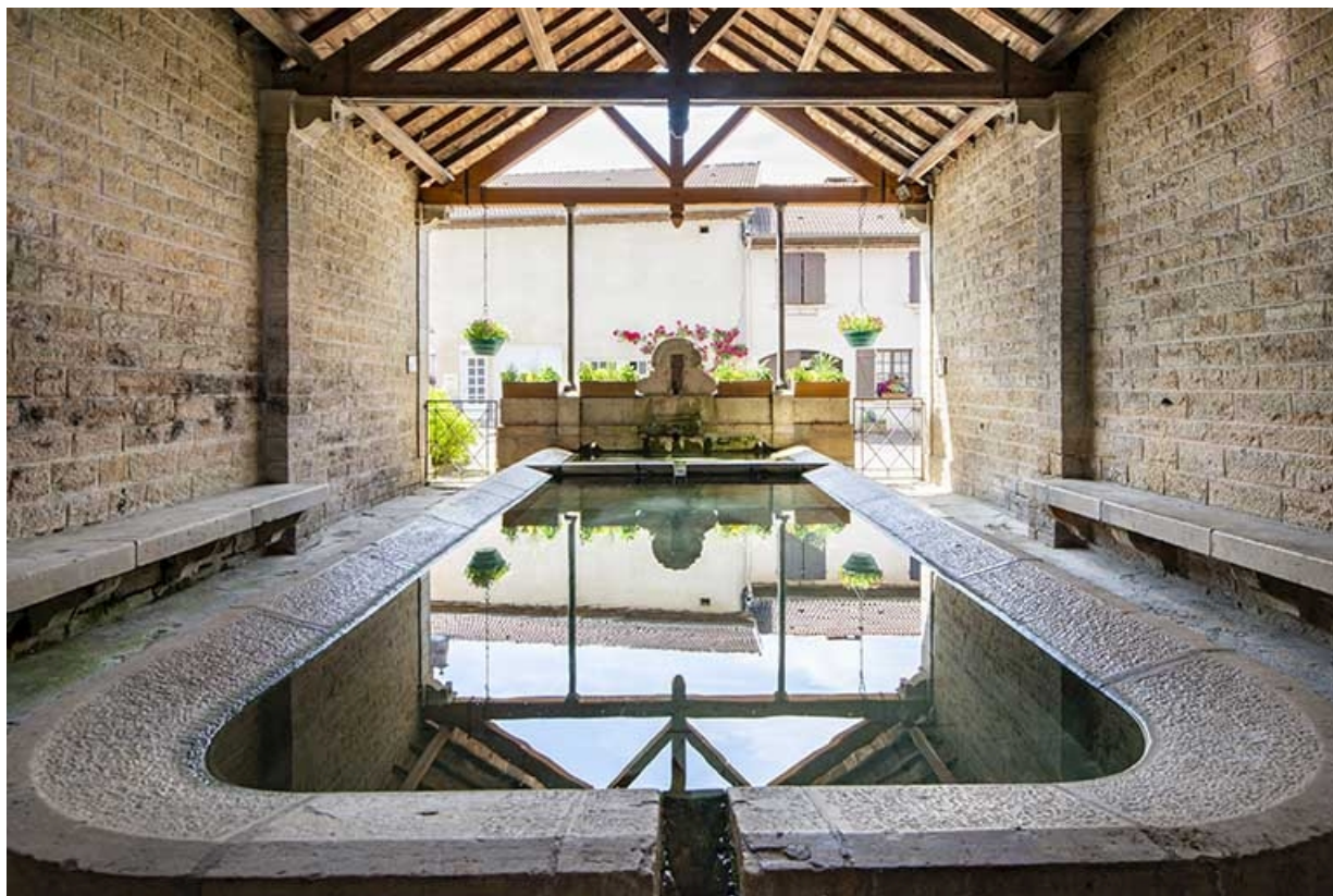
L'intérieur du lavoir, depuis le fond.