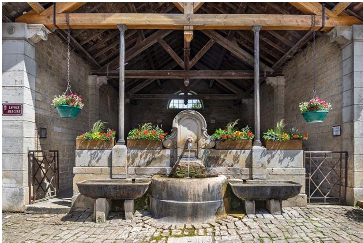
Détail de la face antérieure du lavoir.