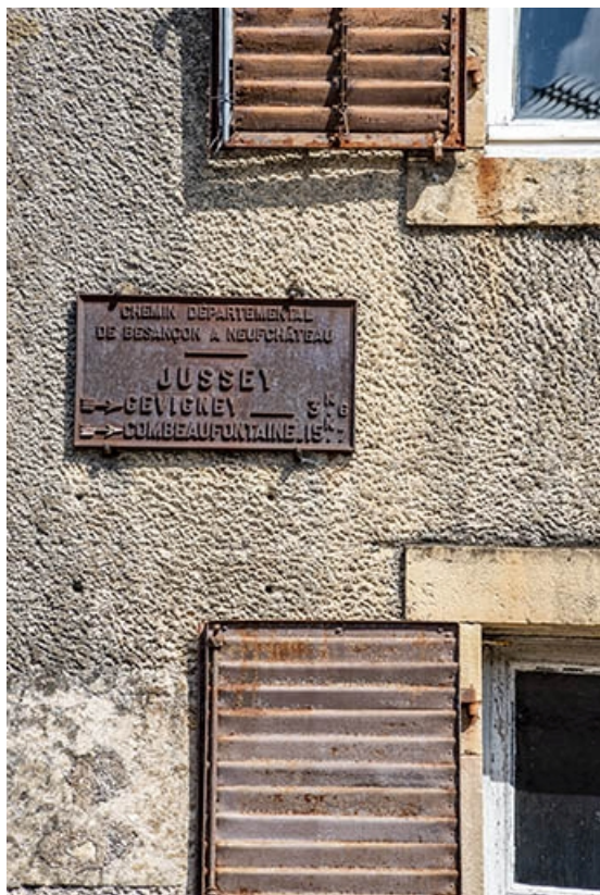
Détail de la façade avec plaque directionnelle.