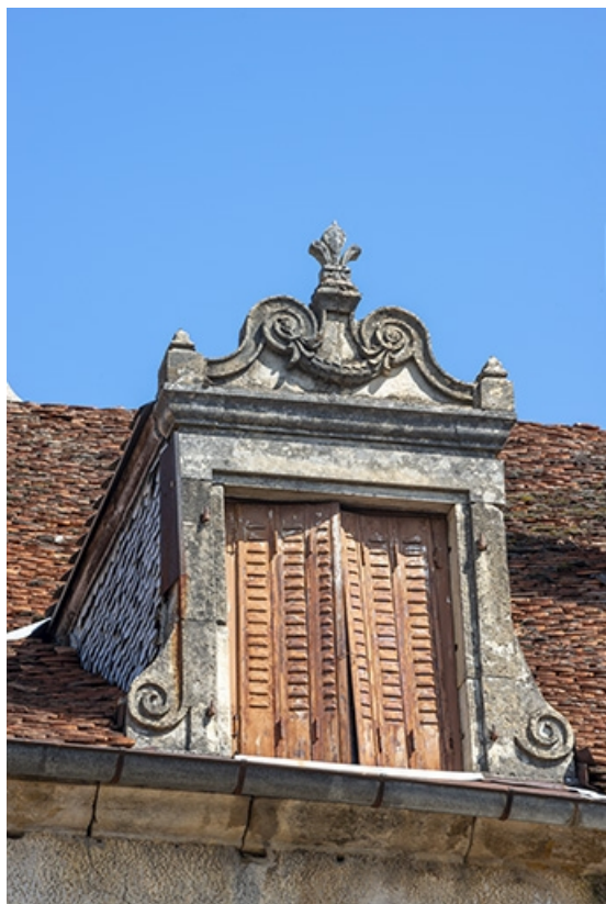
Détail de la lucarne droite.