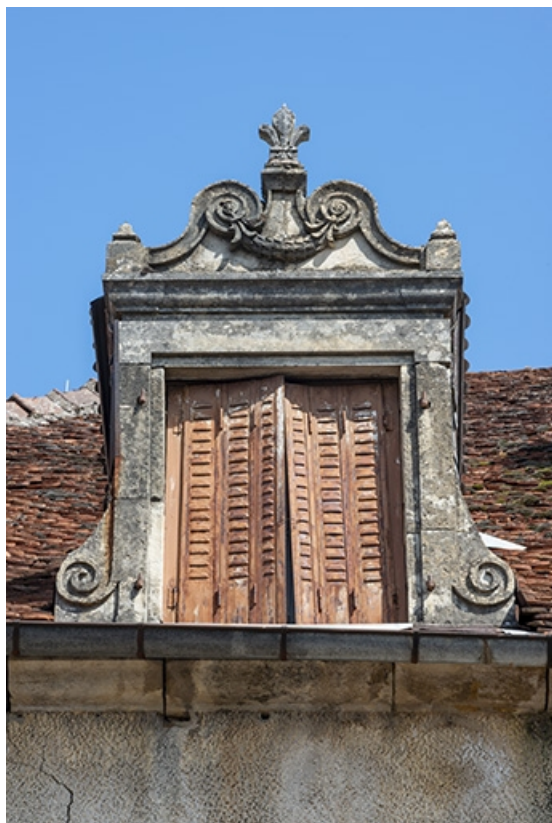
Détail de la lucarne gauche.