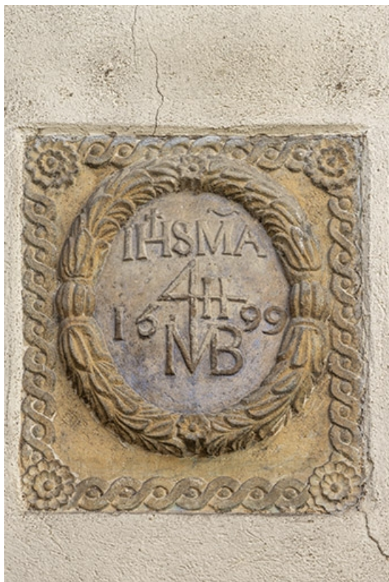
Cartouche inséré dans un mur de la cour, portant le millésime 1599. 70, Jussey, 8 rue Charles-Bontemps