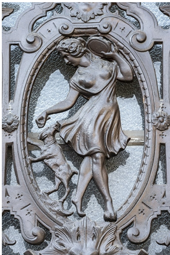
Détail de la grille droite de la porte cochère. 70, Jussey, 8 rue Charles-Bontemps