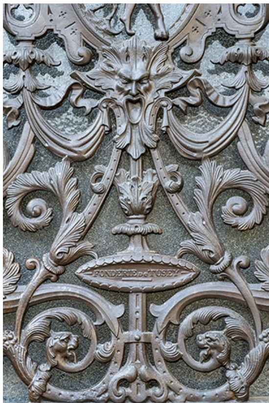
Détail de la grille droite de la porte cochère. 70, Jussey, 8 rue Charles-Bontemps