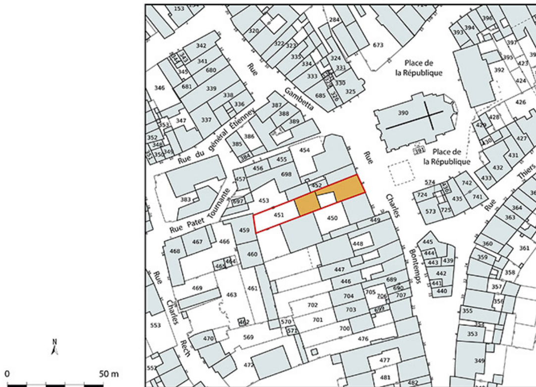
Plan-masse et de situation. Extrait du plan cadastral numérisé de la direction générale des finances publiques, 2025, 1/1 000. 70, Jussey, 8 rue Charles-Bontemps