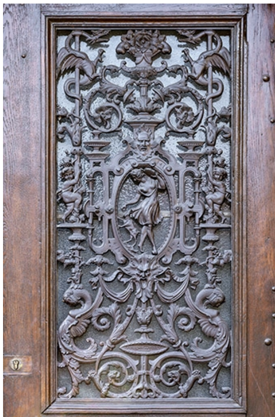
Vantaill de droite de la porte cochère.