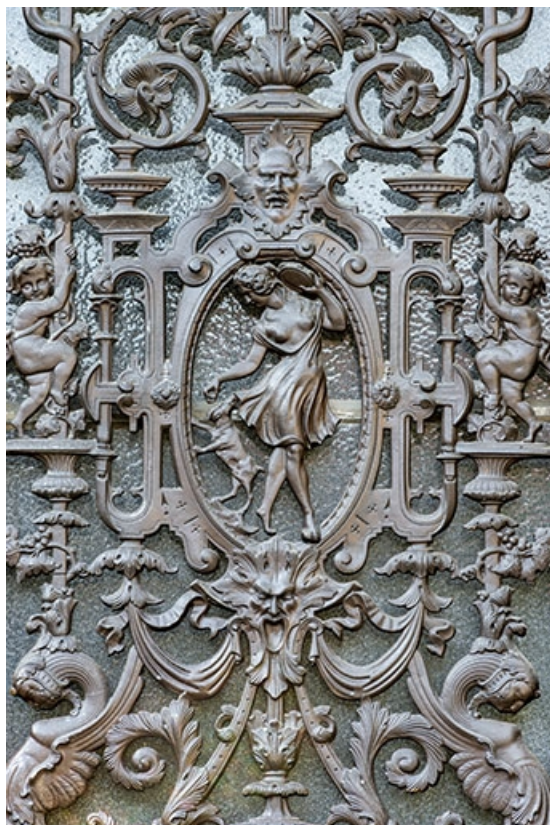
Détail de la grille droite de la porte cochère. 70, Jussey, 8 rue Charles-Bontemps