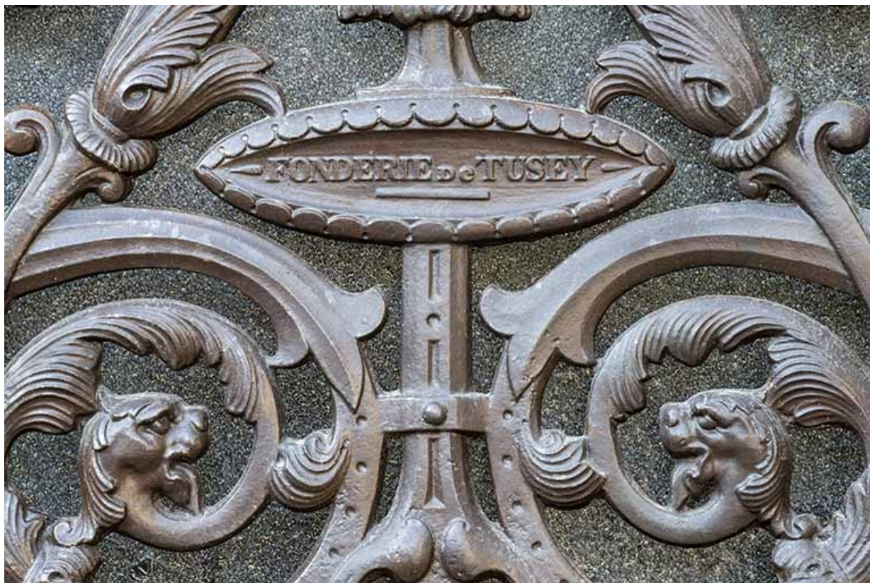
Détail de la grille droite de la porte cochère avec marque de fabrique : "Fonderie de Tusey". 70, Jussey, 8 rue Charles-Bontemps