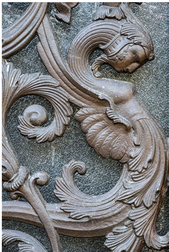
Détail de la grille gauche de la porte cochère. 70, Jussey, 8 rue Charles-Bontemps