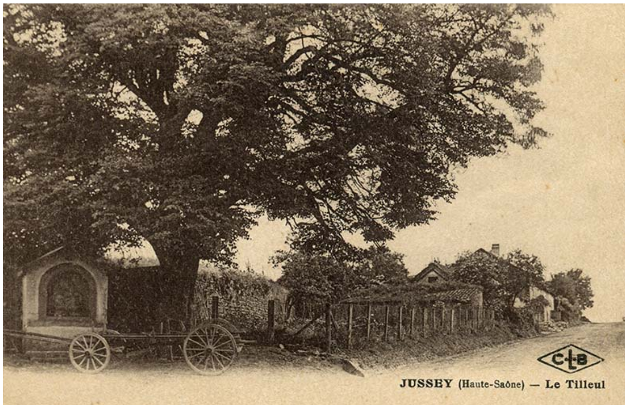
L'oratoire et le tilleul au début du 20e siècle. 70, Jussey rue Bontemps