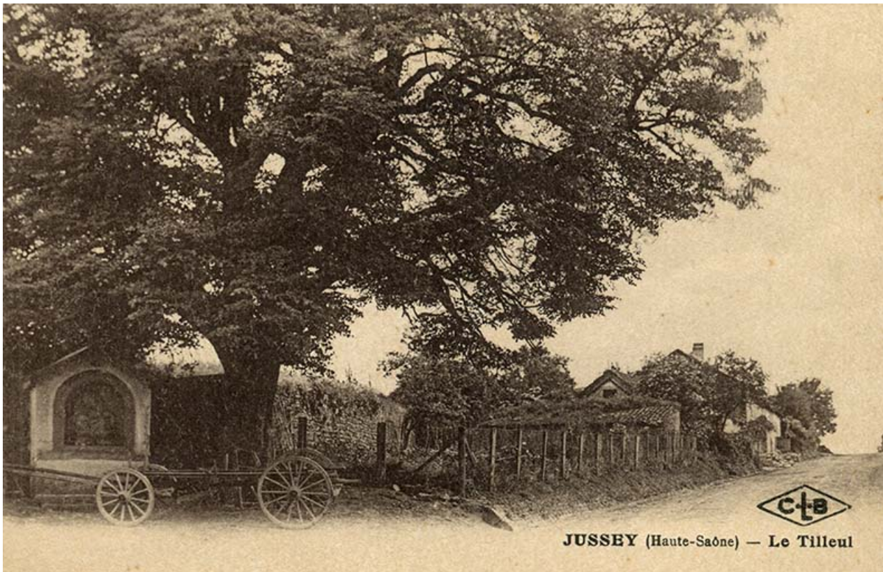
L'oratoire et le tilleul au début du 20e siècle.