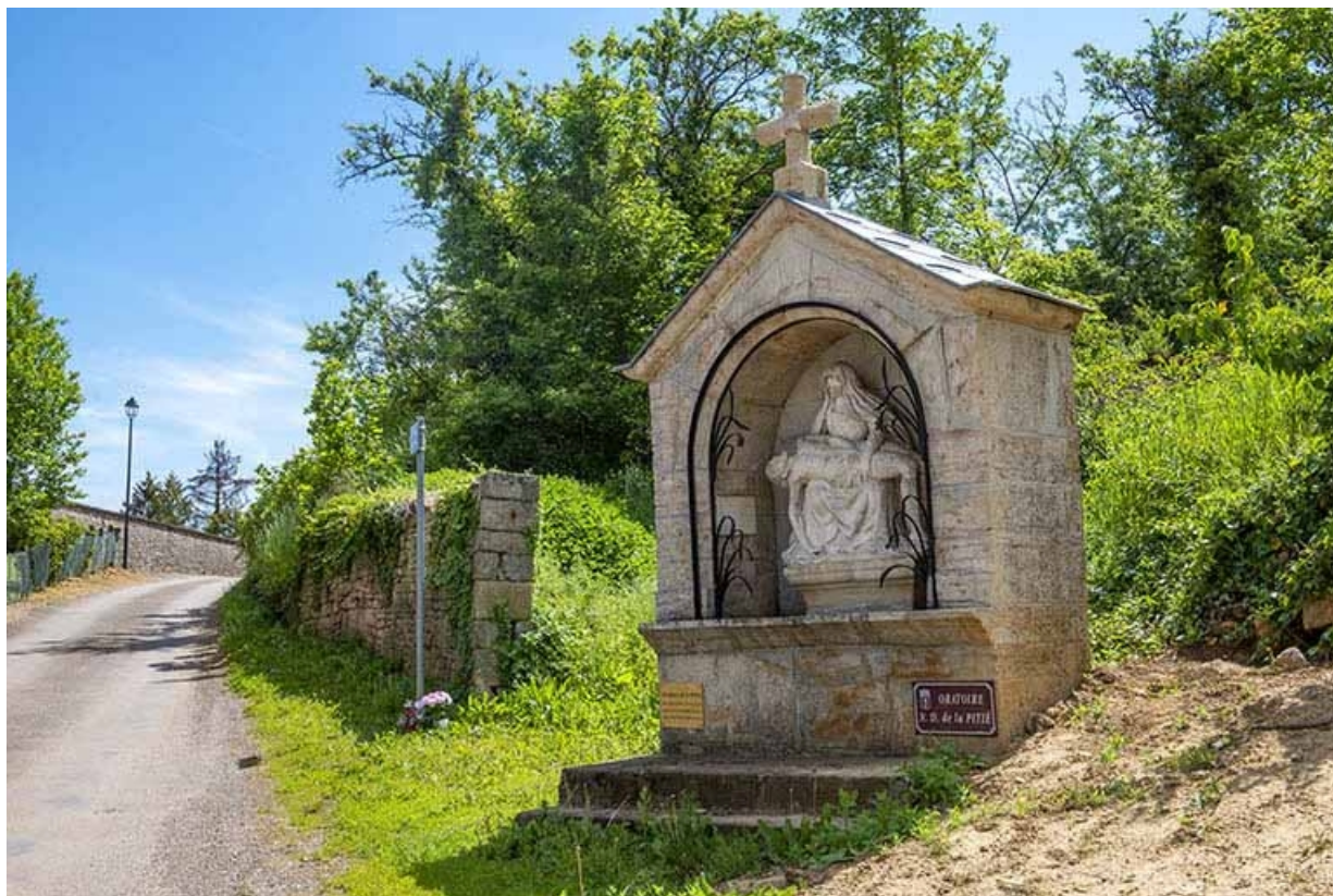
L'oratoire dans son environnement