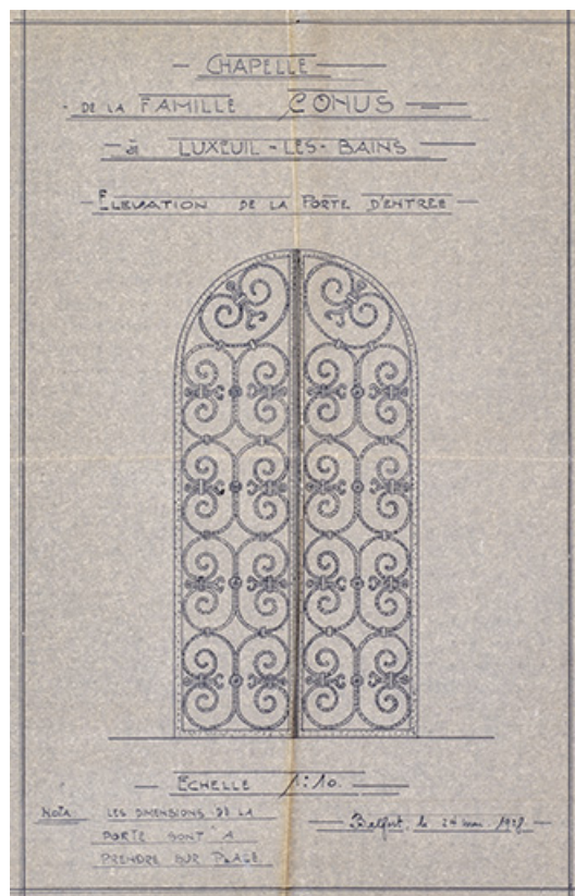
Projet d'Albert Salomon (1928), grille de la porte d'entrée. 70, Luxeuil-les-Bains place du Souvenir français