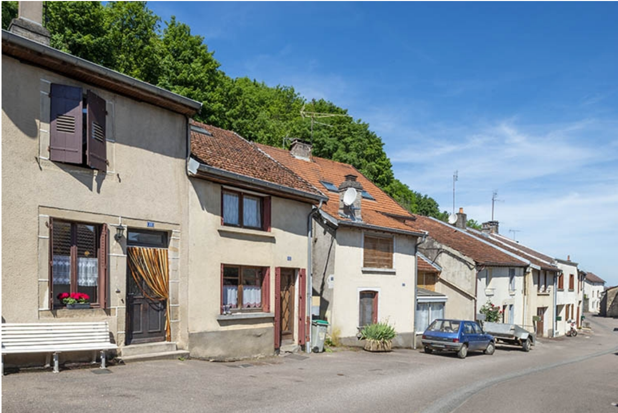
Côté des numéros impairs, à la hauteur du n° 11. 70, Jussey rue Charles Rech