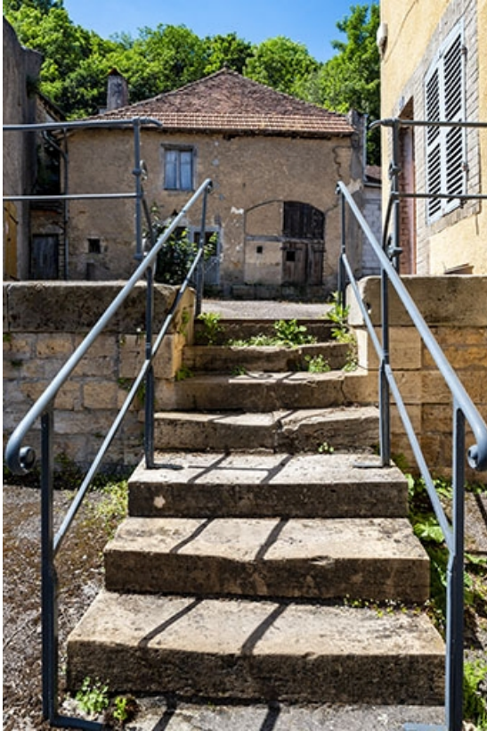
Escalier isolé débouchant sur la rue Charles-Rech, face à la ferme, au n° 69. 70, Jussey rue Charles Rech