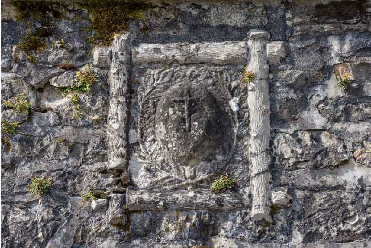
Détail de la façade du n° 37 : bas-relief.