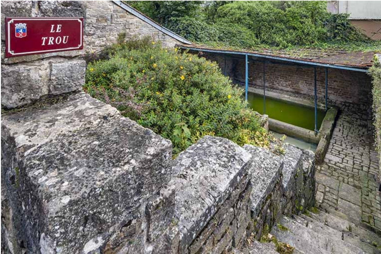
L'escalier et les bassins depuis la rue.