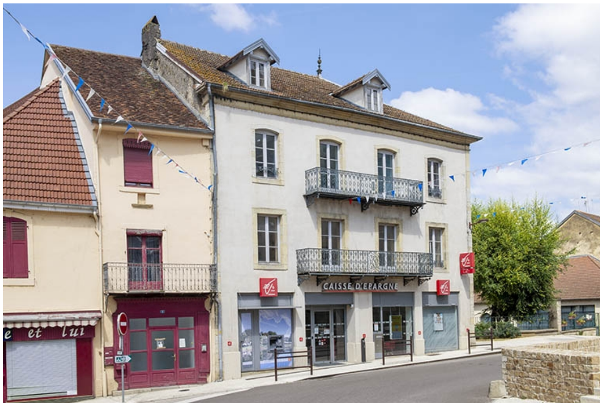
Trois quarts gauche des maisons à boutiques et immeuble aux n° 1, 3 et 5. 70, Jussey, 5-7 rue de l' hôtel de ville