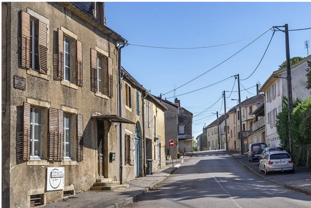
Vue vers l'est, à hauteur du n° 37, anciennement rue de la boulagerie. 70, Jussey rue de l' Hôtel de ville