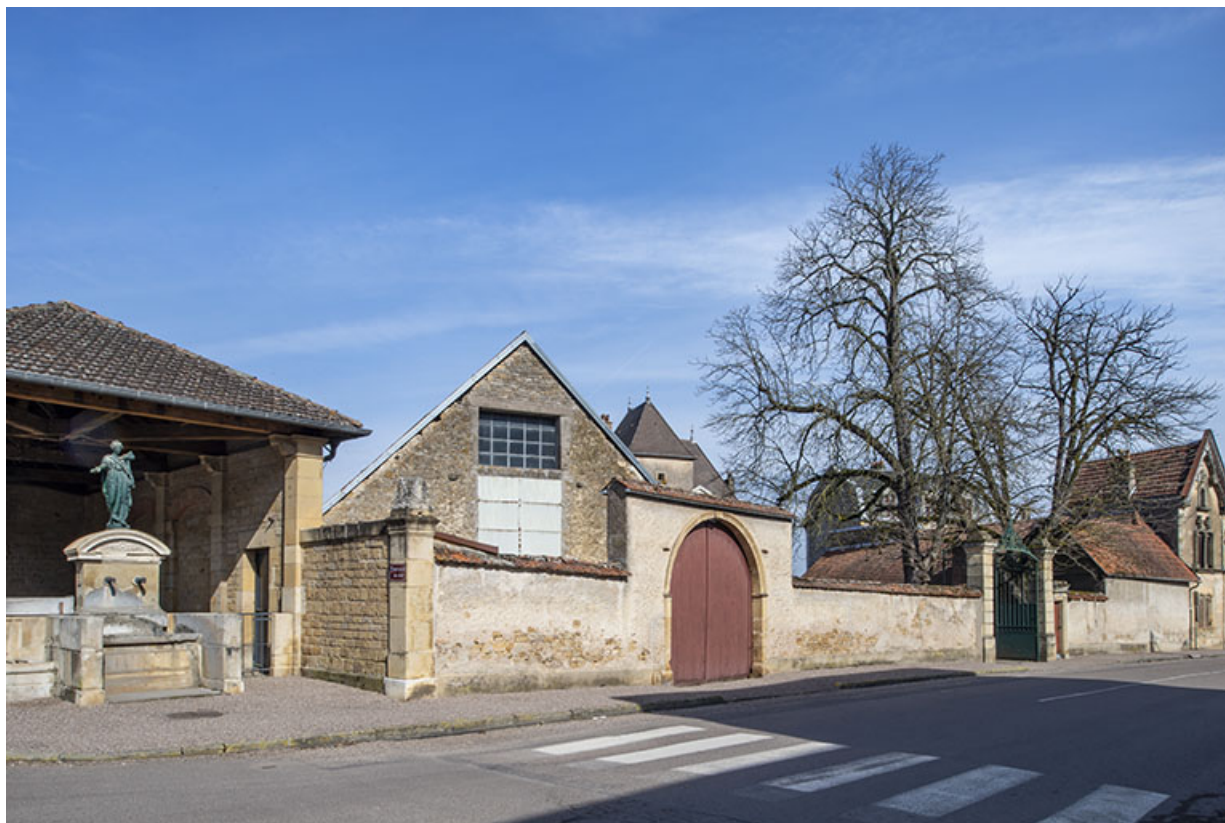
La rue avec le lavoir et les n° 27 et 29.