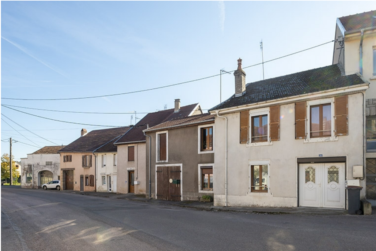
Trois quarts droit des façades des maisons, 16, 18 et suivants, vers le nord-est. 70, Jussey rue de la Pêcherie