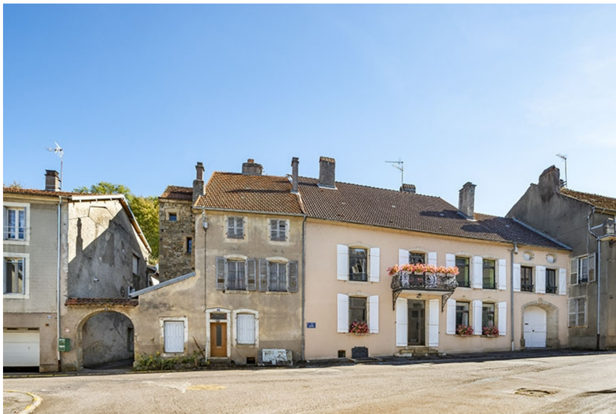
Alignement du côté pair de la rue Thiers (n° 2 à 6).