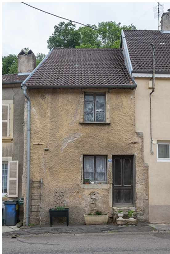
Rue Thiers, façade de la maison au n° 48. 70, Jussey rue Adolphe-Thiers