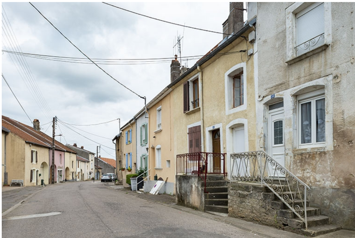
Rue Thiers, alignement du côté pair devant le n° 36, vue vers le nord-est. 70, Jussey rue Adolphe-Thiers