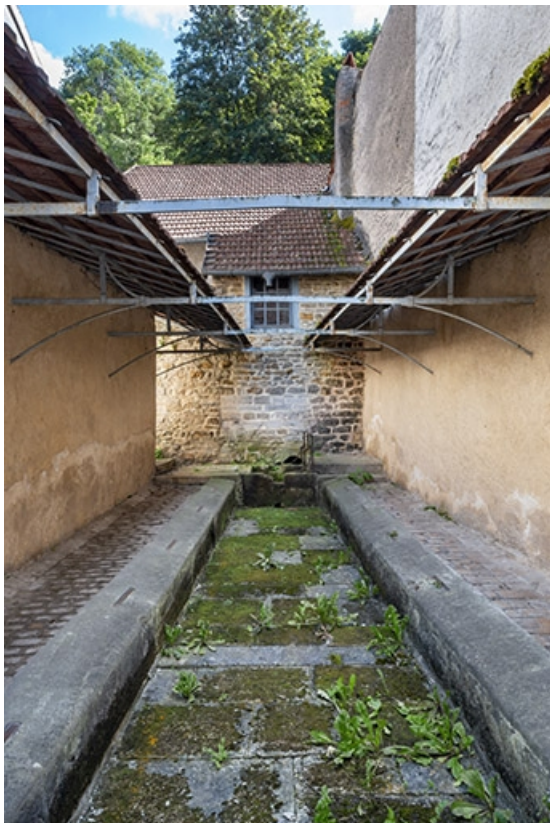
L'intérieur de la fontaine-lavoir.