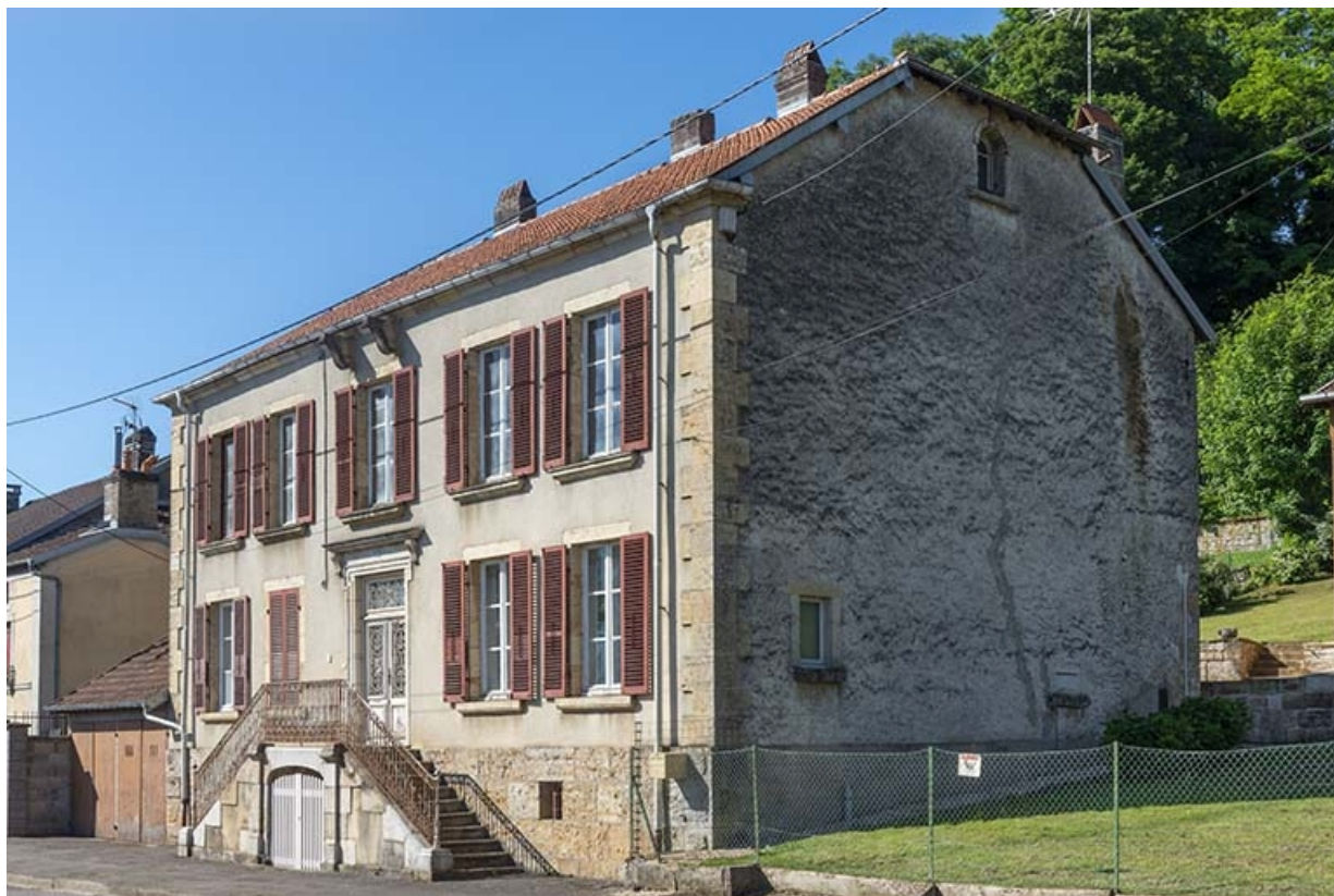
Rue Thiers, trois quarts de la demeure n° 106. 70, Jussey rue Adolphe-Thiers