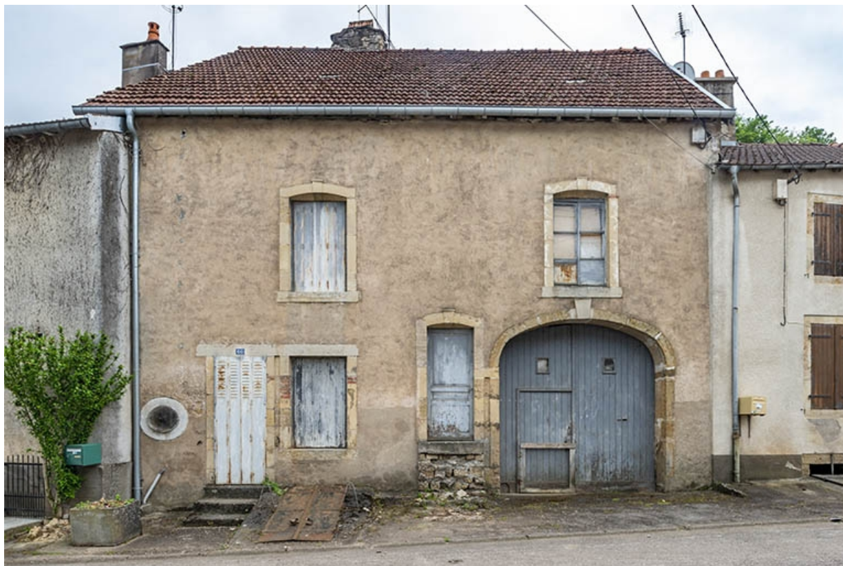
Rue Thiers, maison au n° 60. 70, Jussey rue Adolphe-Thiers