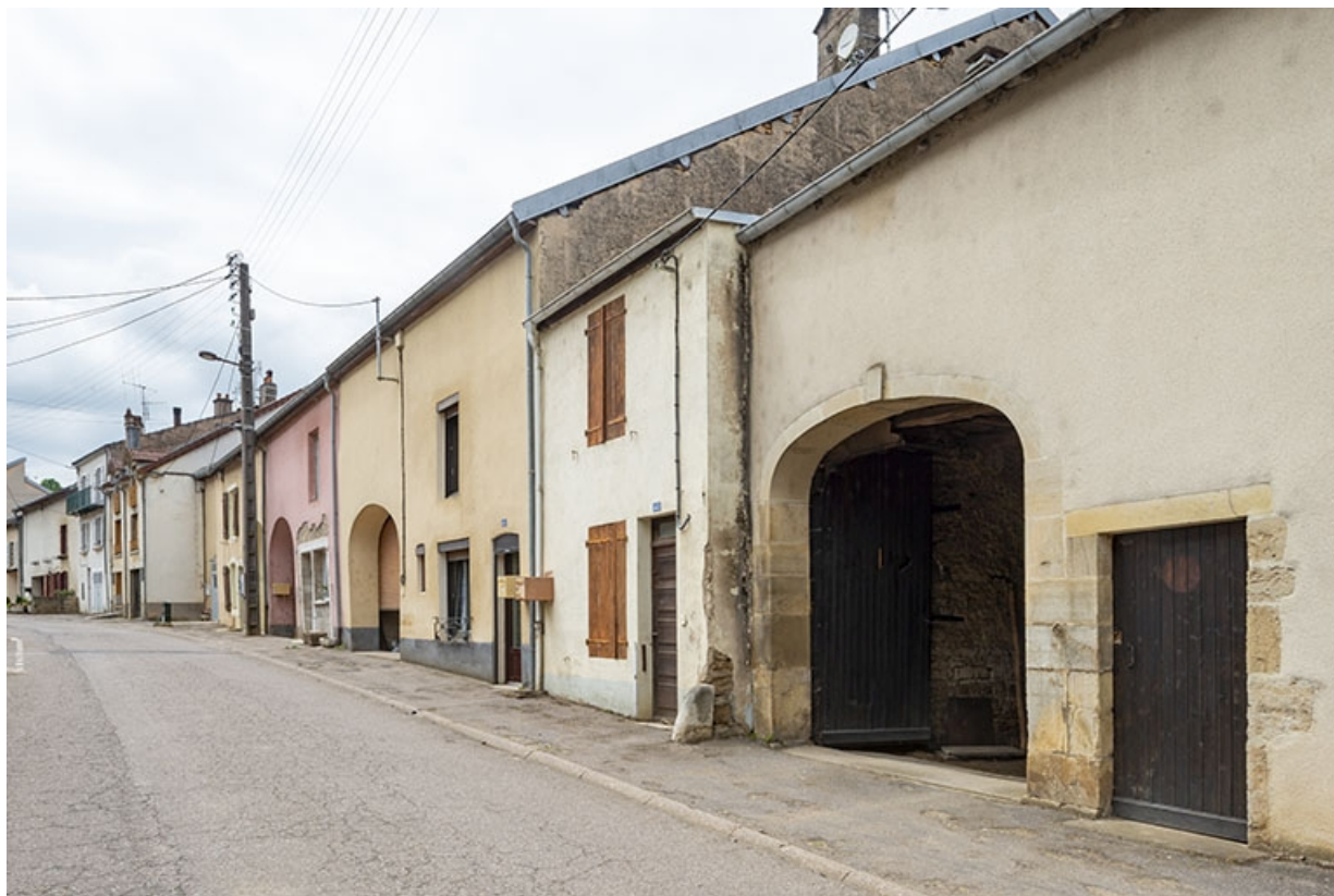
Rue Thiers, alignement du côté impair devant le n° 45, vue vers l'ouest. 70, Jussey rue Adolphe-Thiers