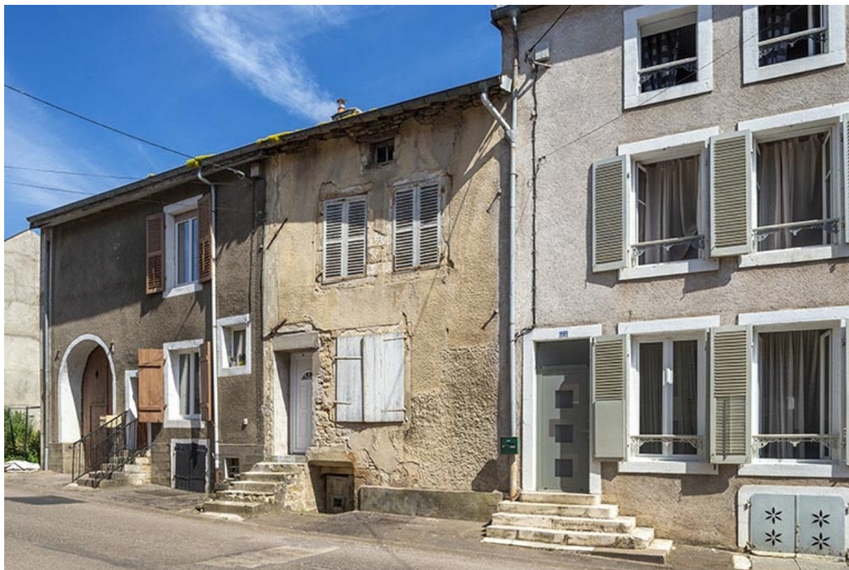
Rue Thiers, alignement du côté pair devant le n° 22, vue vers le nord-est. 70, Jussey rue Adolphe-Thiers