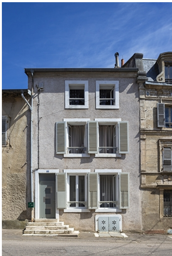
Rue Thiers, façade de la maison n° 22.