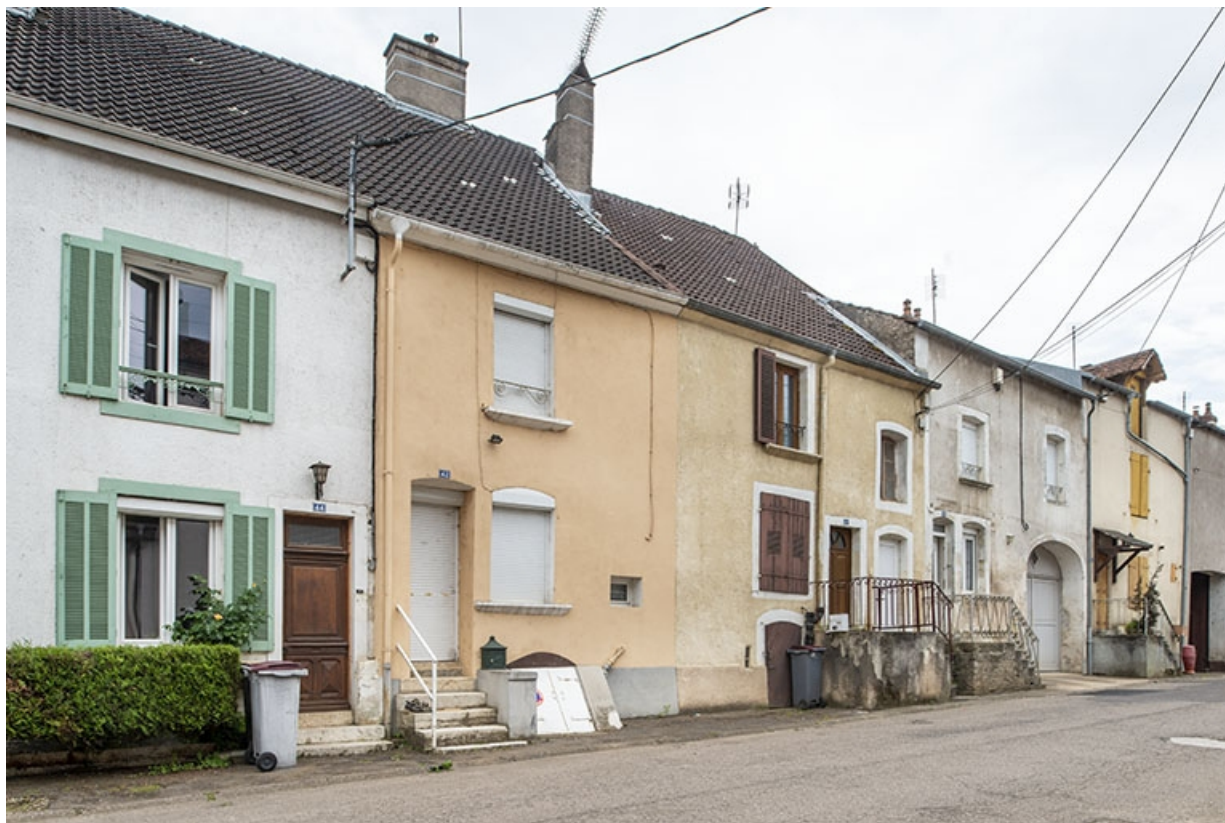
Rue Thiers, alignement du côté pair devant le n° 44, vers le sud-ouest. 70, Jussey rue Adolphe-Thiers