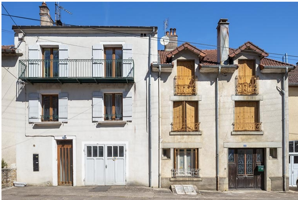
Rue Thiers, façades des maisons n° 31 et 33. 70, Jussey rue Adolphe-Thiers