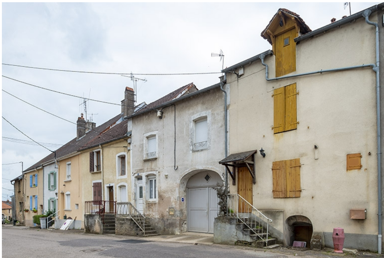
Rue Thiers, alignement du côté pair devant le n° 34, vue vers le nord-est. 70, Jussey rue Adolphe-Thiers