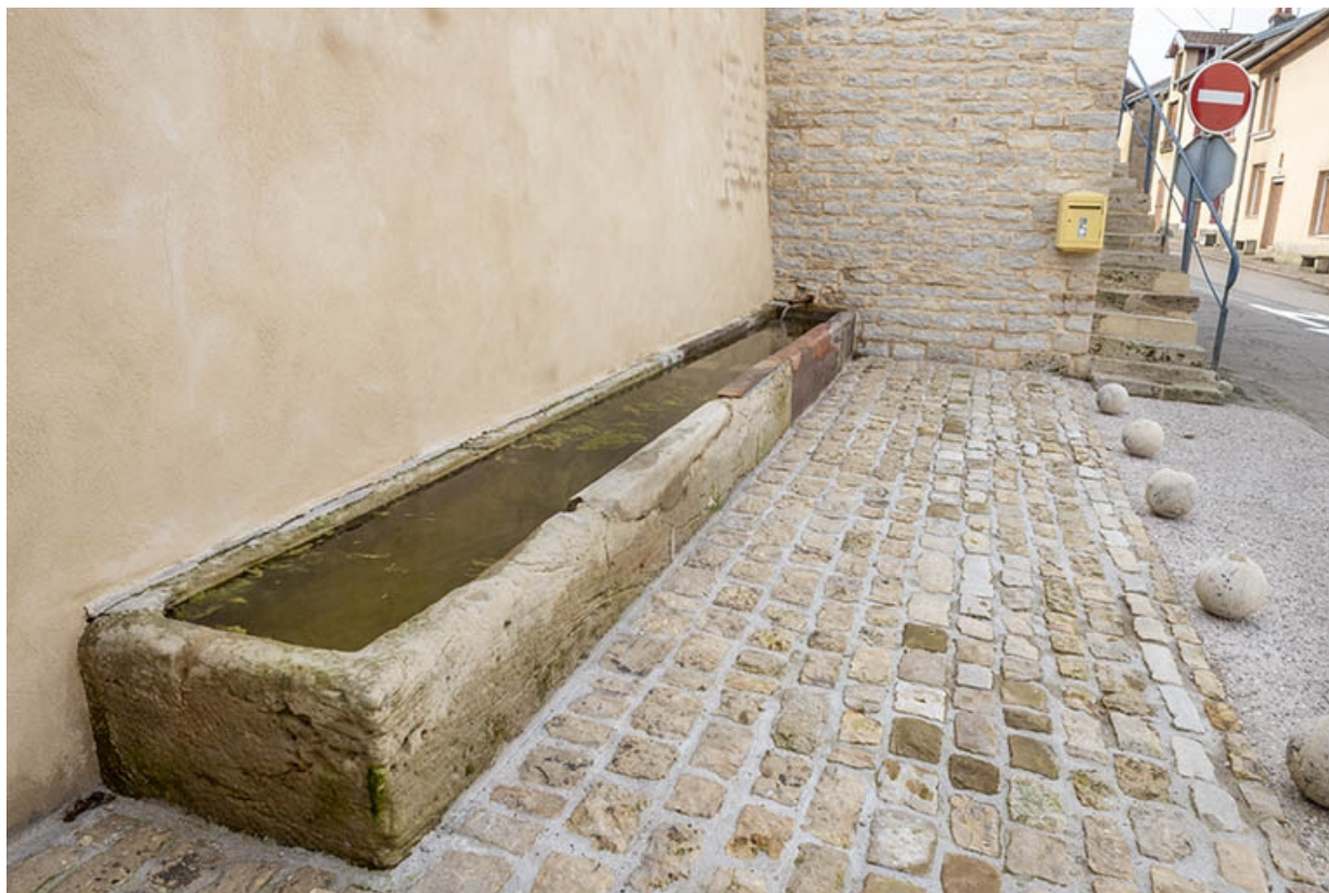
Rue Thiers, trois quarts gauche de l'abreuvoir, à hauteur du n° 74. 70, Jussey rue Adolphe-Thiers, lieudit : La Lanterne