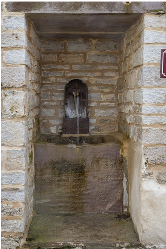
Rue Thiers, fontaine dite Petite fontaine, à hauteur du n° 74. 70, Jussey rue Adolphe-Thiers, lieudit : La Lanterne