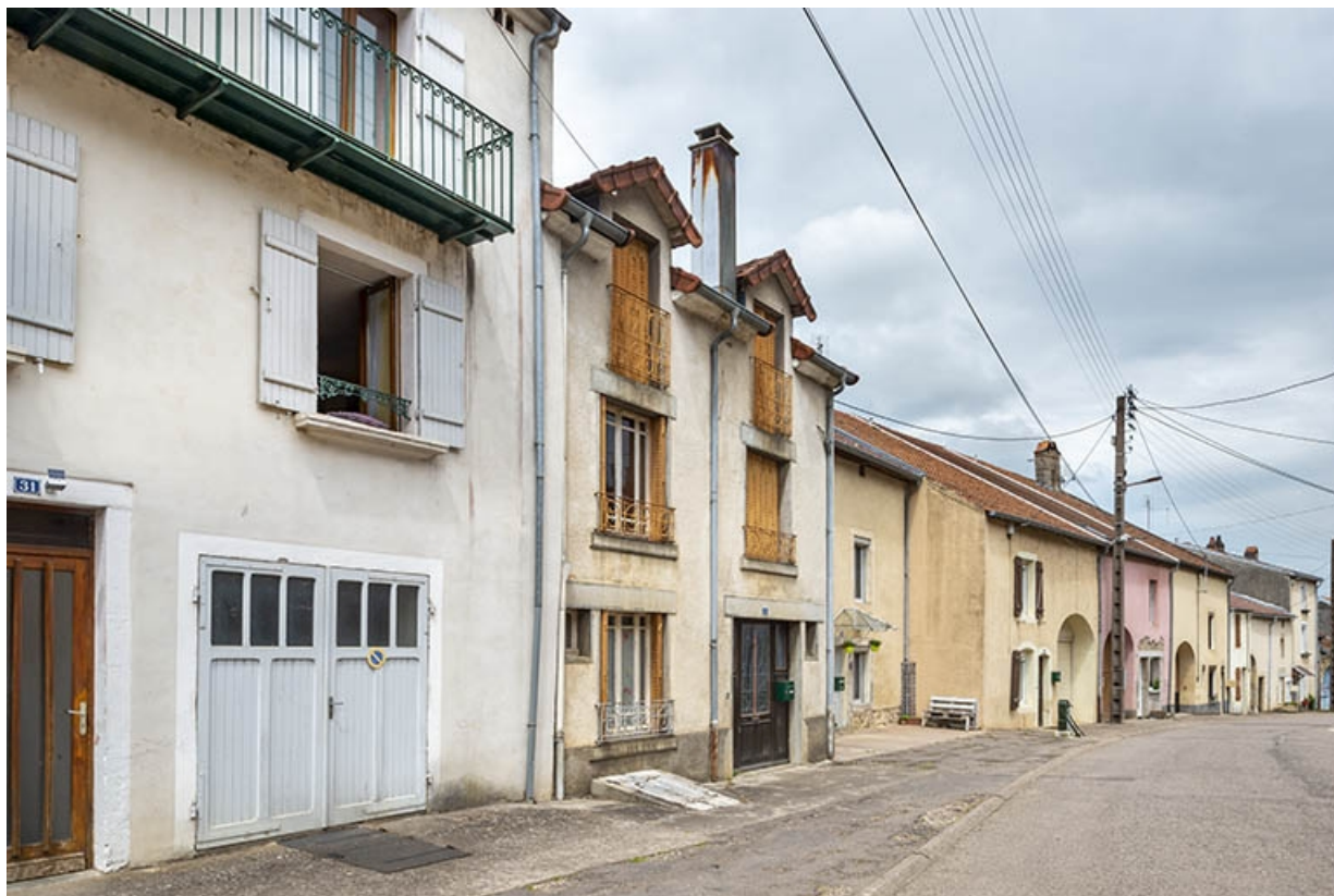
Rue Thiers, alignement du côté impair devant le n° 31, vue vers le nord-est. 70, Jussey rue Adolphe-Thiers