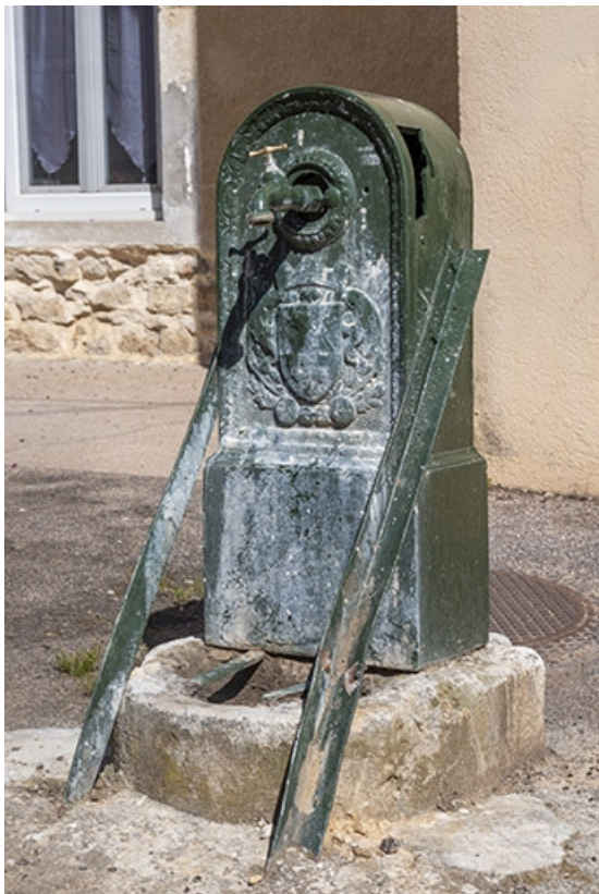
Rue Thiers, la borne fontaine au n° 37.

70, Jussey rue Adolphe-Thiers, lieudit : La Lanterne