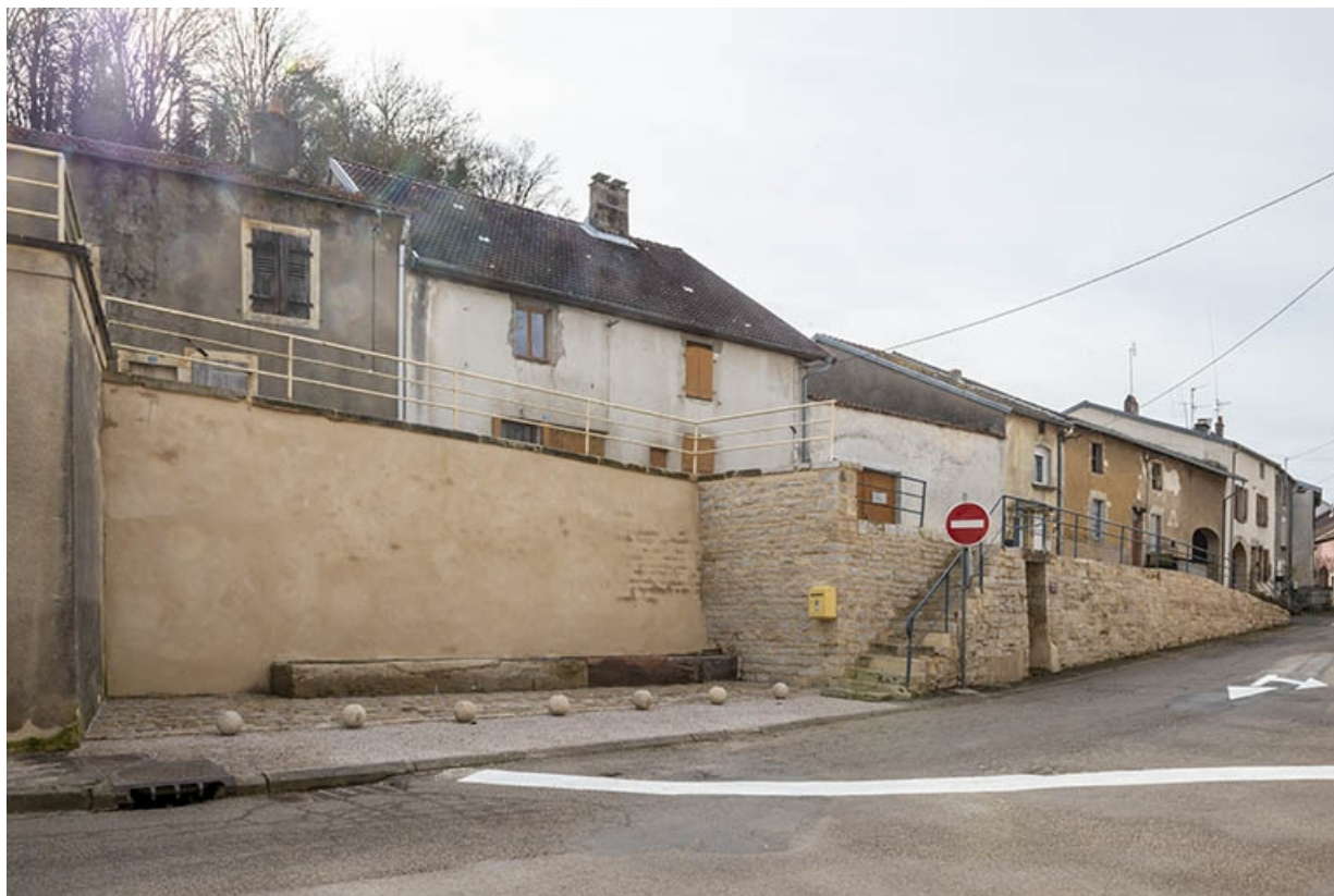
Rue Thiers, trois quarts gauche de la fontaine dite Petite fontaine et de l'abreuvoir, à hauteur du n° 74. 70, Jussey rue Adolphe-Thiers, lieudit : La Lanterne