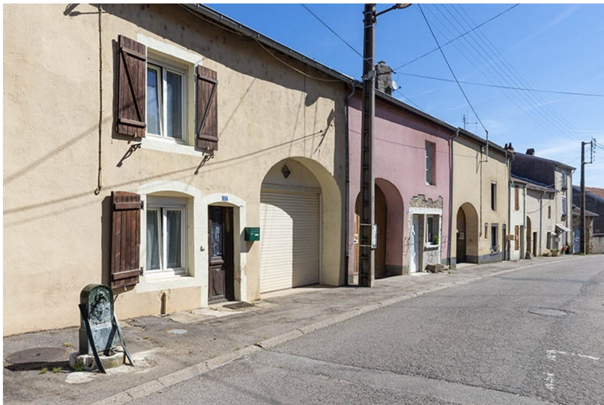
Rue Thiers, alignement du côté impair devant le n° 35, vue vers le nord-est. 70, Jussey rue Adolphe-Thiers