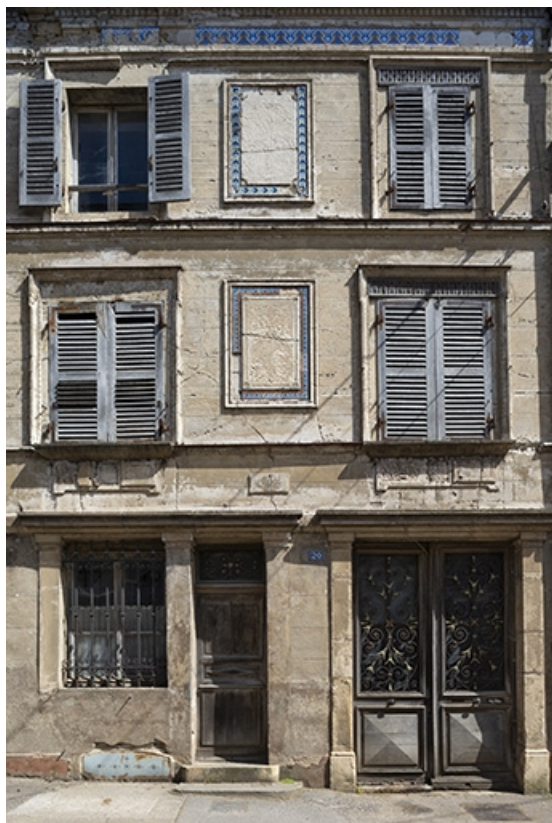
Le rez-de-chaussée et les deux étages carrés.