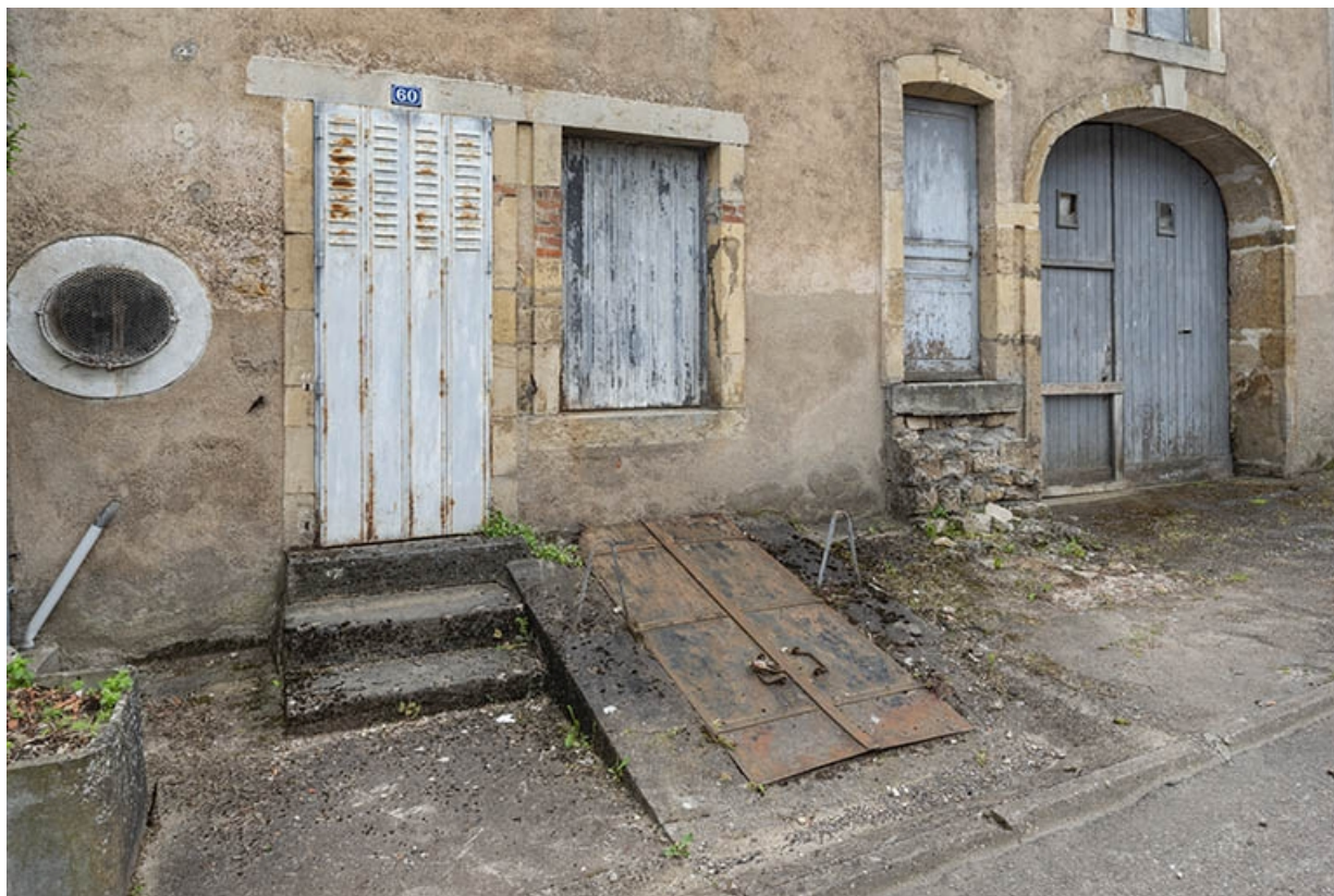
Rue Thiers, rez-de-chaussée du n° 60. 70, Jussey rue Adolphe-Thiers