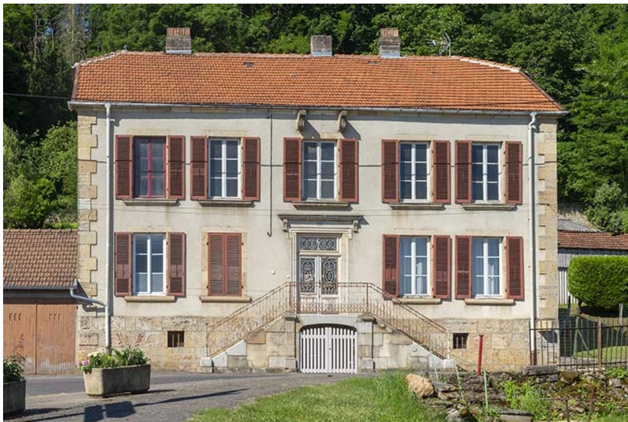
Rue Thiers, façade de la demeure n° 106. 70, Jussey rue Adolphe-Thiers