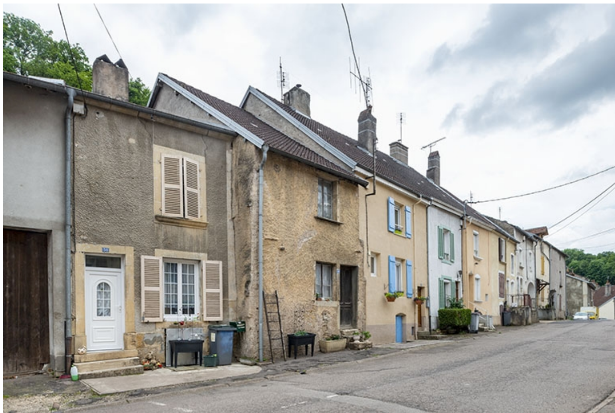
Rue Thiers, alignement du côté pair devant le n° 52, vers le sud-ouest. 70, Jussey rue Adolphe-Thiers