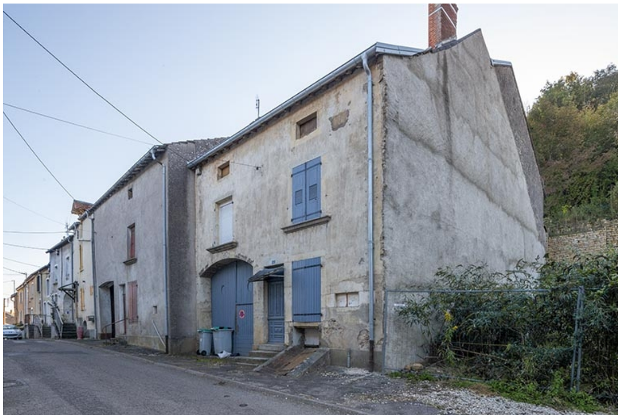
Rue Thiers, alignement du côté pair devant le n° 32, vue vers le nord-est. 70, Jussey rue Adolphe-Thiers