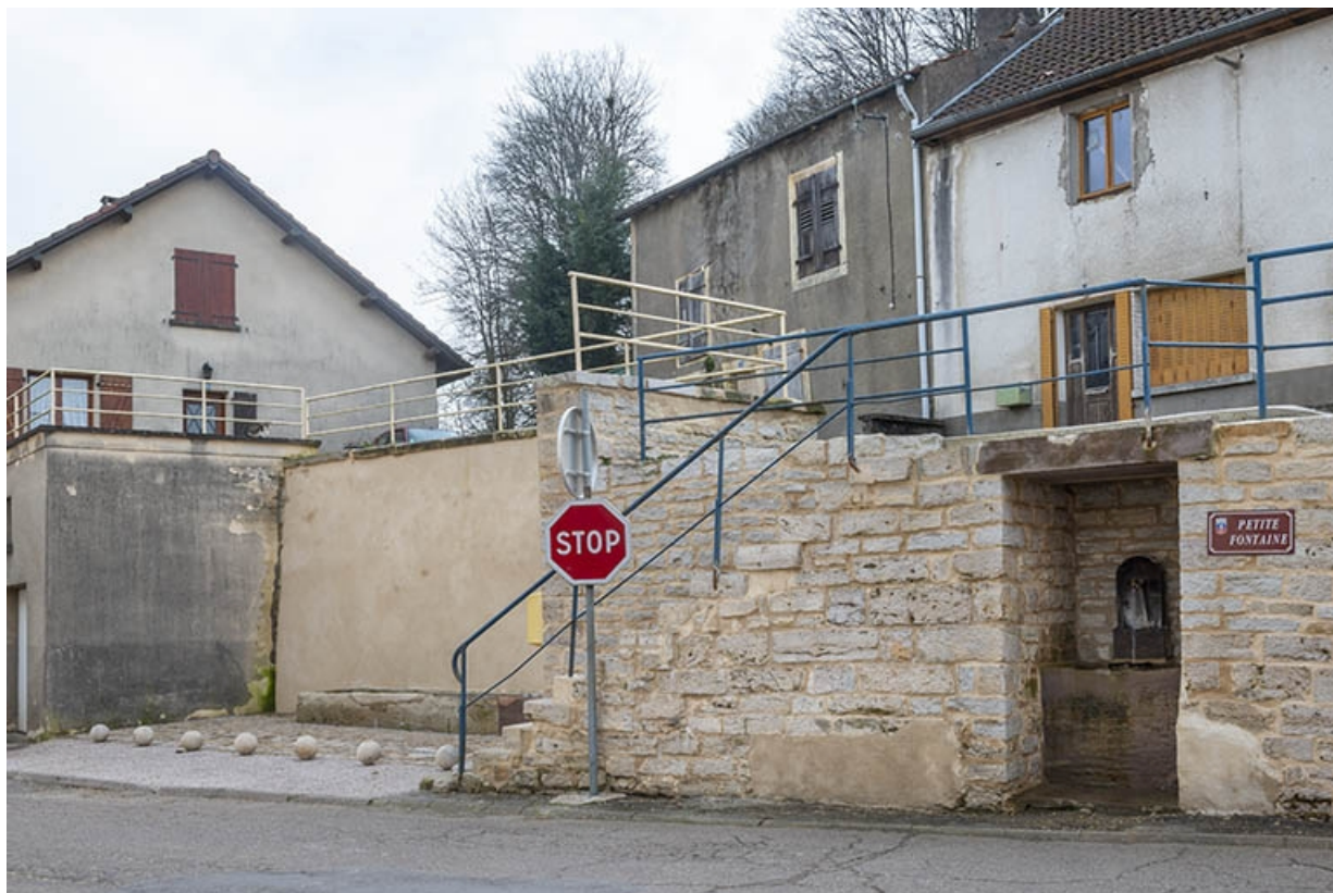
Rue Thiers, trois quarts droit de la fontaine dite Petite fontaine et de l'abreuvoir, à hauteur du n° 74. 70, Jussey rue Adolphe-Thiers, lieudit : La Lanterne