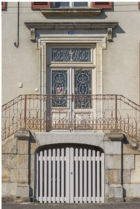
Rue Thiers, entrées de sous-sol et du rez-de-chaussée surélevé de la demeure n° 106. 70, Jussey rue Adolphe-Thiers