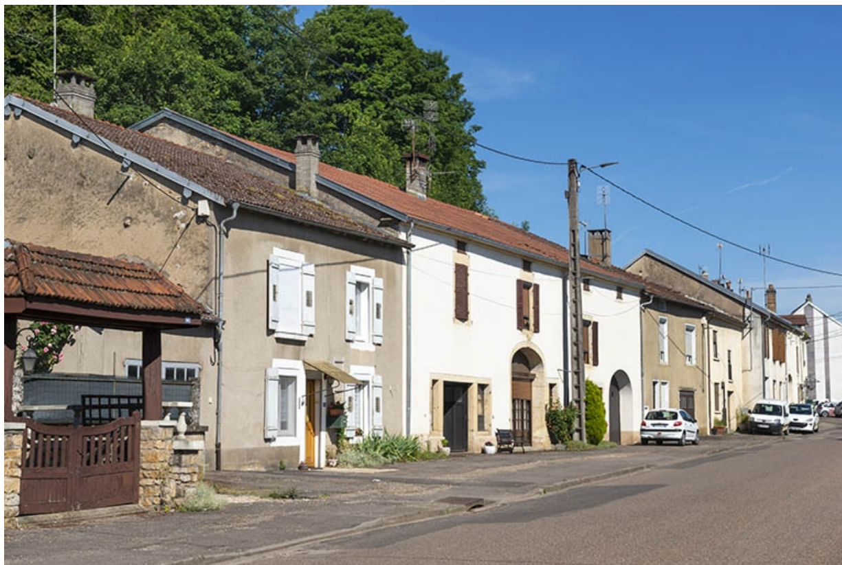
Rue Thiers, alignement des façades du côté pair vers le nord-ouest, à hauteur du n° 102. 70, Jussey rue Adolphe-Thiers