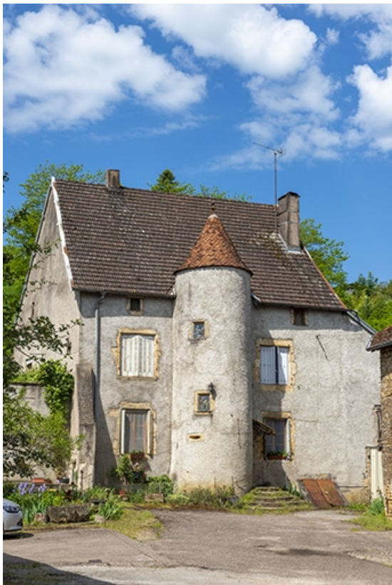
La façade antérieure depuis la rue.