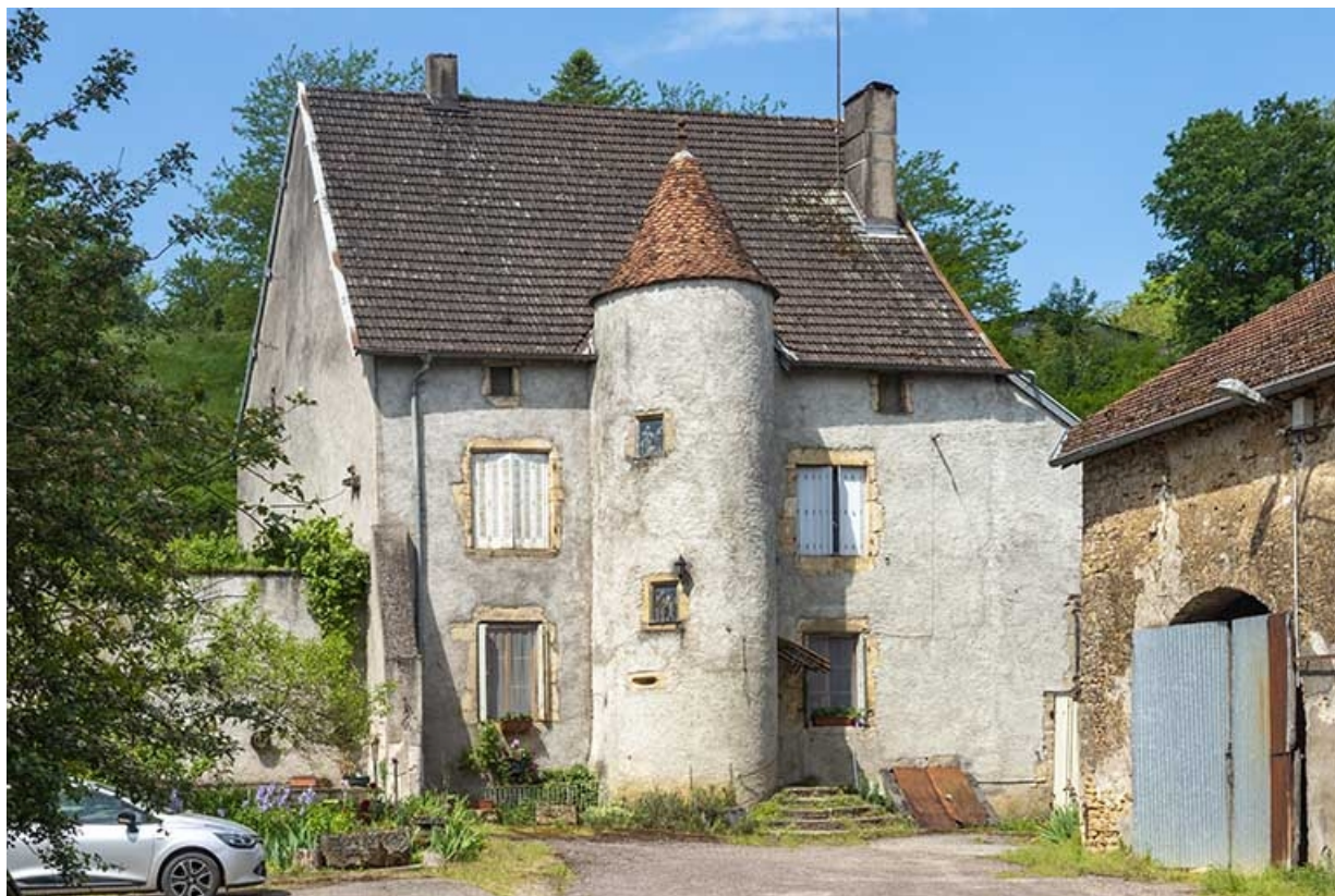
La façade antérieure depuis la rue.