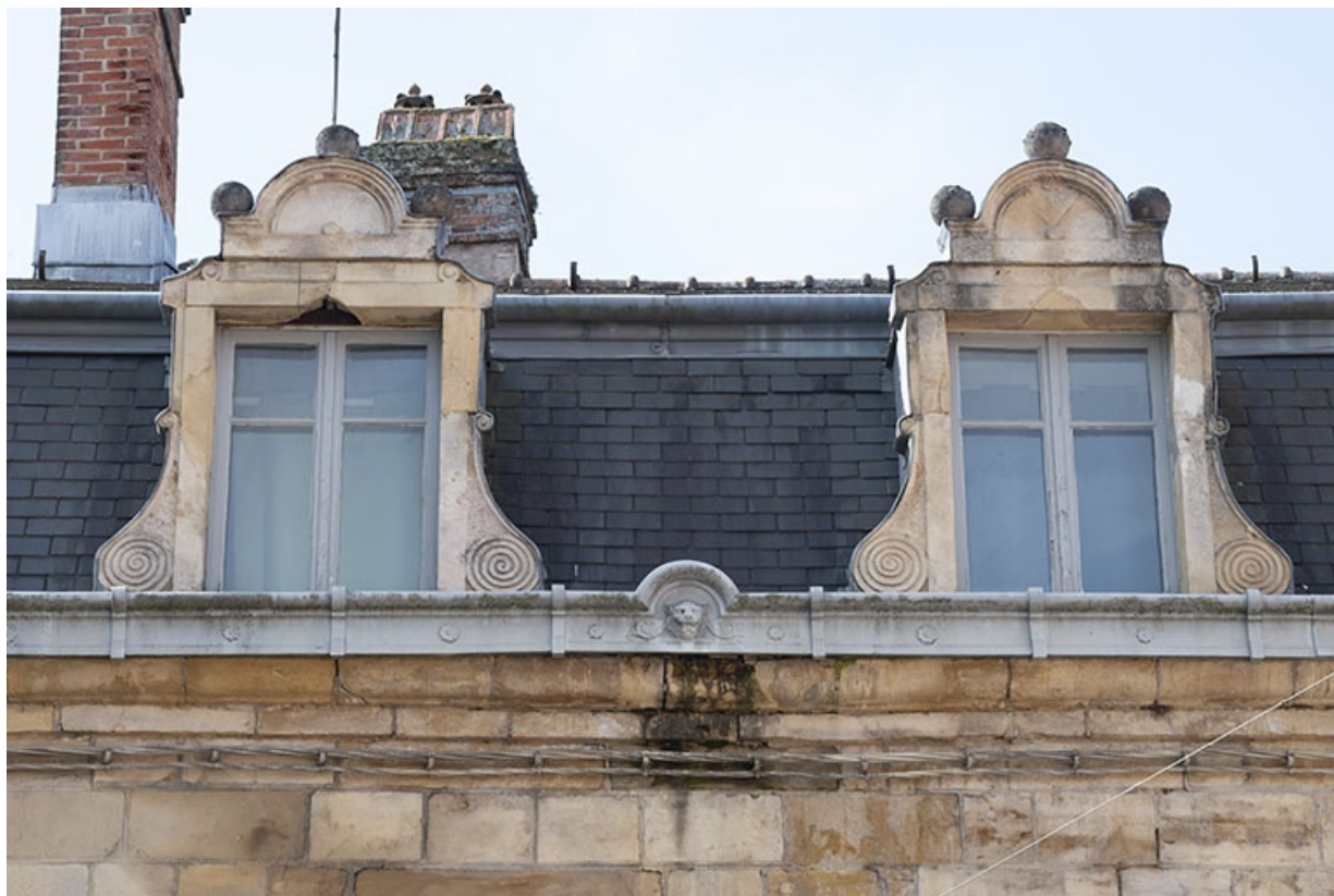
La rue Gambetta : n° 1, lucarnes.