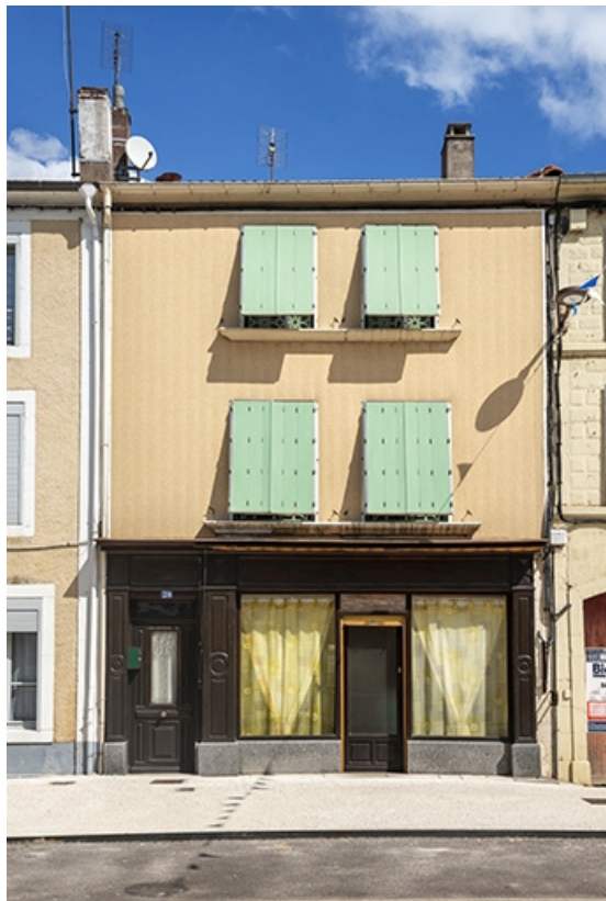
La rue Gambetta : n° 70. 70, Jussey rue Gambetta