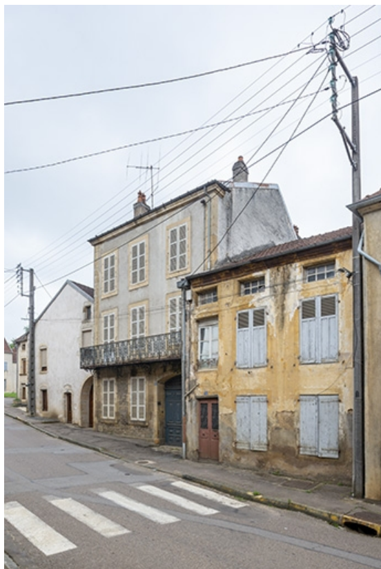
La rue Bontemps : n° 34 et 36.