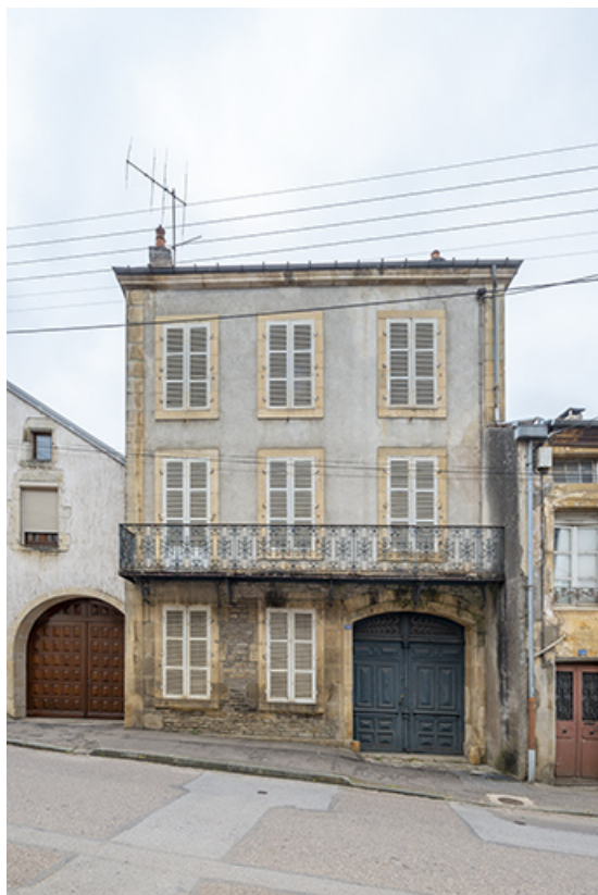
La rue Bontemps : n° 36. 70, Jussey rue Gambetta