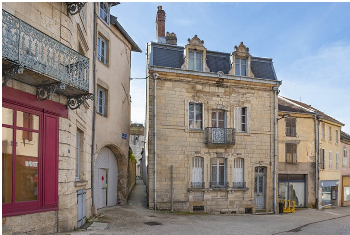
La rue Gambetta : n° 1. 70, Jussey rue Gambetta