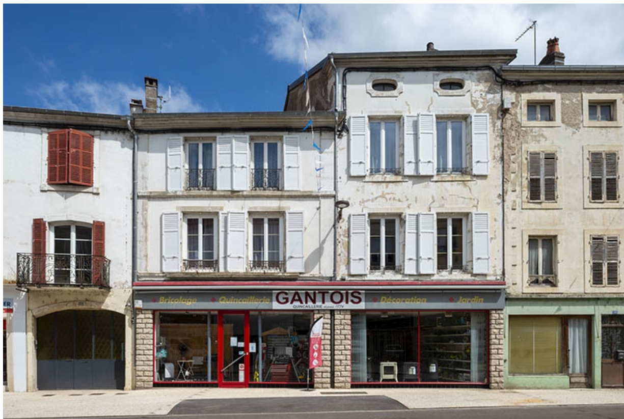
La rue Gambetta : n° 60. 70, Jussey rue Gambetta