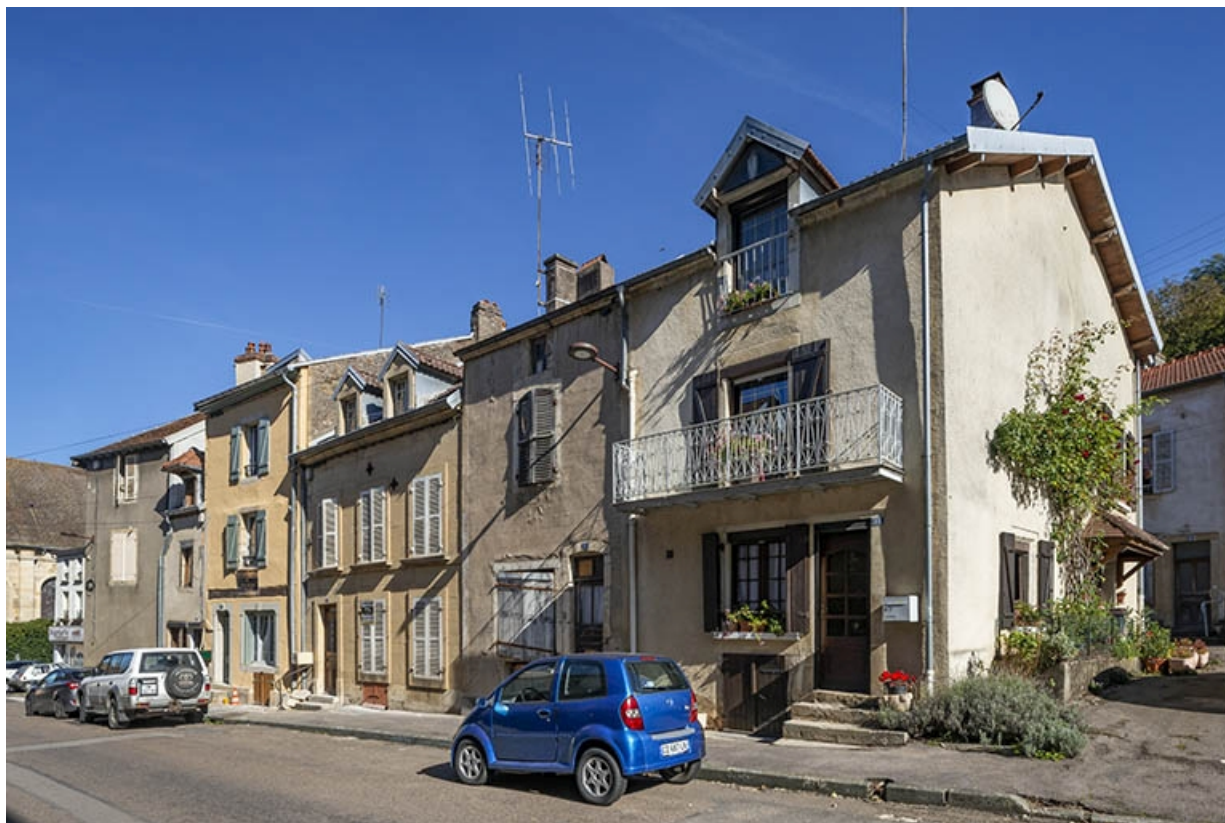
La rue Bontemps : n° 15 à 9. 70, Jussey rue Gambetta