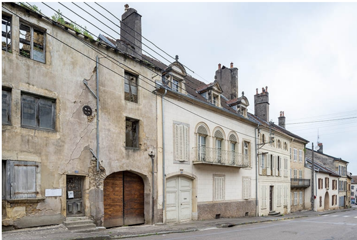
La rue Bontemps : n° 28 à 18. 70, Jussey rue Gambetta