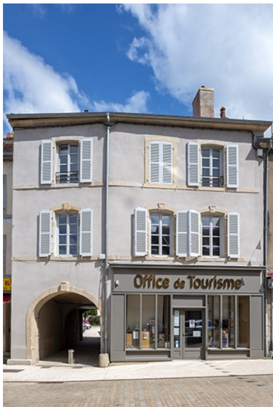
La rue Gambetta : n° 18. 70, Jussey rue Gambetta