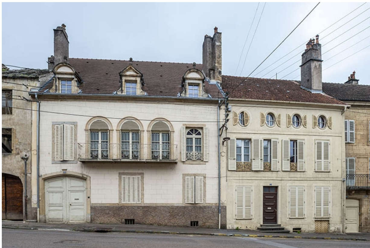
La rue Bontemps : n° 24 et 26.