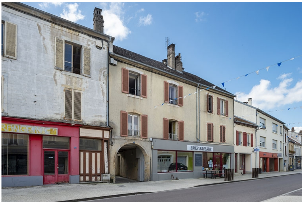
La rue Gambetta : n° 53 et suivants.