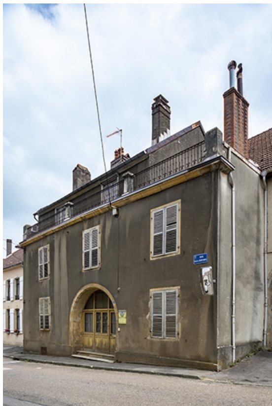
La rue Bontemps : n° 17 de trois quarts.