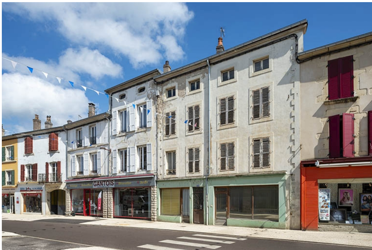
La rue Gambetta : n° 56 à 60. 70, Jussey rue Gambetta