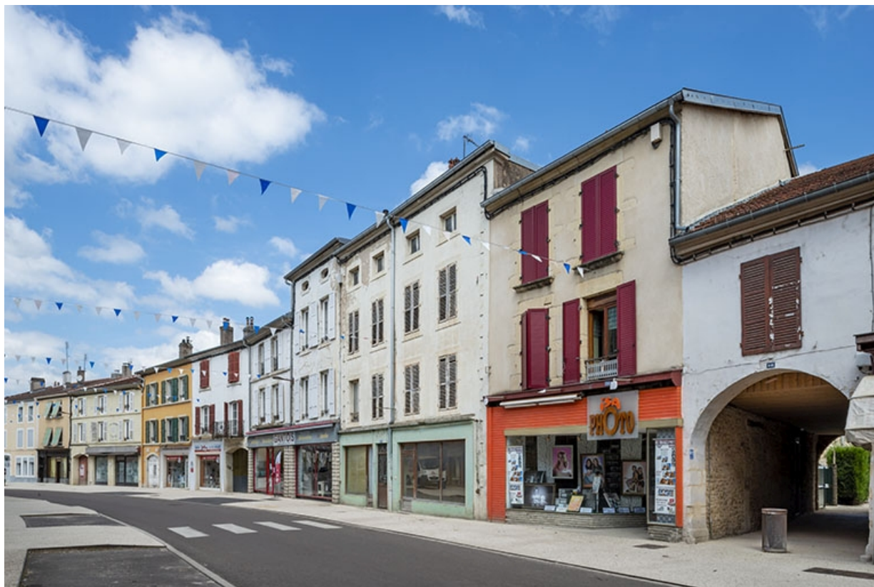
La rue Gambetta : n° 54 et suivants. 70, Jussey rue Gambetta