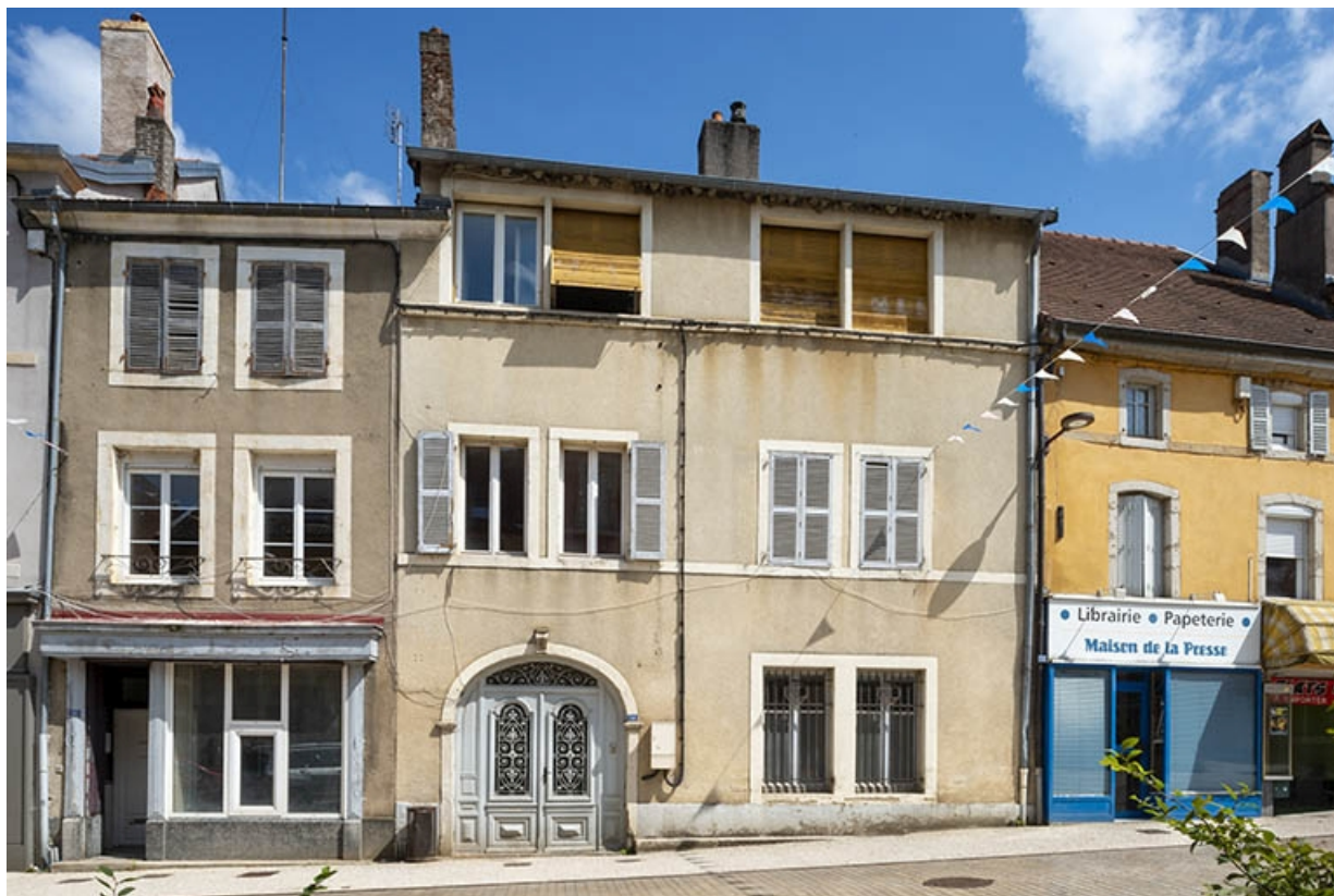
La rue Gambetta : n° 14. 70, Jussey rue Gambetta