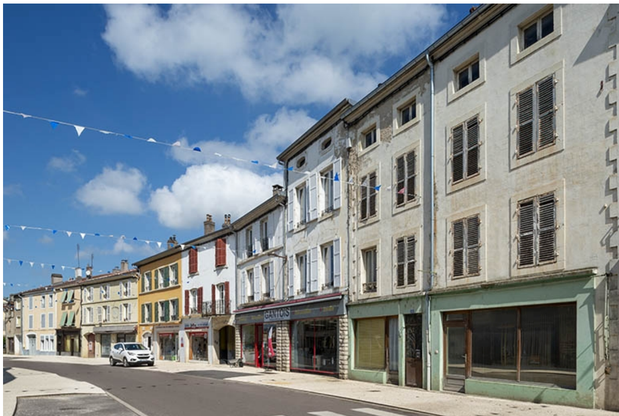
La rue Gambetta : n° 56 à 60. 70, Jussey rue Gambetta