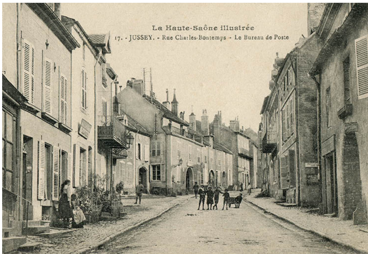
L'entrée de la rue Charles-Bontemps au début du 20e siècle.