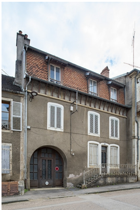
La rue Bontemps : n° 25. 70, Jussey rue Gambetta