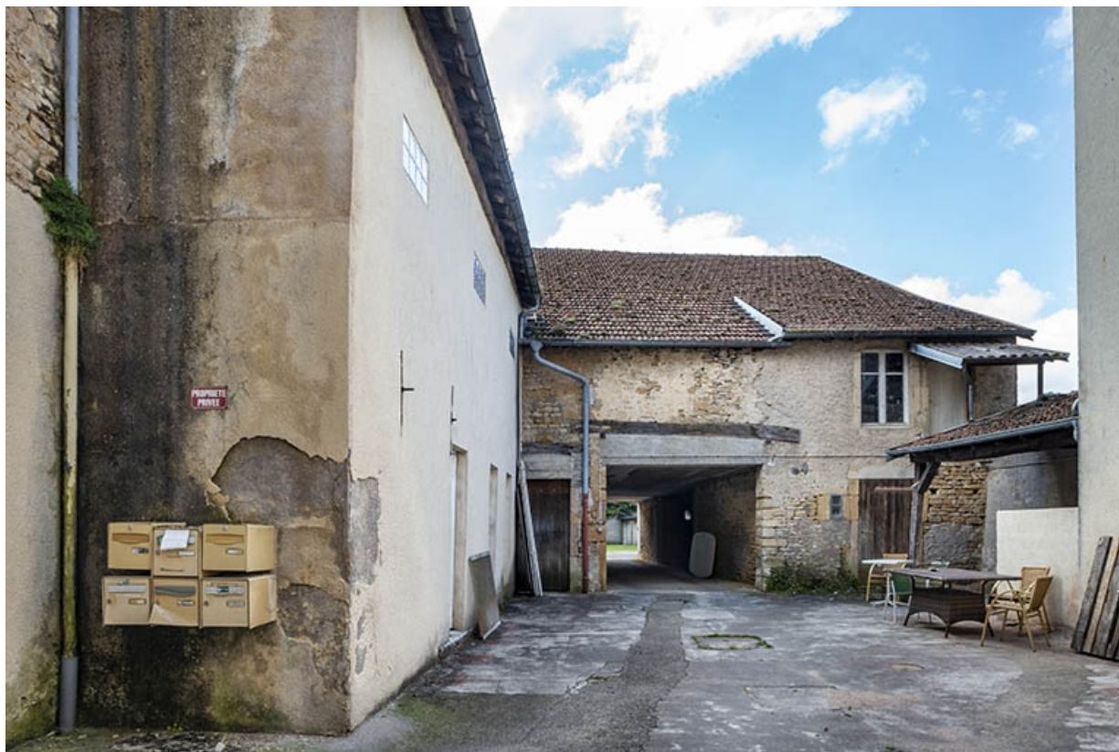
La rue Gambetta : n° 55, la cour vue en direction du sud. 70, Jussey rue Gambetta