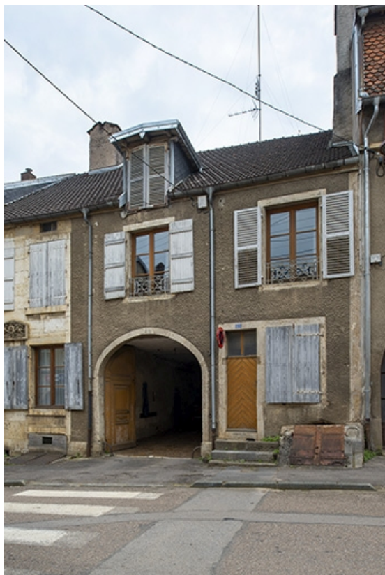
La rue Bontemps : n° 23, avec entrée de cave et porte cochère. 70, Jussey rue Gambetta