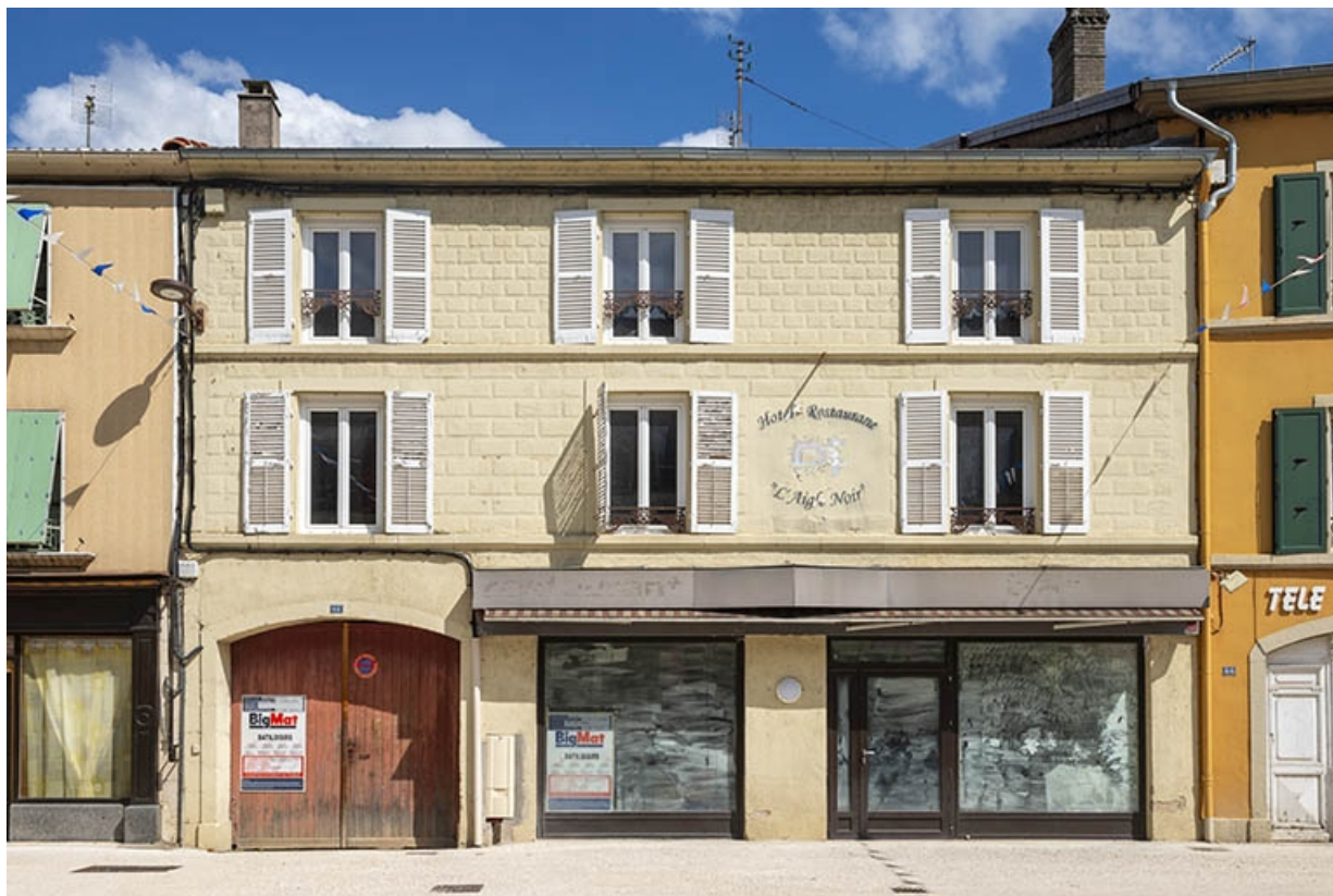
La rue Gambetta : n° 68. 70, Jussey rue Gambetta