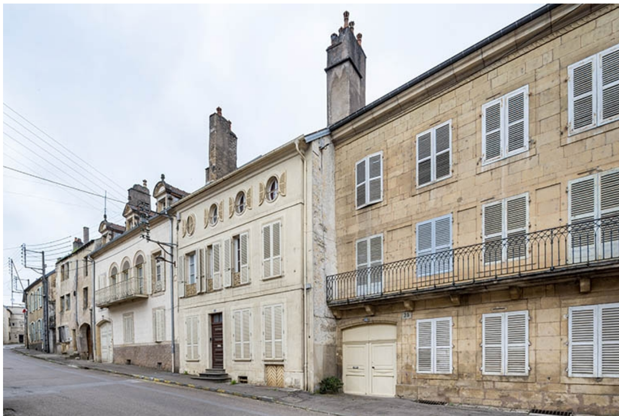
La rue Bontemps : n° 22 à 28. 70, Jussey rue Gambetta