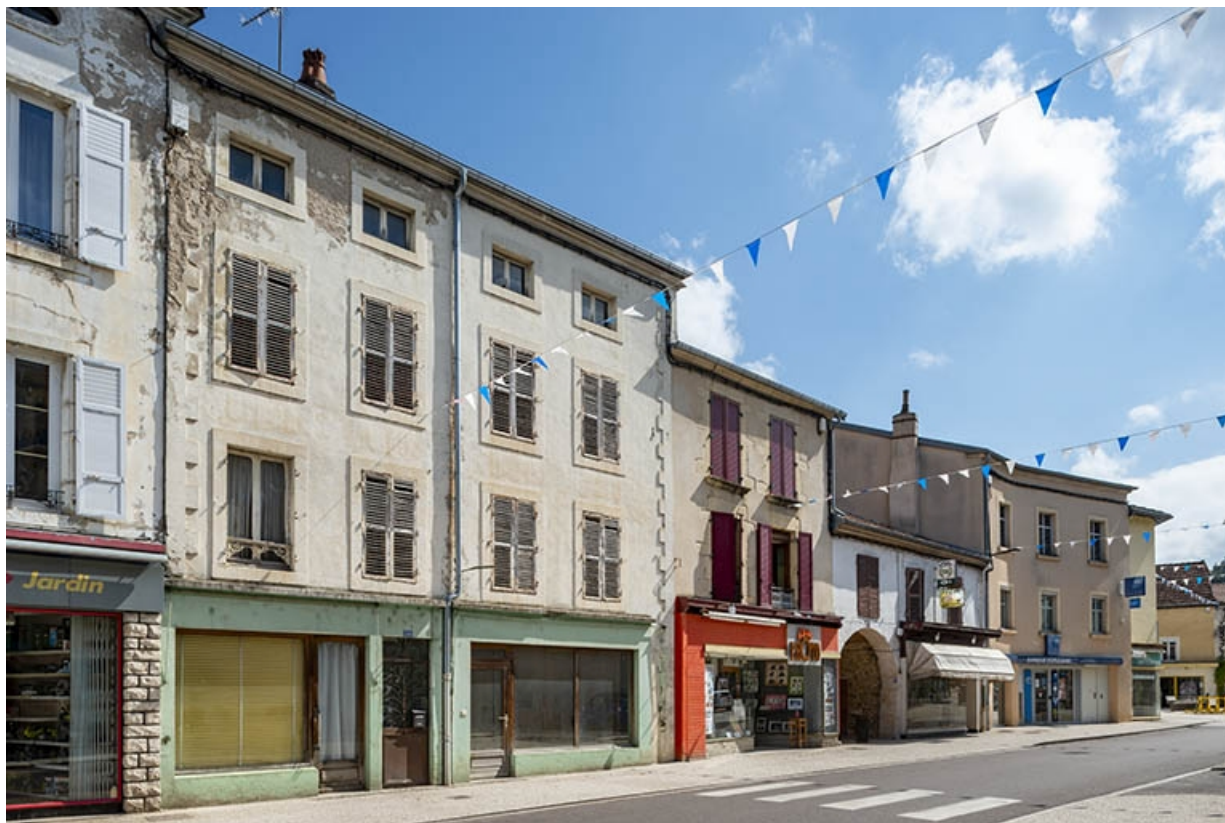
La rue Gambetta : n° 66 et précédents. 70, Jussey rue Gambetta