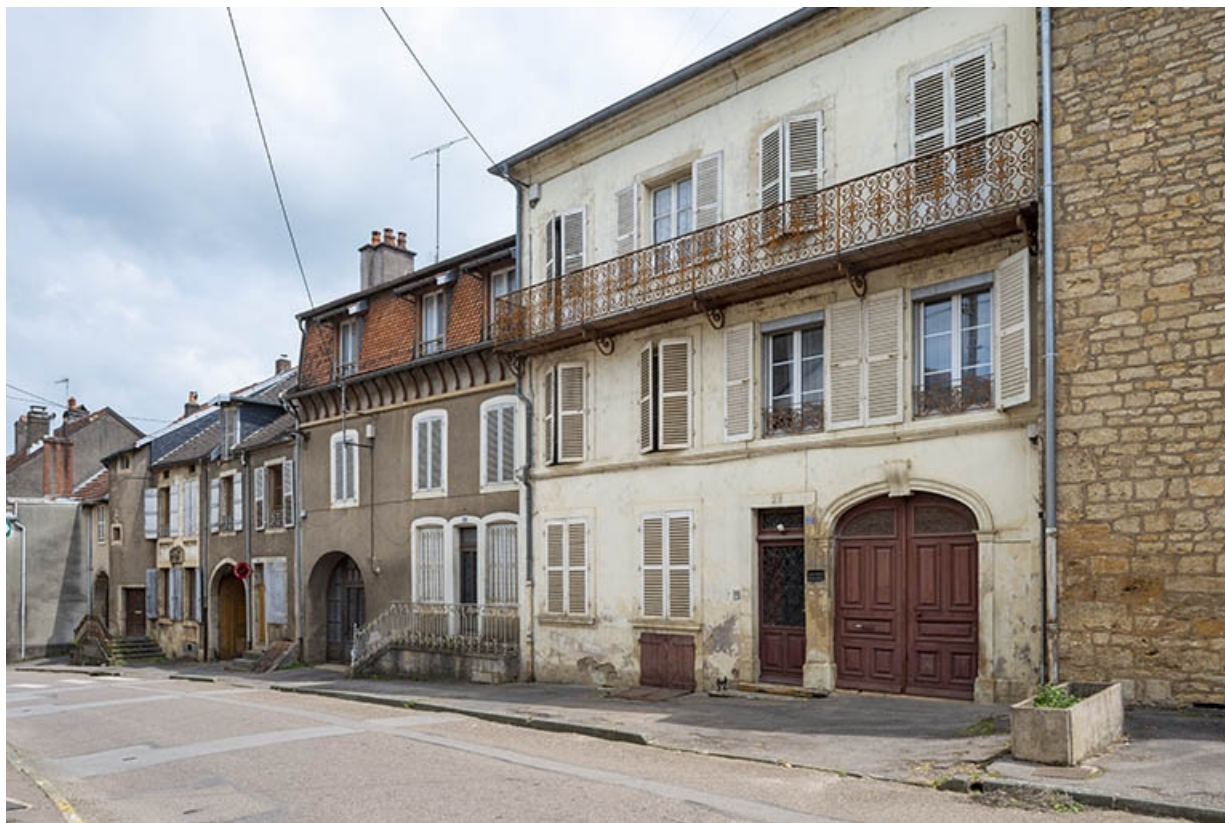
La rue Bontemps : n° 17 à 27. 70, Jussey rue Gambetta