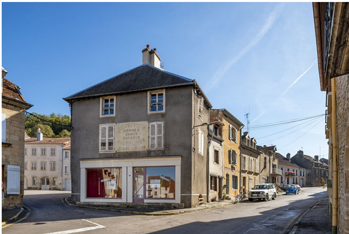
La rue Bontemps : n° 5, face nord et perspective de la rue vers le sud. 70, Jussey rue Gambetta