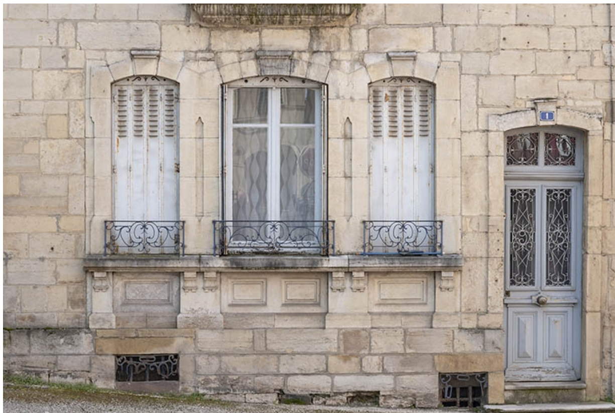
La rue Gambetta : n° 1, rez-de-chaussée. 70, Jussey rue Gambetta