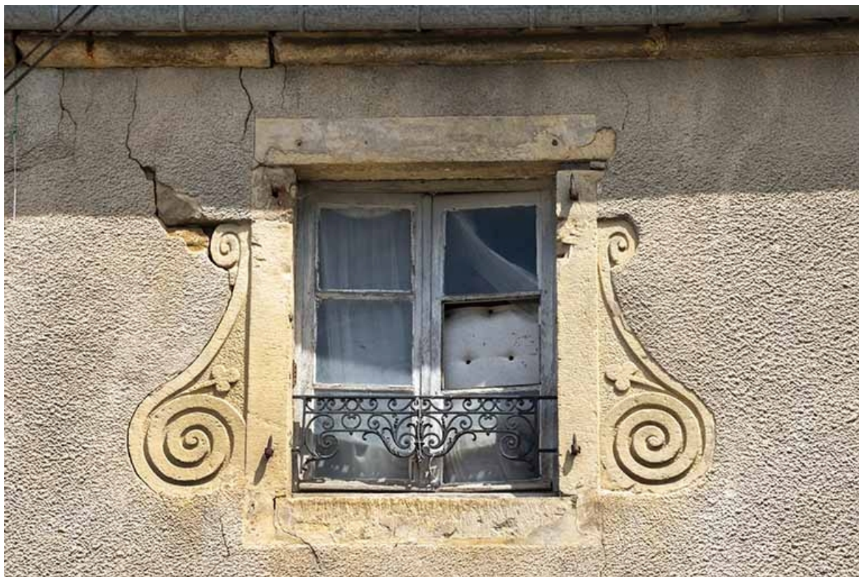
La rue Bontemps : n° 35, détail des ailerons encadrant la fenêtre du 2e étage. 70, Jussey rue Gambetta