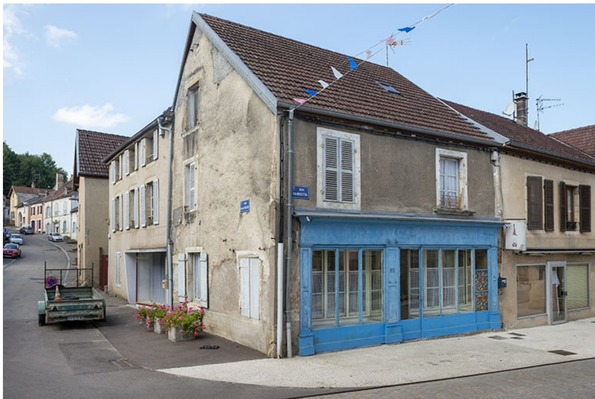
La rue Gambetta : n° 21 et entrée de la rue Decaen. 70, Jussey rue Gambetta