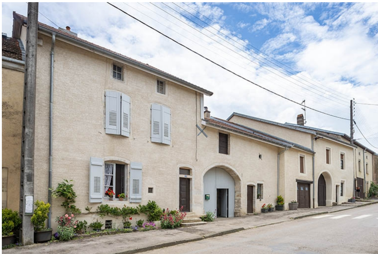
La rue Bontemps : n° 39 et 41 en direction du sud. 70, Jussey rue Gambetta