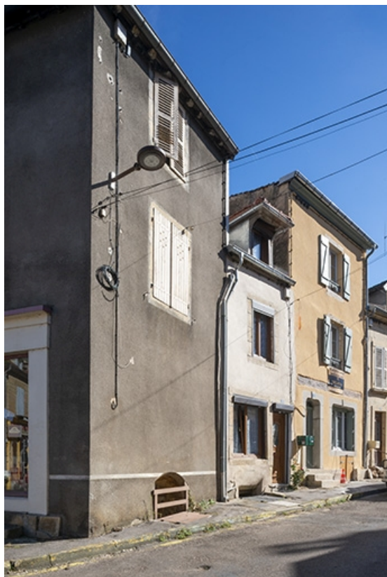
La rue Bontemps : n° 7 et 9.