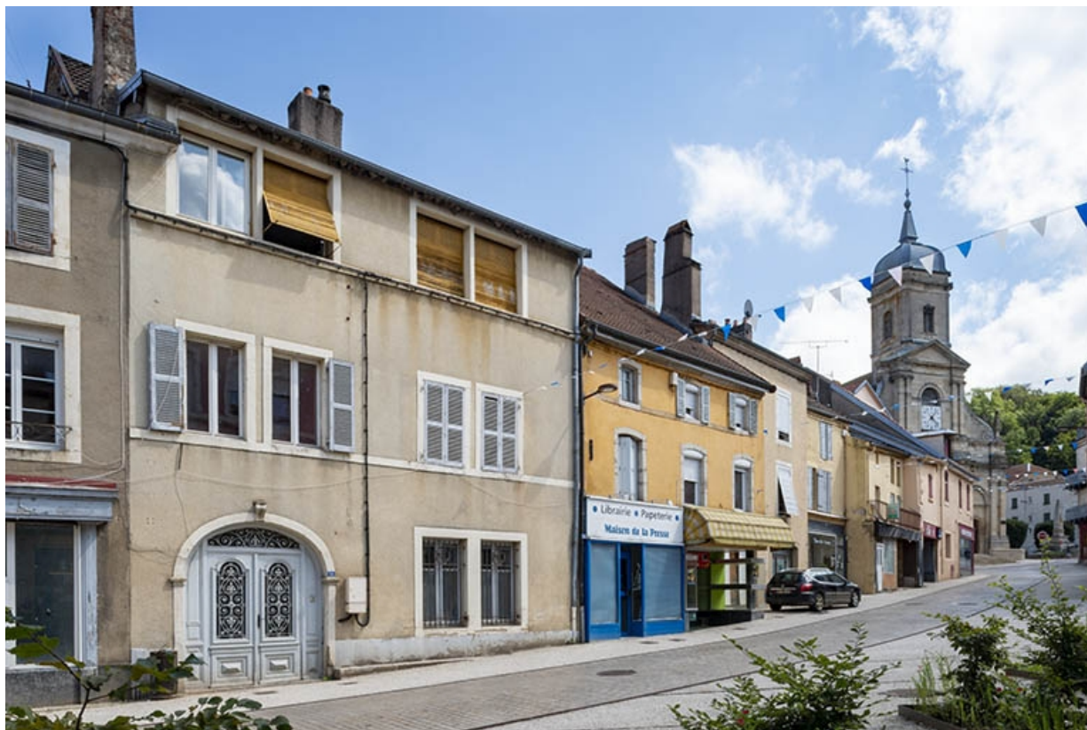
La rue Gambetta : n° 2 à 14. 70, Jussey rue Gambetta