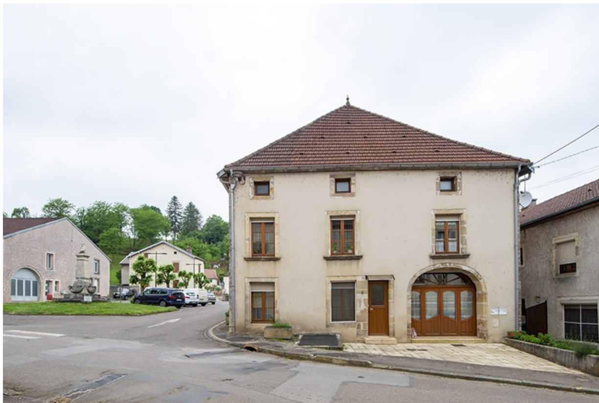
La rue Bontemps : n° 40. 70, Jussey rue Gambetta