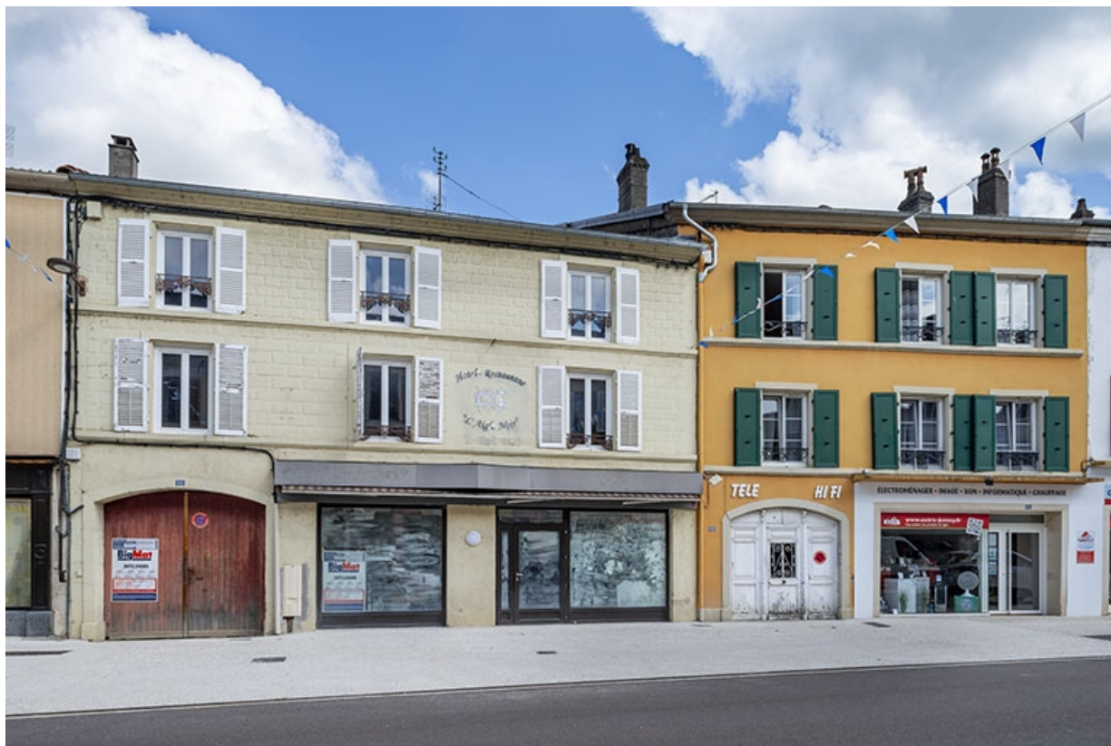
La rue Gambetta : n° 66 et 68. 70, Jussey rue Gambetta