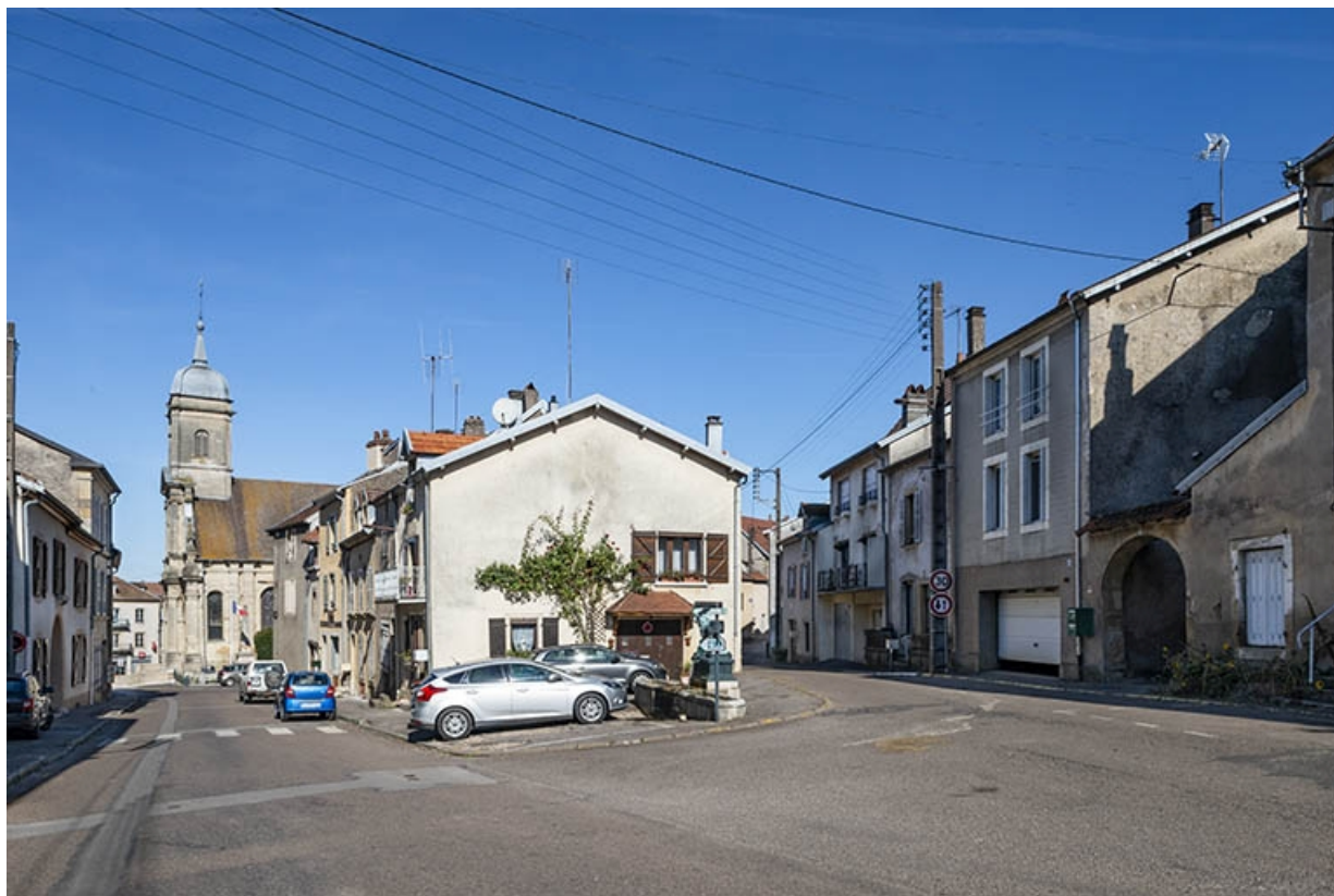
La rue Bontemps : croisement de la rue Thiers.