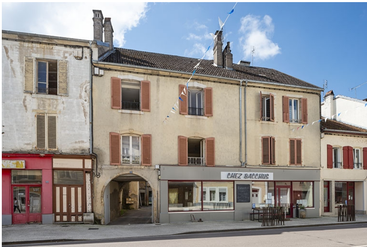
La rue Gambetta : n° 55. 70, Jussey rue Gambetta