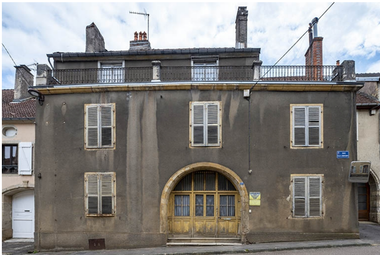
La rue Bontemps : n° 17 de face.