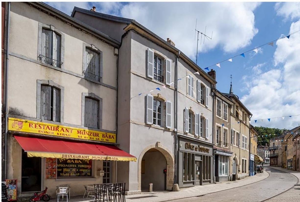
La rue Gambetta : n° 20 et précédents.