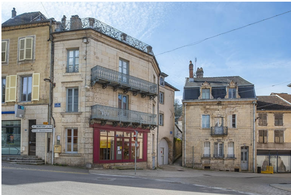
L'immeuble et l'embranchement des deux rues Gambetta (à droite) et Bontemps (à gauche). 70, Jussey rue Gambetta