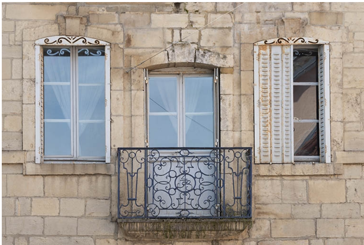
La rue Gambetta : n° 1, étage.