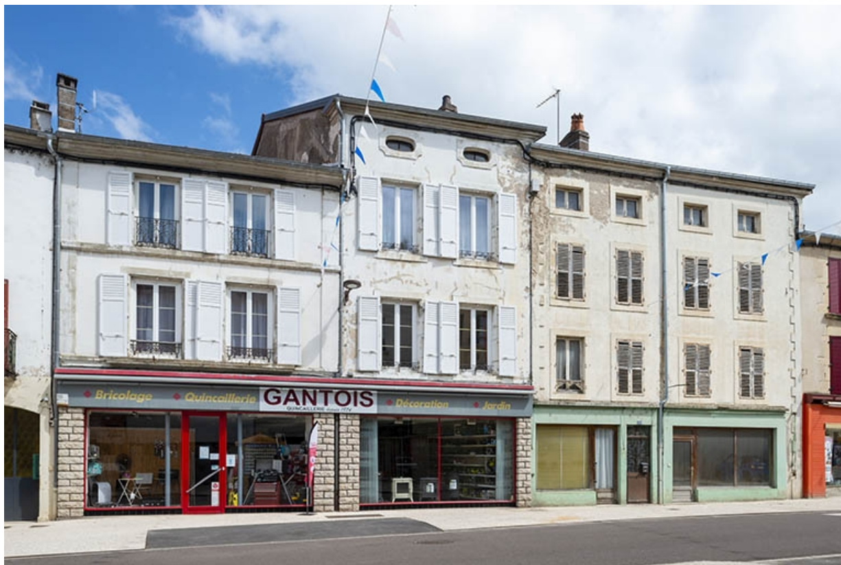
La rue Gambetta : n° 58 et 60. 70, Jussey rue Gambetta