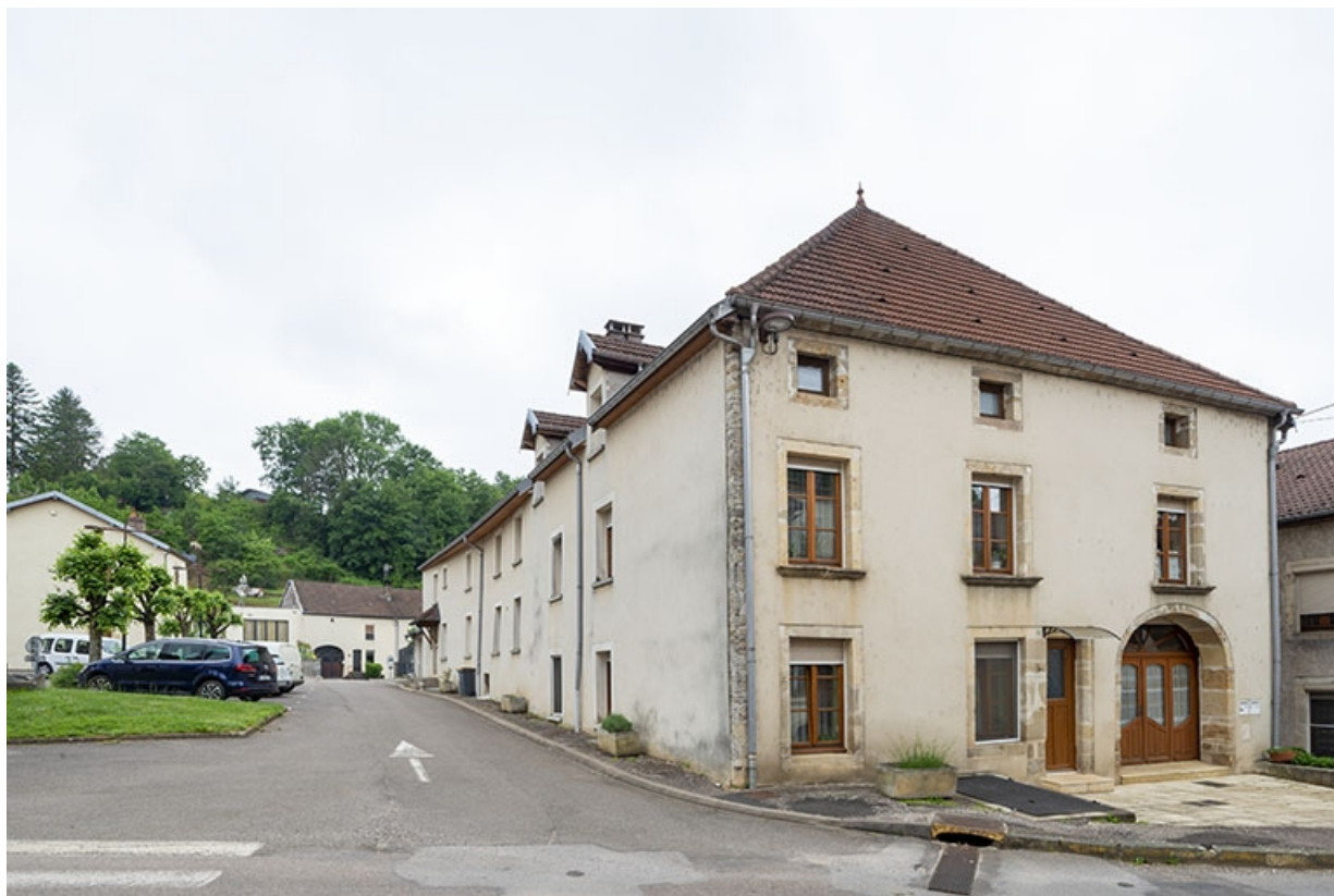
La rue Bontemps : n° 40 et immeubles bordant la rue Charles-Rech au nord. 70, Jussey rue Gambetta