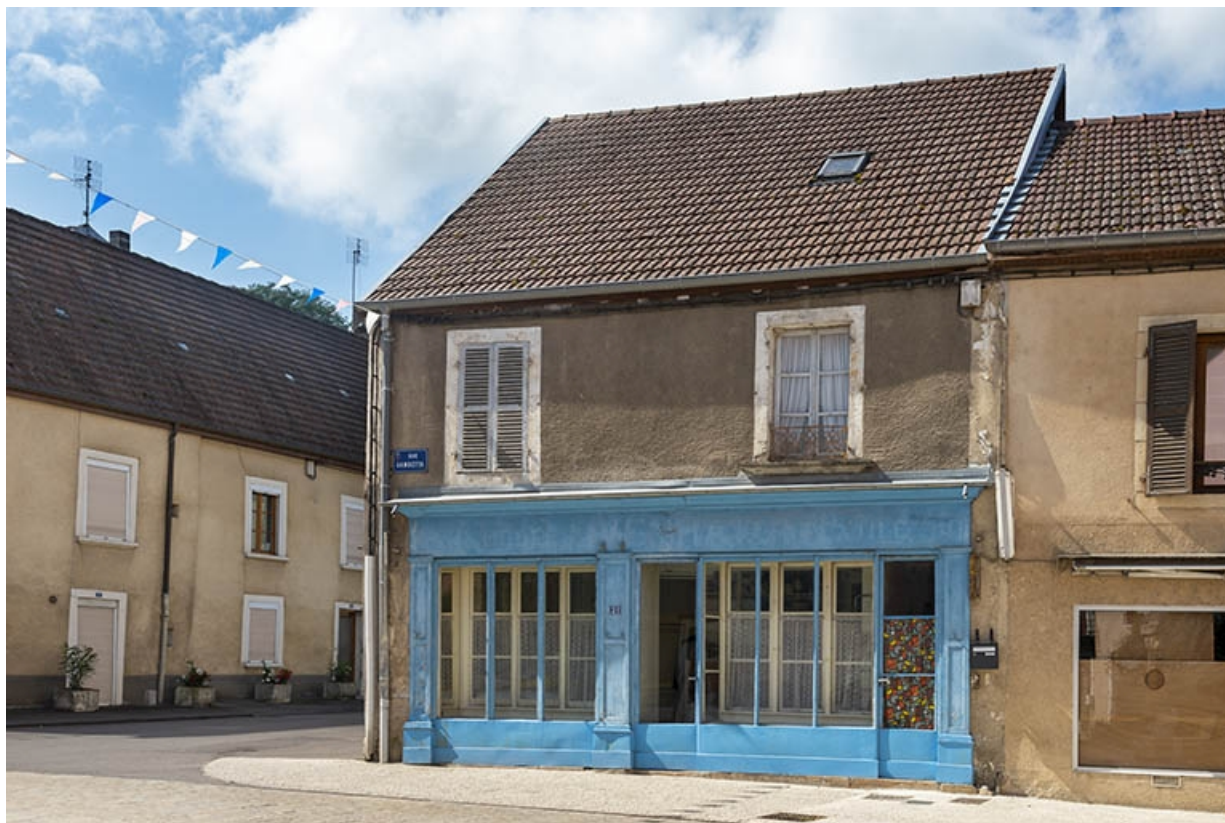
La rue Gambetta : n° 21. 70, Jussey rue Gambetta