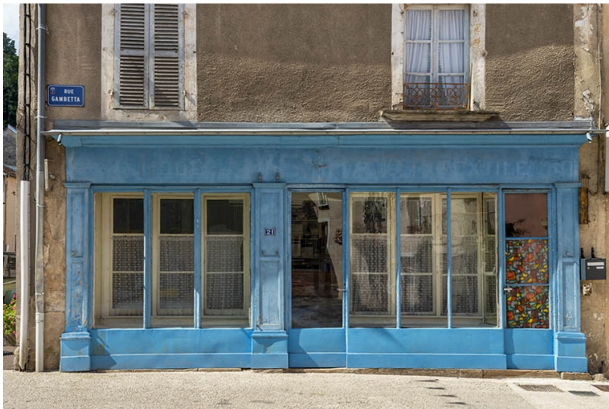
La rue Gambetta : n° 21 et sa devanture.