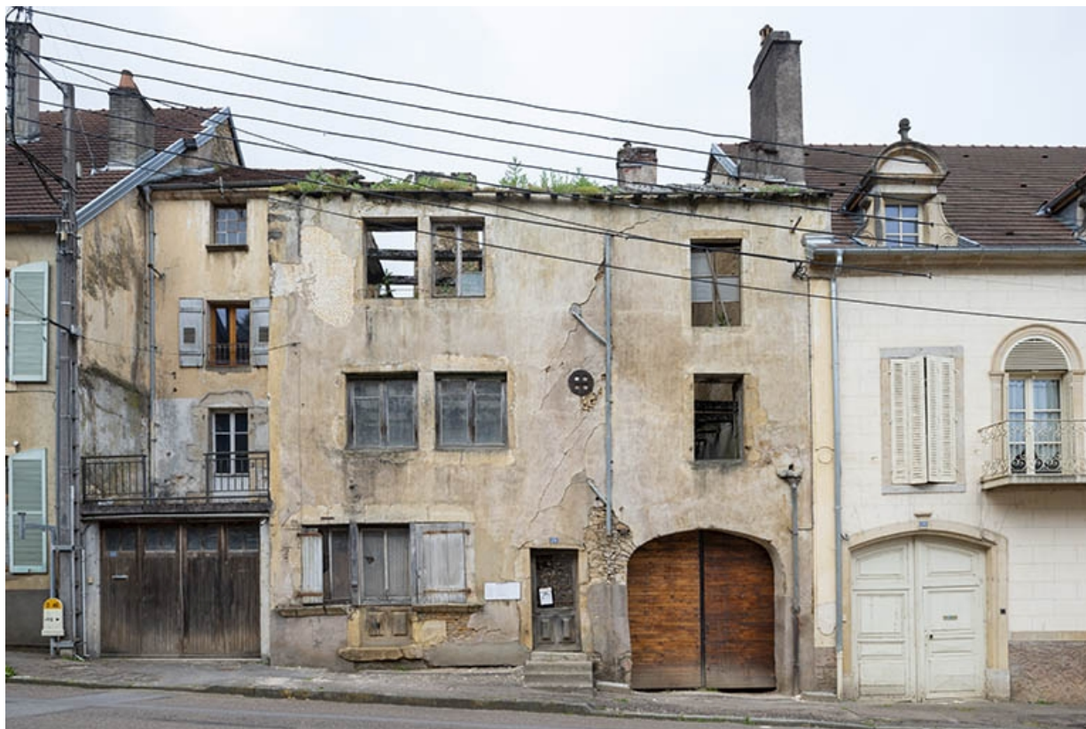
La rue Bontemps : n° 26 et 28.