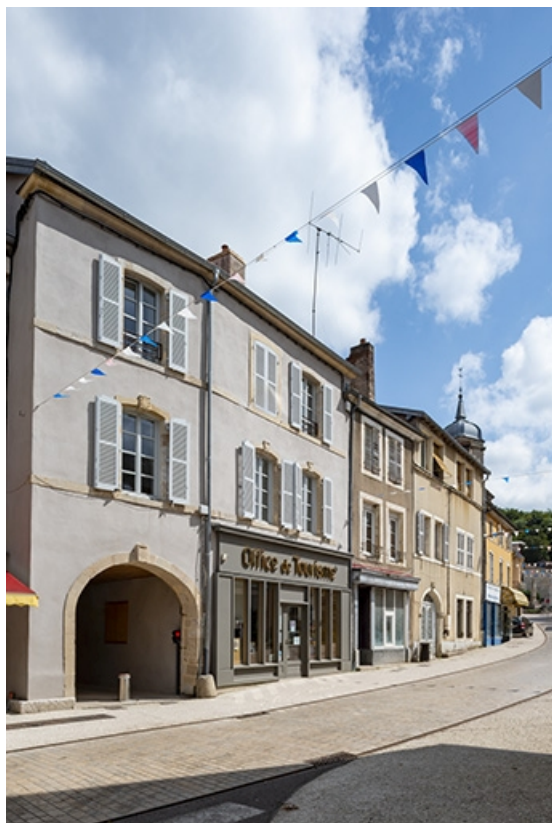
La rue Gambetta : n° 18 et précédents.