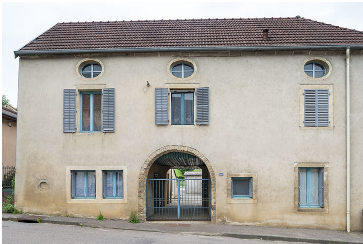
La rue Bontemps : n° 42. 70, Jussey rue Gambetta