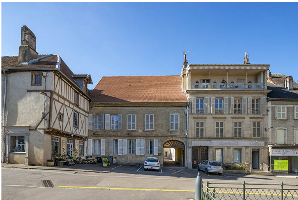
La rue Bontemps : n° 8 à 12. 70, Jussey rue Gambetta