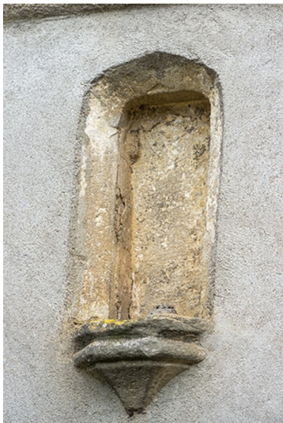
La rue Bontemps : n° 35, détail de la niche ménagée dans la façade. 70, Jussey rue Gambetta