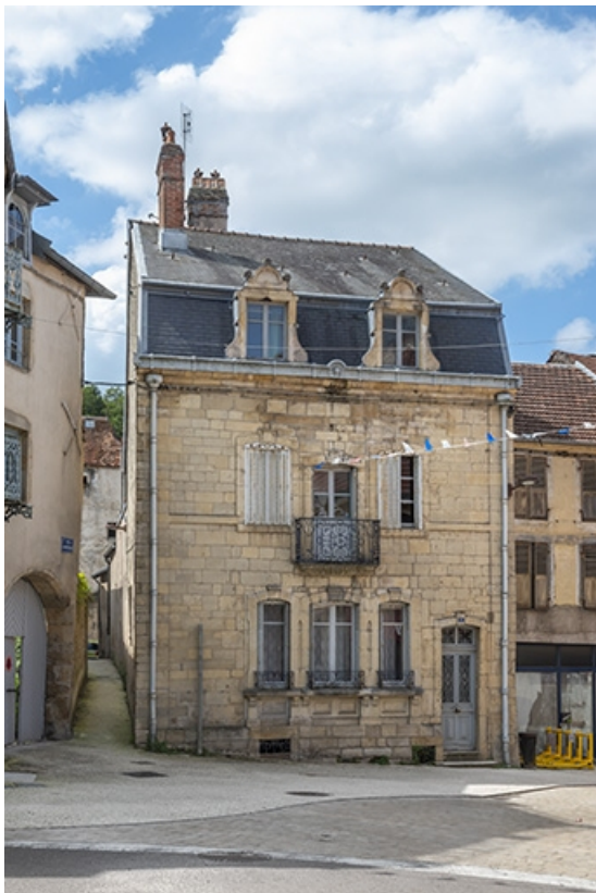
La rue Gambetta : n° 1. 70, Jussey rue Gambetta