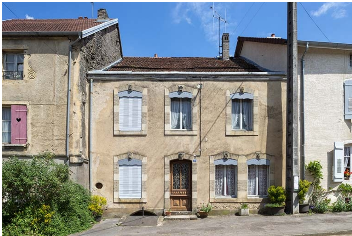
La rue Bontemps : n° 37. 70, Jussey rue Gambetta