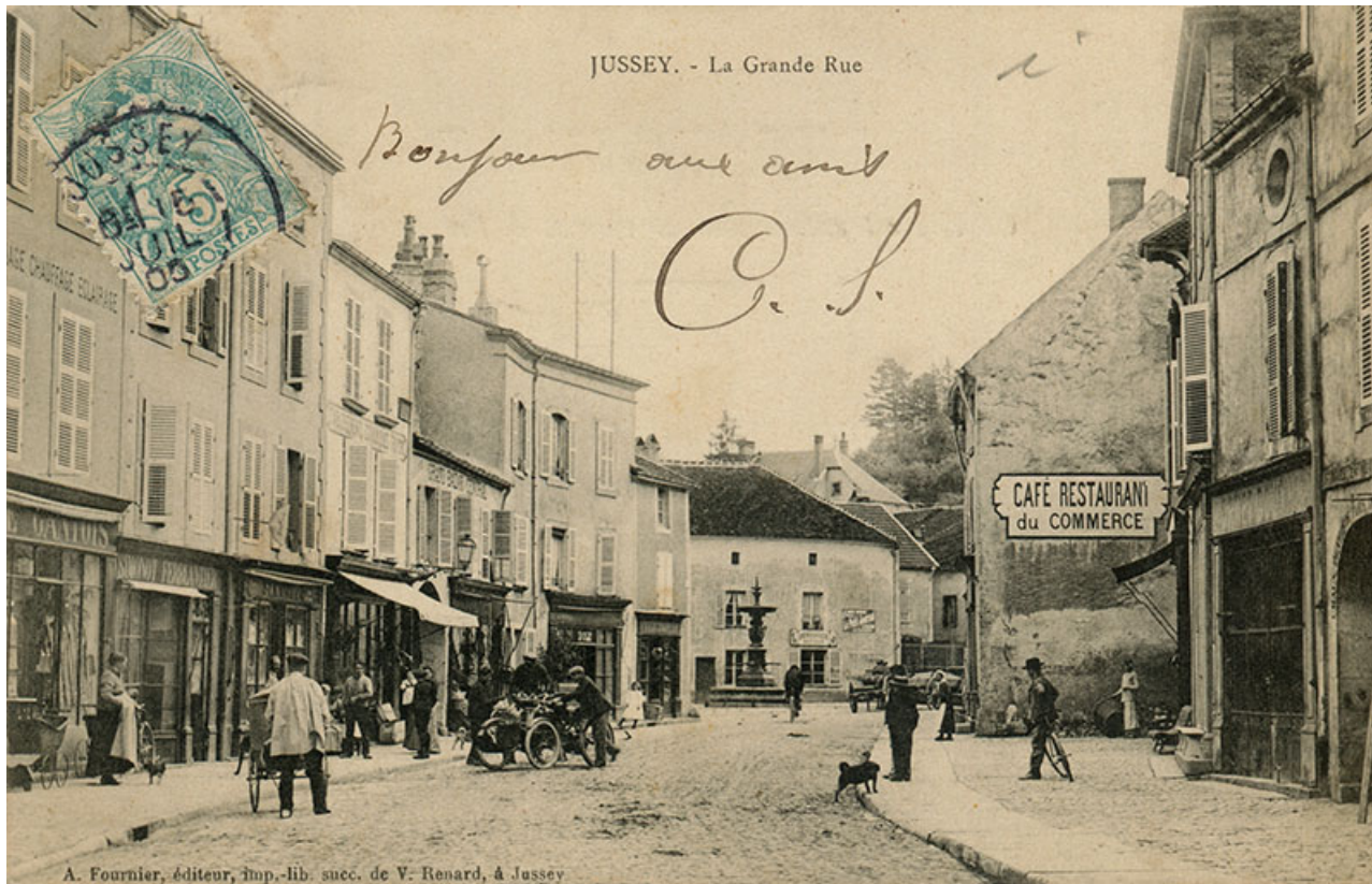
La rue Gambetta au début du 20e siècle. 70, Jussey rue Gambetta