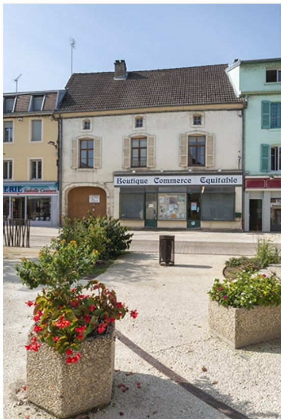
La rue Gambetta : n° 33. 70, Jussey rue Gambetta