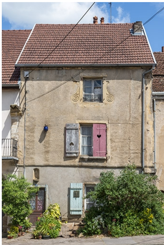
La rue Bontemps : n° 35. 70, Jussey rue Gambetta