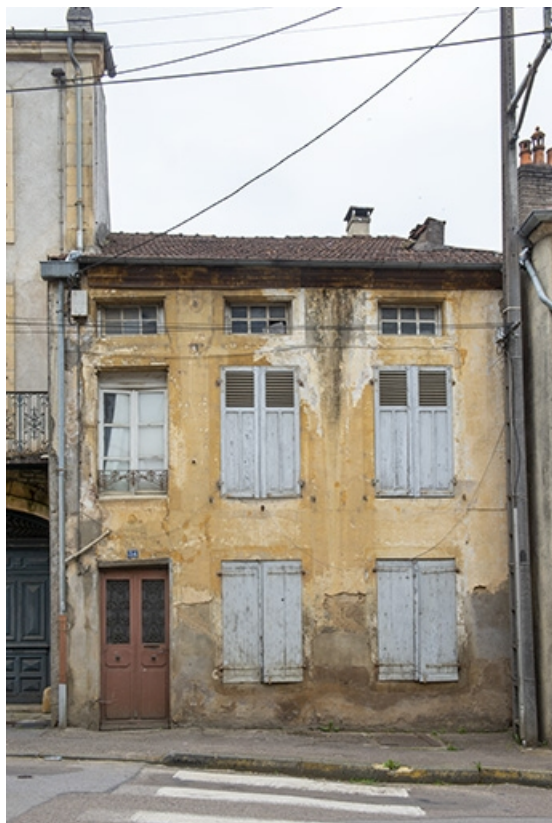
La rue Bontemps : n° 34. 70, Jussey rue Gambetta