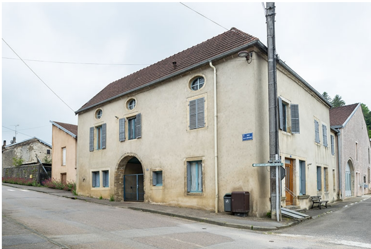
La rue Bontemps : n° 42, vue de trois quarts. 70, Jussey rue Gambetta