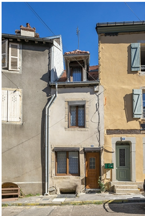
La rue Bontemps : n° 7. 70, Jussey rue Gambetta