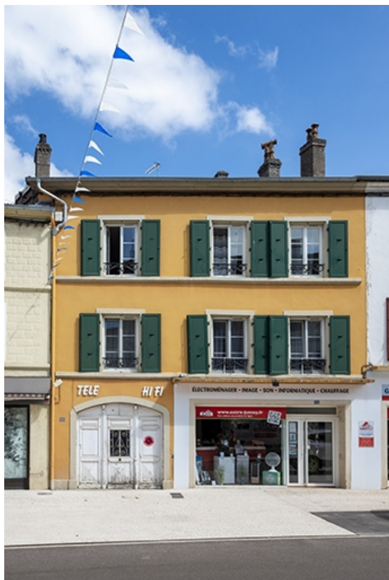
La rue Gambetta : n° 66. 70, Jussey rue Gambetta