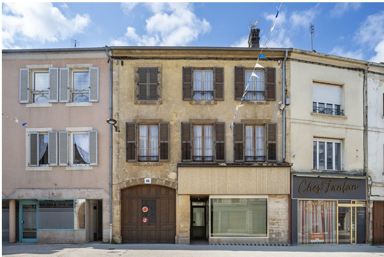
La rue Gambetta : n° 43 à 47. 70, Jussey rue Gambetta