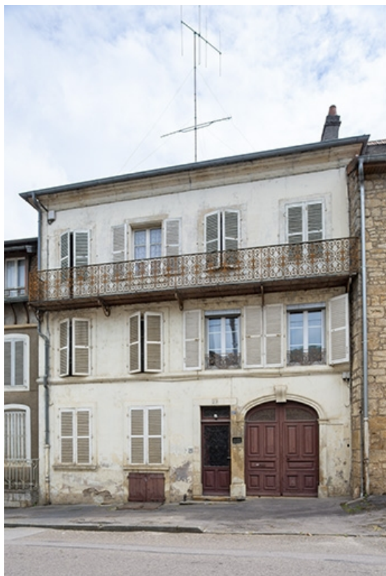
La rue Bontemps : n° 27. 70, Jussey rue Gambetta