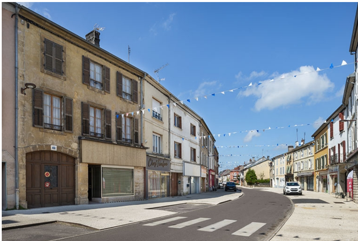
La rue Gambetta : n° 45 et vue d'ensemble de la rue. 70, Jussey rue Gambetta