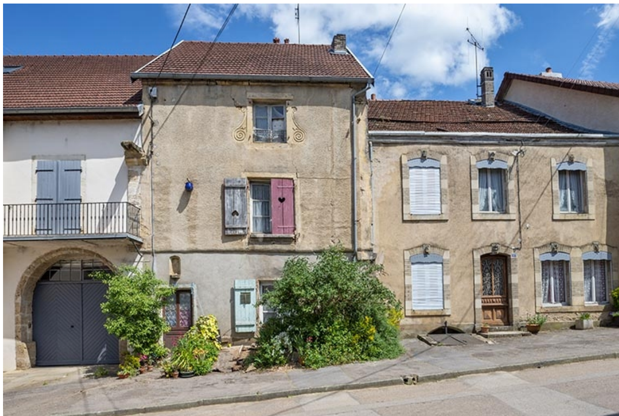
La rue Bontemps : n° 35 et 37.