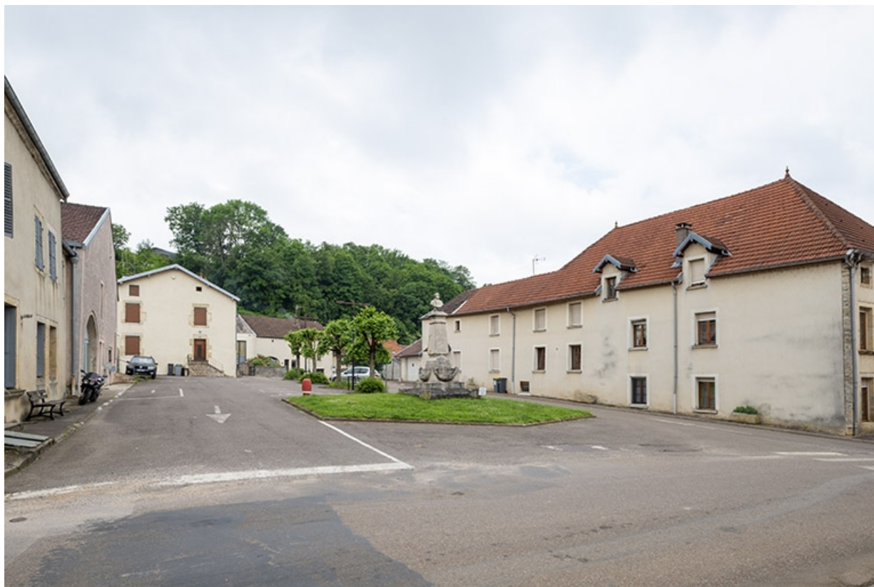
La rue Bontemps : croisement de la rue Charles-Rech. 70, Jussey rue Gambetta