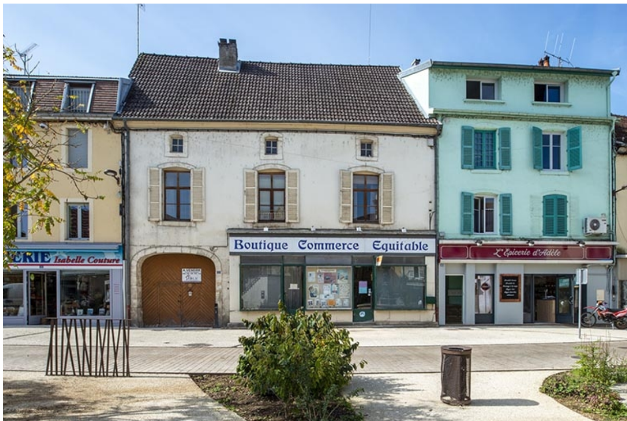
La rue Gambetta : n° 33 et 35. 70, Jussey rue Gambetta