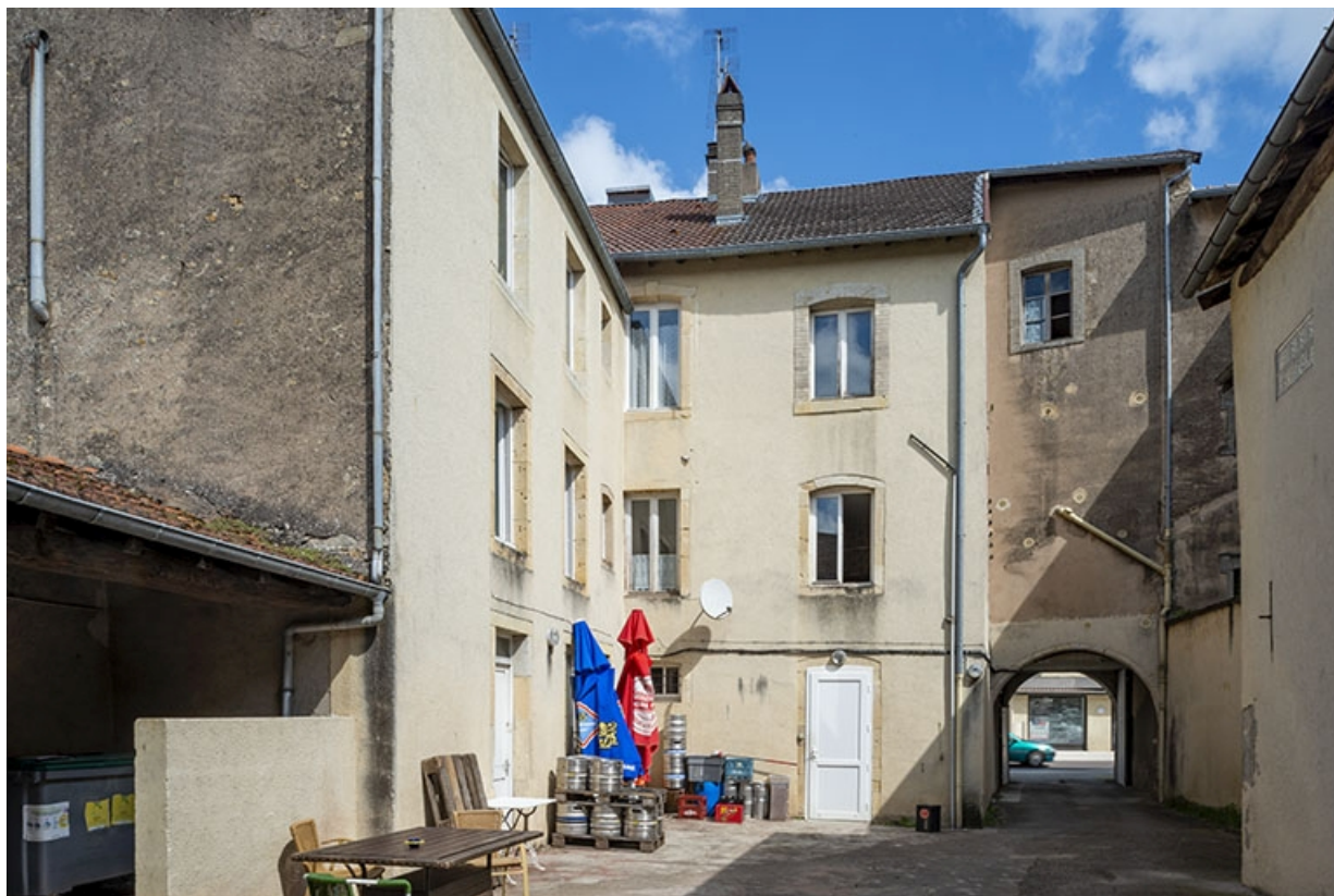
La rue Gambetta : n° 55, la cour et la façade postérieure. 70, Jussey rue Gambetta