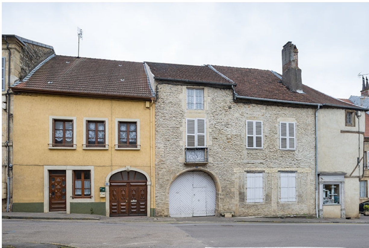
La rue Bontemps : n° 12 à 16. 70, Jussey rue Gambetta