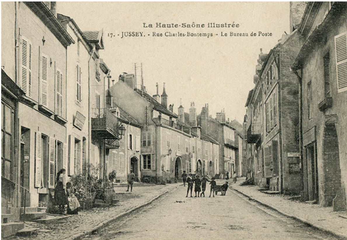
L'entrée de la rue Charles-Bontemps au début du 20e siècle.