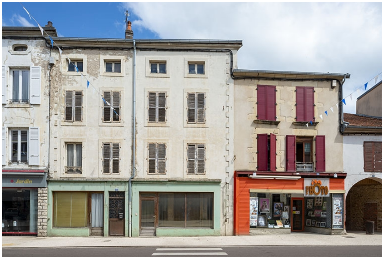
La rue Gambetta : n° 56 à 58.