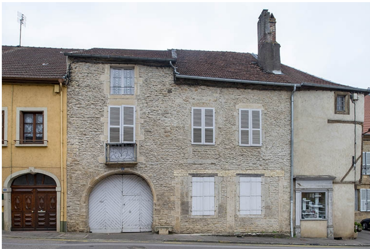
La rue Bontemps : n° 12 à 14. 70, Jussey rue Gambetta