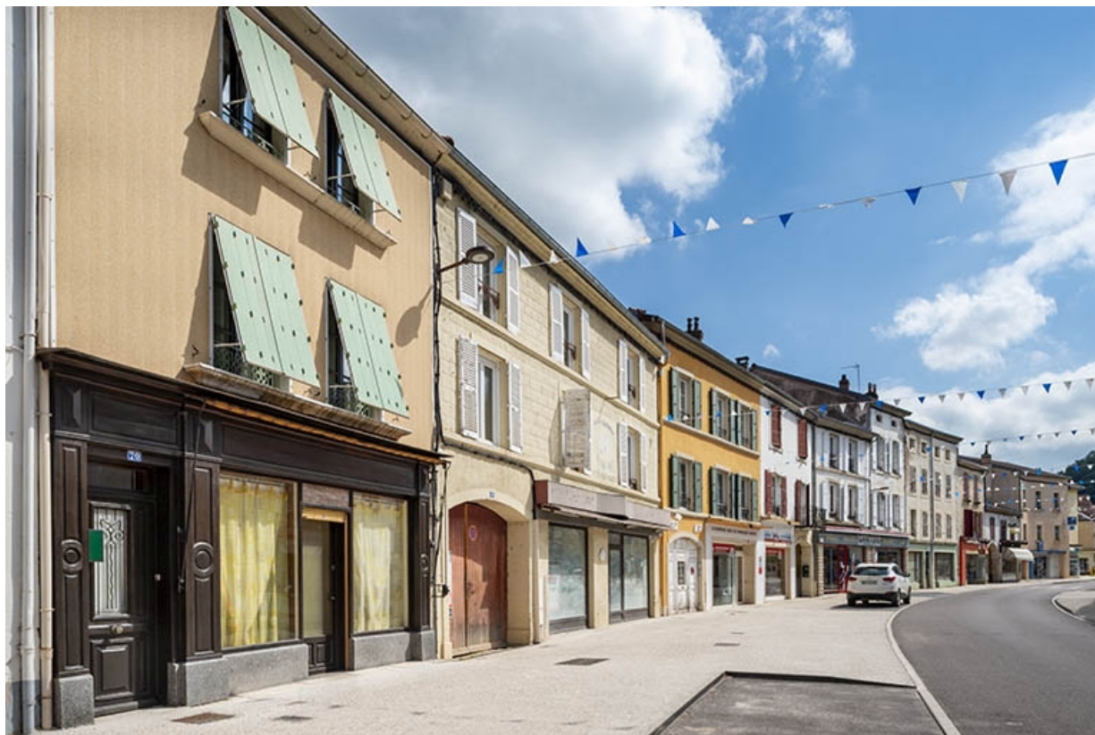
La rue Gambetta : n° 70 et suivants. 70, Jussey rue Gambetta