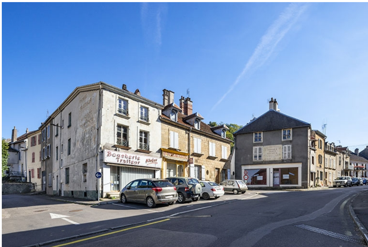
La rue Bontemps : n° 3 et 5 et perspective de la rue vers le sud. 70, Jussey rue Gambetta