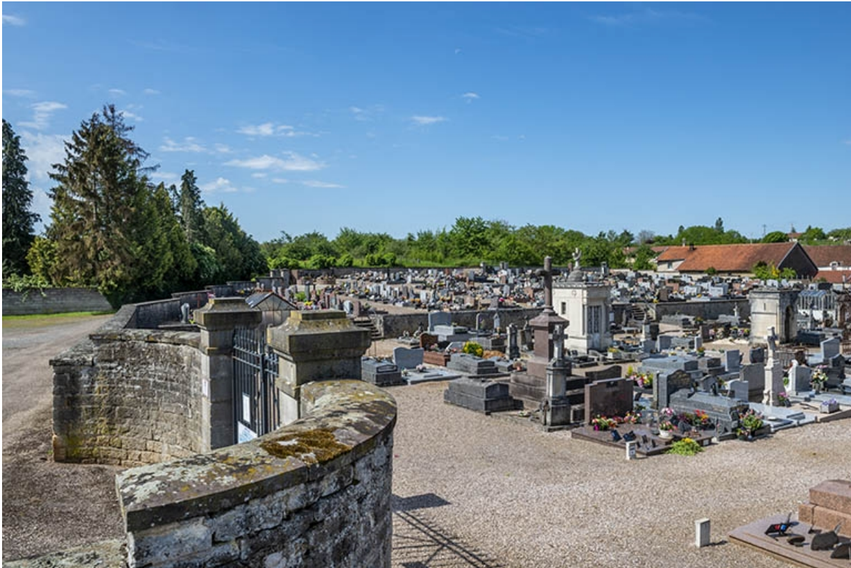
Détail du mur d'enceinte, du portail et vue du cimetière depuis l'est.

70, Jussey, entre 51 et 53 rue Charles-Bontemps