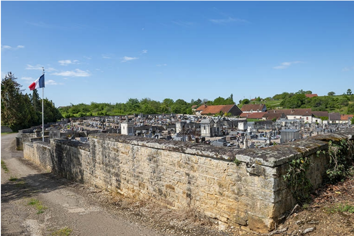
Ensemble du cimetière depuis l'angle nord-est.

70, Jussey, entre 51 et 53 rue Charles-Bontemps