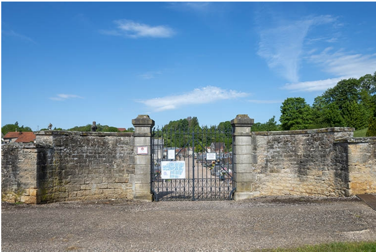
Entrée du cimetière au mont Simon (à l'est).

70, Jussey, entre 51 et 53 rue Charles-Bontemps