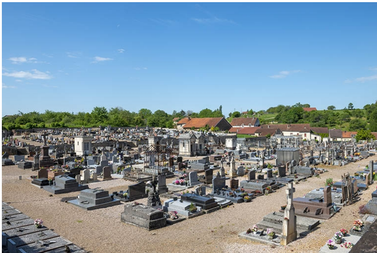
Ensemble du cimetière depuis le nord-est.

70, Jussey, entre 51 et 53 rue Charles-Bontemps