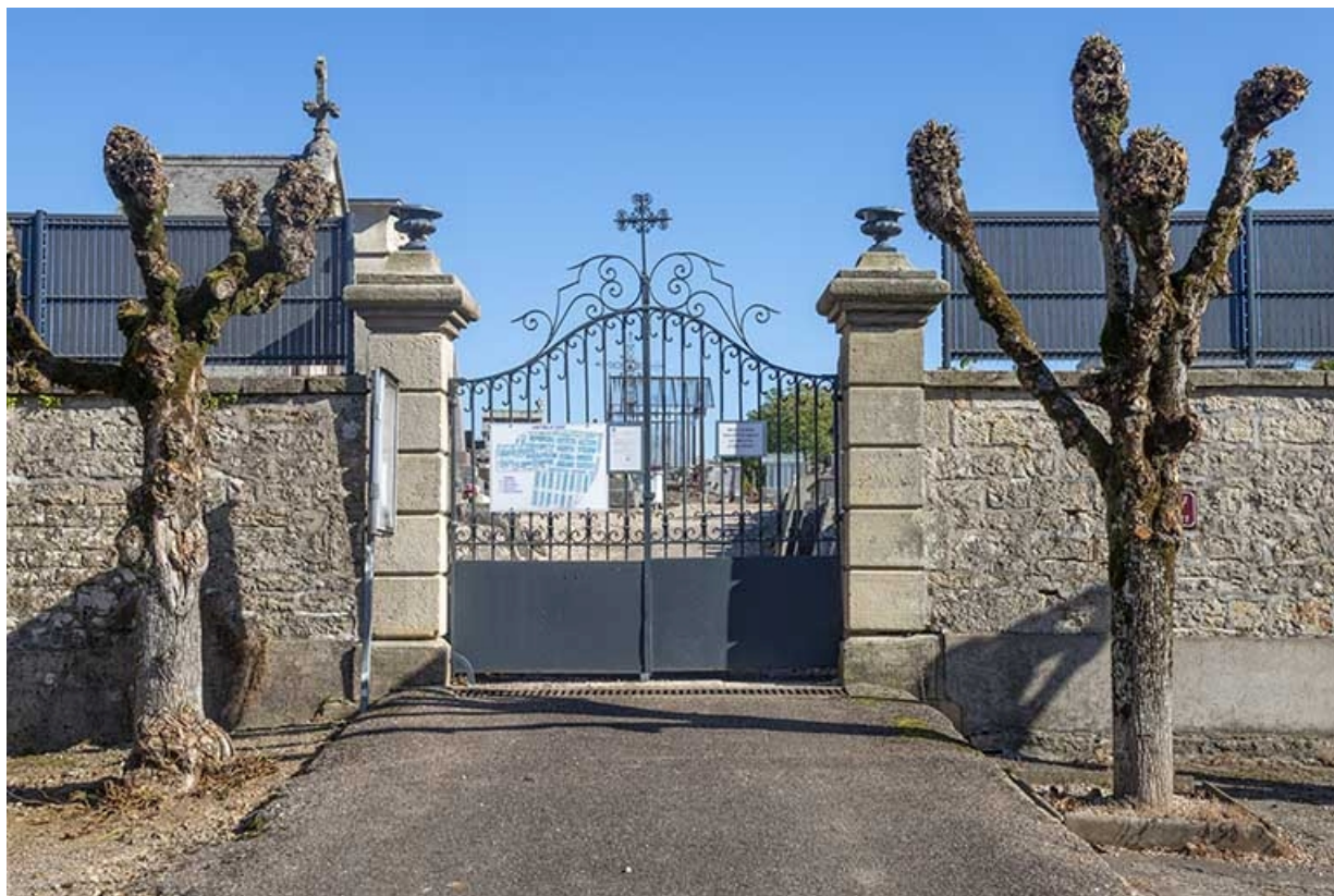
L'entrée du cimetière rue Charles-Bontemps.