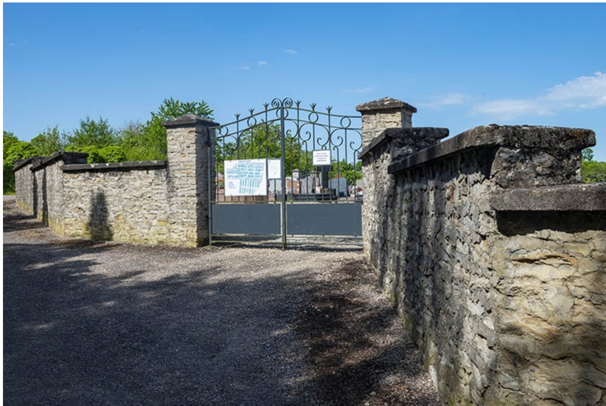
Entrée sud du cimetière, rue de la Pietà.

70, Jussey, entre 51 et 53 rue Charles-Bontemps