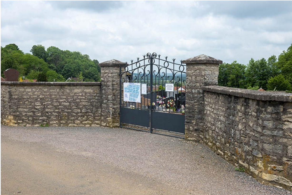
Entrée sud du cimetière, rue de la Pietà.

70, Jussey, entre 51 et 53 rue Charles-Bontemps