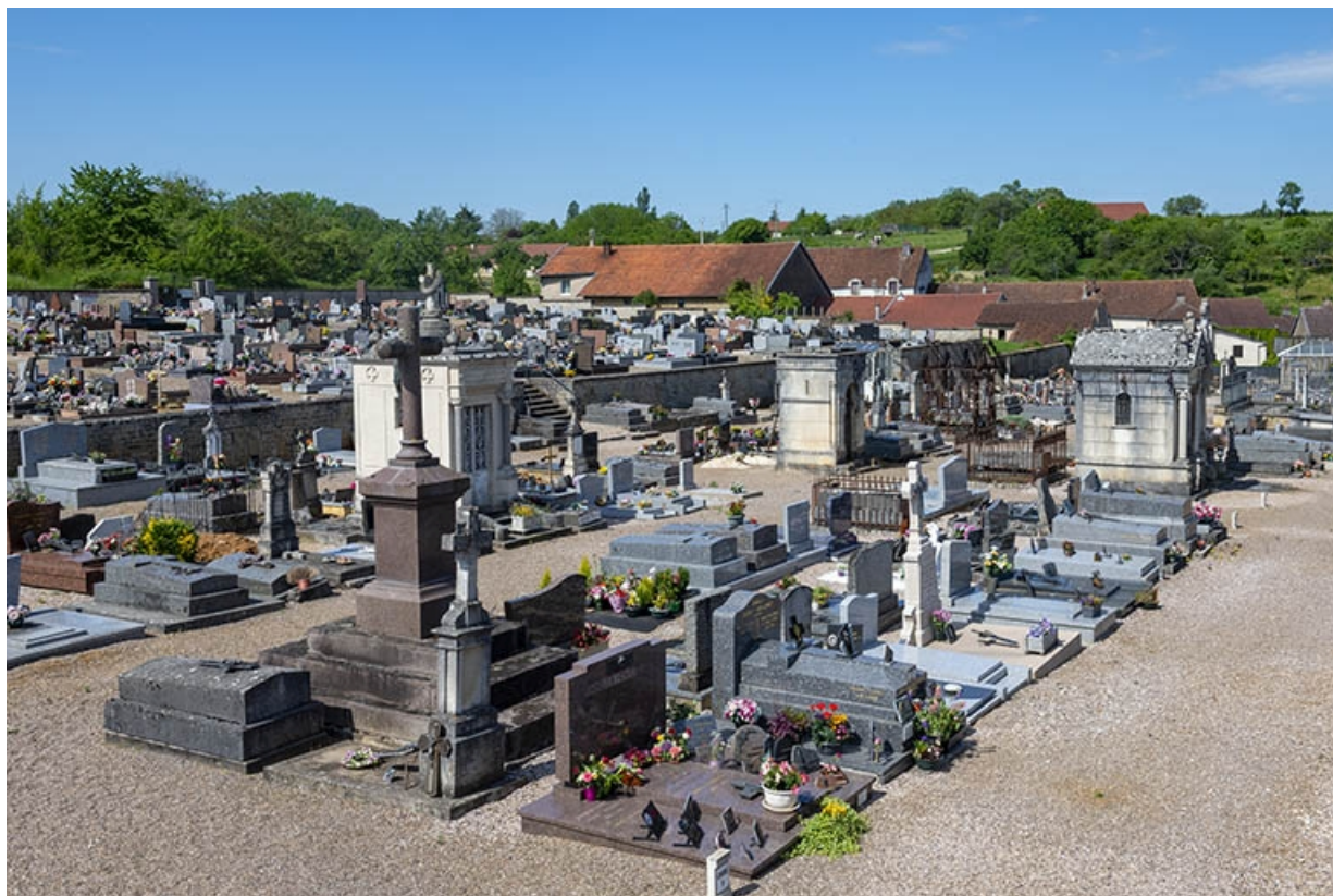
Ensemble du cimetière depuis l'est.

70, Jussey, entre 51 et 53 rue Charles-Bontemps