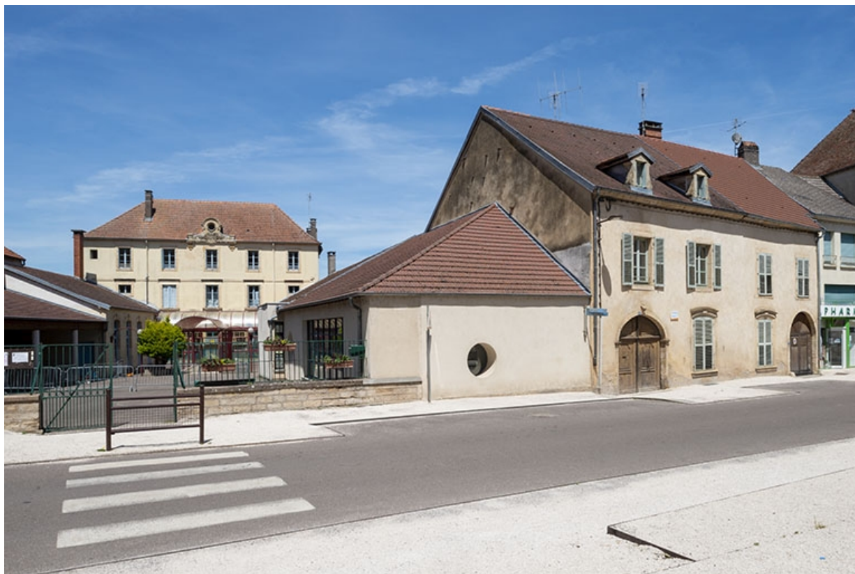
Pignon gauche avec l'école voisine.