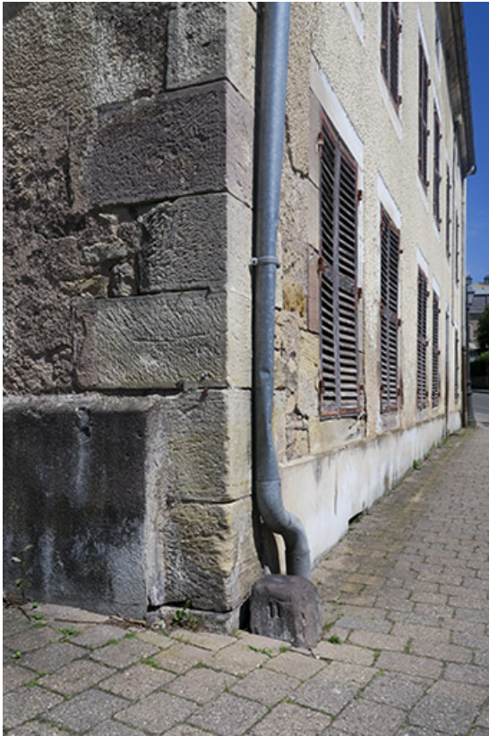
Vue de la borne à l'angle de la rue Jean Jaurès et de la rue de la Saline.