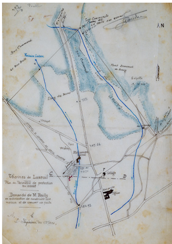
70. Luxeuil-les-Bains rue Jean Jaurès

Lieu de conservation : Archives départementales de la Haute-Saône, Vesoul - Cote du document : 311 E dépôt 386