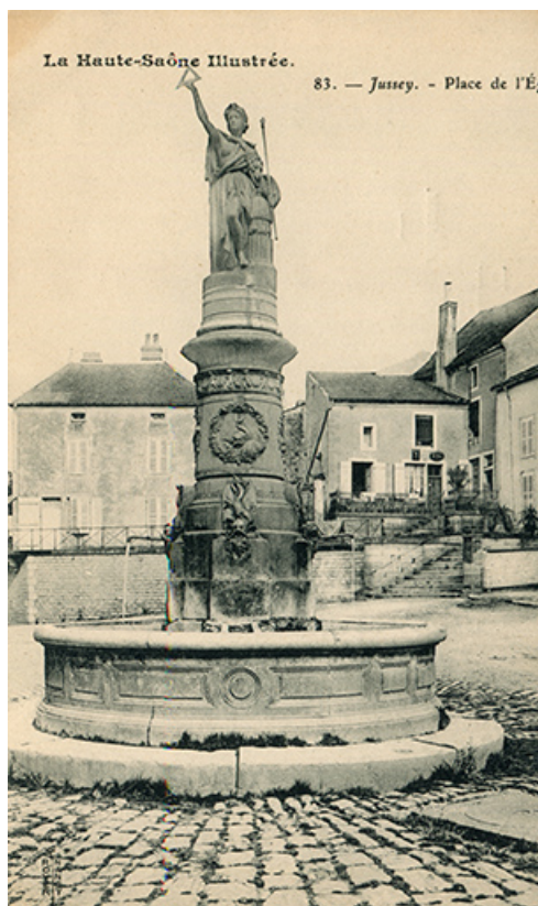
La fontaine, disposée sur la place d ela République au début du 20e siècle. 70, Jussey rue de la libération

Jussey. La fontaine de Marianne. Carte postale. [auteur inconnu]. Nancy : Royer [Premier quart du 20e siècle]. Lieu de conservation : Archives départementales de la Haute-Saône, Vesoul - Cote du document : 11 Fi 292/28