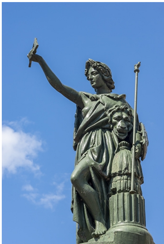
La statue en pied, vue de la droite.