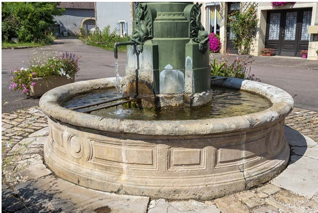
Le bassin de la fontaine.