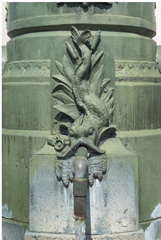
L'un des canons du socle, de face.