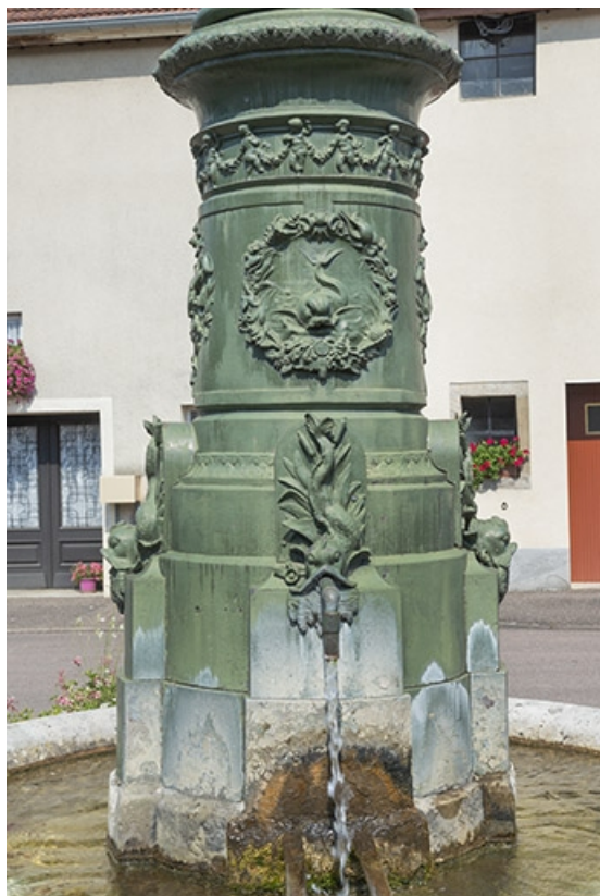
Le socle, vu depuis la rue.