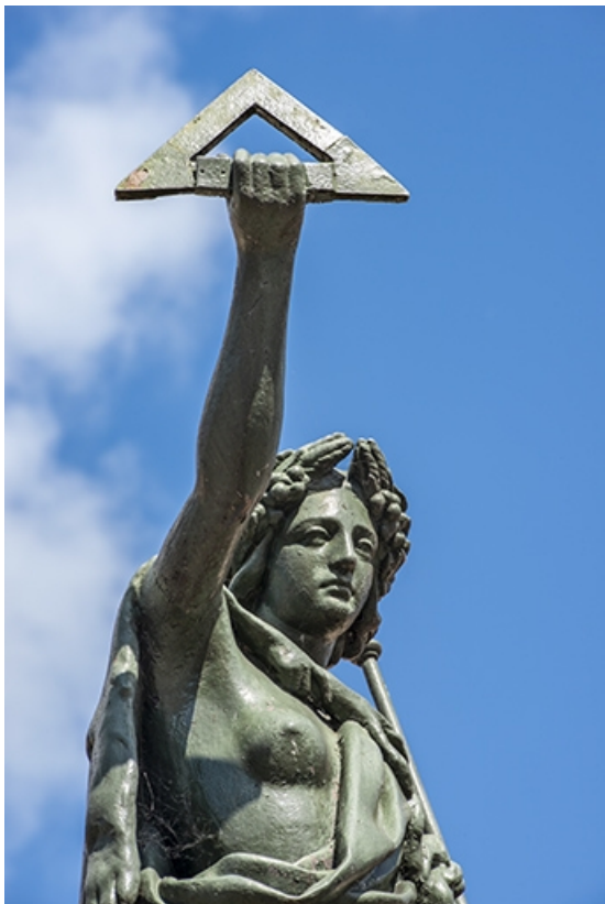
Détail de la partie supérieure de la statue.