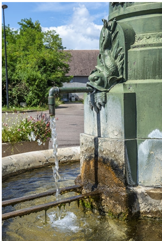
L'un des canons du socle.