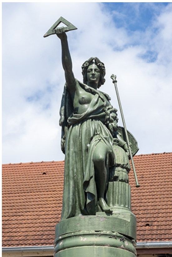
La statue de face.