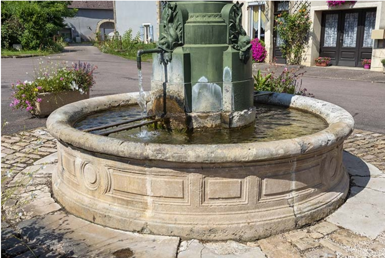
Le bassin de la fontaine.