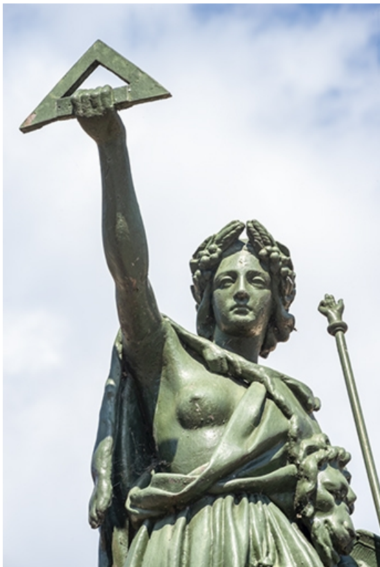
Détail de la partie supérieure de la statue.