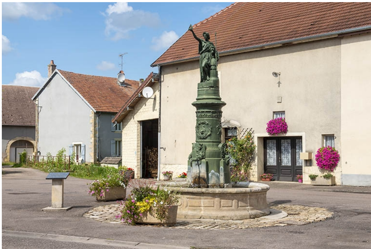
La fontaine dans son contexte urbain.