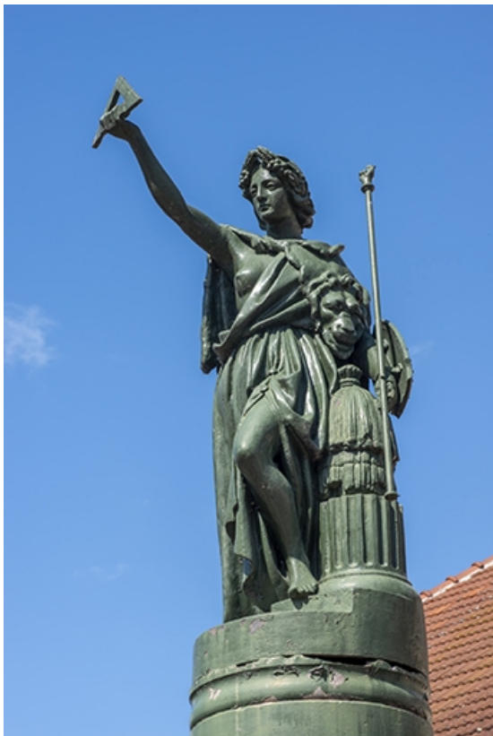
La statue en pied depuis la droite.