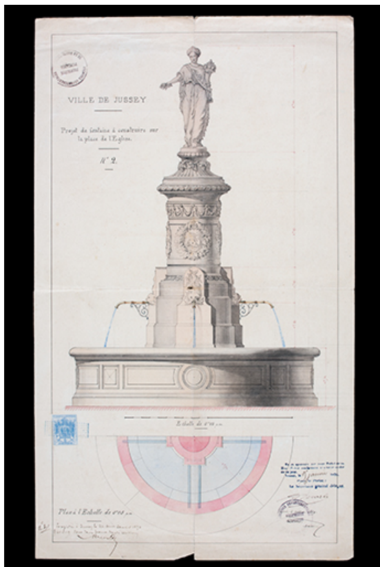
Élévation et plan projetés pour la fontaine de l'agriculture, 1869. 70, Jussey rue de l' Hôtel-de-Ville