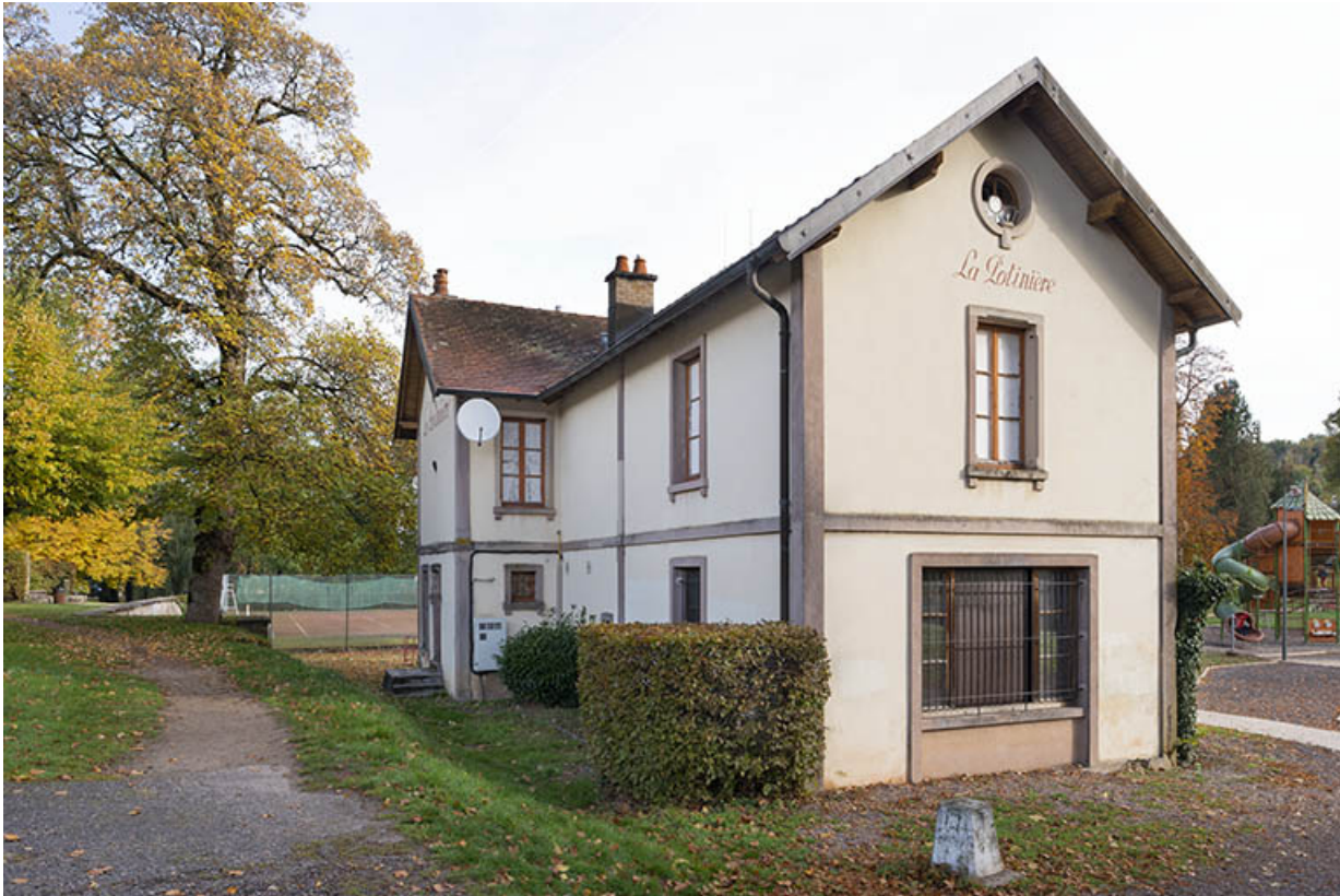
Vue depuis le sud-ouest.

70, Luxeuil-les-Bains, 3 rue des Thermes