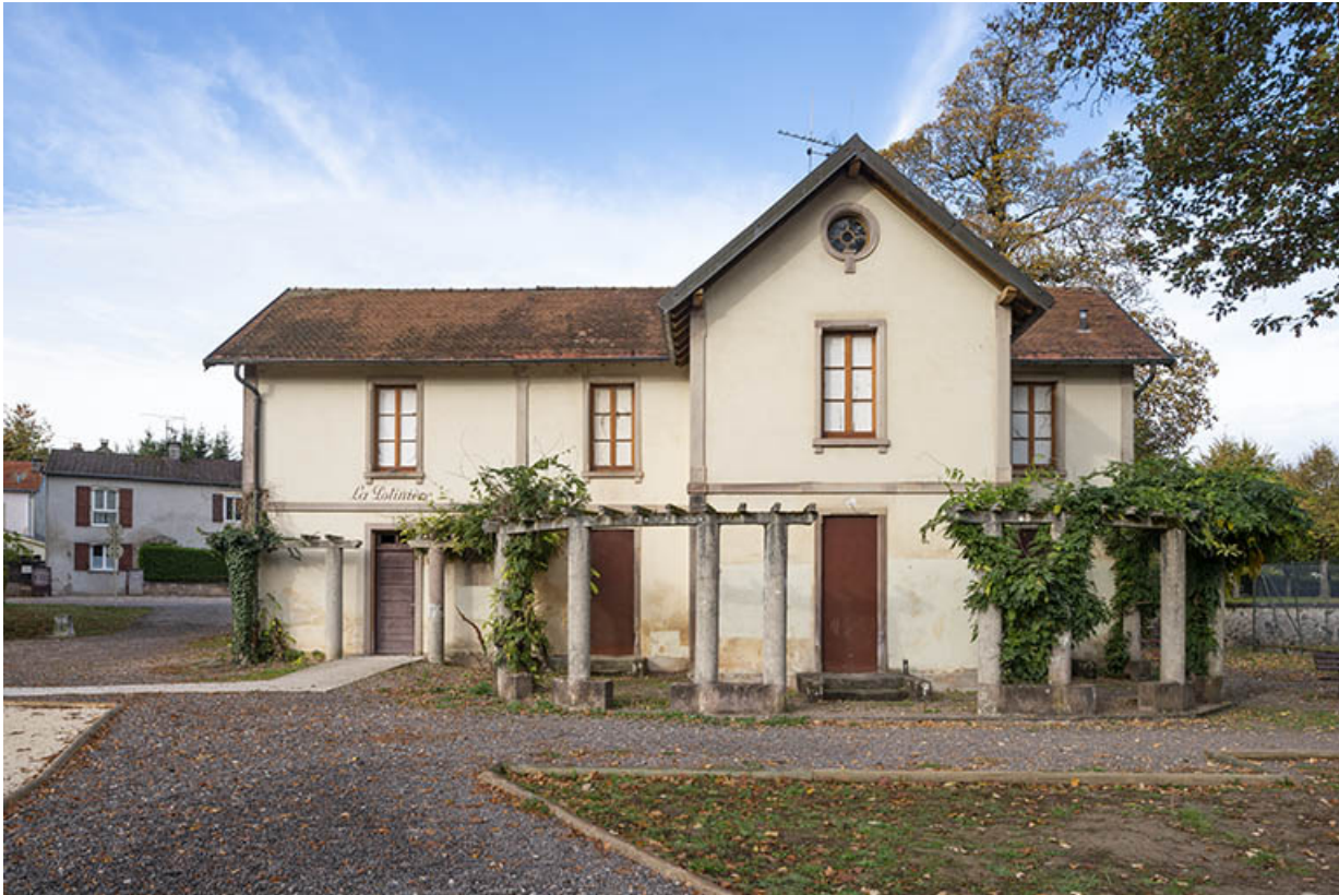
Vue depuis l'est.

70, Luxeuil-les-Bains, 3 rue des Thermes