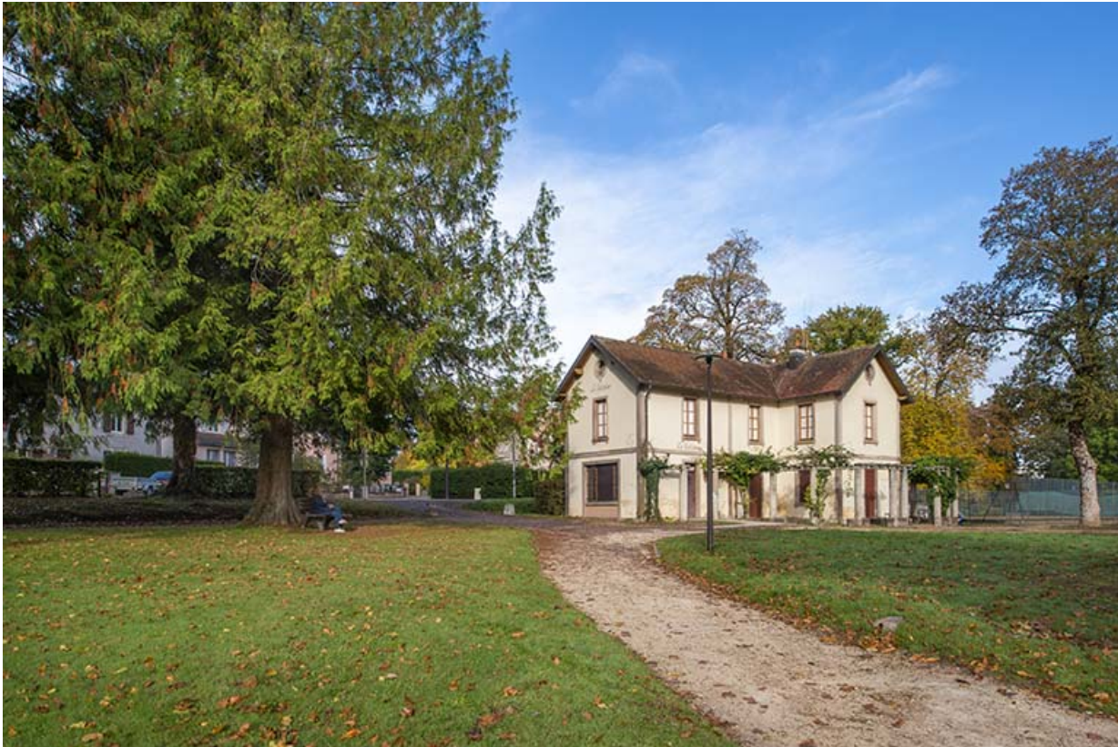
Situation de l'édifice, en bordure du parc thermal.

70, Luxeuil-les-Bains, 3 rue des Thermes