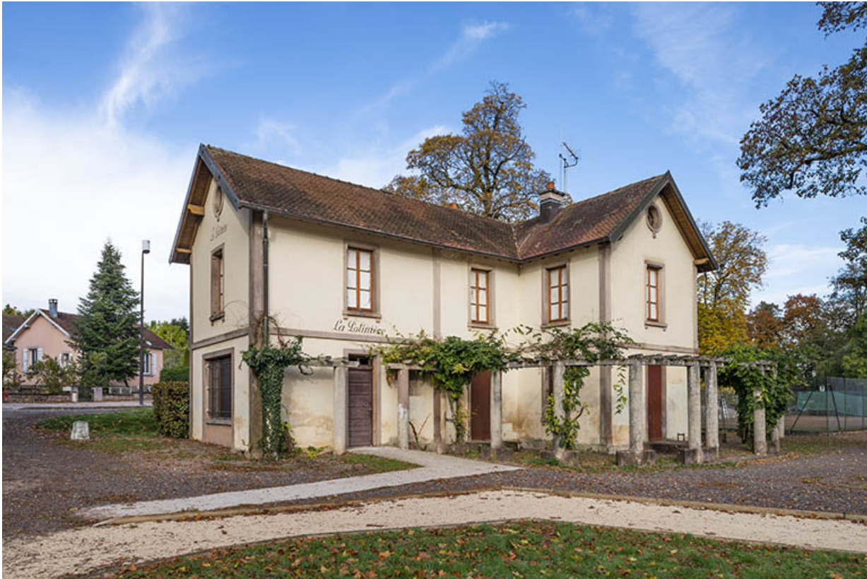
Vue depuis le sud-est.

70, Luxeuil-les-Bains, 3 rue des Thermes