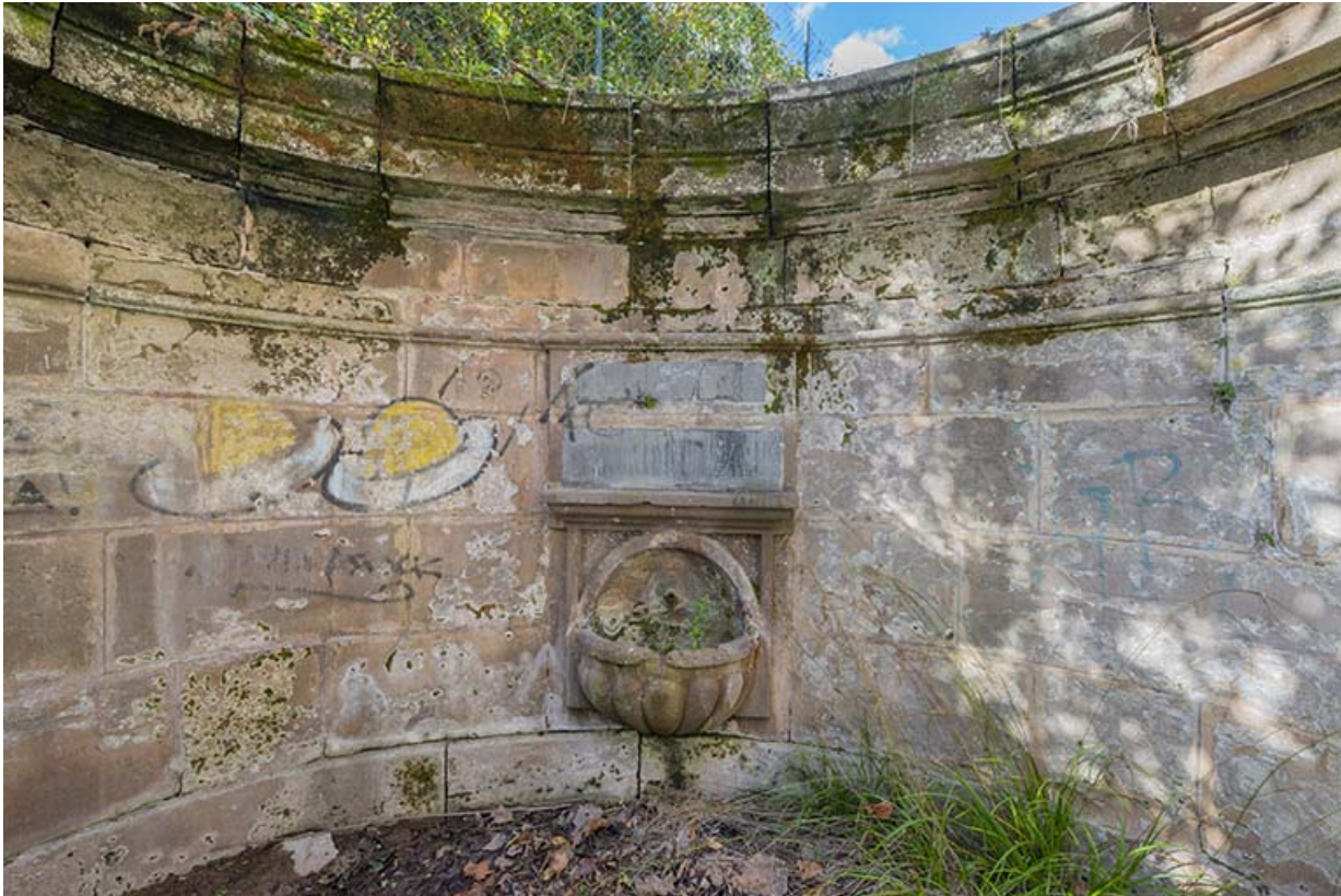
Mur de soutènement.

70, Luxeuil-les-Bains, 3 rue des Thermes