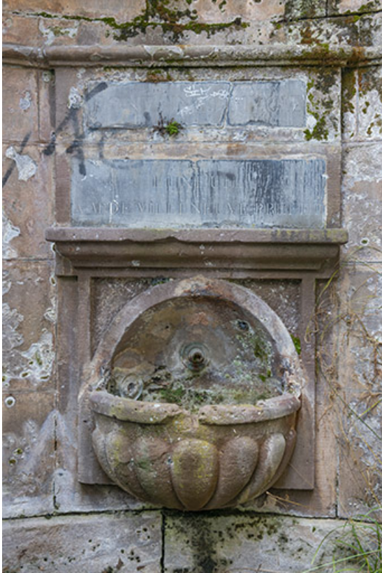
Demi-vasque godronnée et inscription.

70, Luxeuil-les-Bains, 3 rue des Thermes